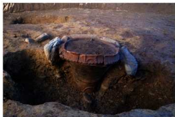
SB 15 石囲埋甕が No.179 出土状況