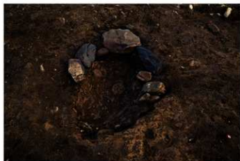
S B 63 石圍炉完掘