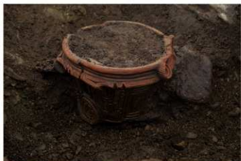
S B 42 埋甕 No.296 出土状況