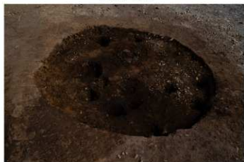
S B 29 完掘