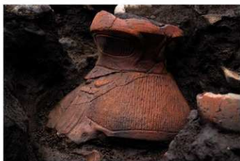
S B 13 No.152 出土状況