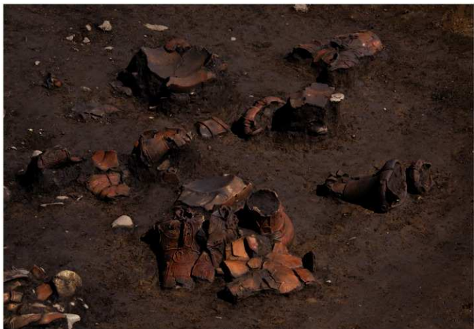
S B 13 遺物出土状況 (部分)