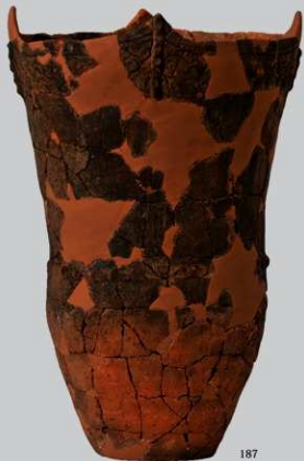
SB16A : (187・188)