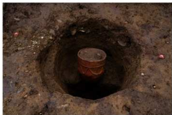
S B 13 P 5 No.119 出土状況