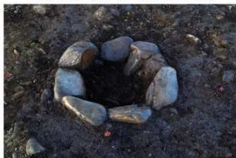
S B 37 石囲炉完掘