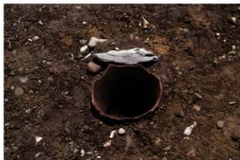
S B 46 埋甕炉検出状況