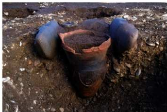
S B 11 石囲埋甕炉 No.80 出土状況