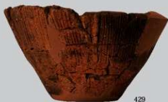
UG31 : (429)