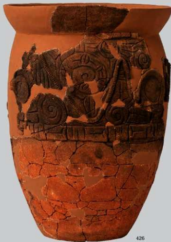
UG28 : (426)