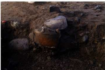
UG 25 No.422 出土状況