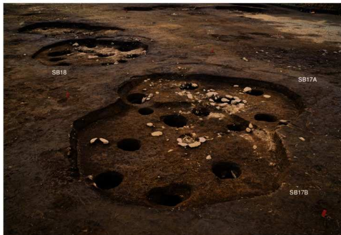
S B 17A・17B・18 完掘 (東から)