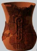
SB1 : (1~3)