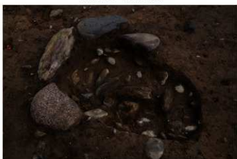
SB 17 B 石囲炉完掘