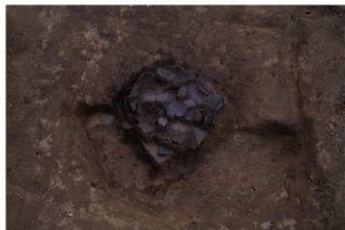
DS 9 No.444 出土状況