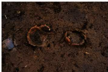
UG 26 No.423 (左) No.424 (右) 検出状況