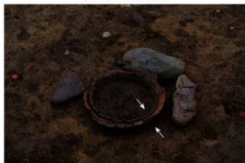
SB 16 B 石囲埋甕が No.190 (内) No.191 (外) 検出状況