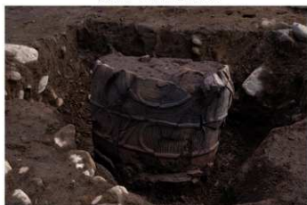
U G 15 No.413 出土状況