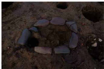
S B 43 A 石囲炉完掘