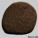
SK53 : (201)