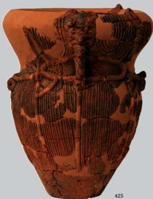
UG27 : (425)