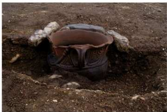
S B 24 石圍埋甕炉 No.236 出土状況