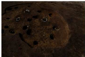
SB 15 完掘