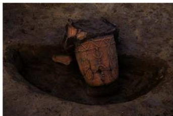
SK 42 No.387 出土状況