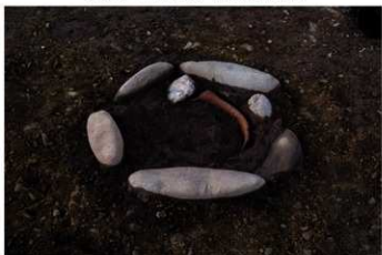
S B 11 石囲埋甕炉検出状況