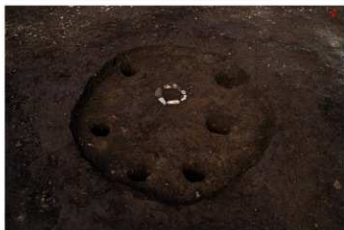
S B 45 完掘