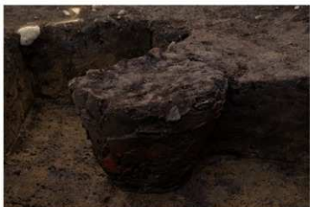
U G 14 No.412 出土状況