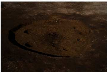
S B 52 完掘