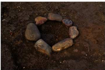
S B 45 石圓が完掘