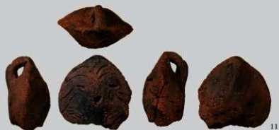
SB50 : (11)