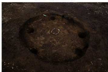
S B 47 完掘