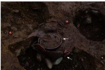
S B 43 B 埋葬が No.307 (外) No.308 (内) 検出状況