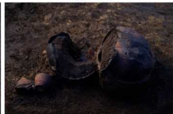
SB 14 A 古墳 No. 2 (左)・1 (中)・3 (右) 出土状況