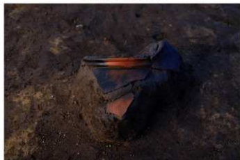
SB 14 A 古墳 No. 1 出土状況