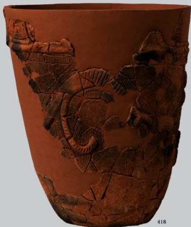
UG19 : (418)