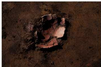
UG 6 No.404 出土状況