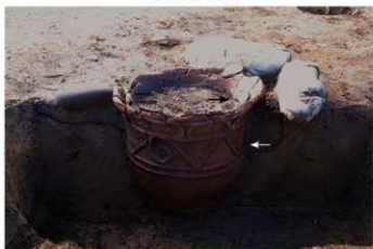
SB 16 B 石囲埋甕が No.190 (内) No.191 (外) 出土状況