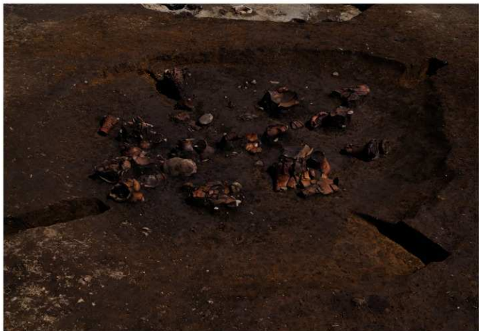
S B 13 遺物出土状況