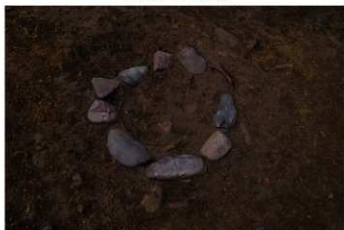
S B 50 石圍埋甕炉検出状況