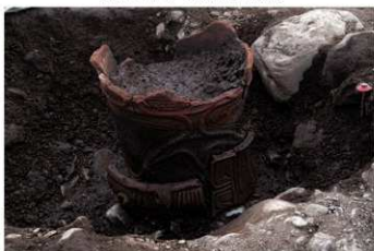
SB 18 埋壺炉 No.202 (内) No.201 (外) 出土状況