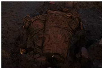
S B 12 No.100 出土状況