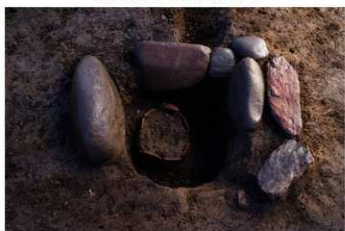
S B 13 石囲埋焼炉 No.118 出土状況