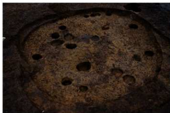
S B 14B 完掘