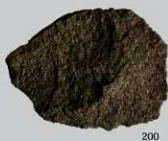
SK51 : (200)