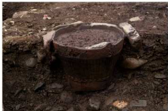
SB 23 石囲埋甕が No.223 出土状況