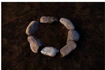
S B 66 石圍炉完掘