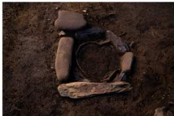
S B 12 石囲埋甕炉検出状況