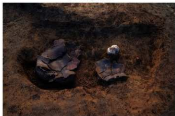
SF 3 No.386 (左) No.385 (右) 出土状況