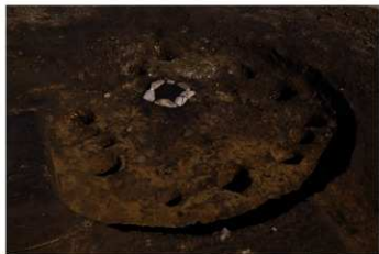
S B 60 完掘