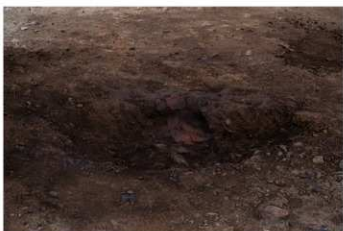
DS 8 出土状況