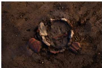
UG 7 No.405 出土状況