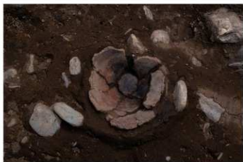
UG 21 No.419 出土状況