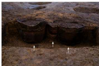
S B 14B 埋焼炉 No.175 (左) No.176 (中) No.172 (右) 出土状況