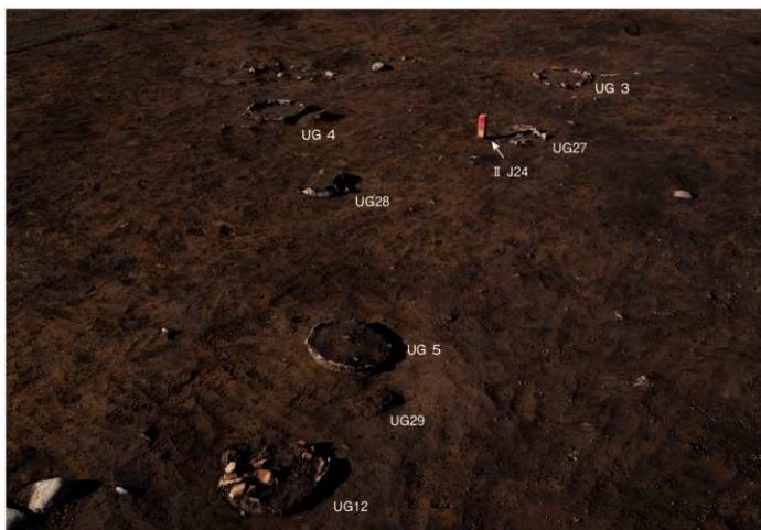
屋外埋設土器 検出状況 (II J24 グリッド周辺・南東から)