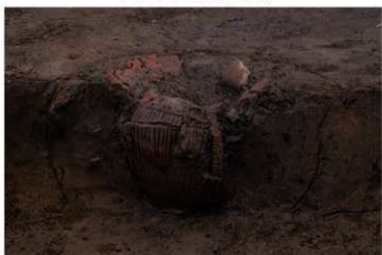
U G 16 No.414 出土状況