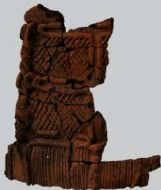
SB3 : (6)