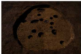
S B 27 完掘