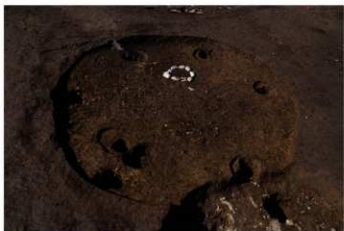
S B 64 完掘