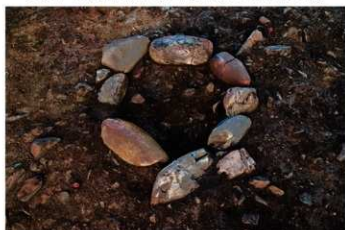
S B 48 石囲炉完掘