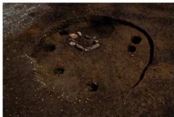
S B 41 完掘