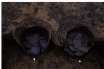
S B 14B 埋焼炉 No.175 (左) No.172 (右) 底面土器敷設状況