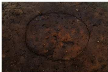
SF 2 検出状況