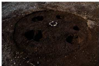
S B 37 完掘