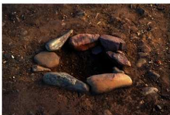
S B 47 石囲炉完掘