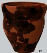
SB 6 : (12・13)