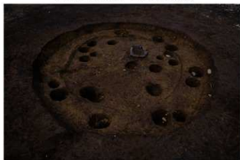
S B 43 A 完掘