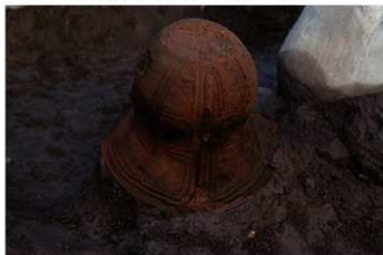
S B 12 No.95 出土状況