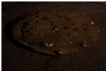
S B 43 B 完掘