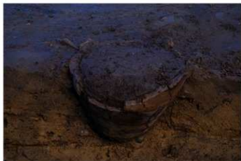
UG 17 No.415 出土状況