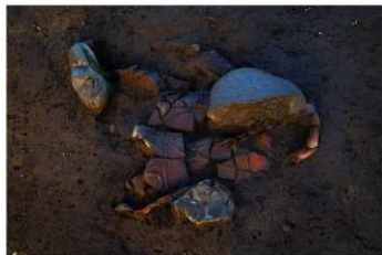
UG 1 No.399 出土状況