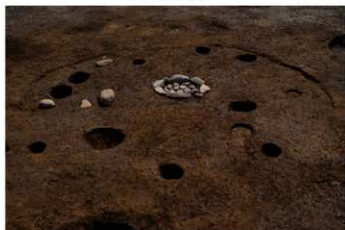
SB 2 完掘