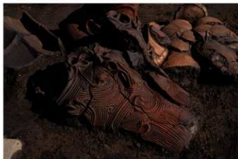
S B 13 No.125 出土状況