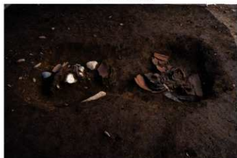
DS 2 出土状況