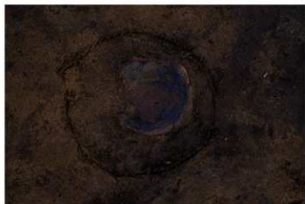
DS 19 No.446 出土状況