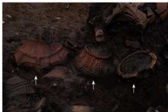
S B 13 No.153 (左) No.155 (中) No.154 (右) 出土状況