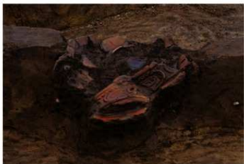
U G 9 No.407 出土状況