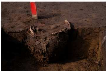
UG 27 No.425 出土状況