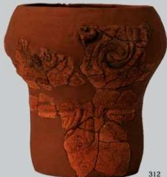
SB44 : (312・313)