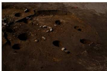
SB 17 B 完掘