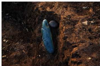
S B 47 棒状石 No.146 (左) 磨石 No.144 (右) 出土状況