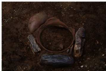
S B 24 石圍埋甕炉検出状況