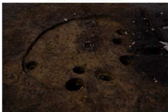
SB 16 A 完掘