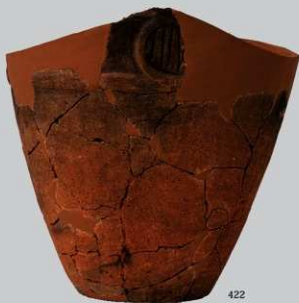
UG25 : (422)