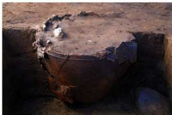
UG 2 No.401 出土状況