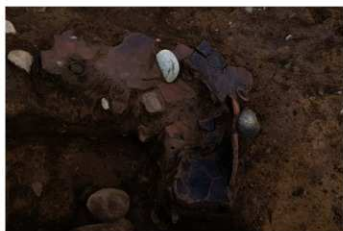
SK 49 出土状況