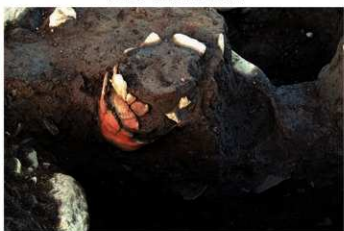
UG 30 No.428 出土状況