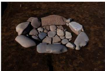
SB 2 石囲炉完掘