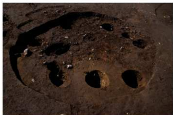
SB 18 完掘