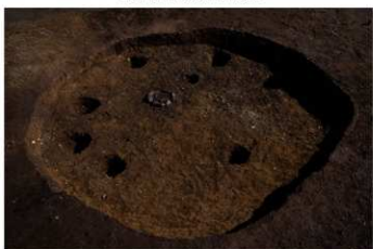
S B 10 完掘