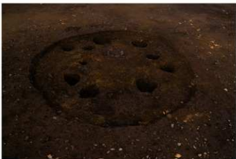
S B 50 完掘