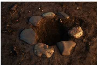
S B 44 石圓が完掘