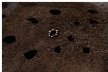
SB 4 完掘