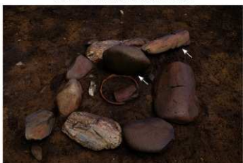
S B 25 石圍炉内 扁平な石と棒状石 出土状況