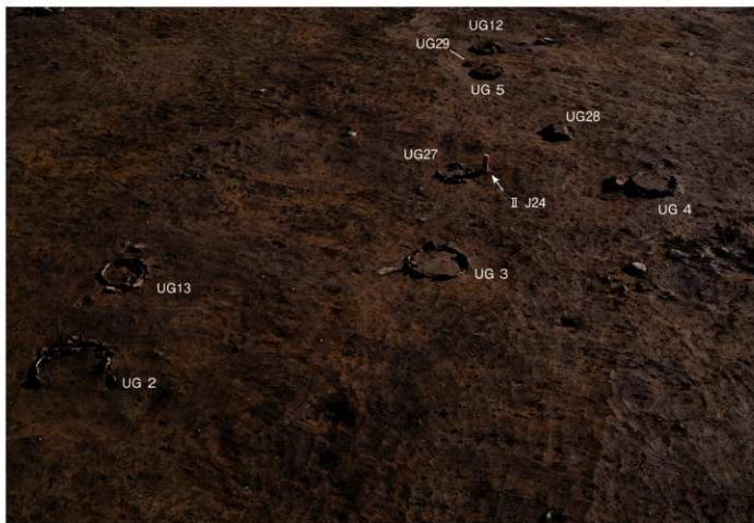
屋外埋設土器 検出状況 (II J24 グリッド周辺・北から)