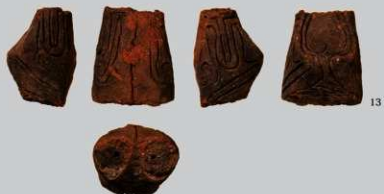
SB66 : (13)