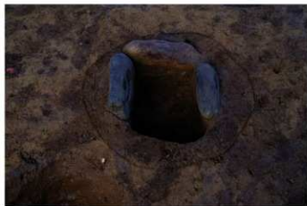
S B 27 石囲炉完掘