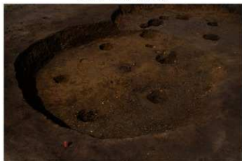
S B 26 完掘