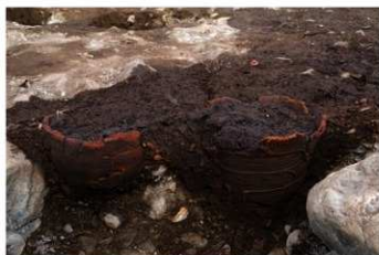
S B 30 埋甕炉 No.280 (左) No.281 (右) 出土状況