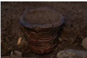
SB 19 B 埋甕 No.221 出土状況