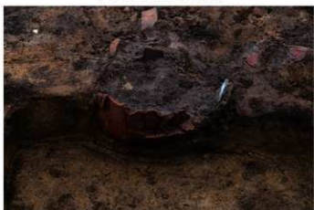
UG 34 No.432 出土状況