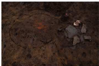
SF 3 罫出土状況