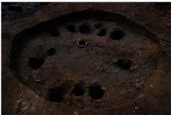
SB 24 完掘