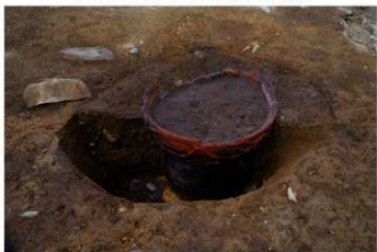
S B 26 埋甕炉 No.249 出土状況