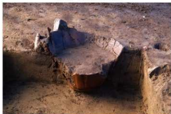
DS 23 No.448 出土状況