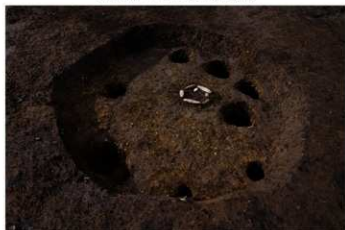
S B 11 完掘