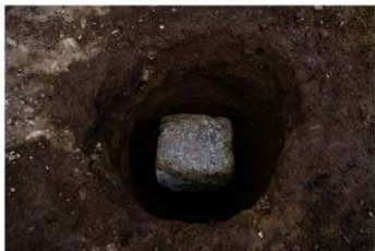
S B 13 P 8 立方体状の石 出土状況