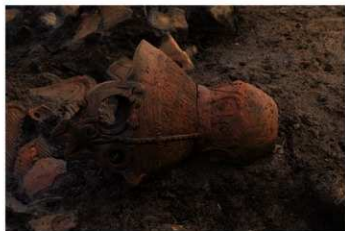
S B 10 No.58 出土状況