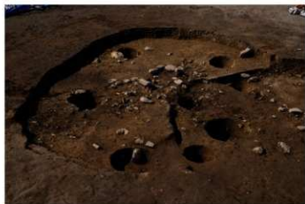
SB 17 A 完掘