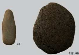
SB13 : (44・45)