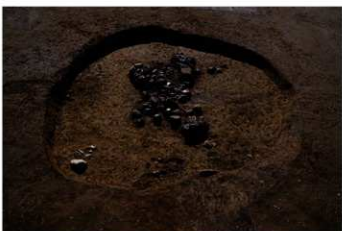
S B 52 遺物出土状況