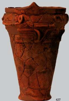
UG29 : (427)