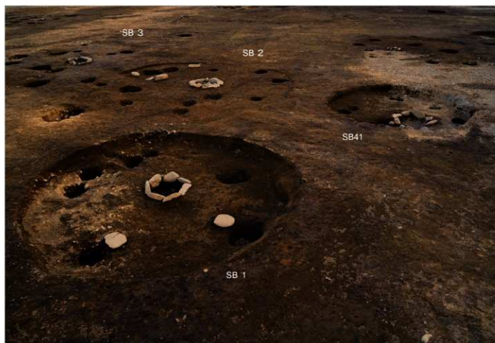
S B 1・2・3・41 完掘 (北から)