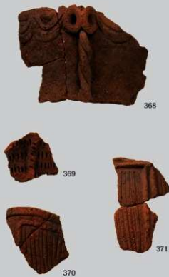
SB63 : (368~371)