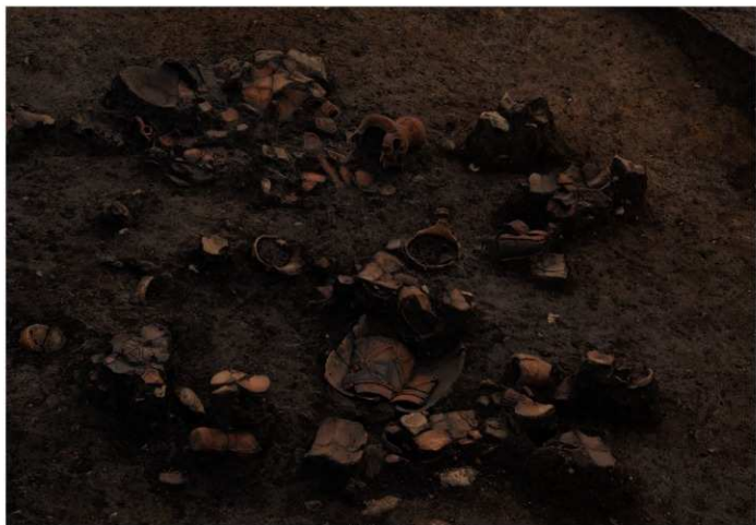
S B 10 遺物出土状況 (部分)