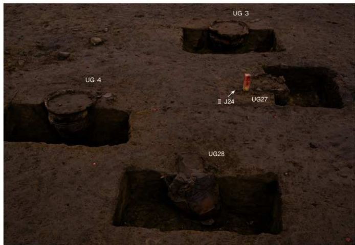
屋外埋設土器 出土状況 (II J24 グリッド周辺・南から)