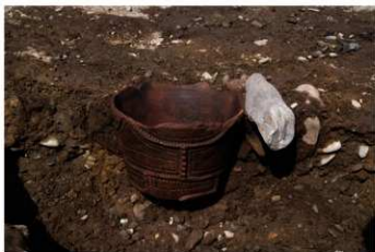
S B 46 埋甕炉 No.318 出土状況