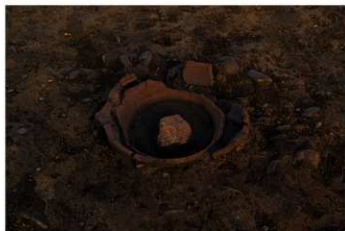
S B 52 埋甕炉検出状況