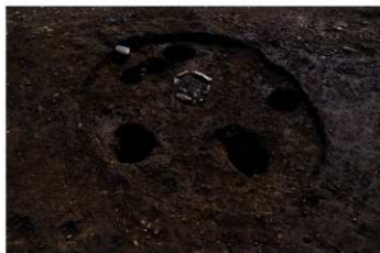
S B 57 完掘