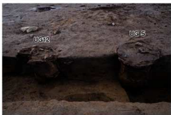
UG 5・12 No.410 (左)・403 (右) 出土状況