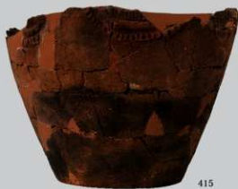
UG17 : (415)