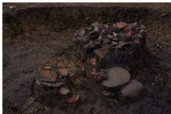
S B 46 遺物出土状況