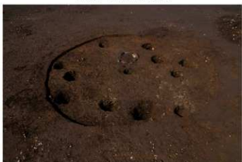
S B 59 完掘