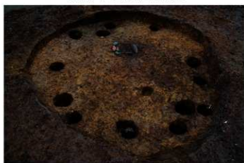
S B 13 完掘