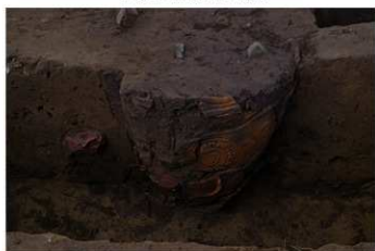
U G 10 No.408 出土状況