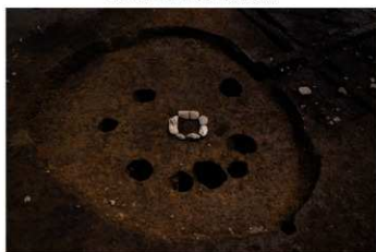
S B 25 完掘