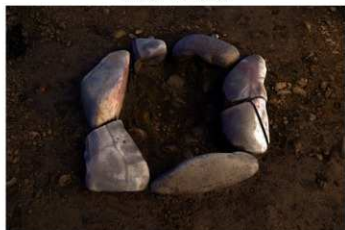
S B 60 石囲炉完掘