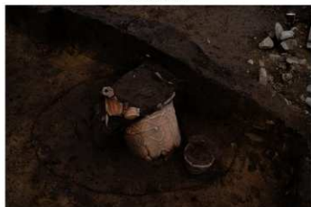
SK 42 No.387 (左) No.388 (右) 出土状況