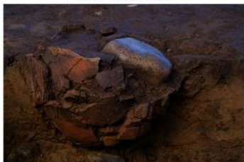
UG 19 No.418 出土状況