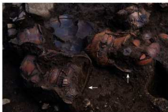
S B 13 No.161 (左) No.160 (右) 出土状況