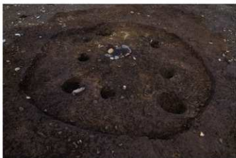
S B 48 完掘