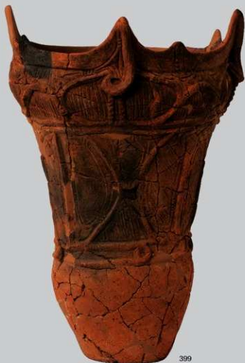
UG1 : (399)