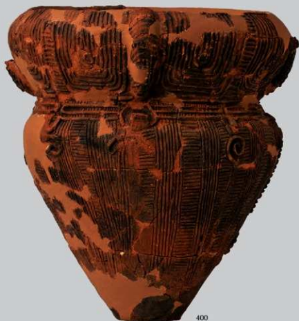
UG3 : (400)