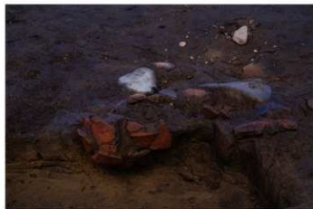
UG 35 出土状況