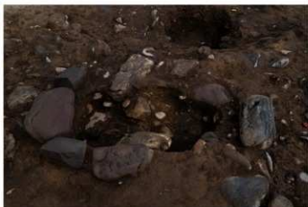
SB 17 A 石囲炉完掘