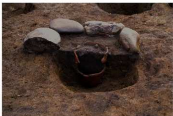
S B 25 石圍炉内土器 No.245 出土状況