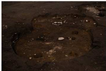
SB 19 A B 完掘