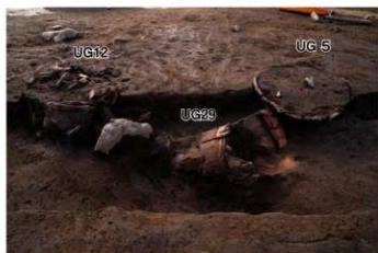
UG 5・12・29 No.410 (左)・427 (中)・403 (右) 出土状況