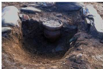
S B 57 石囲炉内土器 No.354 出土状況