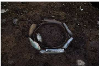
SB 23 石囲埋甕が検出状況