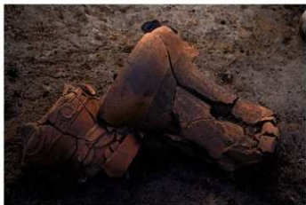
S B 13 No.136 (左) No.134 (右) 出土状況