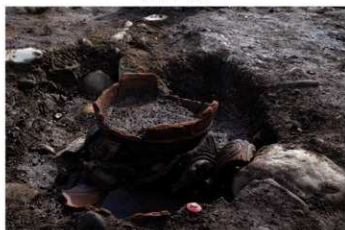
SB 18 埋壺炉検出状況