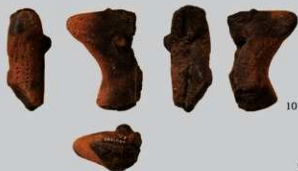
SB49 : (10)