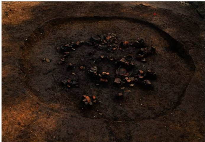
S B 10 遺物出土状況