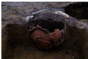
S B 61 石囲埋甕炉 No.364 出土状況