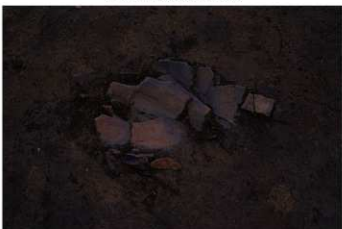
UG 20 No.417 出土状況