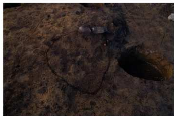
SB 14 A 穴検出状況