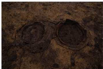
S B 14B 埋焼炉検出状況