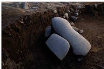
S B 12 台石 No.42 (左) 棒状石 No.43 (右) 出土状況