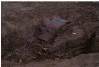
DS 13 No.445 出土状況