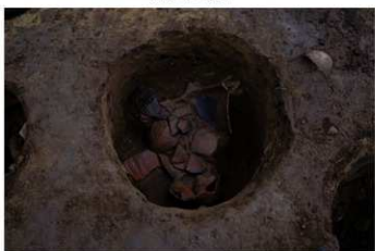
S B 65 P 7 No.376 出土状況