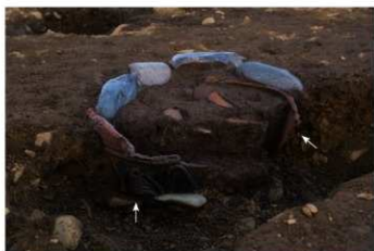
S B 50 石圍埋甕炉 No.338 (左) No.339 (右) 出土状況