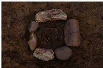
S B 25 石圍炉検出状況