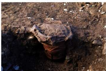
S B 52 P 8 No.347 出土状況