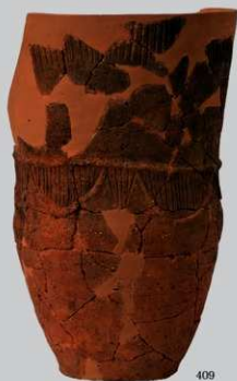
UG11 : (409)