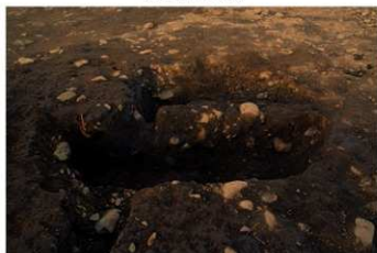
SK 53 断面