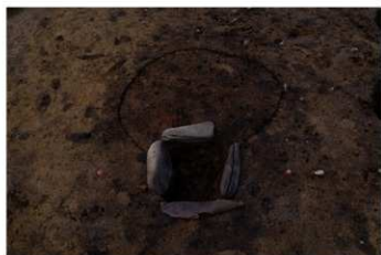
SB 16 A 石囲が完掘