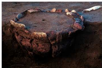
UG 3 No.400 出土状況