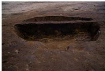
SK 39 断面