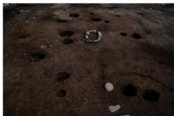
SB 3 完掘