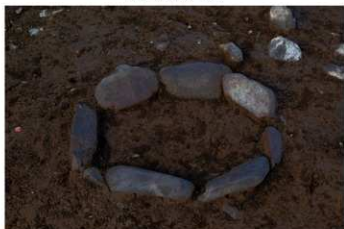
SB 19 B 石囲が完掘