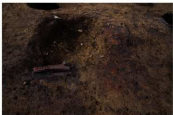
S B 65 炉完掘