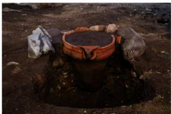
S B 10 石囲埋甕炉 No.44 出土状況