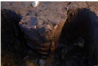
UG 18 No.416 出土状況