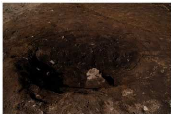
SK 51 断面