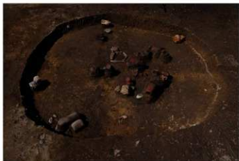
S B 12 遺物出土状況