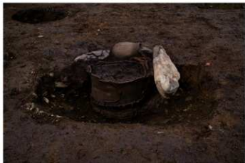
S B 12 石囲埋甕炉 No.92 出土状況