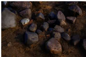
S B 52 埋甕炉検出状況