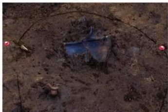
DS 22 No.447 出土状況