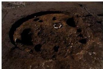
S B 63 完掘