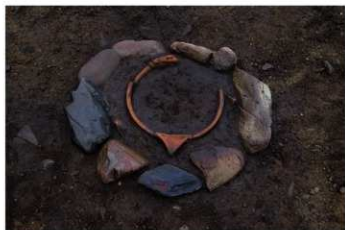
S B 10 石囲埋甕炉検出状況