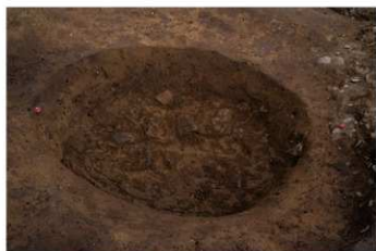
SK 42 完掘