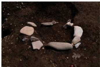
S B 41 石囲炉完掘