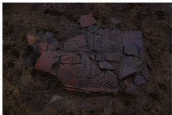
DS 99 No.449 出土状況