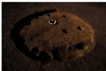
S B 66 完掘