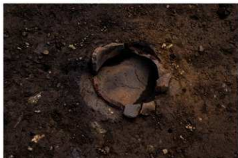
UG 23 No.421 出土状況