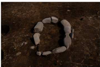
SB 3 石囲炉完掘