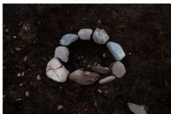
S B 64 石圍炉完掘