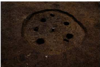
S B 46 完掘