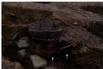
S B 43 B 埋葬が No.307 (外) No.308 (内) 出土状況