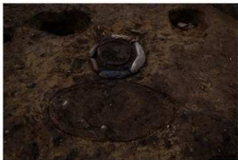
SB 15 石囲埋甕が検出状況