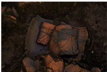
S B 10 No.45 出土状況