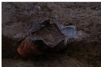
UG 33 No.431 出土状況