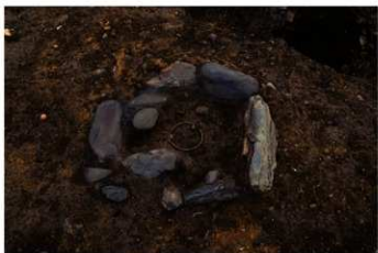
S B 57 石囲炉検出状況