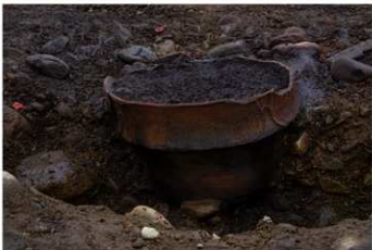
SB 19 A 埋甕が No.213 出土状況