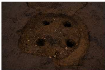
SB 23 完掘