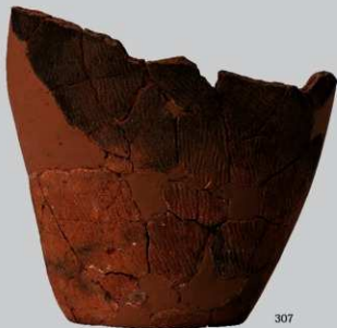
SB43B : (307~311)