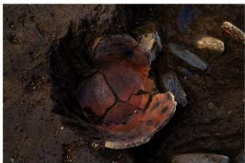
UG 32 No.430 出土状況