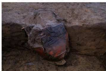
UG 28 No.426 出土状況