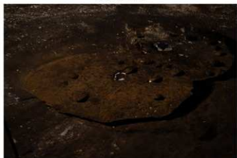
S B 61 完掘