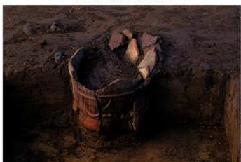
U G 11 No.409 出土状況