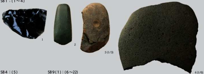
SB4 : (5)