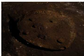
S B 42 完掘