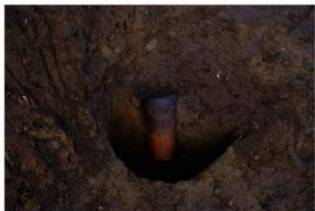
S B 13 P14 No.120 出土状況