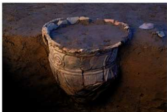
UG 4 No.402 出土状況