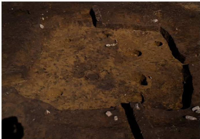
SB 14 A 完掘