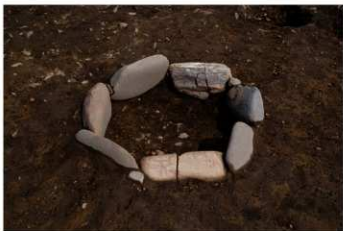
SB 1 石囲炉完掘