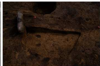
SB 14 A 穴断面