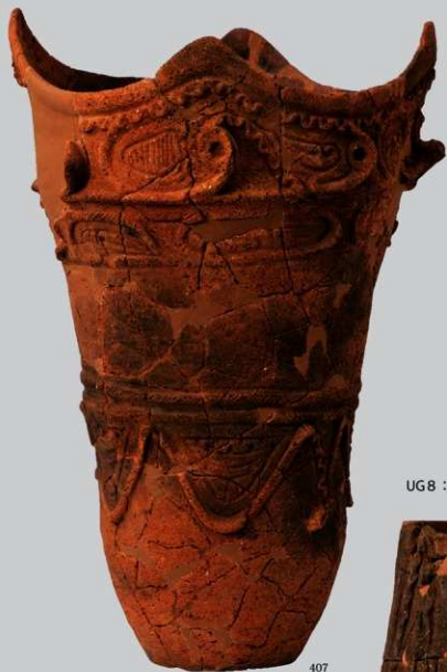
UG 8 : (406)