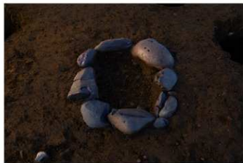
S B 59 石囲炉完掘