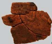
SB17B : (196~199)