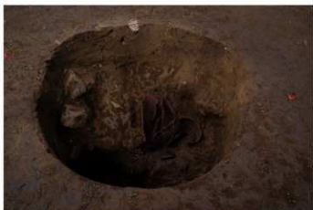
SB 18 P 5 No.206 出土状況