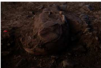
UG 22 No.420 出土状況