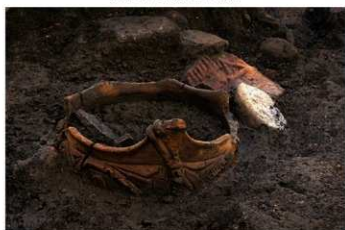
S B 10 No.52 出土状況