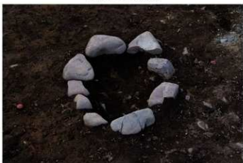
SB 4 石囲炉完掘