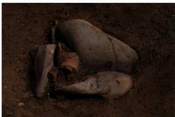
DS 5 No.440 出土状況