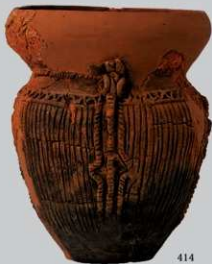
UG16 : (414)