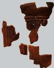
SB4 : (7)