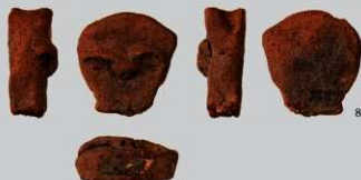
SB43B : (8)