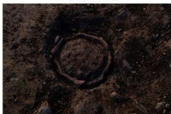
S B 52 P 8 検出状況