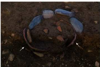
S B 50 石圍埋甕炉 No.338 (左) No.339 (右) 出土状況