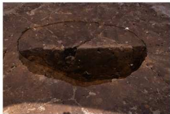
SK 2 断面