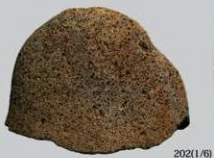
UG 1 : (202)