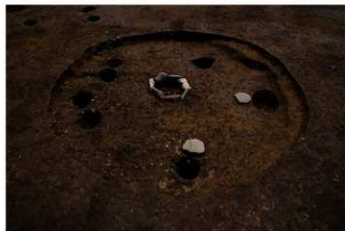
SB 1 完掘