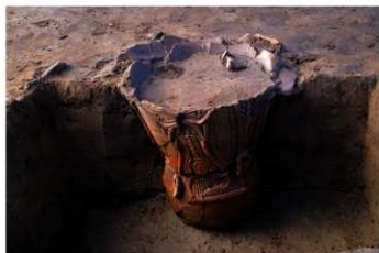
U G 13 No.411 出土状況