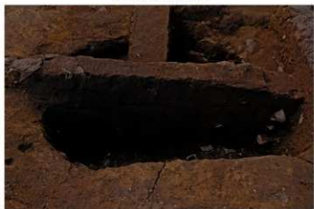
SK 1 断面