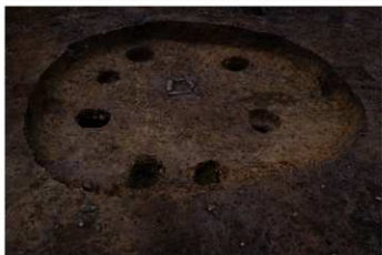
S B 12 完掘