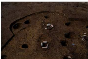
SB 16 B 完掘