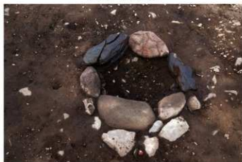
S B 29 石囲炉完掘