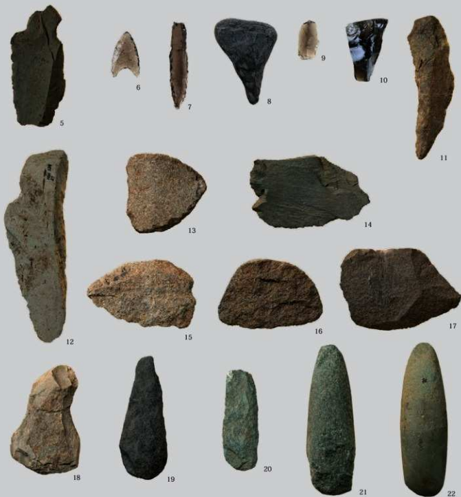
SB9 (1) : (6~22)