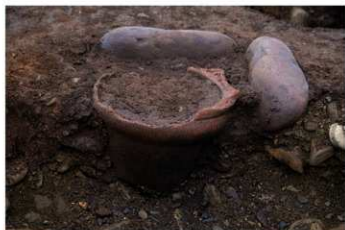
S B 42 石囲埋甕炉 No.295 出土状況