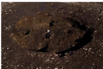
S B 49 完掘