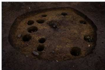
S B 65 完掘