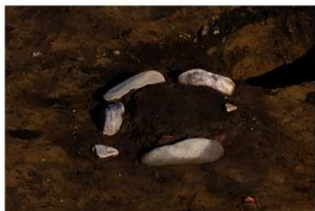
S B 61 石囲埋甕炉検出状況