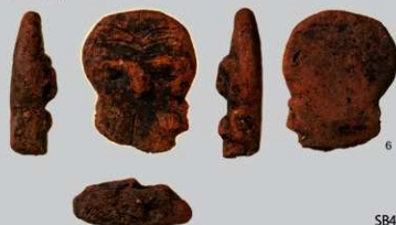
SB24 : (6)