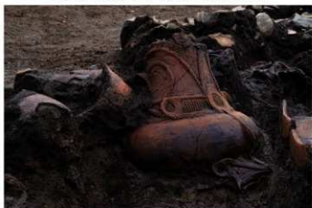
S B 13 No.124 出土状況