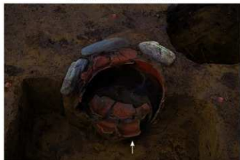
S B 61 石囲埋甕炉底面土器 No.365 敷設状況