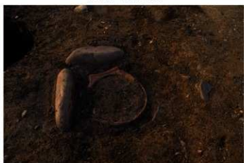
S B 42 石囲埋甕炉検出状況