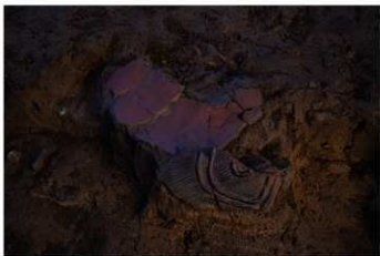
DS 1 No.435 出土状況