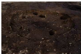
S B 30 完掘