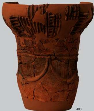
UG 5 : (403)