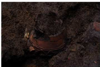
S B 13 No.127 出土状況