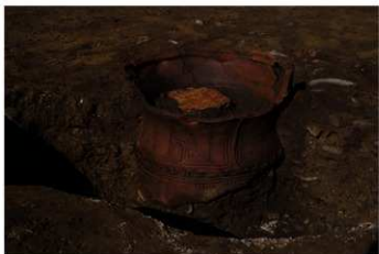
S B 52 埋甕炉 No.346 出土状況