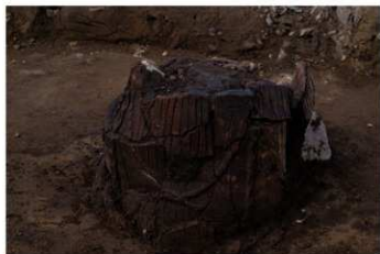
U G 8 No.406 出土状況