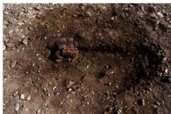
DS 7 No.441 出土状況