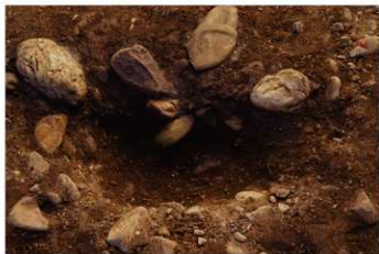
S B 49 石圍炉完掘