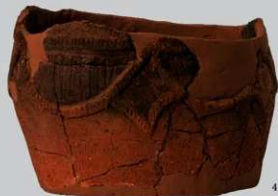
UG22 : (420)