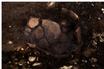
UG 31 No.429 出土状況