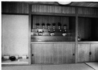
平安山ノロ殿内の神棚

『琉球国由来記』は、このノロ火ヌ神について、三月・八月の四度御物参の平安山ノロ御崇所と記す。現在は、旧正月のハチウガミや、旧暦五月・六月のウマチー、九月の白露の拝みなどが家人によって行われている。