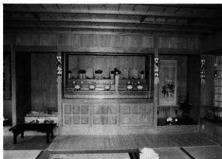
北谷ノロ殿内の神棚

中央の神棚は二つに区切られ、左側には今ヌル・中ヌル・先ヌルの香炉とクバ扇、右側には、クニデーヒとウサチカニマの香炉を祀る。右側の神棚には、カンティンオー（関帝王）の掛け軸と香炉がある。主な行事は、旧暦二月・三月・五月・六月十四日のウタカビ、二月・三月・五月・六月十五日のウマチーと、六月二十五日綱引き拝み、七月十七日の十七日遊びなどである。