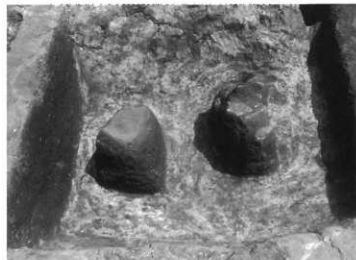
周溝から土器が出土した様子

方形周溝墓とは土層（死者を葬った穴）の周りに四角く溝を巡らせた弥生時代のお墓です。今回の調査では周溝の一部が確認されました。周溝の中からは弥生土器が出土しています。