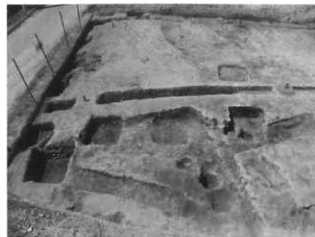
四角形の柱穴の建物跡

四角形の柱穴の建物跡は、柱間が3間×1間で5つがし字状に並んでいました。柱穴の中や周辺から遺物が出土していないため、建物の性格や時期は不明です。