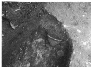
土器が出土した様子

調査では、弥生時代後期(約1,800年前)の掘立柱建物跡1棟、小穴、溝が発見されました。また、煮炊きした跡が確認され、竪穴住居跡があったと考えられます。壺、甕、高環などの土器の破片、土錘などが出土しました。