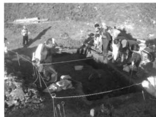
現地説明会の様子