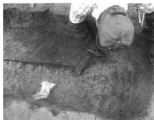
鉄製品(鎌)を掘り出す様子