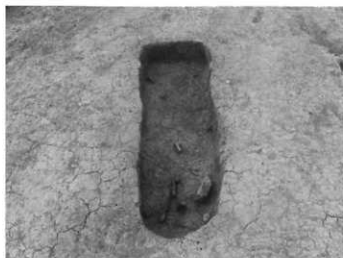
鉄製品が出土した様子

調査では、弥生時代後期(約1,800年前)の竪穴住居跡が2軒、方形底溝墓が4基、古墳時代の土塚墓が5基、江戸時代の墓が2基発見されました。