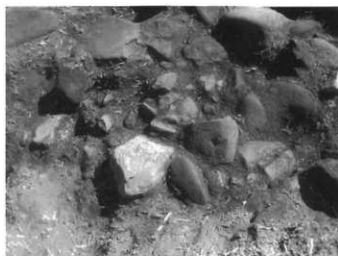
埴輪が出土した様子

墳丘を巡る溝を周溝と呼びます。周溝の外側に土手状の周堤があるように見えていましたが、今回の調査で周堤ではないことがわかりました。ここから、須恵器の破片が出土しています。