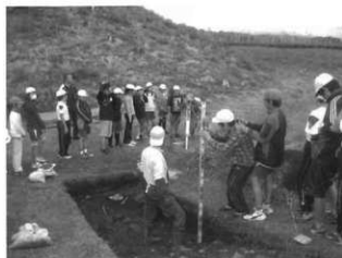
小学生の見学の様子

吉岡大塚古墳の周辺には、墳丘と好対照をなす広大な茶園が広がり、良好な景観となっています。また、古墳の近くには県道が通り、交通の便は良好です。県道を守る車から墳丘を眺めることもできます。今後は、これまでの調査結果に基づき、この立地を活かした整備を進めるよう計画しています。