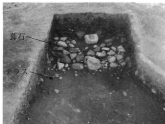
葺石を検出した様子

崩れ落ちた葺石の間やテラスからは、円筒埴輪と朝顔形埴輪の破片が出土しました。これらの埴輪は、過去の調査でも出土しています。