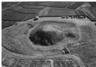
吉岡大塚古墳遠景

史跡整備に向け、古墳の内容を知るために行った調査で、今回は第6次調査になります。