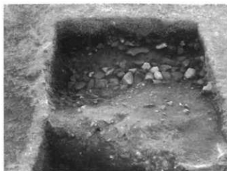
葺石を検出した様子

また、北側調査区では葺石を確認しました。葺石とは、盛った土が崩れないように墳丘の斜面に貼り付けるようにした石のことです。葺石の多くは崩れ落ちており、墳丘上段の葺石は4～5段残り、下段の葺石は確認できませんでした。