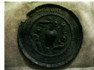
発見された斜縁四脚鏡

岡津原は、原野谷川が形成した独立丘陵です。鏡は、丘陵の西縁辺部の茶畑脇で発見されました。古墳時代中期に製作され古墳に埋葬されたと考えられる斜縁四脚鏡で、直径12cmのほぼ完全な形です。岡津原には、縄文時代から古墳時代の遺跡が広がっていますが、これまで奥ノ原古墳(消滅)で画文帯神獸鏡、西岡津古墳(消滅)で変形獸文鏡が発見されています。現在も丘陵縁辺部には、古墳や横穴が立地していますが、鏡の発見された場所には古墳の存在は知られていません。今回の発見は、既に消滅した有力古墳の存在を裏付けるものです。