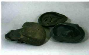
不良品として残されていた須恵器

あひわ 明和7年（1722）5月21日（陰暦）、現在の長谷小出ヶ谷地区において銅鐸 どうたつ 一口が発見され、掛川藩に届け出されました。掛川市教育委員会では、この日を記念して、市民の埋蔵文化財に対する理解と保護・保存しようとする意識の向上を願い、出土文化財展を開催しています。