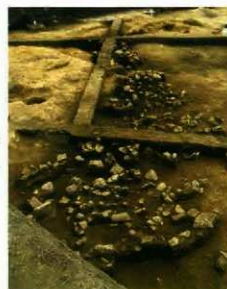
土器が出土した様子