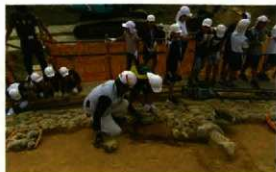
葺石復元体験の様子