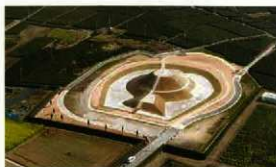
令和元年度 工事完成 西から