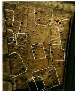
破線…竪穴住居跡 8軒 実線…掘立柱建物跡 4棟