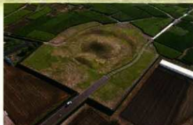
平成29年度 工事着手前の様子

令和元年度は、墳丘の復元と周囲の園路舗装や植栽を行いました。墳丘の葺石復元には地元小学校の5、6年生が参加しました。埴輪の設置を除けば、墳丘の復元はほぼ完了しました。