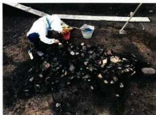
土器捨て場の様子