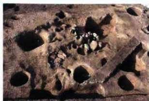
石敷き遺構のある竪穴住居跡（縄文時代）

白線…竪穴住居跡、緑線…掘立柱建物跡 赤円…土坑墓、黄円…土坑墓（中世） 青円…貯蔵穴