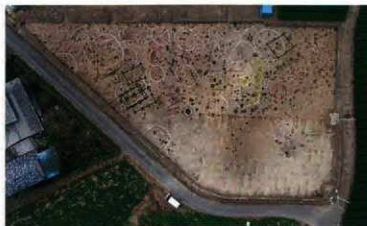
調査区東半部遺構の検出状況

白線…竪穴住居跡、緑線…掘立柱建物跡 赤円…土坑墓、黄円…土坑墓（中世） 青円…貯蔵穴