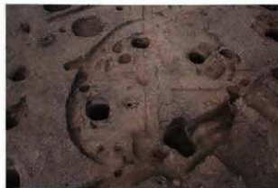
竪穴住居跡（弥生時代後期）

住居跡の多くは、弥生時代後期から古墳時代前期のものでした。時代は違いますが、何回も住居が建てられていることから、当時から住みよい場所だったことが想像されます。