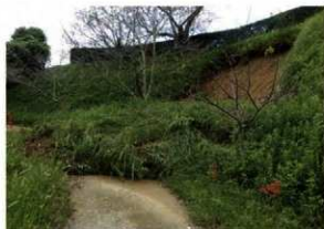
本丸の斜面崩落状況

斜面の崩落土から戦国時代末期に葺かれた瓦や江戸時代の陶磁器や瓦が見つかっています。本丸、西の丸に存在した建物に葺かれた瓦や城内で使われた陶磁器が斜面に落ちたものと考えられます。