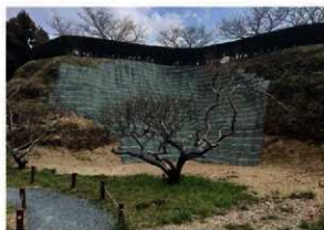
西の丸復旧工事の完了状況