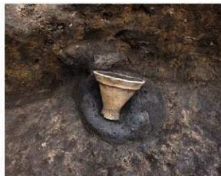
竪穴住居跡内から見つかった高環の一部

めいお しょうわ しょうわ しょうわ 明和9年(1772)5月21日(陰暦)、現在の長谷小出ヶ谷地区において 銅鐻一口が発見され、掛川藩に届け出されました。掛川市では、この 日を記念して、市民の埋蔵文化財に対する理解と保護・保存しようとする 意識の向上を願い、出土文化財展を開催しています。