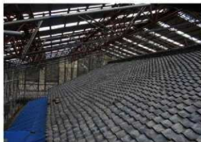
令和2年 解体調査前の屋根

文化財建造物の修復ですので、瓦や垂木、床板など引き続き使用できる部分は再利用して修復を進めています。また、解体調査を進めている中で、式台玄関から棟札が見つかるなど、建物の変遷を物語る貴重な発見もありました。