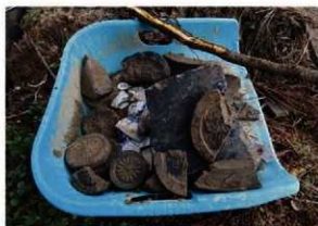
崩落土から出土した遺物