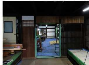
復元整備が進む主屋内部