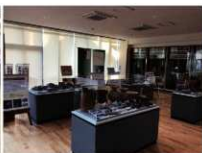
展示会場（木城会場）