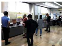
展示会場（高原会場）