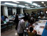
土器復元体験・石器レプリカ製作等