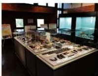
展示会場（西都会場）