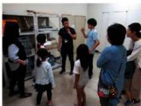
バックヤード見学