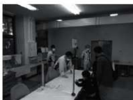
石器レプリカ製作