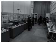
展示会場（日の影会場）