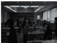
体験講座（宮崎会場）