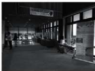
展示会場（門川会場）