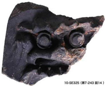
10-SE325 (第7-243 図14)