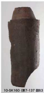
10-SK160 (第7-137 図63)