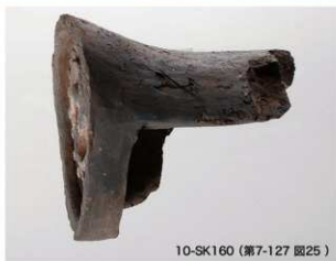
10-SK160 (第7-127 図25)