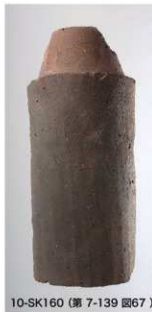
10-SK160 (第7-139 図67)