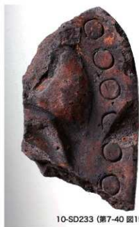
10-SD233 (第7-40 図15)