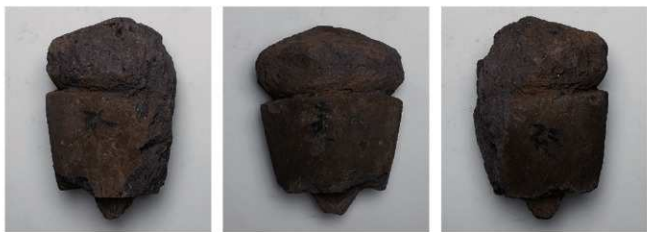
10-SE225 (第7-232 図8)