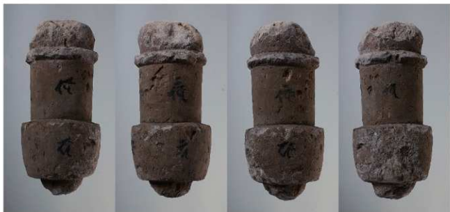
10-SE225 (第7-232 図7)