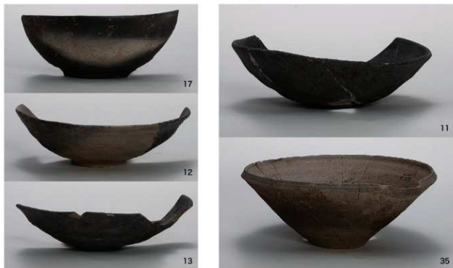
10-SK281 出土遺物(第7-207 図・第7-208 図)