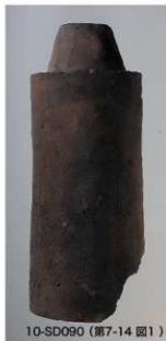
10-SD090 (第7-14 図1)