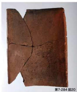
旧万寿寺跡第10次調査出土平瓦