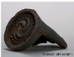
10-SK027 (第7-53 図7)