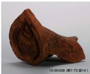
10-SK038 (第7-73 図14)