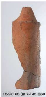
10-SK160 (第7-140 図69)