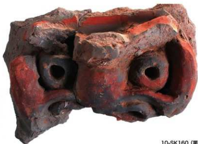
10-SK160 (第7-129 図49)