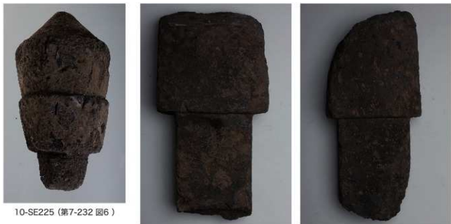
10-SE225 (第7-232 図6)