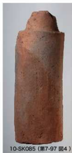
10-SK085 (第7-97 図4)