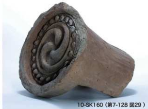
10-SK160 (第7-128 図29)