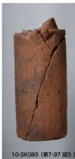
10-SK085 (第7-97 図5)