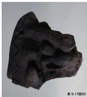
第 5-17 図55