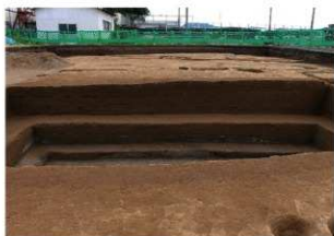
南北トレンチ土層