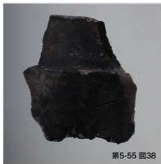
文字瓦(天下□ / 人口)