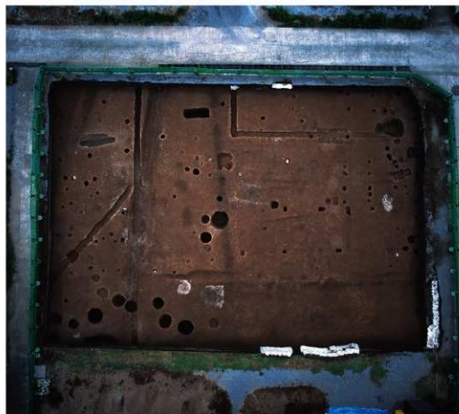
旧万寿寺跡第9次調査区