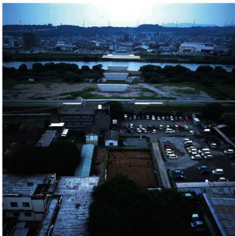
旧万寿寺跡第9次調査区全景(西から)