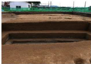
南北トレンチ土層