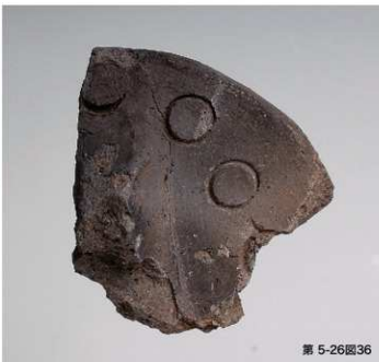
第 5-26 図36