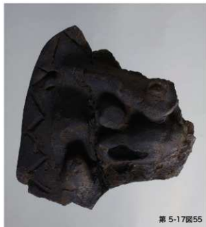
第 5-17 図55