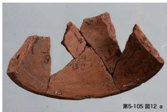
第5-105 図12 a