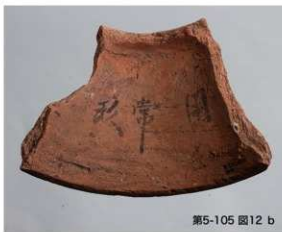
第5-105 図12 b