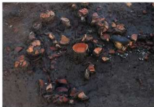
10-SK031 遺物出土状況(土器と玉砂利)