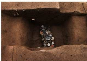
10-SD140断ち割り部遺物出土状況