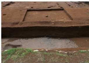
東西トレンチ土層