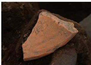
08-SK167墨書土器遺物出土状況