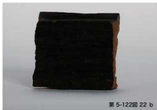
第 5-122 図 22 b