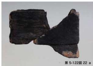
第 5-122 図 22 a