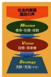
奈文研の“Mission”, “Vision”, “Strategy”

このような奈文研に対する社会的要請の変化と同時に、長引く経済的な低迷、人口減少、世界的な環境変動、頻発する災害、新型コロナウイルス感染症の大流行、ロシアのウクライナ侵攻をはじめとする激動の国際情勢など、日本と奈文研をとりまく状況も大きく変化し、不確実性を増しています。