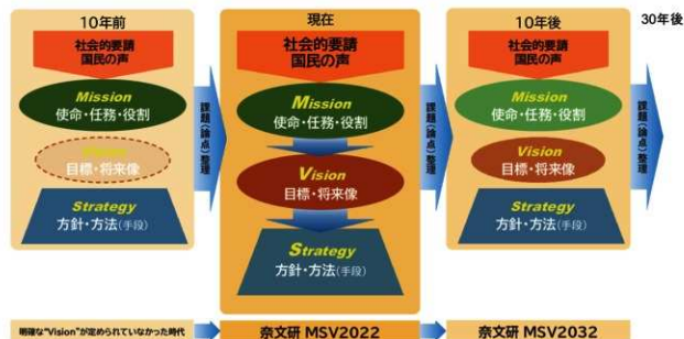
奈文研の“Mission”、“Vision”、“Strategy”の段階的發展

「奈文研MVS2022」の実施にあたっては、私たちの調査研究が、本報告に示す「3つのサステナビリティ(持続可能性)」の維持に寄与し、社会的要請に十分応えるものとなっているかという観点から、経営企画委員会をはじめ所内に設置された各種委員会において定期的に点検を行い、そのプロセスと成果に関する自己評価を確実に行う必要がある。そのうえで、恒常的に事業の実施及び組織体制の運営状況について自己評価を行い、必要に応じて見直しを図りつつ、体力強化に努めることが重要である。この観点から、今後は、限られた人員でさらなる研究力・企画力の向上を図り、収支バランスの安定のため、運営費交付金の減額を補完する外部資金獲得の制度を構築・推進する