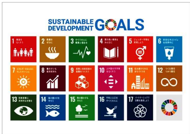
国連による「持続可能な開発目標（SDGs）」の17のゴール

そのため、奈文研創立70周年にあたり、私たちはこれまでの歩みを振り返り、現状を正しく認識したうえで、①社会的使命を明確にし、②今後どのような姿を目指し、③その実現のために何を行うのかを明らかにしたいと思います。それを、奈文研の①Mission：ミッション、②Vision：ビジョン、③Strategy：ストラテジーとして公表することとします。