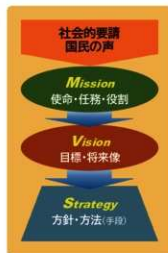
奈文研の“Mission”, “Vision”, “Strategy”

そのため、奈文研創立70周年を迎えるにあたり、これまでの歩みを振り返るとともに、現状を正しく認識したうえで、①社会的使命を明確にし、②今後どのような姿を目指し、③その実現のために何を行うのかについて明らかにすることとした。そして、本中眞所長の指示の下に経営企画委員会で議論を行い、上記の3項目を奈文研の①社会的使命(Mission: ミッション)、②10年後の姿(Vision: ヴィジョン)、③その実現の手法(Strategy: ストラテジー) (以下①～③を総称して「MVS」という)として取りまとめることとした。