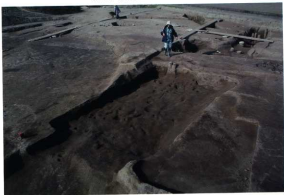
SK137 付近調査風景（北西から）