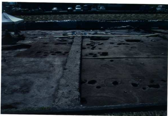
A63・B64区 上層遺構状況 (北から)