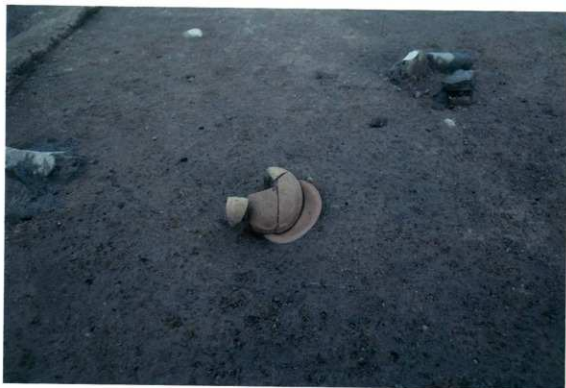
遺物(京都系土師器)出土状況 (A64区)