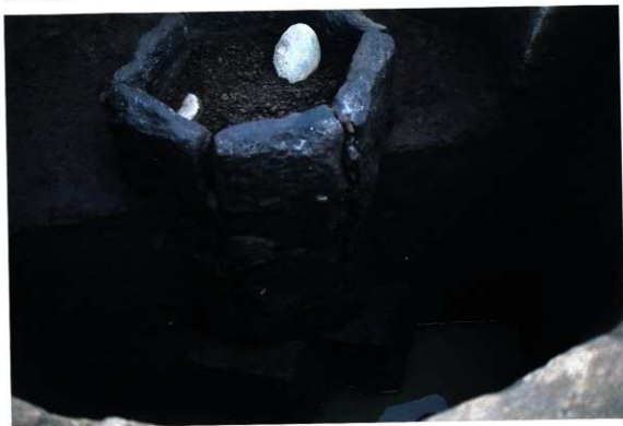
SE108 石組下部出土状況（南から）