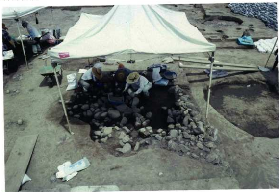
SK18 発掘作業風景（西から）