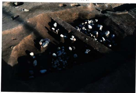
SK127 遺物出土状況 (東から)