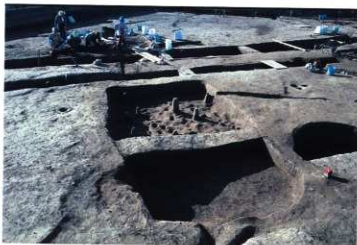
SK109 遺物出土状況（北から）