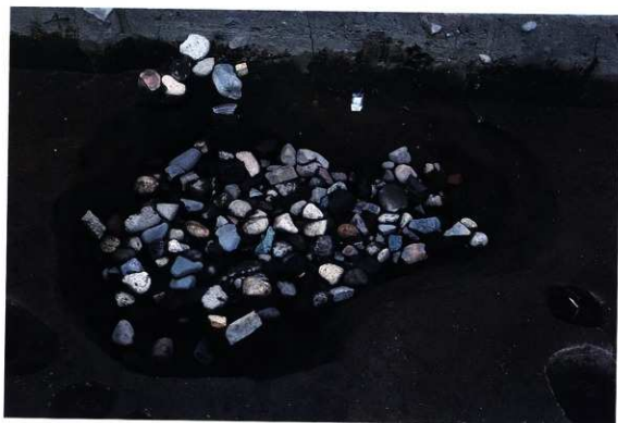
SK187 遺物出土状況（南から）