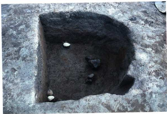
SK126 遺物出土状況（南西から）