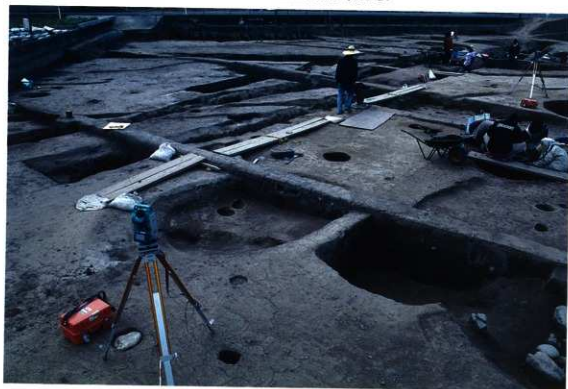
SD114・SD84 付近調査風景 (南から)