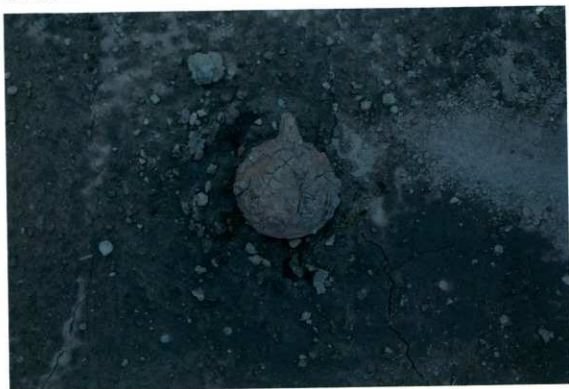
鉄製品出土状況 (Z64区)