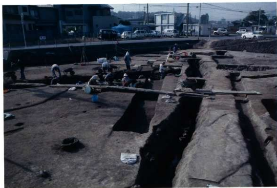
SD112 南部調査風景（東から）