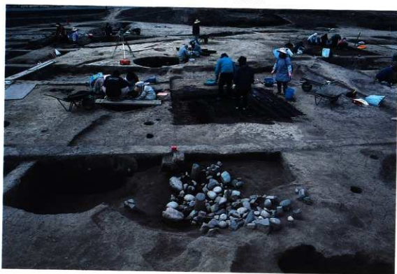
SE7 遺物出土状況(東から)