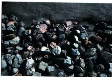
SD116 遺物出土状況近接写真(西から)