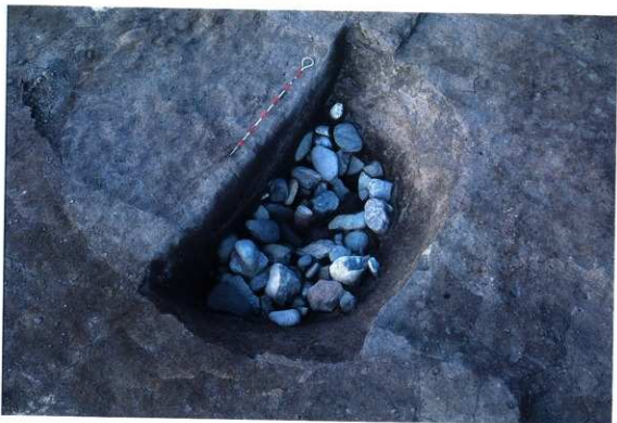
SK148 半割状況 (南から)