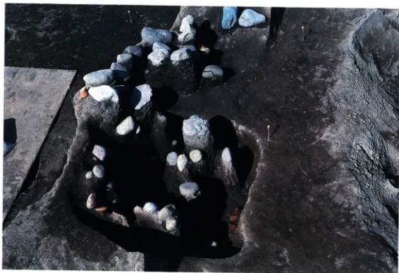
SK182-183 遺物出土状況（南から）