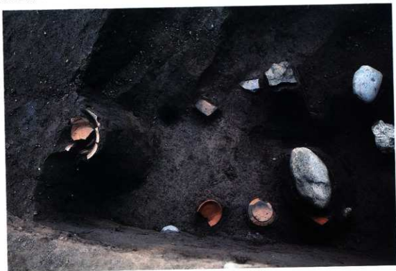
SK143 遺物出土状況（南から）