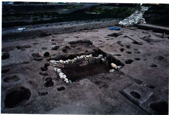
SK242 完掘状況（南西から）