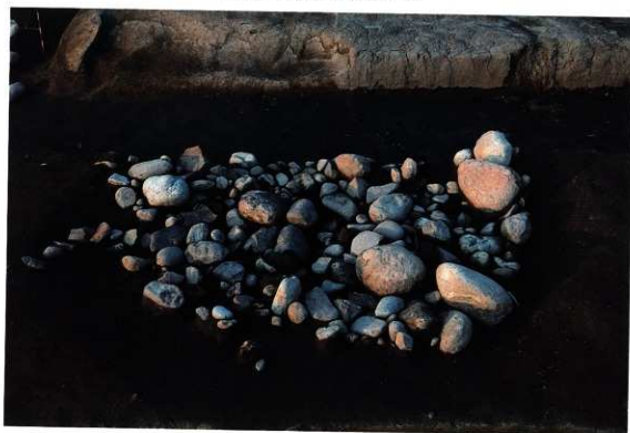
SK136 遺物出土状況（南から）