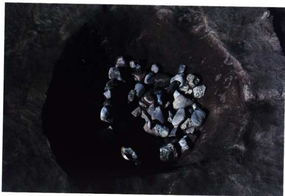
SK148 遺物出土状況 (南から)