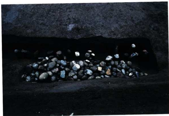
SD176 遺物出土状況（北から）