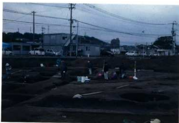
上層遺構面の調査状況（西から）