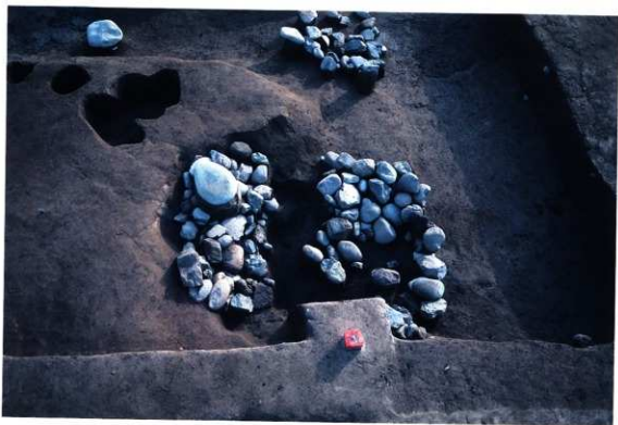
SK131・135 遺物出土状況（西から）