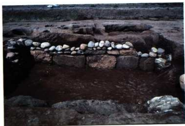
SK242 完掘状況近景 (南から)