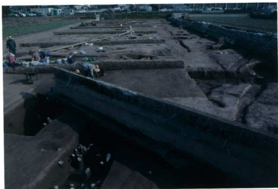
コンクリート壁の状況（調査区中央部）