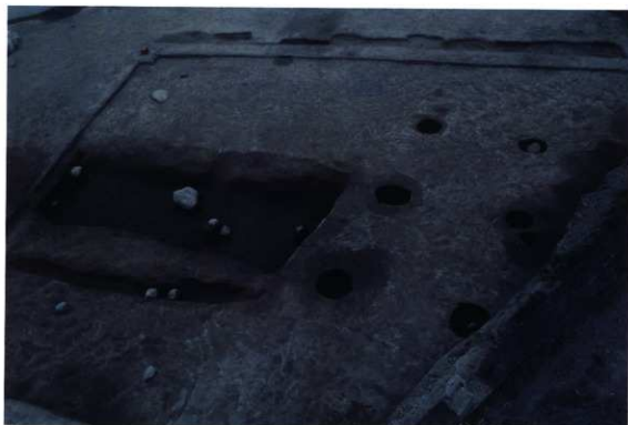
遺構検出状況(X61区) (東から)