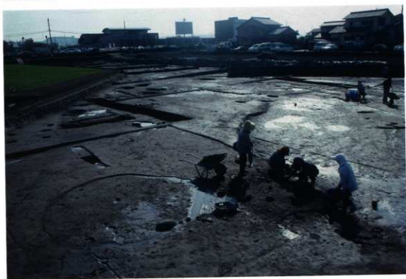
SE100 付近調査風景（北西から）