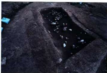
SD112 遺物出土状況 (南から)