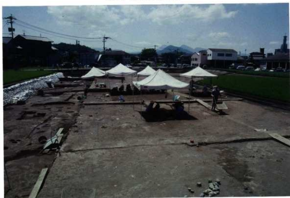
夏の作業風景・上層遺構面の調査（東から）