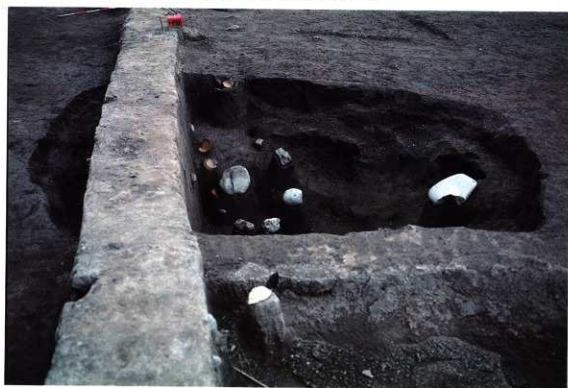
SK142 遺物出土状況 (南から)