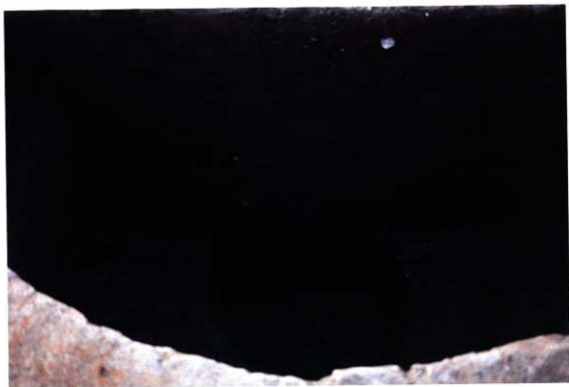
SE150 土層断面写真 (西から)