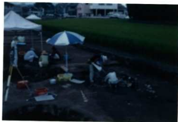
上層遺構面の調査（北西から）