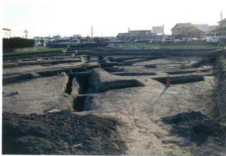
調査区南西部（西から）