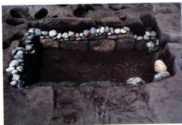
SK242 完掘状況 (南から)