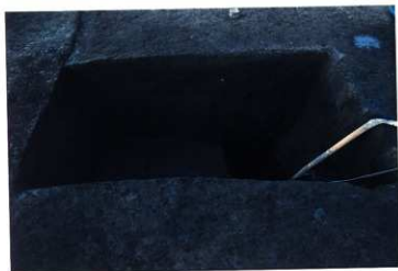
SD103 南北溝土層写真（北から）