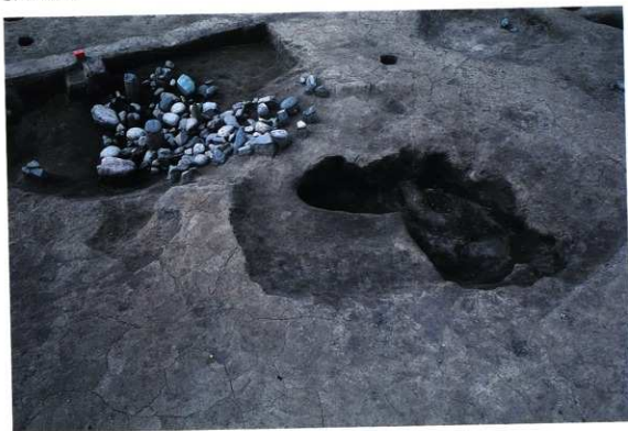
SK146 遺物出土状況（東から）