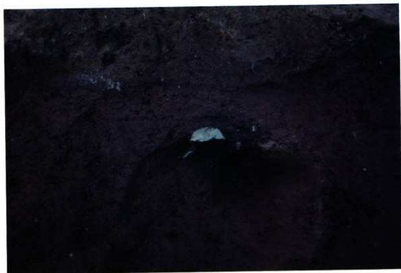
青銅製品出土状況