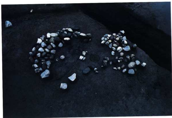
SK172・173 遺物出土状況（北から）