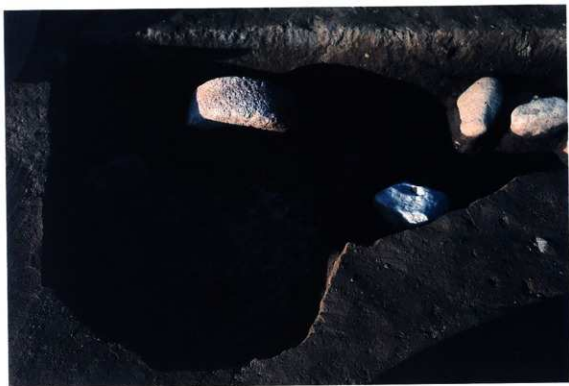
SK138 遺物出土状況（南から）