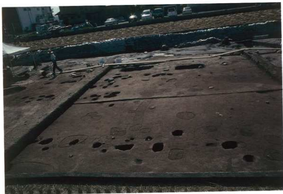
柱穴類調査状況(A63-64区)（北から）