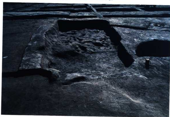
SK109・137 完壁状況 (南から)