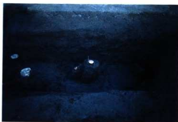
SD103B 遺物出土状況 (西から)