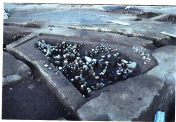
SK123(SD112埋土上部) 遺物出土状況(南西から)