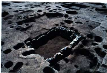
SK242 完掘状況（北東から）