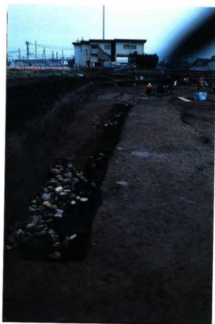
SD176 遺物出土状況（西から）