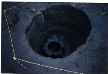
SE108 石組最下部・井筒出土状況（北から）