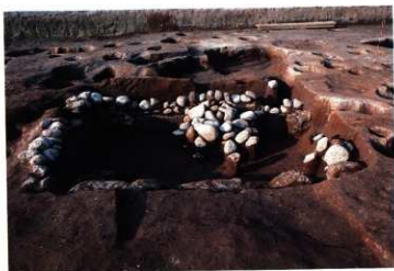
SK242 調査途中状況 (南から)