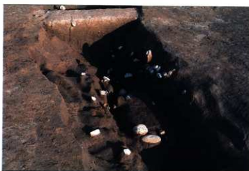
SD112 下部遺物出土状況 (南から)