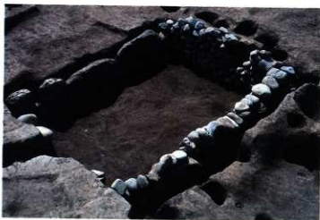
SK242 完掘状況近景（北東から）