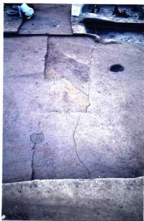
X62区の下層溝状遺構検出（北から）