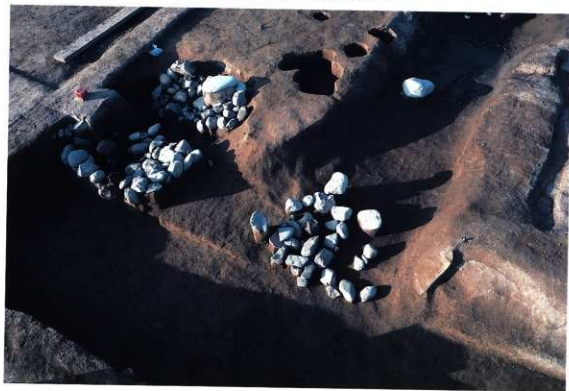
SK131・135 遺物出土状況（南東から）