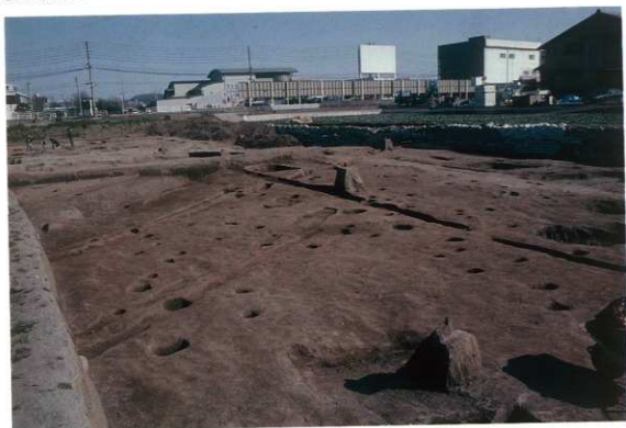
A63-64、B63-64区 下層遺構（北西から）