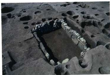
SK242 完掘状況（南東から）