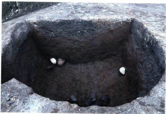
SK126 土層断面写真 (南から)