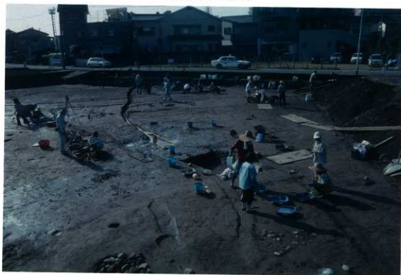
西部作業風景（北から）