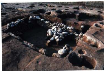
SK242 調査途中状況（南東から）