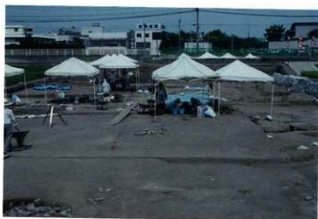
夏の作業風景・上層遺構面の調査（西から）