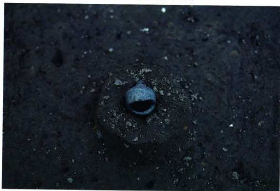
遺物(土製鈴)出土状況 (D64区)