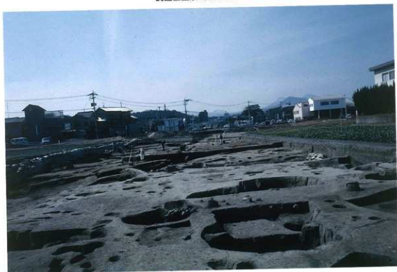
SE7東から見た調査区（東から）