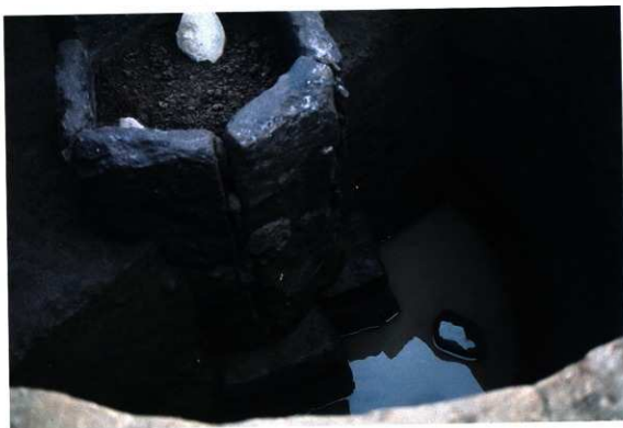
SE108 石組井側・最下部石組出土状況（南から）