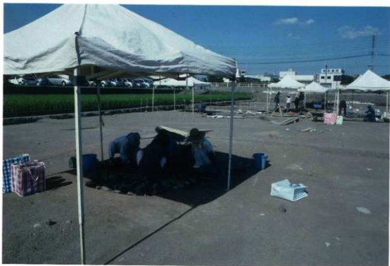
上層遺構面の調査（南西から）