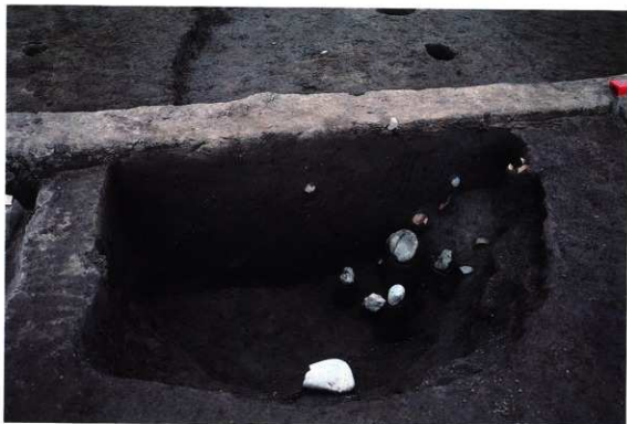
SK142 遺物出土状況 (東から)