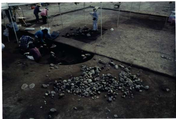
上層遺構面の調査（井戸の調査中）