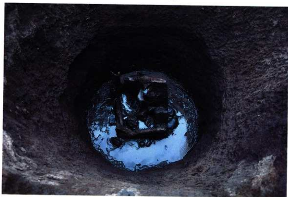
SE171 方形井側出土状況