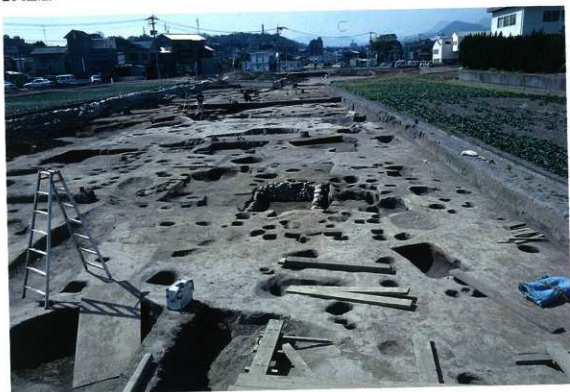
調査区全景（東から）