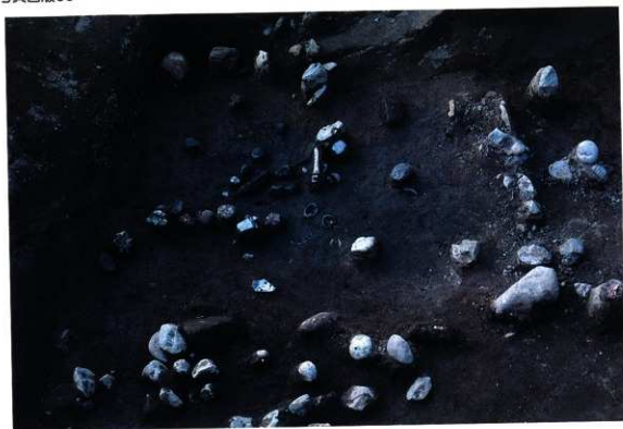
SK123 下部の状況（東から）