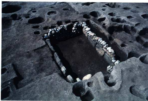
SK242 完掘状況（南東から）