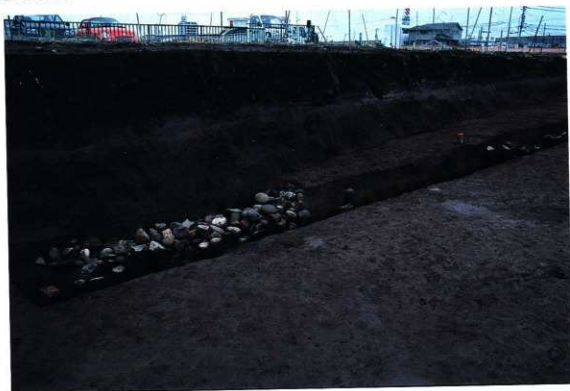
SD176 遺物出土状況（南西から）