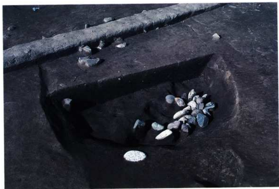
SK142遺物出土状況（東から）