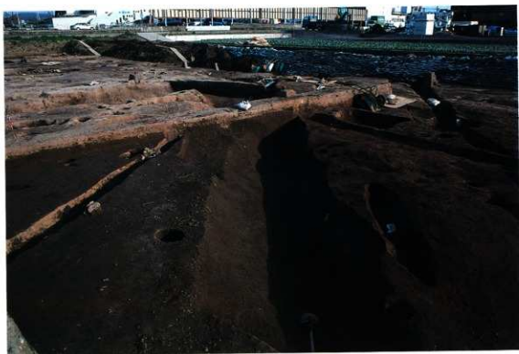
SD213・246~248 完掘状況（北西から）