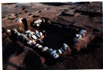
SK242 調査途中状況（北西から）