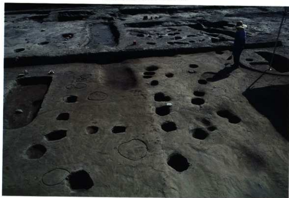
調査区東部上層遺構（北から）