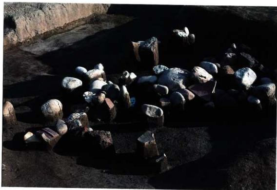
SK136 遺物出土状況（北から）