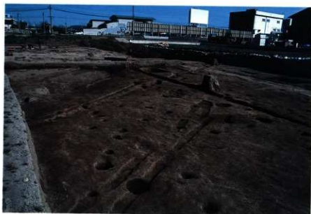
SD240・246～248 完掘状況（南東から）