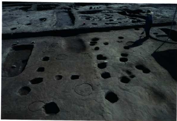
上層遺構完掘状況（柱穴類）