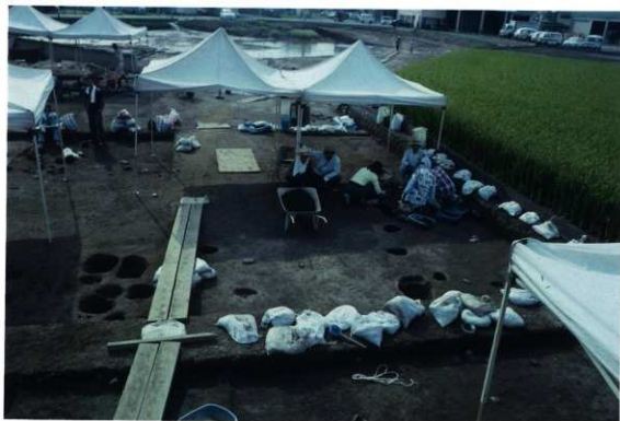
上層遺構面の調査（東から）