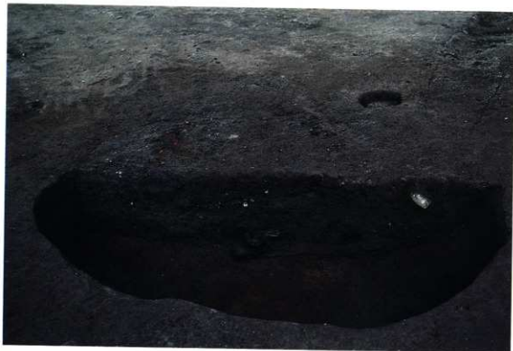
SK144 半割・土層写真(東から)