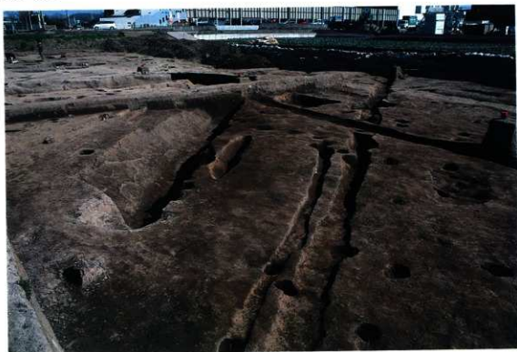
SD240・246・247・256 完掘状況（北西から）