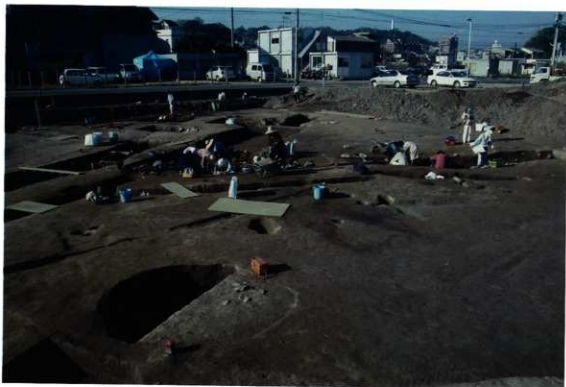
調査区西部作業風景（東から）