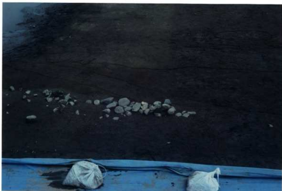
遺構検出状況(X63区) (南から)