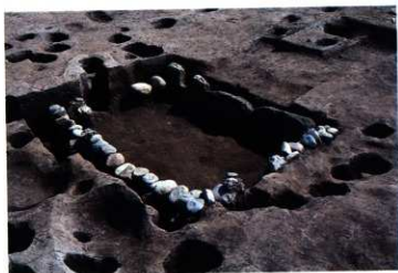
SK242 完掘状況（北西から）