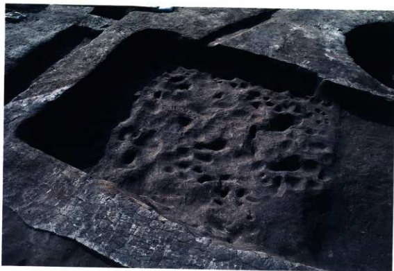
SK137 床面の凹凸 (南西から)