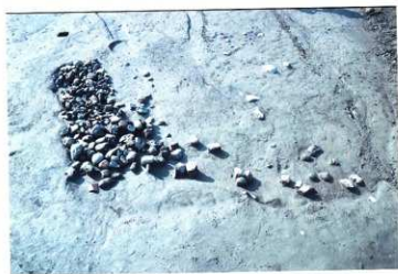
SD116 遺物出土状況（東から）