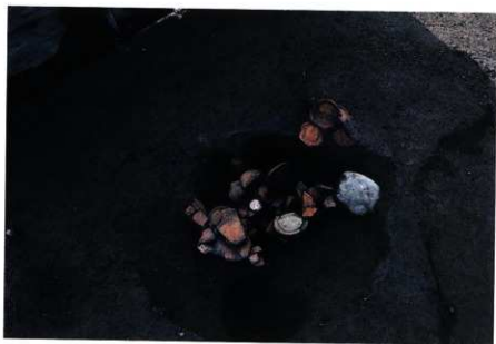
SK175 遺物出土状況（北から）