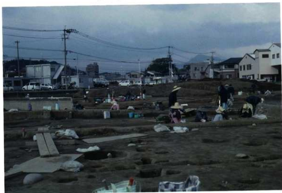
作業風景・上層段階（東から）