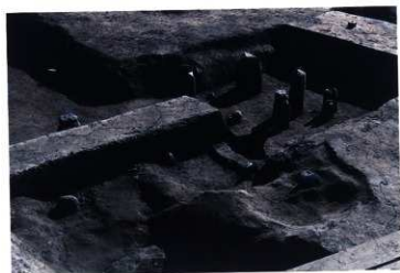
SD103・114 分岐地点付近（北西から）