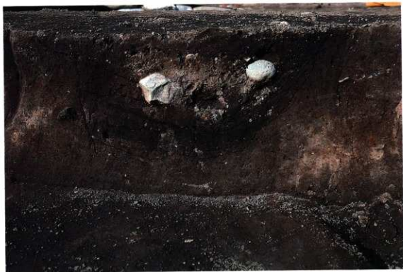
SK157 断面写真 (東から)