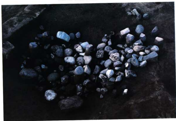
SK146 遺物出土状況近景写真（南から）