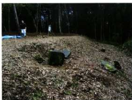
御霊園クルスバ遺跡測量風景

以上の点から、御霊園クルスバ遺跡は、鎌倉時代末期から戦国時代まで使われた小規模な中世仏教寺院が、戦国時代末期にキリスト教施設に改変されたものと推定され、その両者の石造物が現在に残る貴重な遺跡であることが明らかとなった。(田中)