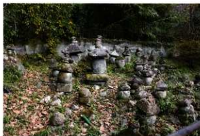
屋成家墓地石塔群

屋成家墓地は大分県北部の中津市本耶馬溪町屋形に所在する。狭隘な谷集落の山付きに営まれた鎌倉時代中葉～戦国時代の石塔群であり、面積80m 2 の中に宝塔10基以上、五輪塔40基以上の部材が確認できる。中でも、弘安5年(1282)の紀年銘をもつ宝塔は、大分県下においてもきわめて古式であり、茶筒状の塔身下に蓮華反花がつく金屬塔を模倣した型式をもち、笠裏の挿型内に全て黒書で三重方形枠内に「バク」を中尊にした梵字曼荼羅が八角所配されている。県下においてもきわめて貴重な石塔として、大分県指定有形文化財とされている。この宝塔に隣接し、型的に近似する同規模の宝塔が並べて立てられており、この2基が双塔として石塔群造営の契機となったことがわかる。この2基の宝塔の周囲に石塔が整然と並べられており、5×5mの範囲に35基が数えられる。並びには時期的な変遷や塔形の傾向は読みとれなく、後世、整理され組み立てられた姿が現在に続くものと思える。県指定弘安5年銘宝塔をはじめ数基の石塔を除き、本来の組み合わせを保っておらず、これについても後世、石塔群が整理されたことに起因するものと思える。石塔群の周辺には地面上に一握りの大きさの川原石が散乱するが、敷石目的で配石された