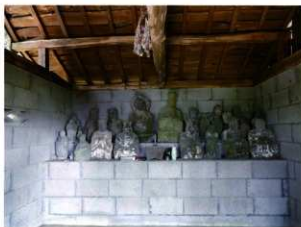
杵築市山香町広瀬鍛冶屋坊御堂内十王