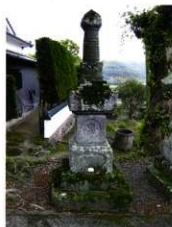
臼出町藤原下川久保地藏堂宝篋印塔

別杵地域では杵築市を中心にして相輪下部の意匠に馬耳形をもつという特徴的な宝篋印塔の分布と形態が把握できた。この特徴は、この地域に先行して熊本県や鹿児島県において流行するが、当地においても製作が根付いているこ