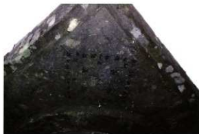
屋成家墓地県指定宝塔笠裏の梵字曼荼羅