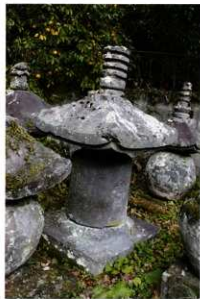
屋成家墓地県指定宝塔