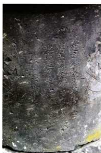
屋成家墓地県指定宝塔銘文