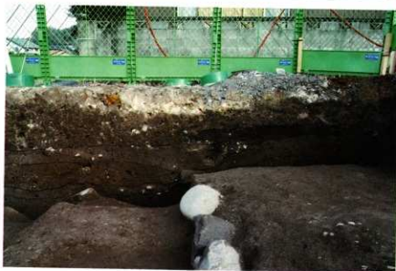
1次調査区1区 東壁土層 (スポット)