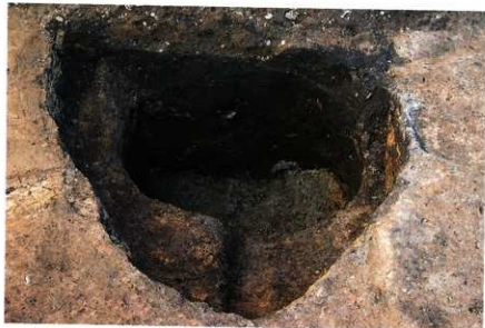
3次調査区SE010掘削状況