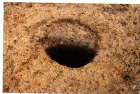
1次調査区SP1033土層断面