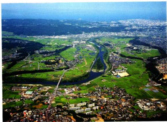
雄方後遺跡遺景(南から)