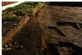
1次調査区SD2001完掘状況(西より)