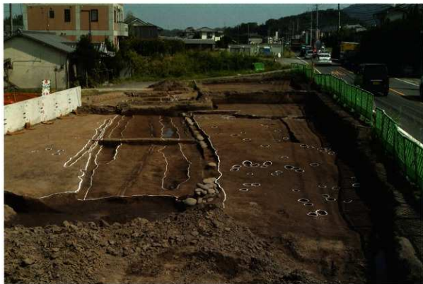
2次調査Ⅱ区 東側(西から)