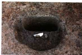
1次調査区SP1031遺物出土状況