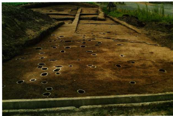
2次調査Ⅱ区 西側(西から)