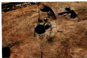
1次調査区SD1021遺物出土状況(北より)