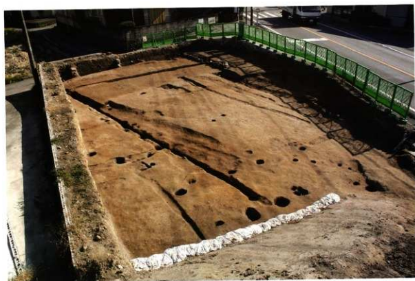
1次調査区1区 完掘状況(西より)