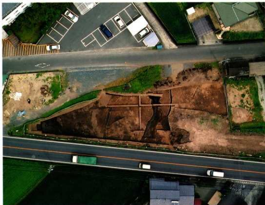
2次調査Ⅱ区 西側空中写真