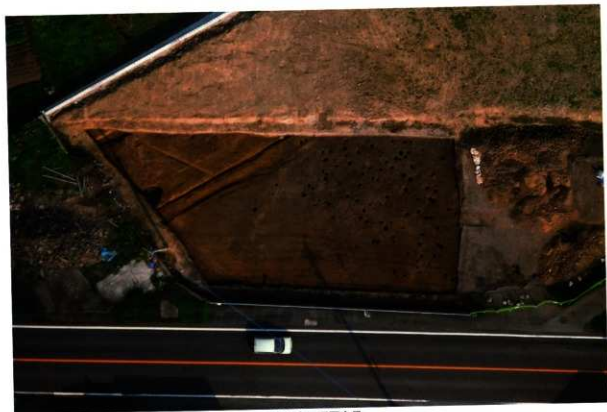
3次調査区西区全景