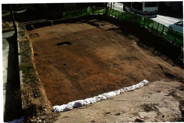
1次調査区1区 遺構検出状況(西より)