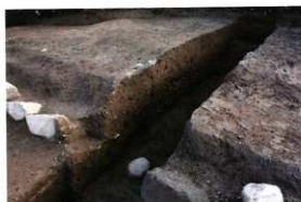
1次調査区1区 西側トレンチ土層断面