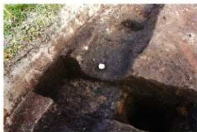
1次調査区SD2001遺物出土状況(第24回-1)