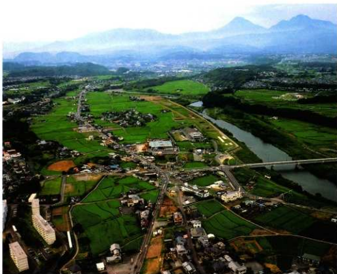
2次調査区空中写真(東から)