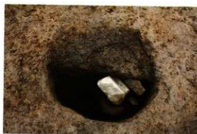
1次調査区SP1037土層断面