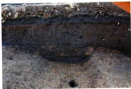
1次調査区2区 南壁土層 (SD1040付近スポット)