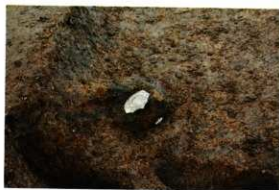
1次調査区SD1040遺物出土状況(第20図-1)