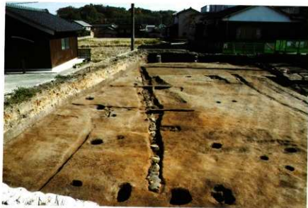
1次調査区 SD1018 石列検出状況 (西より)