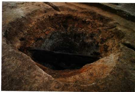
3次調査区 SE015足場木組検出状況 (北東から)