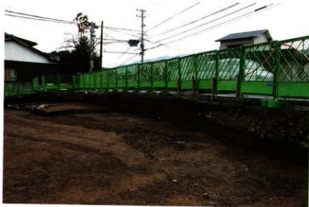
1次調査区1区 南壁土層