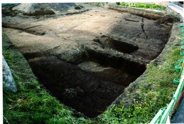
1次調査区3区 遺構検出状況(南東より)