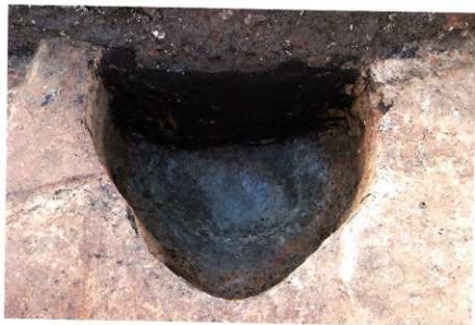
3次調査区SE010完掘状況