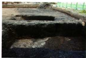
1次調査区3区 東側黒色土落込み状況