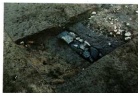
1次調査区暗渠上石列検出状況