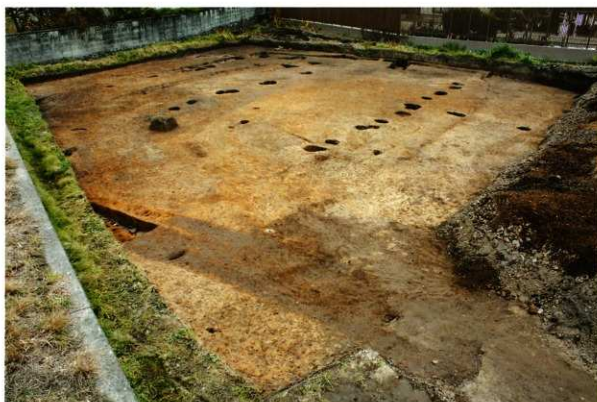
1次調査区4区 完掘状況(南西より)