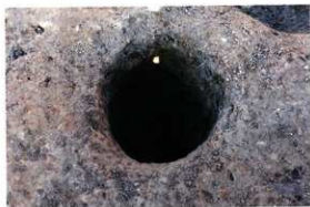
1次調査区SP1029柱出土状況