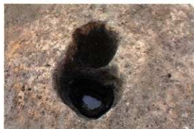
1次調査区SP2012木材検出・SP2020完掘状況