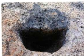
1次調査区SP1004土層断面