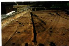
1次調査区SD1018完掘状況(西より)