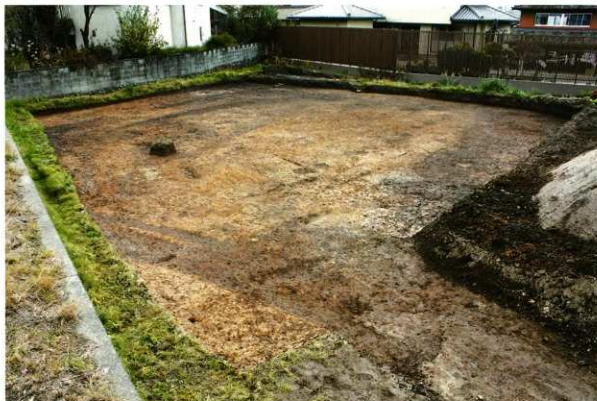
1次調査区4区 遺構検出状況(南西より)