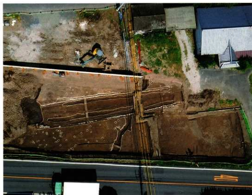
2次調査Ⅱ区 東側空中写真