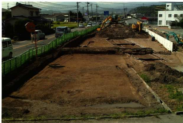
2次調査Ⅱ区 東側(東から)