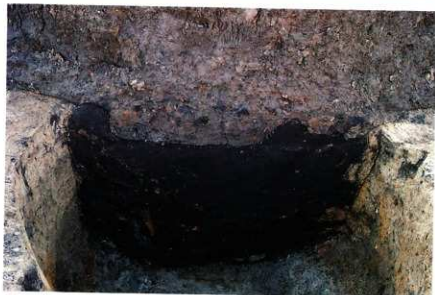
3次調査区SE010土層断面