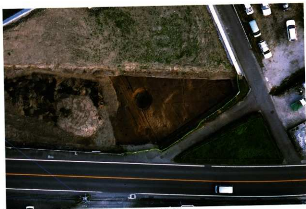
3次調査区東区全景