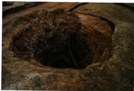
3次調査区 SE015足場木組検出状況 (南東から)