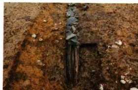
1次調査区暗渠下木材検出状況