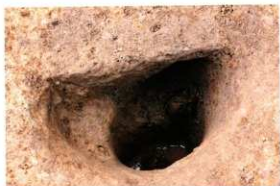
1次調査区SP1002土層断面