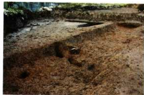
1次調査区SD1040完掃状況(北東より)