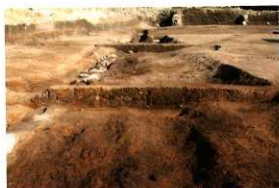
1次調査区SD1018土層断面(西より)