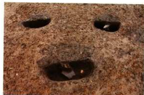
1次調査区SP1031(下)・1032(右)遺物出土状況