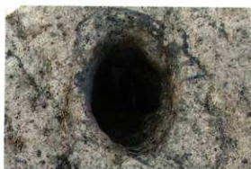
1次調査区SP2024柱出土状況