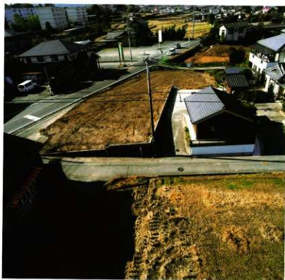
1次調査区全景(東より)