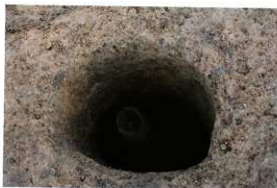
1次調査区SP1039柱検出状況