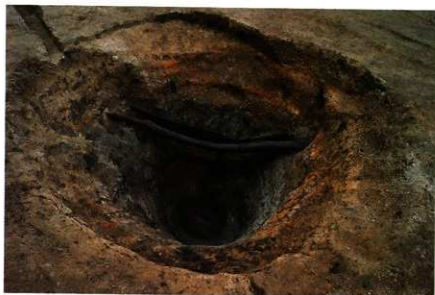
3次調査区 SE015足場木組検出状況 (南西から)