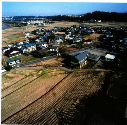
1次調査区全景(南より)