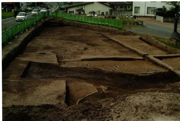
2次調査Ⅱ区 西側(西から)