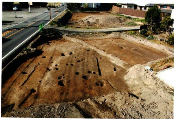
1次調査区2区 完掘状況(東より)