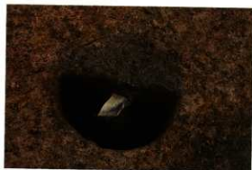
1次調査区SP1032遺物出土状況