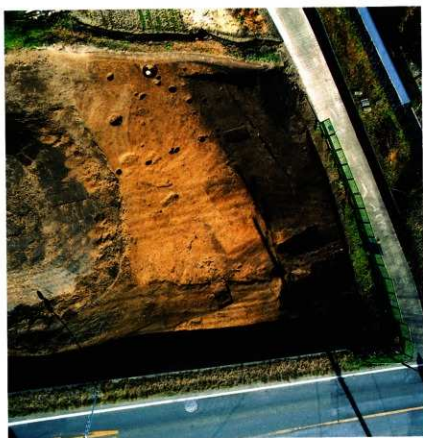
1次調査区3区 発掘状況(真上より)