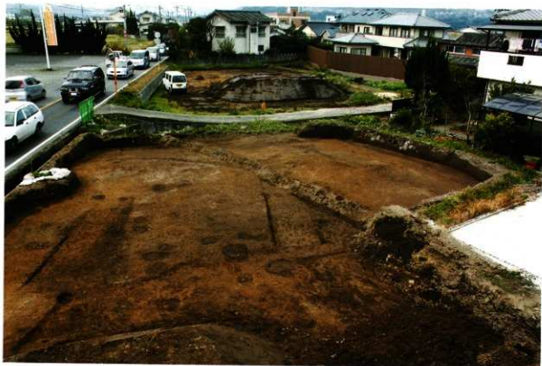
1次調査区2区 遺構検出状況(東より)