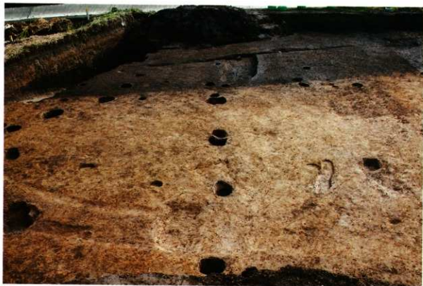
1次調査区SA2038完掘状況(西より)