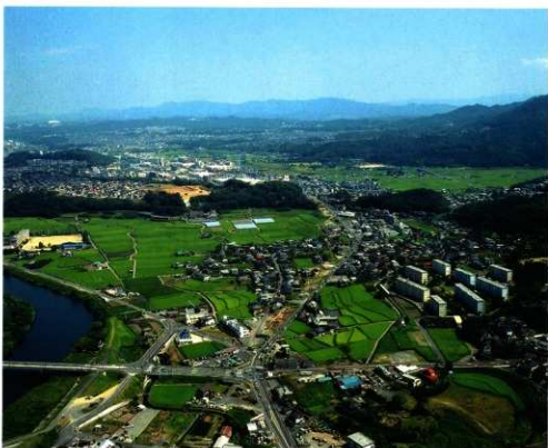
2次調査区空中写真(西から)