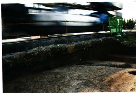
1次調査区2区 南壁土層 (北より)