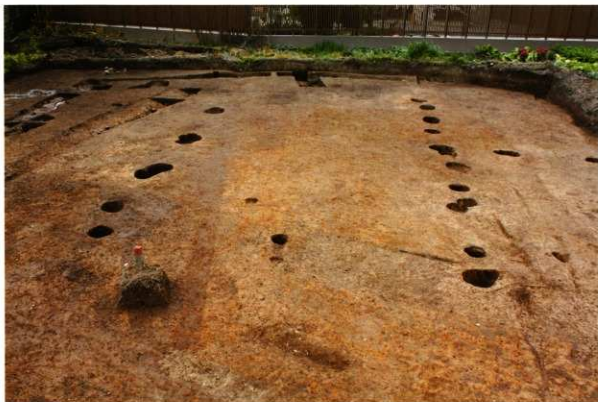
1次調査区SB2036・SB2037・SA2039完掘状況(南より)