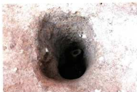
1次調査区SP1002柱出土状況