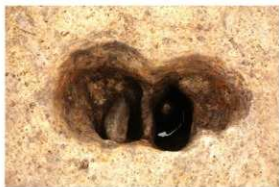
1次調査区SP2014・2015柱出土状況