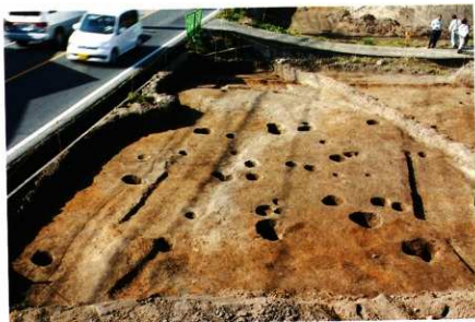
1次調査区 SB2036-SB2037 完掘状況(東より)