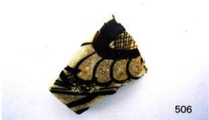
磁州窯系陶器鉄絵壺