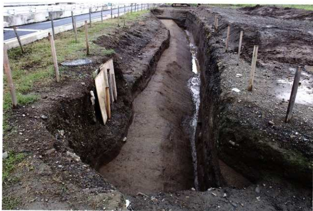
SD016 完掘状況 (北から)