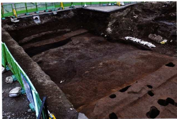
SX029 完掘状況 (北西から)