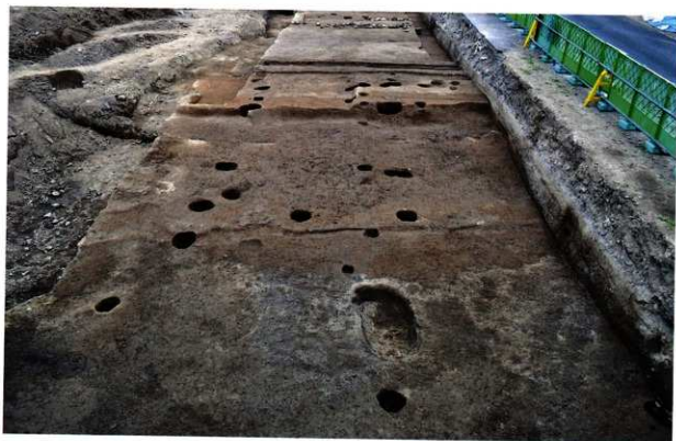
第1面の遺構群全景 (東から)

16世紀後葉～17世紀初頭・第2南北街路は幅員6m強まで縮小し、街路東側には柱穴列や廃棄土坑が展開する。