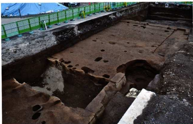
初期の南北街路 SF069 完掘状況 (南西から)