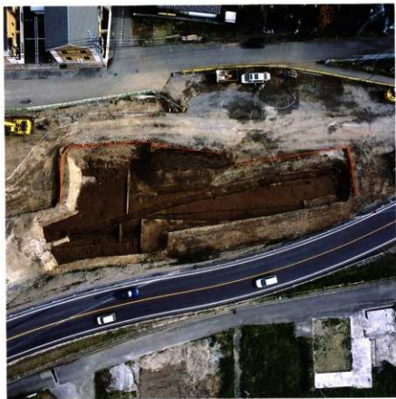
第92次調査区 第2南北街路遠景 (第2面：垂直)