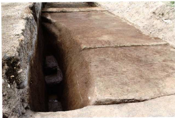
SD005 完掘状況 (南から)