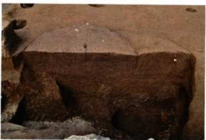
SK075・SE076 断ち割り時の土層断面