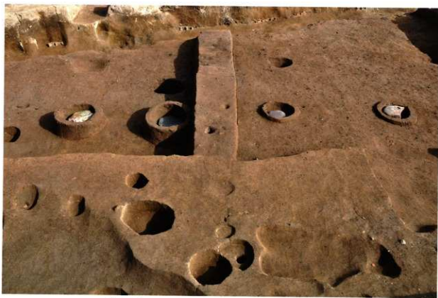
礎石列 (SP337・SP328・SP340・SP341) (西から)