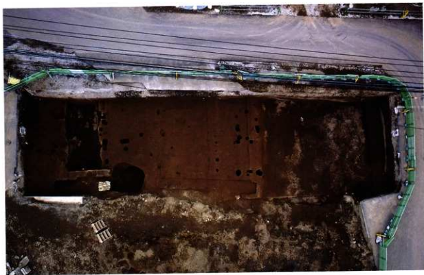
第2面の遺構群 (16世紀中葉以前)

画面右(西)の柱穴群は上空から見ると掘立柱建物跡のように見えるが、柱穴個々の形状や埋土の状況が異なる。