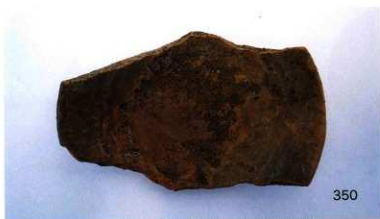
ロク口目土師器皿(内面に筆ならしの墨跡あり)