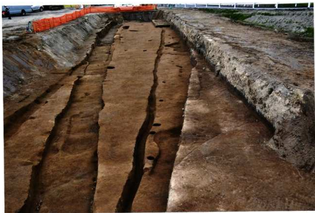
SD380・SD383・柱穴列 (北から)