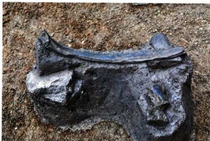
SX029 遺物出土状況 (肋骨など)