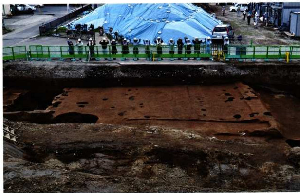
初期の南北街路 SF069 完掘状況 (南西から)

想定される最大の街路幅員は約 15m。発掘作業員 15 名が並んだ幅とほぼ同じである。