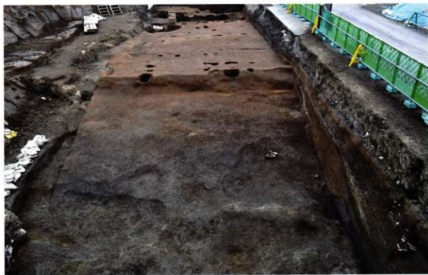
第2面の遺構群全景（東から）

16世紀中葉以前・・・西側に堀、東側に落ち込み遺構がある。幅員13mを測る初期の南北街路も検出された。