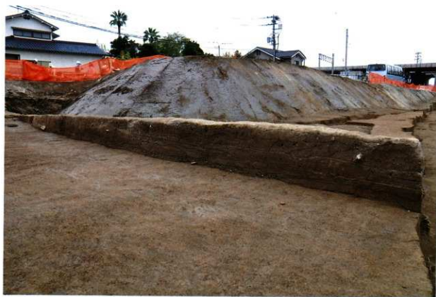
e - e'土層壁 (北から)