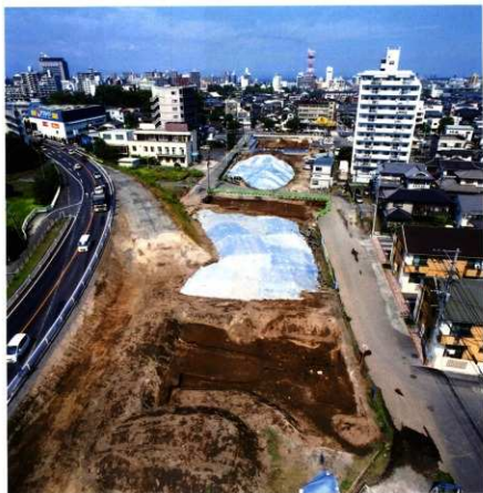
第92次調査区東側 町屋跡透景 (第1面：南から)