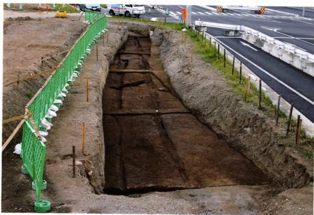
街路側溝 (SD001・SD003・SD004・SD013) 完掘状況 (南から)