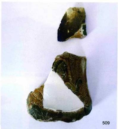
華南三彩鶴形水注