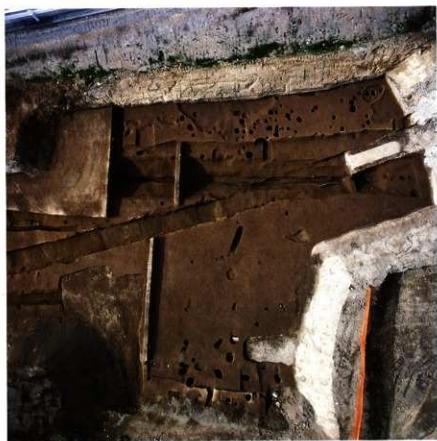
第92次調査区 第2南北街路北側遠景 (第2面：垂直)