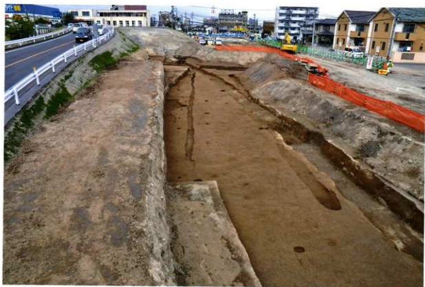
第2南北街路第2面南側 (南から)