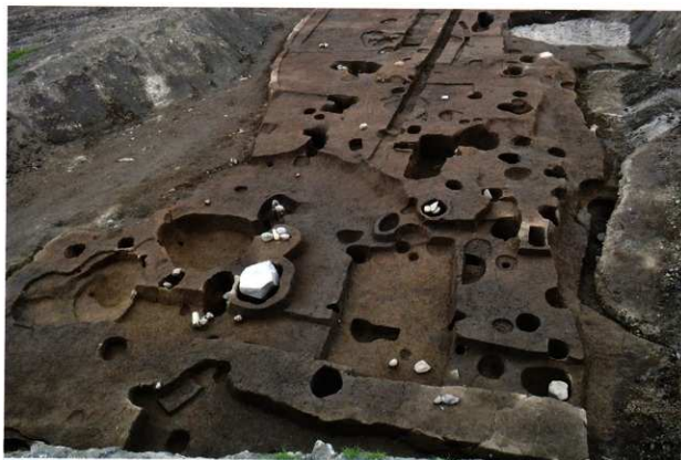
町屋跡 (第1面：東から)