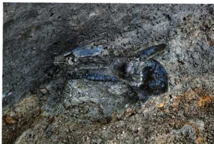
SX029 遺物出土状況 (下顎骨)