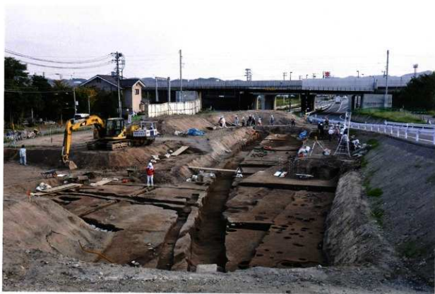
第2南北街路掘削状況 (第1面：北西から)