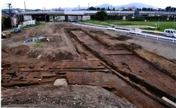
第2南北街路検出状況 (第1面：北東から)