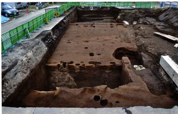
第2面の遺構群全景（西から）