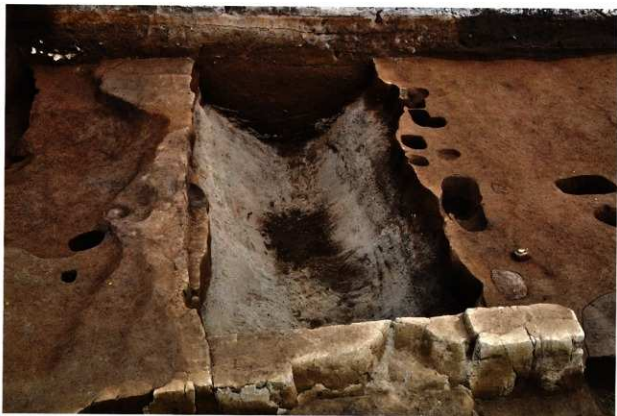
SD067 完掘状況 (北から)