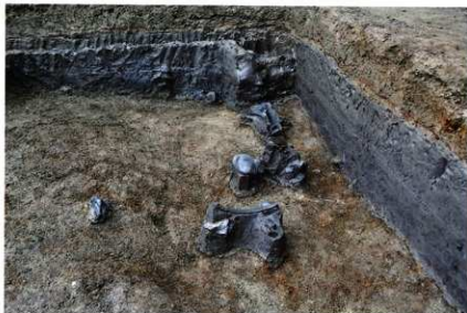
SX029 遺物出土状況 (南から)