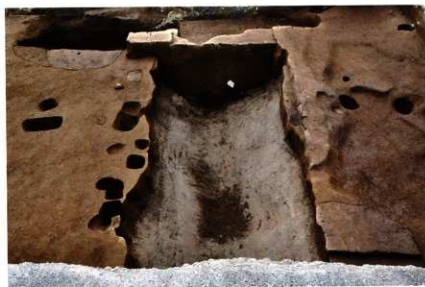
SD067 完掘状況 (南から)