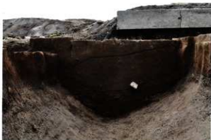
SK075・SE076 検出時の土層断面