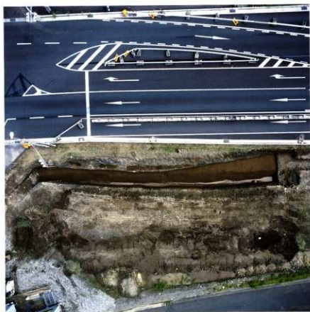
第93次調査区全景 (垂直)