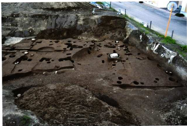
町屋跡 (第2面：南から)