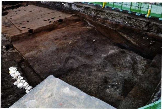
SX029 完掘状況 (南東から)