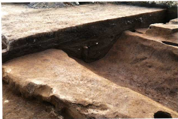
c - c'土層壁 (北から)