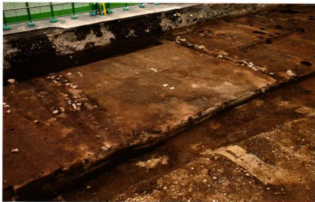
第2南北街路 SF012 検出状況 (南西から)