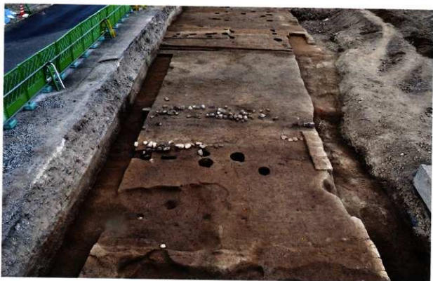
第1面の遺構群全景 (西から)