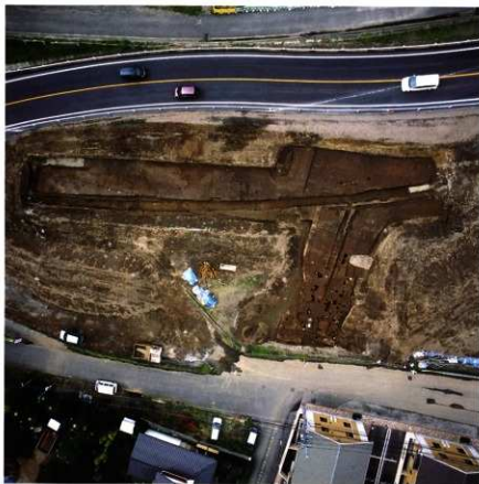
第92次調査区遠景 (第1面：垂直)