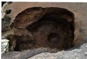
SK075・SE076 完掘状況 (南から)