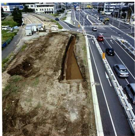
第93次調査区遠景 (南から)