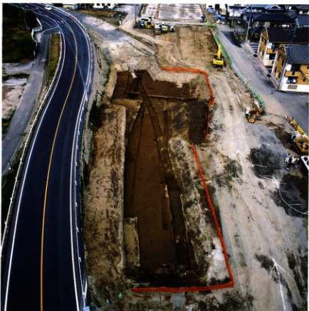
第92次調査区 第2北街路遠景 (第2面：南から)