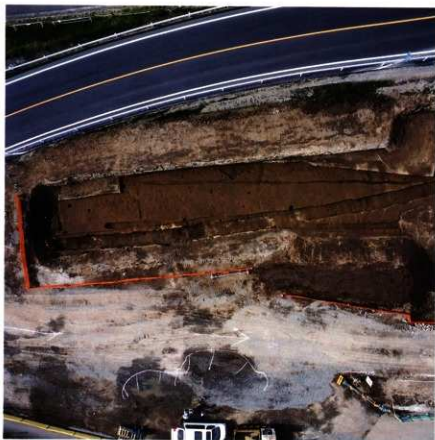
第92次調査区 第2南北街路南側遺景 (第2面：垂直)