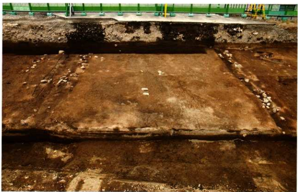
第2南北街路 SF012 検出状況 (南から)