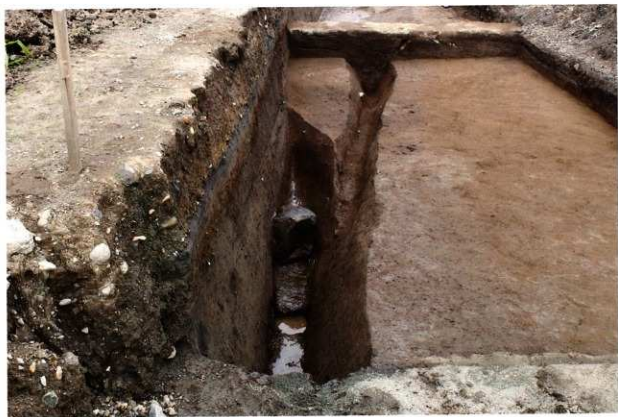
SD017 完掘状況 (南から)