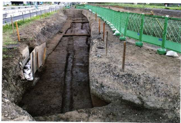
街路側溝 (SD001・SD003・SD004・SD013) 完掘状況 (北から)