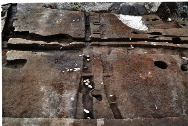
SD216・SD217・SD308・SD309 (第1面:南から)