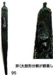
笄(太鼓形分銅が錆着している)