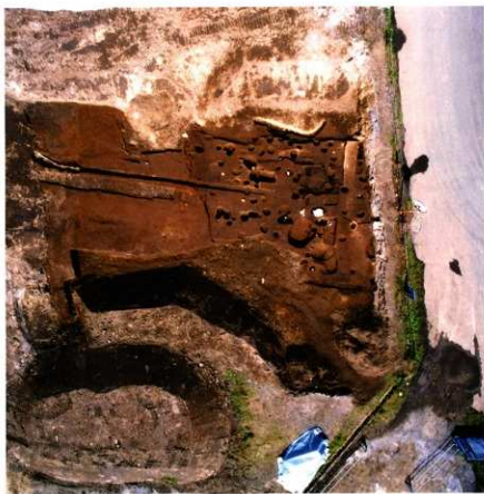
第92次調査区東側 町屋跡透景 (第1面：垂直)