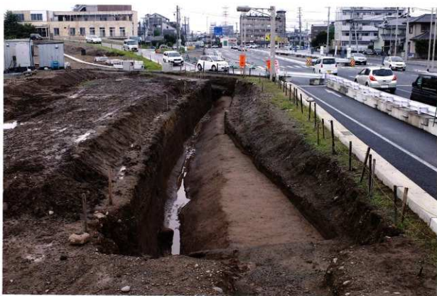
SD016 完掘状況 (南から)