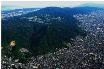
飯盛城跡遠景(俯瞰)