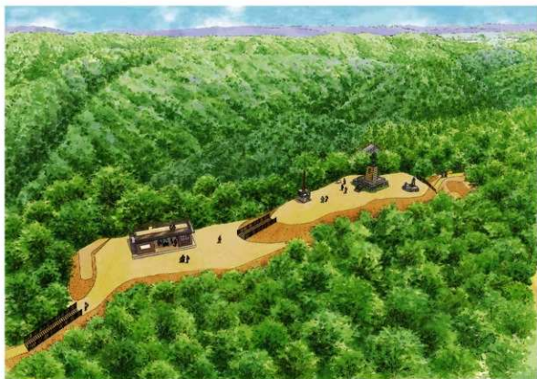
1 郭・2 郭の将来的な整備イメージ

飯盛城跡の本質的価値の保全・次世代への継承 中世城郭の調査・研究を推進する場 地域の歴史的ランドマークとして顕在化、観光振興・地域振興への寄与