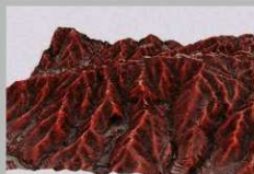
赤色立体地図の三次元画像(西から)

北エリアでは主尾根に築かれた各曲輪は面積が狭く、曲輪間の高低差が大きいうえ、主尾根から東西に派生する尾根上に曲輪群が展開していることから防衛空間であったと考えられます。一方、南エリアのV郭(千疊敷郭)などでは広い曲輪が築かれていることから居住空間として機能したと考えられます。