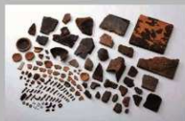
V郭(御体塚郭)出土遺物

V郭(御体塚郭)からは瓦が出土しています。このことから、建物の屋根の一部に瓦が葺かれていたことが明らかになりました。