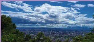
展望台からの眺望