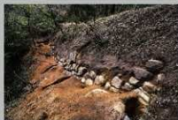
V郭(千疊敷郭)の石垣

石垣は自然石を積んだ野面積みです。登城道が想定される東斜面や虎口に石垣が多く築かれていることから、城主の威光を示す役割を担っていたと考えられます。