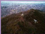
飯盛城跡近景(南から)

* 河内平野（大阪平野の東部）は、かつて河内海、河内潟、河内湖と変遷し、飯盛城跡が機能していた当時は河内湖の名残である深野池や新開池等がありました。「河内内海最奥」という言葉は、飯盛城跡が眼下に池沼の残る河内平野を一望できる立地であることを示しています。