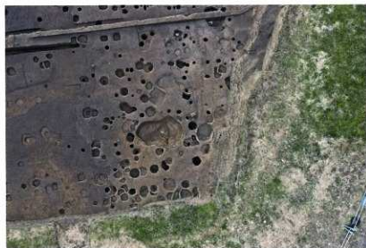
B区 北西部 空中写真