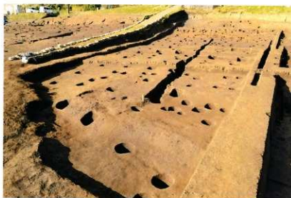
B区 完掘状況(東から)