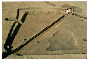
SH09 と SH10