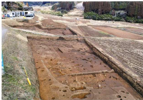
E区 完掘状況 (南から)