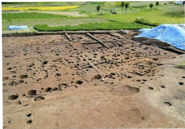
C区 完掘状況(西から)