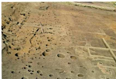
C区 発掘状況(南から)