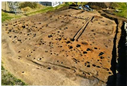
B区 完掘状況(西から)