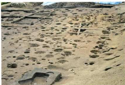
C区 発掘状況(北から)