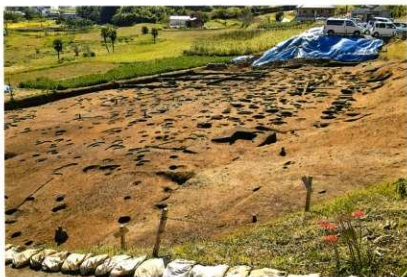
C区 発掘状況(北から)