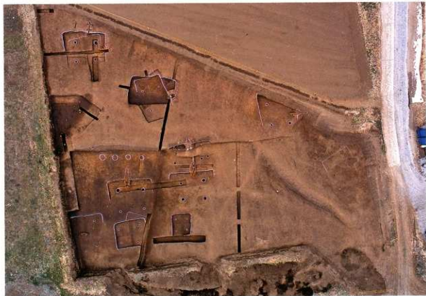
A区 空中写真(上方が西)