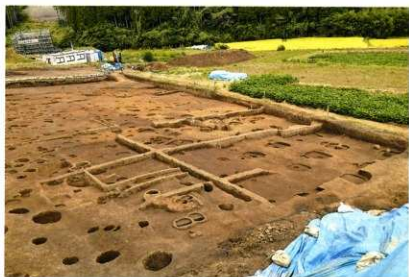
C区 南部 (SH21, SH22)