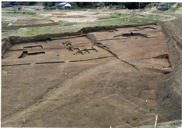
A区 完掘状況(南から)