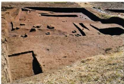
D区 完掘状況(西から)