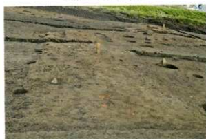
B区 焼土面の広がり