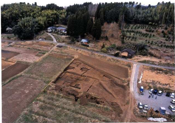
A区 空中写真(北東から)