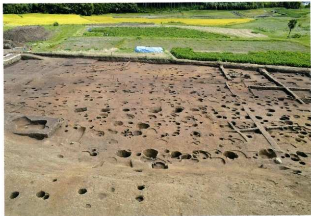
C区 完掘状況(西から)