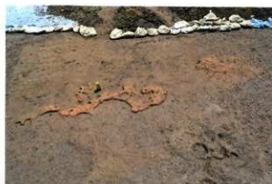
B区 焼土面の広がり