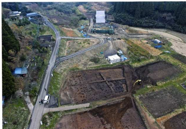
B区 空中写真(南から)