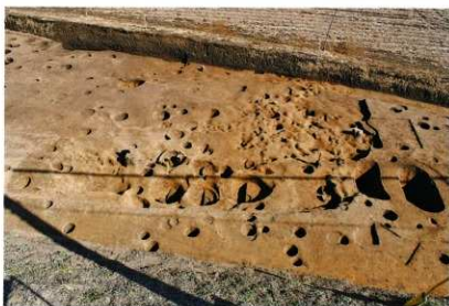
SA05(中央) と SK15, SK16(右側)