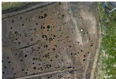
B区 南西部 空中写真