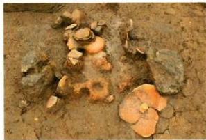
SH01 竈 遺物出土状況