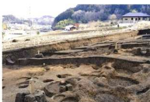
SH24 付近 土層断面