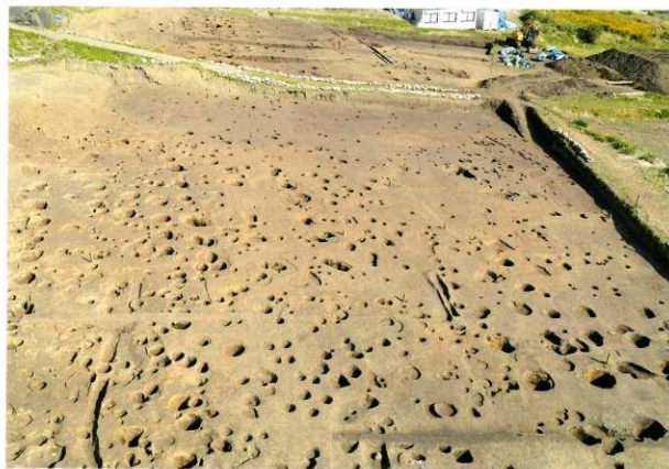
C区 完掘状況(南から)