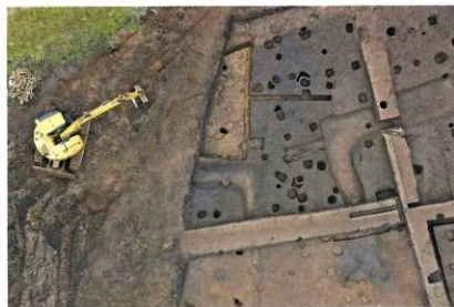
B区 南東部 空中写真