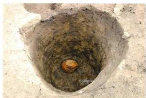
SB27 柱穴 遺物出土状況