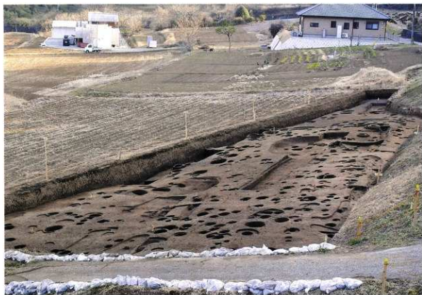
E区 完掘状況 (北から)