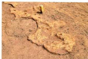
B区 焼土面の広がり