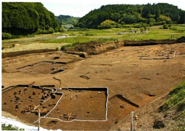
A区 完掘状況(北から)