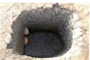
SB13 柱穴 遺物出土状況