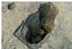
SB25 と SB26