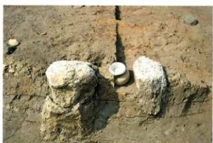
SH06 竈 遺物出土状況