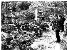
調査委員会現地調査風景 (大分市大友頼桑墓)

また、昨年度に引き続き、調査成果を刊行したが、今年度はこれまでの悉皆調査の成果を分布図・地名表に纏め、3 分冊の内、2 冊目「分布図・地名表編(中)」を上梓した。