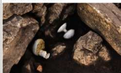
石室内から出土した須恵器と鉄鏡