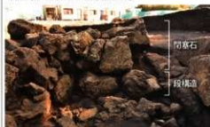
石室入口部の段構造と閉塞石