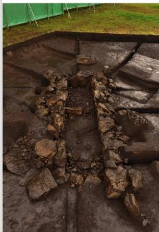
石切平第2号墳の横穴式石室