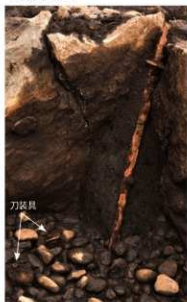
奥壁隅の大刀と床面に落ちた刀装具