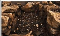
河原石を用いた床面の石敷