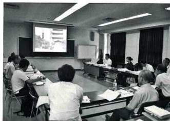
古代・中世石造遺物分布調査委員会

平成26年度までの悉皆調査成果を踏まえ、平成28年度は前年度に引き続き中世石造物の実測調査を行った。実測対象は各地域を代表する主要なものや特徴的なものを抽出して実施した。本年度実測図を作成した石造物は第12表に示すとおりである。また、調査内容について専門家の指導を受けるため、平成28年9月2日に調査委員会を開催し、今年度の調査概要の報告と調査報告書総括編に関する協議検討、調査終了後の石造物の保護方針についての意見交換を行った。平成29年3月31日には石造物の実測図や地域ごとの概要、特論として調査委員の調査テーマをまとめた報告書『大分の中世石造遺物』第5集(総括編)を刊行し、事業を完了した。