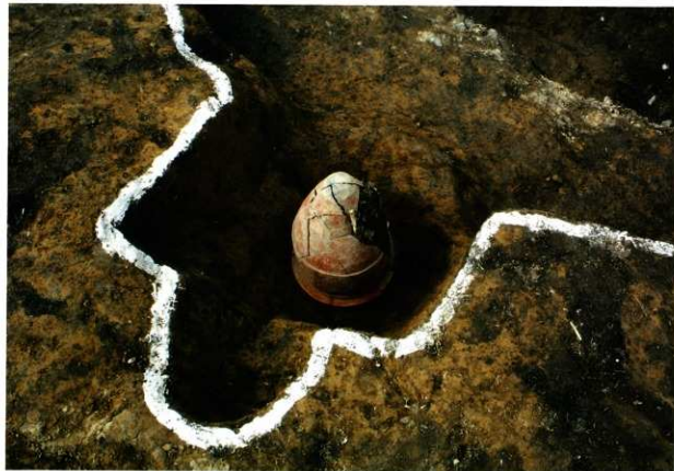
S K 223