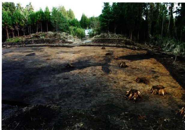
S D17・18検出状況（第6次調査）