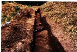
第9次調査4区遺物出土状況