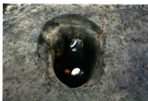
S K 221