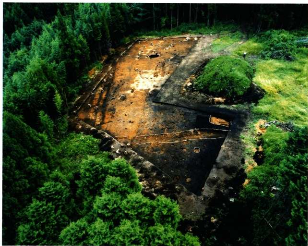
第8次調査2区空中写真