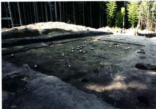
第8次調査2区旧石器調査区1