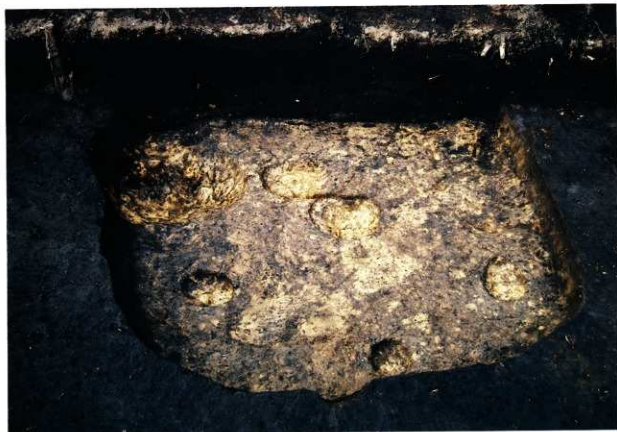
SH46完掘状況 (第6次調査)