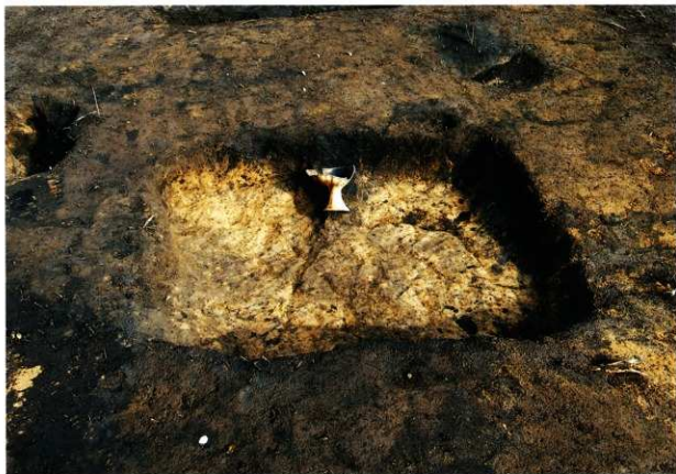
S K 209