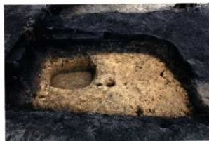
SH46貼床除去状況 (第8次調査)