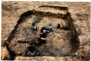
S H53床面遺物出土状況