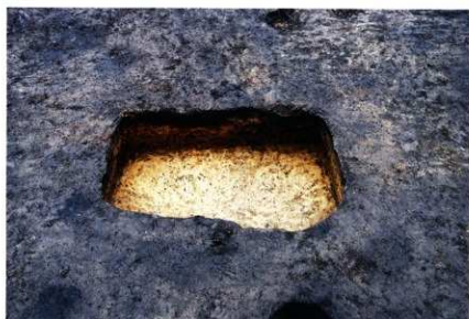
S K 207