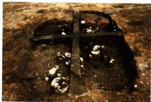
S H53上部遺物出土状況