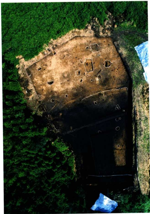
第8次調査1区垂直写真