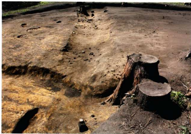
SD15・16 (第8次調査2区 北から)