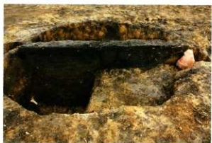
S K 222・223土層