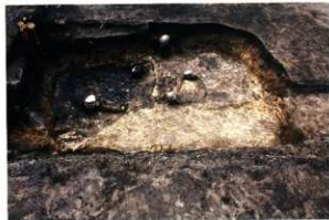
SH46出土状況 (第8次調査)