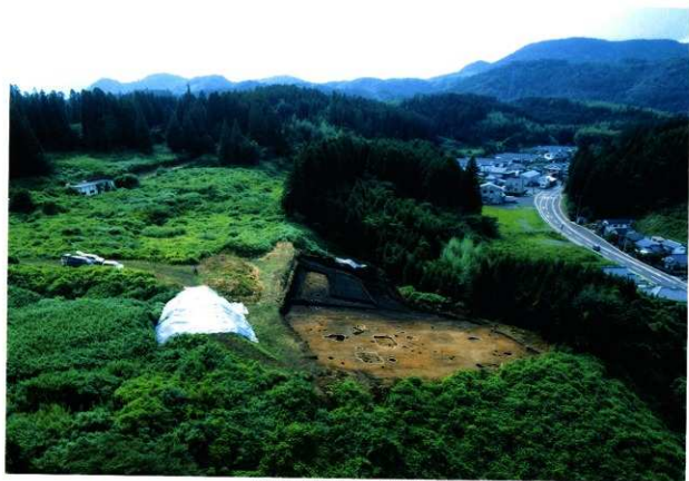
第8次調査1区全景（東から）