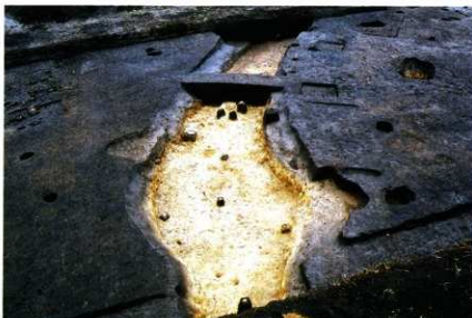
SD17 (第9次調査 西から)