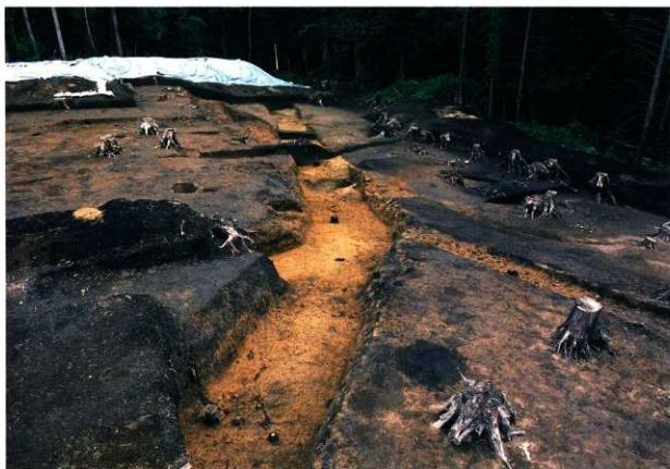
SD18 (第9次調査 西から)