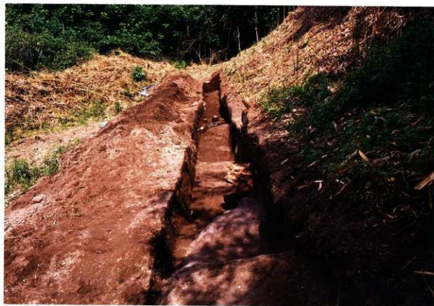
第9次調査4区 (横穴墓確認トレンチ)