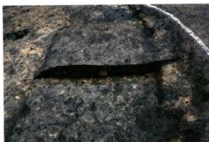
S H48土壇状遺構断面状況