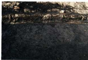
S H46検出状況 (第6次調査)