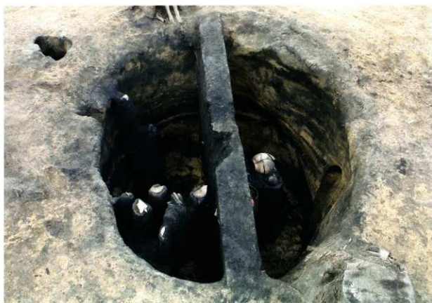
S K 210