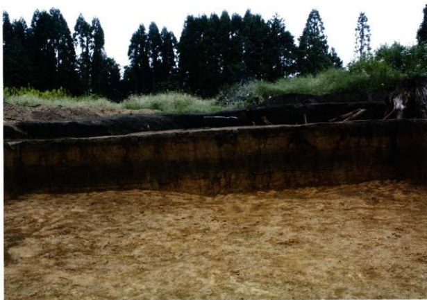
第8次調査2区旧石器調査区2土層