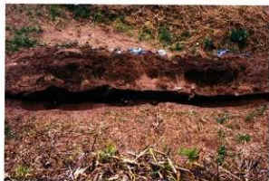
第9次調査4区トレンチ