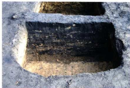
S K 207土層