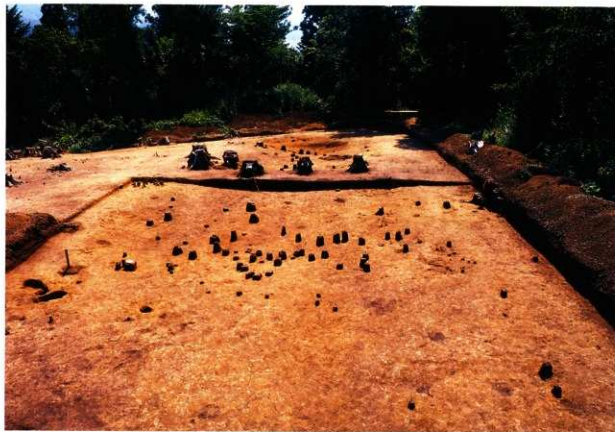
S X 8遺物出土状況