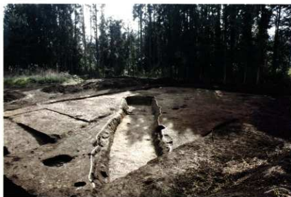
SD17 (第7次調査 西から)