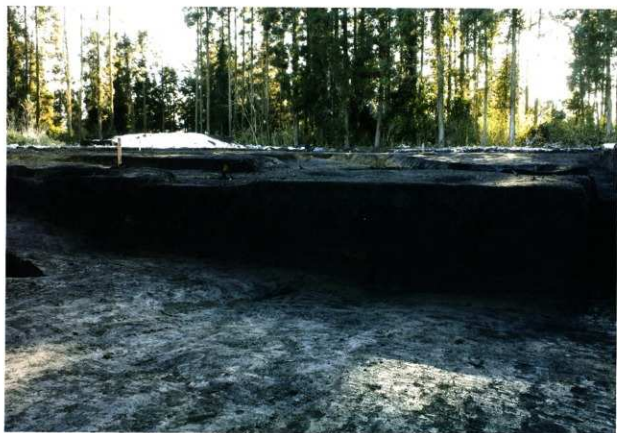
第7次調査下層遺構確認調査区土層