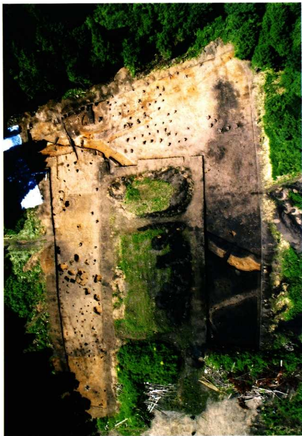
第9次調査空中写真