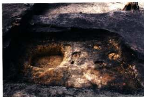
SH46床面完細状況 (第8次調査)