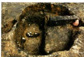
S K 222