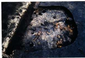
SH46出土状況 (第6次調査)