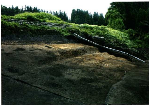
第8次調査1区西半部