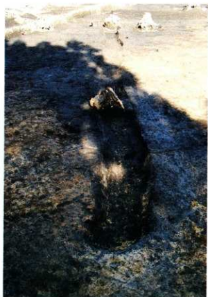
SD15 (第6次調査 南から)