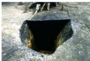
S K202 (陥穴) 土層