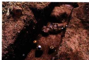
第9次調査4区遺物出土状況