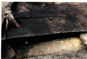
S H46検出状況 (第8次調査2区)