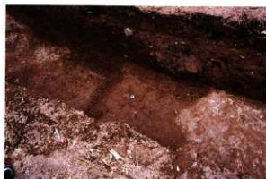
第9次調査4区紡錘車出土状況