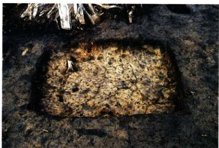
S K 208