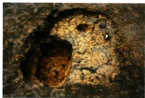
S K 220