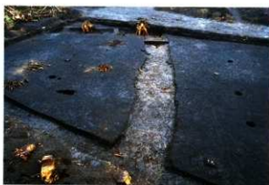
SD16 (第9次調査 西から)