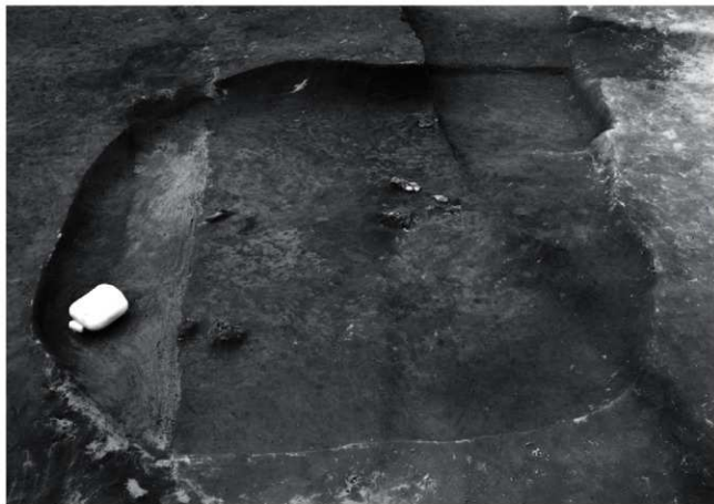
(1) I区 第二面 土坑1 遺物出土状況 (北東から)