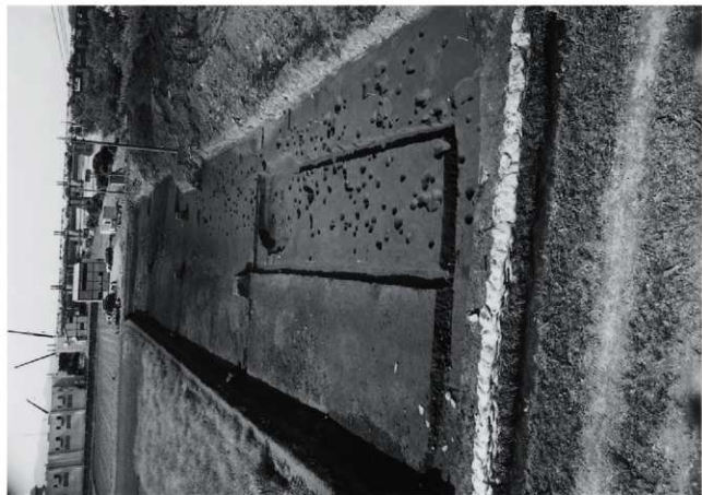
(1) II区 全景 (観台心)