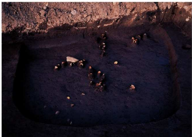
(2) II区 2号住居跡遺物出土状況 (南西から)