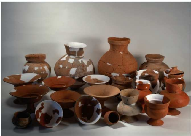
(1) II区 1号住居跡出土遺物