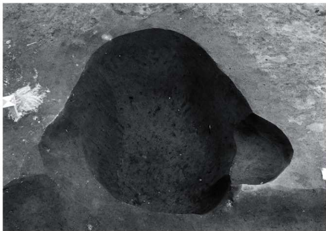
(2) I区 第二面 土坑2完掘状況(北から)