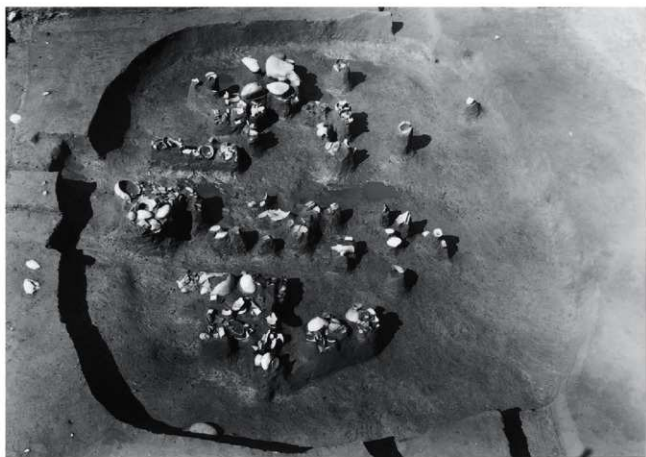
(1) II区 1号住居跡遺物出土状況(南東から)