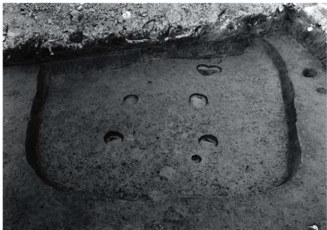
(2) II区 2号住居跡完掘状況(南西から)