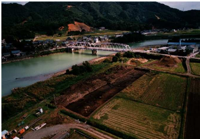
(1) II区 全景 (南西から)