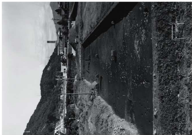
(2) II区 全景 (観台心)