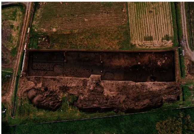
(2) II区 全景 (北から)