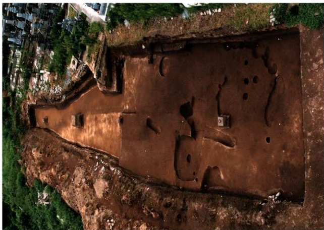
(2) I区 第二面 全貌 (北西から)