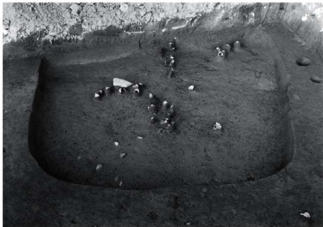
(1) II区 2号住居跡遺物出土状況(南西から)