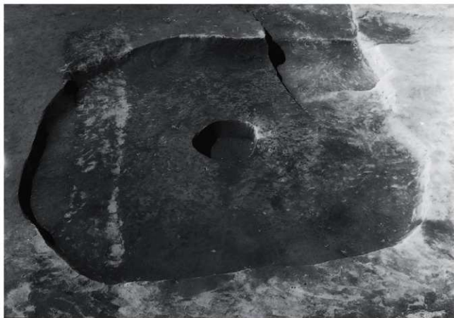
(2) I区 第二面 土坑1 完掘状況 (北東から)