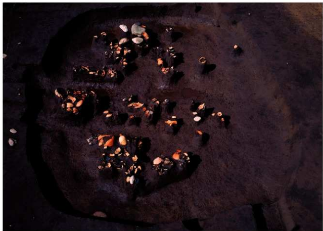
(1) II区 1号住居跡遺物出土状況 (南東から)