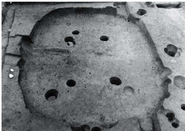
(2) II区 1号住居跡完掘状況(南東から)