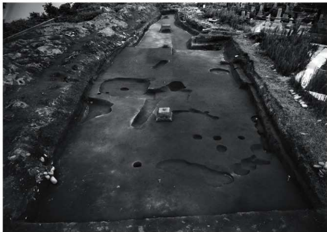
(1) I区 第二面 全景(北西から)