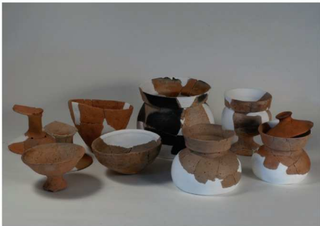
(2) II区 2号住居跡出土遺物