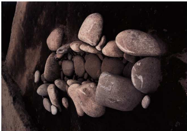
(1) I区 第一面 石垣遺構実状状況 (南西から)