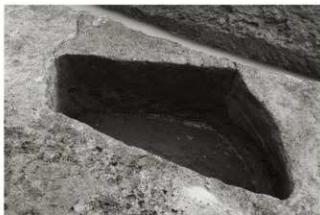
(4) SE 4 断面 (北西から)