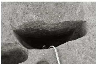
(1) SE 1 断面 (南から)