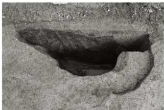
(3) SE 3 断面 (西から)