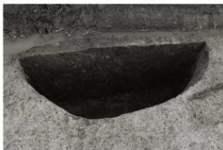
(2) SE 2 断面 (北から)