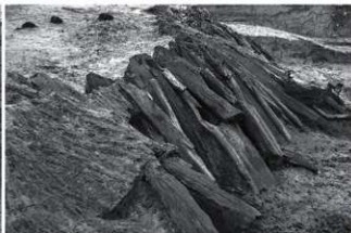
(4) SR4 杭列検出状況 (東から)