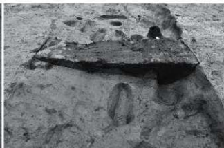
(4) SX1 断面B (南から)