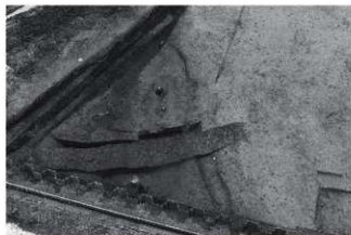
(1) SR3 (北西から)