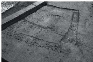
(3) SX1 (北西から)