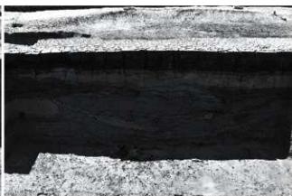
(8) SR2 断面B南半 (西から)