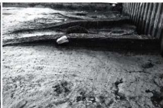
(6) SR1 (西から)