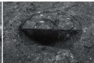
(8) SI2-SP58断面 (北東から)