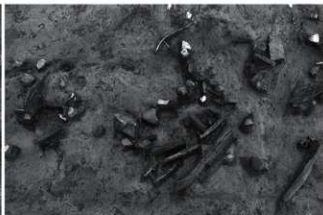
(4) SD1 遺物出土状況 (俯瞰)