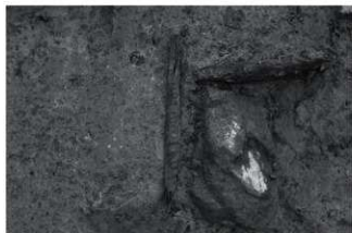
(5) SD1 木桶出土状況