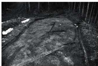
(7) V区全景 (北から)