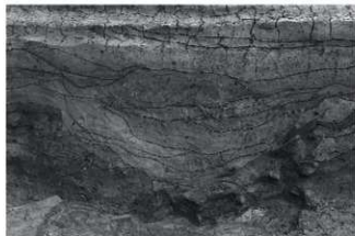
(3) SR4 断面 (西から)