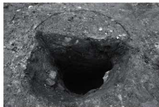
(7) SI2-SP54断面 (東から)