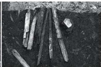
(6) IV区木製品出土状況 (北から)