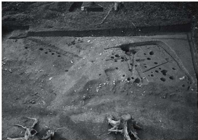
(2) SI1・2 (北から)