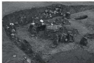
(1) SI1 遺物出土状況 (南東から)