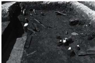
(3) IV ESR1 遺物出土状況 (南から)