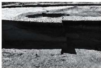
(7) SR2 断面B北半 (西から)