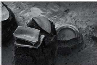
(2) SD1 須恵器出土状況 (北東から)