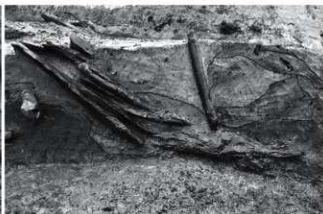
(6) SR4 護岸遺構断面B北半 (東から)