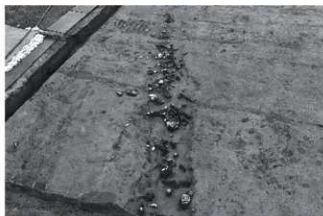
(5) SD1 北半 (南から)