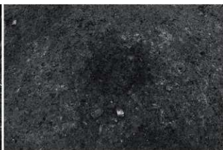
(8) V区ESR1 出土状況 (東から)