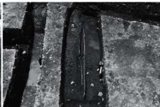
(4) IV ESR1 木桶出土状況 (北から)