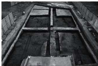
(1) IV区下段部全景 (北から)