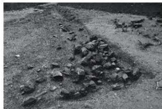
(5) SI2 集石検出状況 (北から)