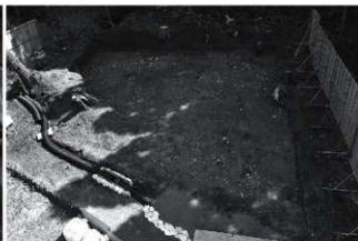
(2) IV区上段部全景 (北から)