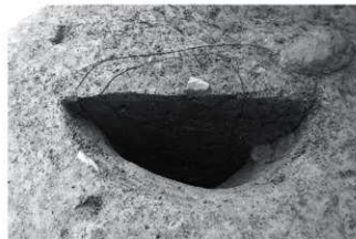
(3) SI1-SP2 断面 (北西から)