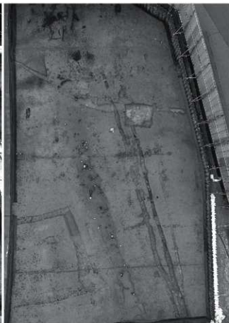
(2) 調査区南半全景 (俯瞰)