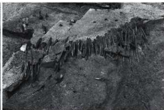
(2) SR4 護岸遺構検出状況 (北東から)