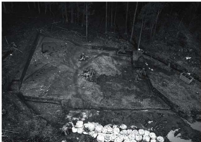
(1) 調査区全景 (東から)