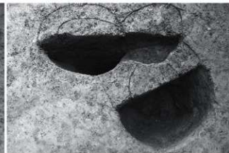
(4) SI1-SP11-13断面 (南西から)