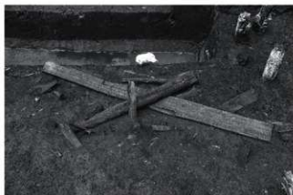
(5) IV ESR1 木製部材出土状況 (西から)