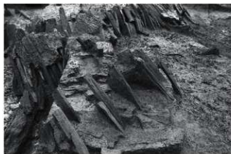
(7) SR4 内側杭列 (東から)