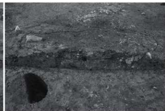
(2) SI1 炉断面 (東から)