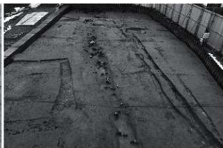
(6) SD1 南半 (北から)