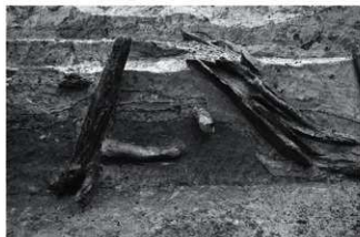
(5) SR4 護岸遺構断面B南半 (東から)