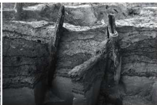
(8) SR4 護岸遺構断面E (南から)