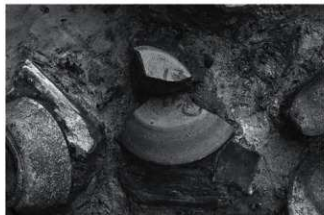
(3) SD1 須恵器出土状況 (北から)