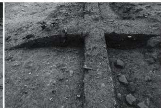
(6) SI2 断面B (北西から)