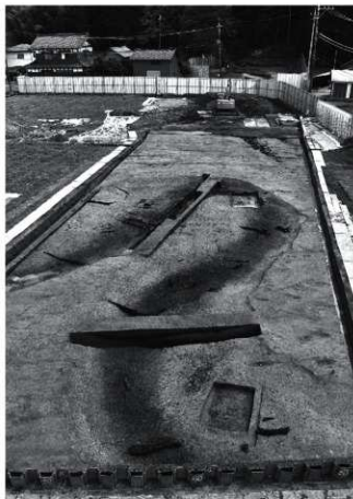
(1) 調査区北半全景 (北から)