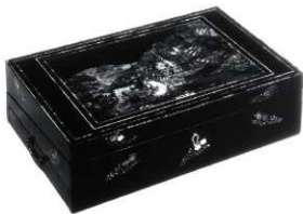
図6 青貝細工異国教会図文箱 金蒔絵によって表現しているが、平板化している。

されている。画面中央には、三角錐形の尖塔をもち、入口付近にアーチ状の装飾がある教会が配される。この教会を中心として、前景(画面左側)の野道には馬車や馬に乗って行き来する人々、後景(画面右側)には山々を確認できる。画面上部の空は、微塵貝を散らした装飾で、青貝細工とは対照的に黒漆地の色味を活かした表現となっている。また、画面右側には赤銅粉を蒔いて表された小川がみえる。伏彩色に着目すると、貝片の裏面から彩色は施されておらず、墨線のみが引かれている。教会や画面左の松の木には、クロスハッチングのように線描を連ねて、陰影表現が描出されていることがわかる。馬や三人で語らう人物の衣装をみると、一部墨で塗りつぶしたような箇所も見受けられ、「青貝細工ヴィーナスとアモール図煙草入れ」とは、異なる表現を採っていることは明確である。