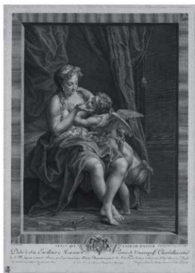
図2 VENUS QUI CARESSE L' AMOUR (アモールを愛撫するヴィーナス) ドイツ・ドレスデン版画素描美術館蔵

に銀箔を貼って漆器に定着させていく装飾技法をいう。貝片が持つ煌びやかさとともに、顔料による鮮やかな発色により、漆黒の中の金銀蒔絵による輝かしい装飾とは異なつた趣を持っているといえよう。なお、ヴィーナスとアモール図にみられるような、貝の裏面から墨で線を引いた作例も確認されている。貝の裏面から点描や線描を連ねることで陰影を付け、対象の立体感を描出しようとする職人の姿勢がうかがえるのである。一方で、後景のカーテンや床面には、金銀研出蒔絵の技法が採られている。こわこわとした布地には、蒔き量しを用いて巧みに表されているといつてよい。床には金蒔絵