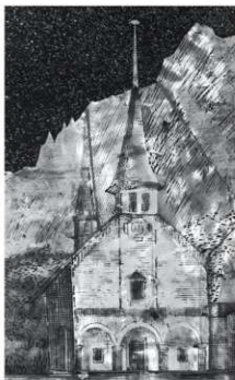
図9 教会部分 風見鶏の有無、尖塔の形状などに差異がみられる。

本図の原図として、一八二五年にフランス・パリで刊行された「スイスでの1ヶ月、あるいは旅人の記憶(原題「Un mois en Suisse ou souvenirs d'un voyageur」)」収録の「VUE DE LA CHAPELLE DE RILAY (リレイ教会の眺め)」を提示したい(図8 2) )。著者はサゼラック・ヒラール(Leon Hilaire Sazerac / 生没年不明)、挿絵はフランスの画家、石版画家として知られるエドゥアール・ピンクレ