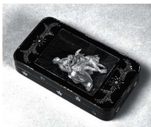
図1 青貝細工ヴィーナスにアモール図煙草入れ 神戸市立博物館蔵

次に、ヴィーナスにアモール図をみていくことにする。本図は天蓋付きのベッドで戯れるヴィーナスとアモールを表したもの。ヴィーナスの膝上には、番の鳩、矢に射られた心臓のようなものも添えら