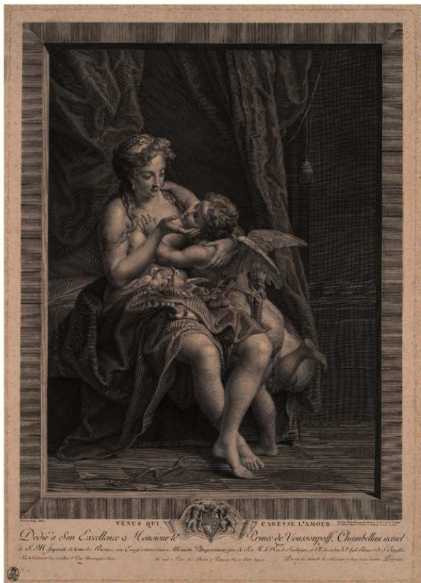
口絵1 VENUS QUI CARESSE L'AMOUR (アモールを愛撫するヴィーナス) ボルボラーティ・カルロ・アントニオ彫版 18世紀後半、ドイツ・ドレスデンで刊行 ドイツ・ドレスデン版画素描美術館蔵 Kupferstich-kabinett, Staatliche Kunstsammlungen Dresden, Photo:Andreas Diesend