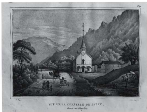
図8 「リレイ教会の眺め (VUE DE LA CHAPELLE DE RILAY)」 『スイスでの1ヶ月、あるいは旅人の記憶 (原題 "Un mois en Suisse ou souvenirs d'un voyageur")』スイス・ETH 図書館蔵