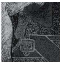
図4 ヴィーナスの顔貌 ヘアースタイル、耳飾りなどの細部に 差異が見られる。

簡略化がみられる点は否めない。加えて、ヴィーナスの髪飾り、イヤリングなどの省略も見受けられる。ヴィーナスの顔貌や胸部に設けられたハイライト部分は、点描が連ねられるのみで、上手く陰影表現を処理できているとは言いがたい。しかし、ヴィーナスの顔貌をみると、左頬付近には線描を連ねて陰影を描き出そうと試みている