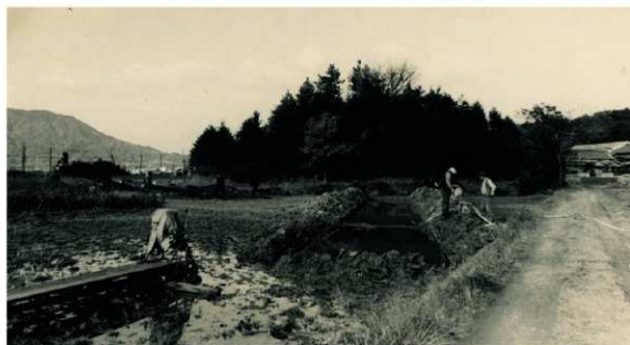
b. 第1次調査 1 トレンチ調査風景 (南から 1973年10月)