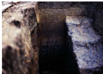
b. 同上 8トレンチ 周濠土層 (東から)