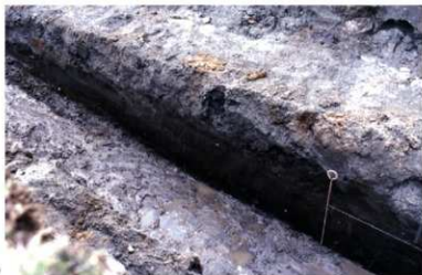
c. 同上 13トレンチ 周濠外縁土層 (南西から)