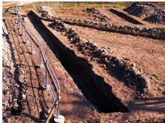
a. 第3次調査 11トレンチ (西から)