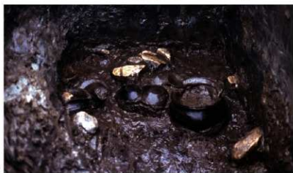
c. 同上 8トレンチ 外堤下土器溜り 遺物出土状況 (西から)