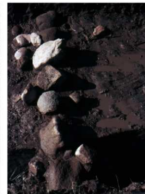
c. 同上 2トレンチ葺石検出状況 (東から)