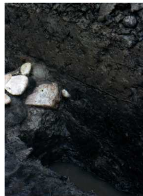
b. 同上 1トレンチ葺石掘土層断面 (南西から)