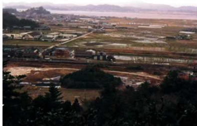
a. 宮地嶽から釜塚古墳を のぞむ (1978年10月)