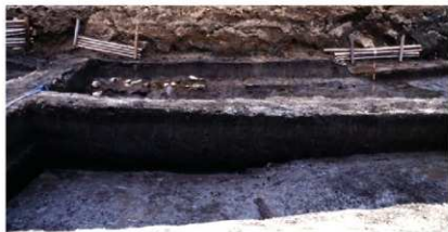
b. 同上 12トレンチ 渡り土堤東壁東土層 (北から)