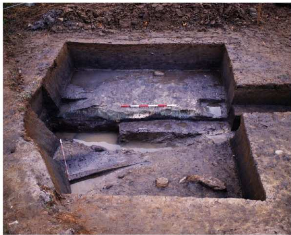
a. 第3次調査 8トレンチ東拡張区近景 (北から)