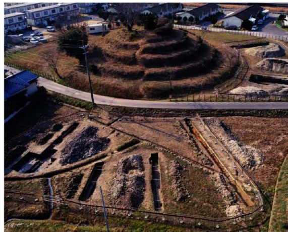
a. 第3次調査 8~11トレンチ (東から)