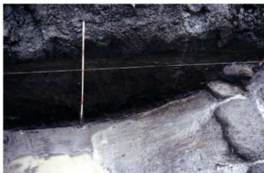
b. 同上 13トレンチ 墳丘裾土層 (西から)