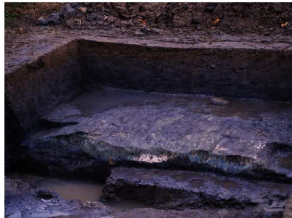
a. 第3次調査 8トレンチ外堤断面 (北から)