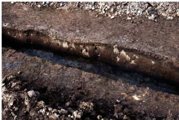
b. 同上 11トレンチ外堤断面 (北西から)