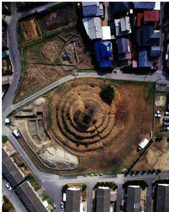
第3次調査 全景 (上から 写真上が東)