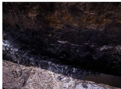
c. 同上 11トレンチ 周濠外縁土層 (北西から)