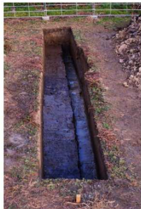
c. 同上 10トレンチ (西から)