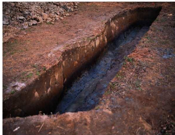
b. 同上 9トレンチ外堤断面 (南西から)