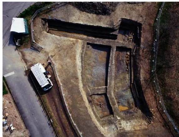
b. 同上 12トレンチ (上から 写真上が南東)