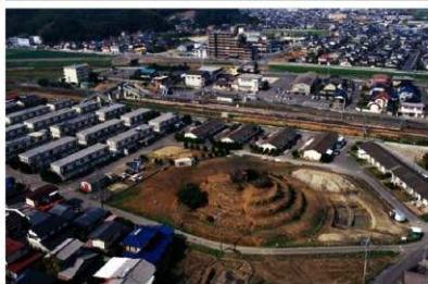
b. 宮地嶽上空から釜塚古 墳をのぞむ (2002年2月)