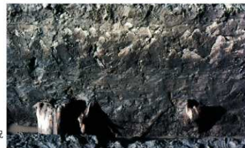
c. 同上 2 トレンチ丸木検出状況 (東から 1973年10月)