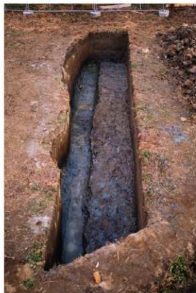
b. 同上 9トレンチ (西から)