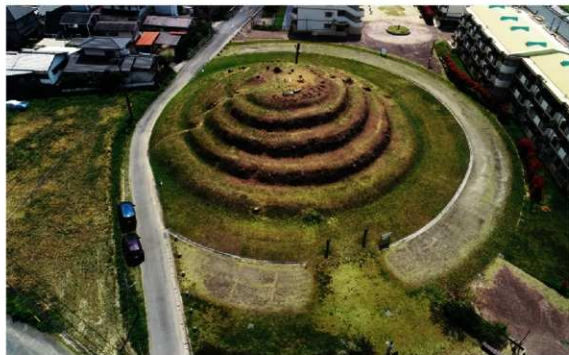
a. 釜塚古墳全景(北から 2019年4月)