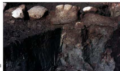
d. 同上 2トレンチ葺石掘土層断面 (南西から)