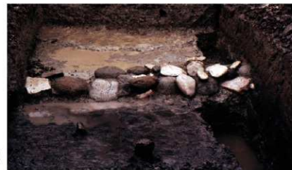
a. 第1次調査 1トレンチ葺石検出状況 (南から)