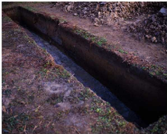
a. 第3次調査 10トレンチ外堤断面 (北西から)