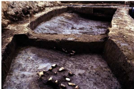
a. 第3次調査 12トレンチ渡り土堤南北縦断壁土層 (西から)