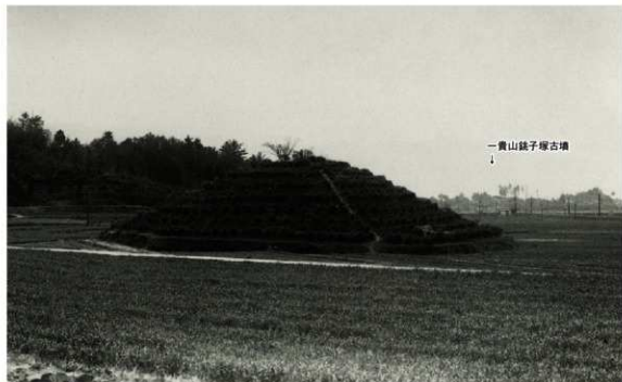
b. 釜塚古墳全景(北から 1950年)