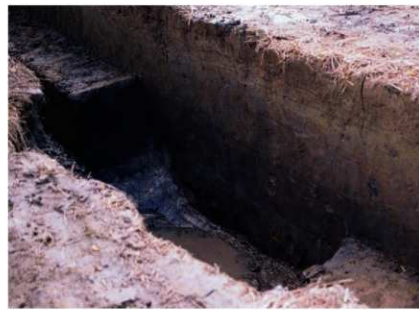
a. 第3次調査 8トレンチ 周濠外縁土層 (北西から)