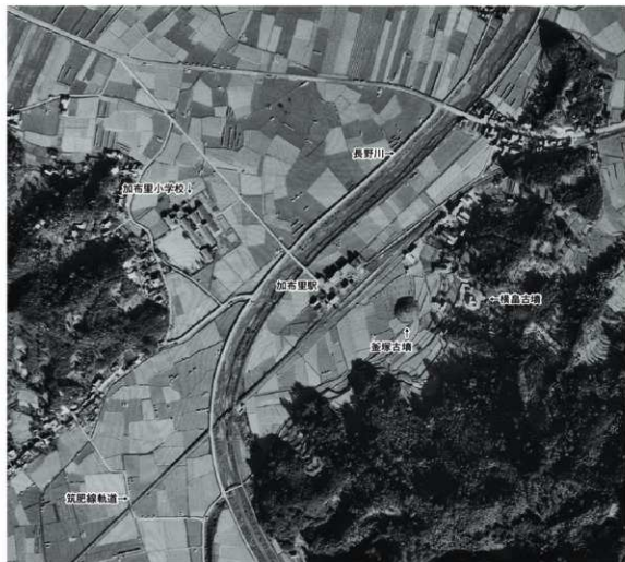
a. 釜塚古墳周辺の米軍撮影写真(上が北 1947年)