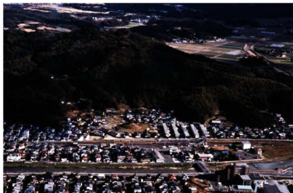
c. 長野川越しに西から釜塚古墳と宮地嶽をのぞむ(2002年2月)