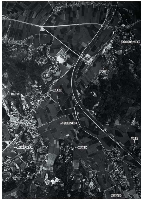
釜塚古墳周辺の航空写真(上が北 1961年)