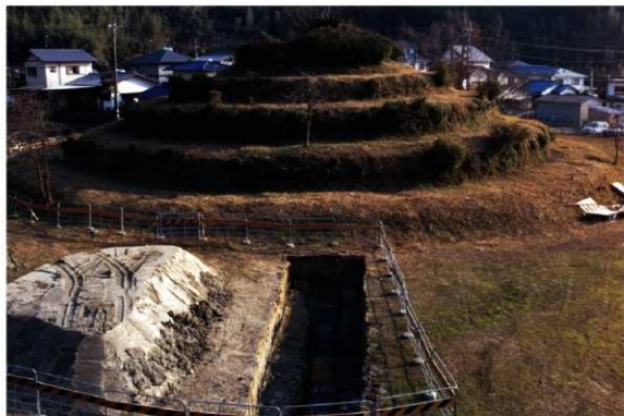
a. 第3次調査 13トレンチ (北から)