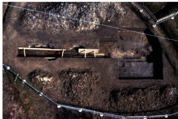
b. 同上 8トレンチ (上から 写真上が北)