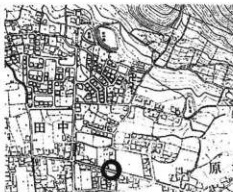
第1図 遺物採集位置図 (1:10,000)