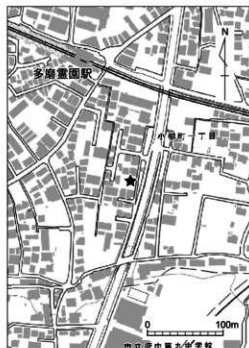
第1852-1図 調査地区位置図(1/5,000)

試掘トレンチ1(SD4を切る攪乱)から土師器の薄手の甕片1点が出土したが、小片のため図化に至らなかった。