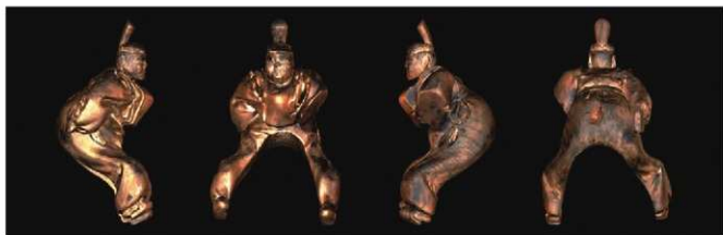
写真9 木造人物像の三次元スキャン画像 (photo 9) 3D-scanned image of wooden figure