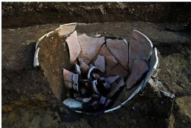
写真 16 発見された鎌倉時代の常滑焼の大甕 (photo 16) Discovered large Tokoname ware jug from Kamakura period