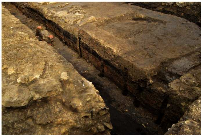
写真 11 小町大路側溝の側板（南から） 板上端が焼け焦げており、火災にあったことが分かります (photo 11) Side plates in the Komachi-Oji Street ditch (from the south). The upper edges of the plates are scorched, indicating that they were subject to a fire.