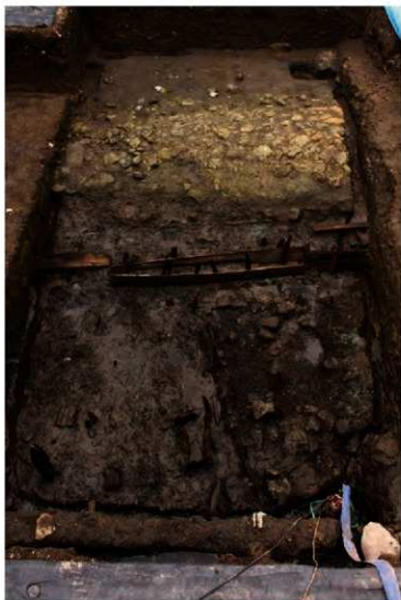
写真 14 鎌倉時代の路地と溝と建物 (photo 14) Alley, ditch and building in the Kamakura period