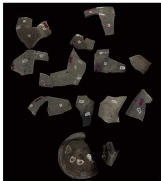
写真 19 同一個体と推定される破片 (photo 19) Fragments surmised to be from same unit