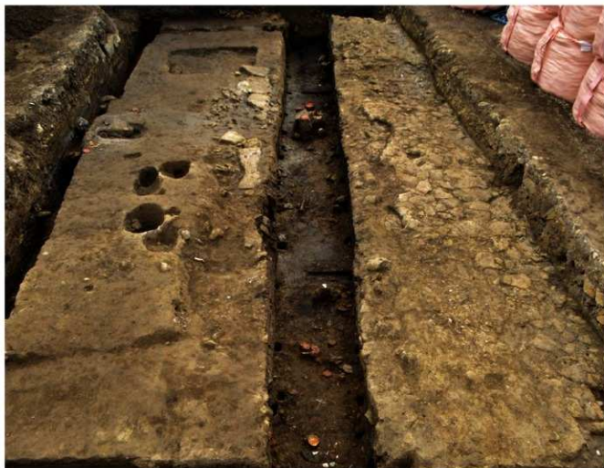
写真10 調査区全景写真(北から) 右側が小町大路、中央の溝が小町大路側溝

この遺跡で注目されるのは、平安時代末期以降から鎌倉時代にかけての、小町大路とその側溝が発見されたことです。鎌倉時代初期の小町大路は目立った舗装は見られず、往来によって硬化した路面が発見されました。その後も小町大路は方向を変えず、何層にもわたって、凝灰岩を突き固めた舗装で造られていました。東側には溝が掘り込まれており、これが小町大路の側溝と考えられます。側溝は断面形状が四角形で、幅約1m前後、深さ約75cmと、若宮大路の側溝と比べると小規模です。溝の両側面には横板が杭で留められていました。これも若宮大路の側溝とは異なる工法が採用されています。