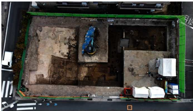
写真15 中世遺構の全景写真(上が東)

さらに弥生時代の甕と壺が入れ子状に重なった状態で出土しました。甕や壺の中からは骨などは出土しなかったため、どのような性格の遺構かわかりませんが、葬送やまじないに係る遺構であったのかもしれません。