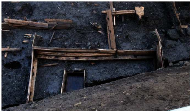
写真4 囲炉裏を有する建物 (photo 4) Building with an irori hearth

出土遺物は、銅細工や織物に関係する遺物が出土しています。特に銅製品は800年前のものとは思えないほど光り輝き、非常に良好な状態で出土しています。また木像人物像や漆蒔絵蓋などは、鎌倉でも数少ない稀有な出土遺物です。