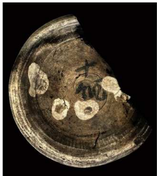
写真 18 出土した白磁壺の底部片 (photo 18) Piece of bottom of excavated hakuji white porcelain pot

「綱」が記された陶磁器の出土例は、平安時代末から鎌倉時代初期の博多に集中しており、宋の商人が博多で活動していたことばかりではなく、日本と宋の貿易が博多を中心に行われていたことを裏付けます。今回、博多と同種の資料が鎌倉で出土したことは、宋と博多との日宋貿易の延長線上に、鎌倉があったことの証拠といえます。宋から直接、鎌倉へ貿易船が入港した可能性も含め、宋～博多～鎌倉への貿易ルートを示す貴重な資料と言えます。