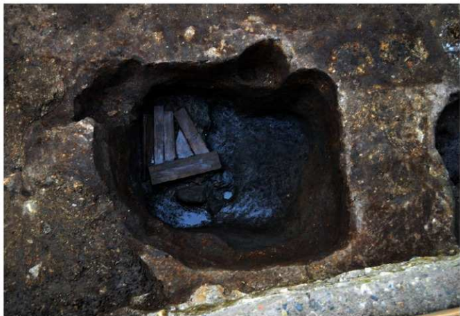
写真2 大型の柱穴の底に据えられた礎板と礎石（東から）

(photo 2) Base plates and foundation stones placed at the bottom of a large pillar hole (from the east)