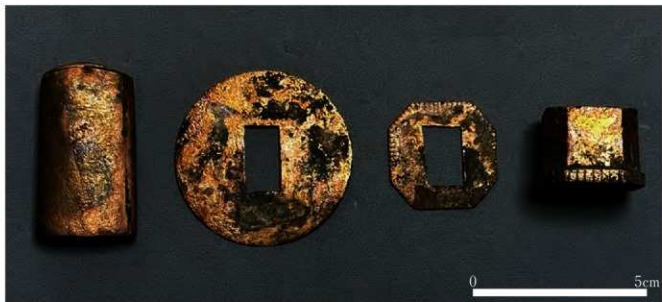
写真5 出土した銅製品

非常に良い状態で出土しました。他にも紡錘車や釘隠しとみられる銅金具等が出土しており、銅細工に関わった職人工房があったのかもしれない。