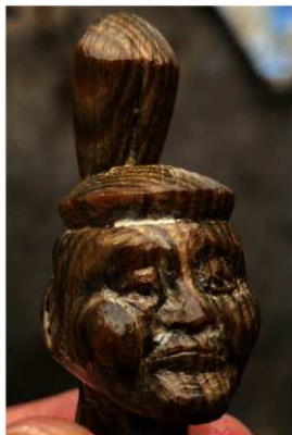
写真8 木造人物像頭部拡大 (photo 8) Magnification of head area of wooden figure