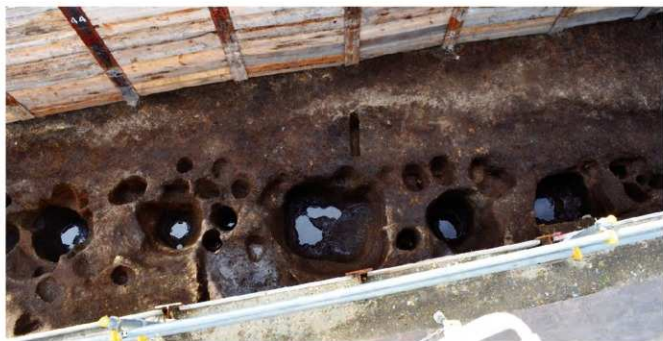
写真1 5穴の大型の柱穴(東から) (photo 1) Five large pillar holes (from the east)

現在の小学校校舎の東に位置する第5区とした調査区では、直線に並ぶ柱穴や直径1mを超える大型の柱穴と、道路と考えられる泥岩を突き固めた地面が発見されました。本調査区の位置は源氏三代が政務を執り行った御所—大倉幕府—の西端と推定されており、南北方向に直線に並ぶ柱穴は、御所の西側を囲む欄の痕跡の可能性があります。また、その欄と重複するように大型の柱穴が5穴発見されています。この5穴には、柱の沈下を防止する板や石が据えられており、相当の重量がかかる構造物の柱穴であったことが推定されます。欄との重複状況や、柱穴の規模や構造から、門の柱穴と推定され、現在の周辺の地名である「西御門」の由来となった御所の西門の遺構であった可能性があります。この欄や門の西側では、丁寧に突き固められた地面が見つかっており、これは御所の西側を南北に延びる道路と推定されます。古文書には、大倉御所の西側に「西大路」が通っていたと記されており、発見された道路遺構がそれにあたるのかもしれませんが、ただし、出土遺物をつぶさに観察すると、これらの遺構が埋まった年代は13世紀中頃と考えられるため、嘉暦元年(1225年)に御所が移転した後の施設であった可能性もあります。