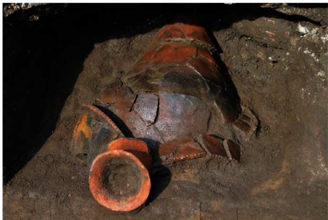
写真 17 発見された弥生時代の甕と壺 (photo 17) Discovered urns and pots from Yayoi period