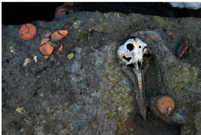
写真 12 出土したイルカの頭骨とかわらけ (photo 12) Excavated dolphin cranial bone and kawarake unglazed earthenware