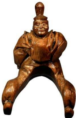
写真7 木造人物像 (photo 7) Wooden figure

顔の表現は緻密で、あたかもモデルがいたようにも思えます。モデルは、神仏か、依頼主か、当時の権力者か、はたまた想像で造られた表情なのか、疑問は尽きません。