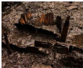
写真 13 発見された囲炉裏 (photo 13) Discovered irori hearth

周辺の調査地点でも規模の小さな道路遺構が見つかったので、鎌倉時代後半のこの辺りは路地によって区画が細かく分けられた地域だったようです。