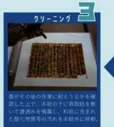
補修 紙繊維組成調査に基づく紙を選択し、染色加工を行うなど、補修紙を複製。小麦澱粉糊と布糊の混合糊を用いて欠失部に補修紙を挿入する。