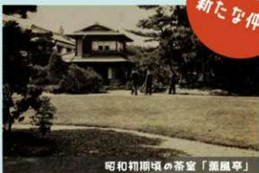
昭和初期頃の茶室「薫風亭」