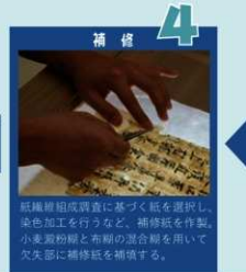
仕立て 修理前と同じ箇所に戻す元紙を取り付け、本紙を修理前と同様に綴いで付け、裏側に新調した包み紙を取り付け、完成!