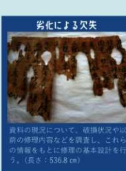
劣化による欠失 資料の現況について、破損状況や以前の修理内容などを調査し、これらの情報をもとに修理の基本設計を行う。(長さ:536.8 cm)

文化財の修理は、ぜい弱になった文化財を解体して様々な手を入れるため、文化財の価値を損ないかねない危険を伴います。そのため修理は必要最小限にとどめ、次回を見据えた調査や記録が重要となります。専門の技術者たちは再度修理が可能な材料と技術で修理するという原則を大切に守っています。