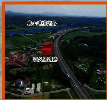
西久保遺跡と東山道との関係