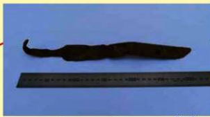
流路跡から出土した直刀