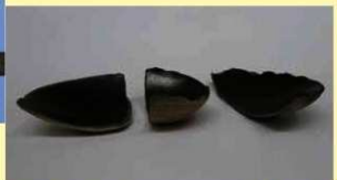
流路跡から出土した土師器 (杯)