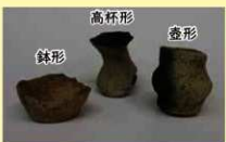
流路跡から出土したミニチュア土器