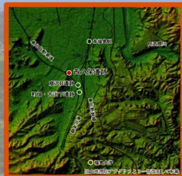
西久保遺跡の位置

A区の建物配置・建物の規模は公的な施設として特徴的であること、C区から公的文書が記されている木簡が出土していることを踏まえると、西久保遺跡は当時、この地区一帯を管理するための役所的な施設が設置されていた可能性があります。現在、調査途中のため今後の調査成果を踏まえて検討していく予定です。