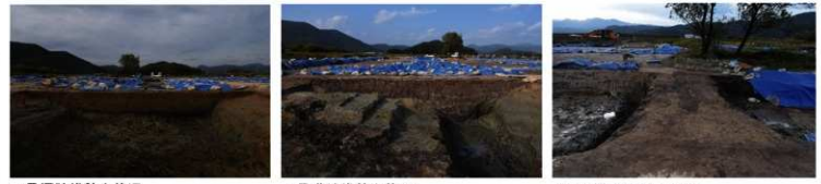
1号堀跡堆積土状況 1号溝跡堆積土状況 土橋状遺構と4号溝跡