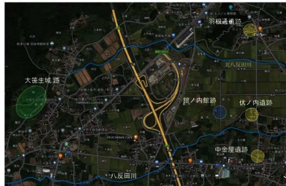
館ノ内館跡周辺の遺跡(Googlemapより転載。一部加工)

大笹地区は福島市の北西部に位置しており、本遺跡の北に縄文時代の遺跡である「羽根通A・B遺跡」、本遺跡の東側に、中世の在家(農業経営体)と考えられる「伏ノ内遺跡」などが存在し、昔から人が住んでいたことがわかっています。本遺跡は、明治22年に作成された地籍図にも地割の跡をどめる館跡であり、今回の調査では、館跡の堀跡のほか、水田耕作に伴う溝跡など規模の大きな遺構が見つかりました。