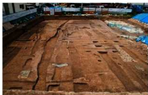
2 平安時代の畑（南から）