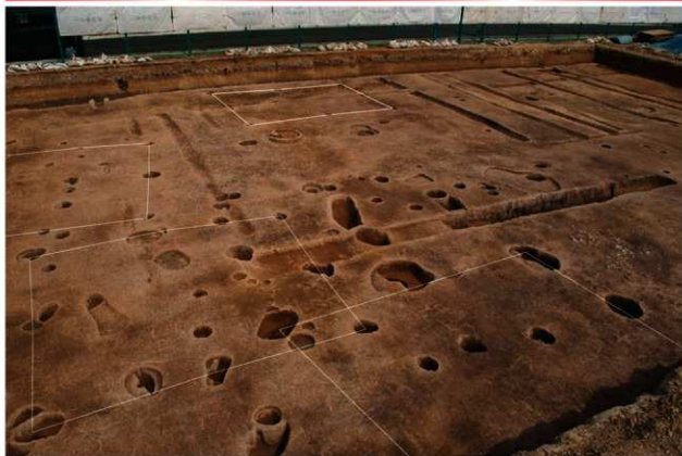
平安時代の建物跡(北西から)

平成24年(2012)4月から7月に池内遺跡の範囲内にある天美東5丁目の市営天美団地跡地で発掘調査を行いました。調査では、平安時代と弥生時代〜古墳時代の生活面を見つけることができました。