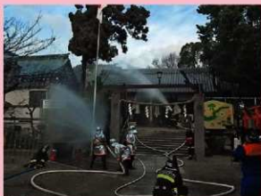
柴籬神社で行われた防火訓練の様子

また、1月26日の第59回文化財防火デーにあわせて23日に松原市消防本部・消防署による文化財防火訓練を柴籬神社でおこないました。訓練には、神社の関係者をはじめ地元消防団の方々と一緒に文化財の持ち出しや初期消火・放水訓練が行われ、文化財を守るため皆さん真剣な面持ちで取り組まれました。