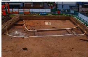
3 弥生時代～古墳時代のお墓（南から）