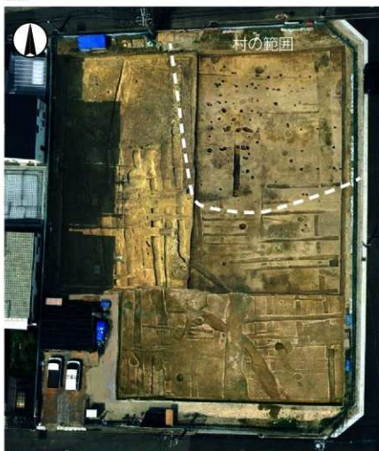
4 池内遺跡の垂直撮影合成写真（上が北、平安時代の生活面）

に沿って掘られていて、条里制（方位に沿って土地を基盤目状に区画する古代の制度で、今でも松原市域に跡が残っています。）を強く意識して畑を作ったことがわかります。