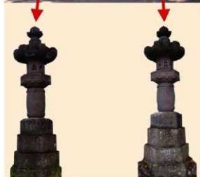
2 階段脇に3対の石灯籠があり、一番背の高い中央の1対が河内国領分のもの。階段そばの1対は文化7年(1810)8月建立の武蔵国領分が寄付したもの。(撮影日:2012年9月)