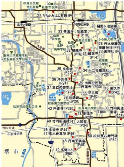
2 市域を国道 309 号線と府道堺・大和高田線(12号)を境として、北東・南東・南西・北西の4コースに分けました。