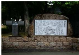
竹内街道の記念碑

松原市は、歴史街道としての竹内街道を広く知ってもらえるよう、岡公園内に立派な記念碑を建てています（平成24年3月建）。