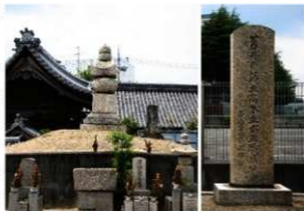
初代高木正次墓と丹南藩陣屋址碑

木主水正陣屋址」の石碑が建っています。正得の 2 女が三笠宮崇仁親王の妃である百合子様で、昭和 16 年に皇族へ嫁がれました。