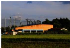
立部古墳群の発掘地