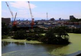
樋野ヶ池窯の小島

河内大塚山古墳は、わが国で5番目の墳丘規模を持つ巨大前方後円墳です。出土遺物は不明ですが、樋野ヶ池窯と同じく6世紀中葉以後につくられたと考えられています。ただ、古墳が完成する前に棄てられたとも考えられており（未完成説）、須恵器が使われなかったかもしれません。