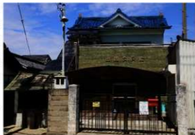
西蓮寺跡の出岡公民館

光背には「釋覚智 しやくかくち 」 享保廿乙卯年三月十一日 と刻まれています。江戸時代中ごろの享保 20 年 (1735) 3 月 11 日に造立されたもので、覚智という人が関わりました。光背の上部が少し欠損していますが、西蓮寺に付随するお地藏さまとして、いまでも信仰をうけています。