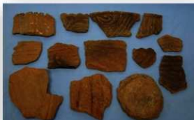
尾田貝塚の阿高式土器

貝塚は縄文人のゴミ捨て場ですが、当時の生活がわかる宝の山でもありません。当貝塚からは、多くの貝殻、縄文土器片の他にも、貝製品（腕輪など）や、シカやイノシシの骨・牙で作られた骨角器などが出土しています。また、掲載していませんが、石器（石斧・石錘・石鏃など）も出土しています。