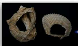
貝肉を採ったあと（アカニシやアカガイ）

貝類はアゲマキ・カキ・ハイガイ・テングニシなどが多く出土しており、これらを好んで食べていたようです。