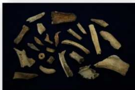
尾田貝塚出土の獣骨など

貝輪は、アカガイの仲間であるサトウガイを利用したものが多く、未成品を含めると32点出土しています。