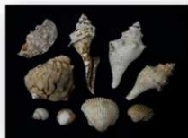
尾田貝塚出土の貝

貝塚は縄文人のゴミ捨て場ですが、当時の生活がわかる宝の山でもありません。当貝塚からは、多くの貝殻、縄文土器片の他にも、貝製品（腕輪など）や、シカやイノシシの骨・牙で作られた骨角器などが出土しています。また、掲載していませんが、石器（石斧・石錘・石鏃など）も出土しています。