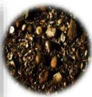
尾田貝塚に散乱する貝殻

尾田貝塚の周辺には、湧水地があります。縄文時代の頃、海はもっと近く、水量も豊富であり、生活の場としては最適だったと考えられます。山も近くて、シカやイノシシなどが狩猟されていたのでしょう。多くの貝類・獣骨などが出土しています。