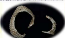
貝輪（サトウガイ製）

貝輪は、アカガイの仲間であるサトウガイを利用したものが多く、未成品を含めると32点出土しています。