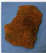
尾田貝塚の曾畑式土器