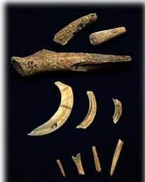
尾田貝塚出土の骨角器