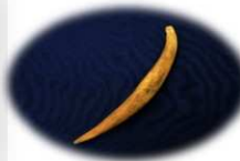
シカの角を利用した刺突具