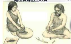
縄文人の生活（「天水町史」より）

貝類はアゲマキ・カキ・ハイガイ・テングニシなどが多く出土しており、これらを好んで食べていたようです。