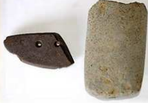
立岩産石包丁と今山産石斧

北部九州系の須玖Ⅱ式にあたる甕です。赤色顔料が塗られ、祭祀に使用された土器です。