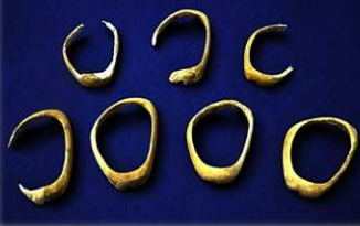
甕棺から出土したゴホウラ貝製腕輪 (市指定有形文化財)

弥生時代の貝輪は、県内では 4 か所の遺跡しか出土しておらず、甕棺内で 7 点もあるのは、この年の神遺跡だけなんじゃ！