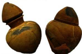
支石墓下の両脇から出土した小型の甕棺