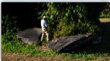
年の神遺跡の支石墓 (市指定史跡)

また、昭和 43 年の農地造成中に緊急調査が実施されています。その結果、右の支石墓付近で、長さ 4m の巨石下から大小の甕棺 3 基が出土し、中央の大型甕棺内から成人男性人骨と共に 7 点のゴホウラ貝製腕輪が発見されました。