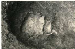
弥生時代中期の墓 （土器を棺おけとして使用）