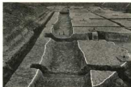
直線的にはしる溝