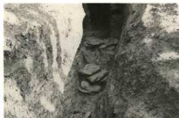
横穴墓入口の石 (ふたに使われたもので約60 kgの重量がある)