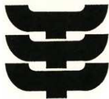
文化財愛護シンボルマーク

明和9年5月21日（陰暦）現在の長谷字小出ヶ谷地区において、銅鐸一口が発見され掛川藩に届出されました。これが現在の文化財保護法の遺物の発見届と同じことで、この日を記念して、市民の埋蔵文化財に対する理解と、これらを保護・保存しようとする意識の向上を願い、毎年5月21日を掛川市「考古の日」として設定しました。