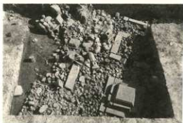
本丸下層の墓 (中世)