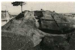
木芯粘土古墳全景 (約1,400年前)