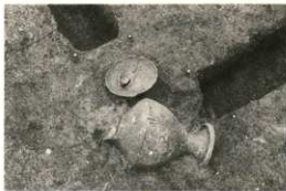
竪穴住居跡から発見された土器