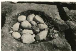
礎石根固め石 1 第2面