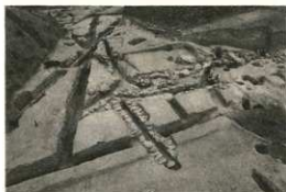
本丸門周辺の暗渠