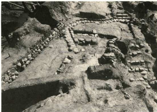
腰曲輪の玉石張り側溝と階段