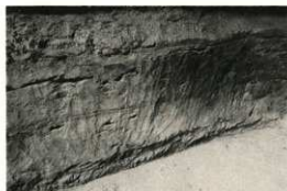
横穴墓内に残る当時の工具のあと