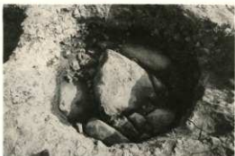
礎石根固め石 1 第4面