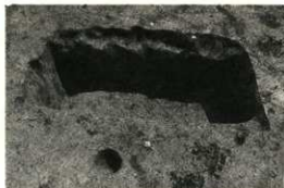
古墳時代中期の土壌墓