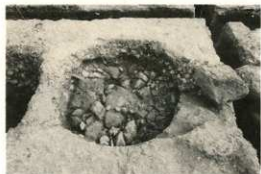
礎石根固め石 1 第3面