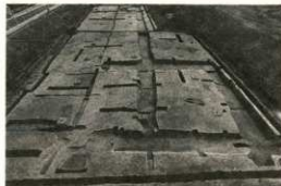
調査区全景 (上の面)

上の面も下の面も、遺構は溝だけでしたが、併せて14本の溝が見つかりました。これらは、はしる方向により、東西方向のもの、南北方向のもの、北西～南東方向のものにおおよそ大別できそうです。また、蛇行するものは自然の流れで、直線的なものは人工のものと思われ、その機能ははっきりしませんが、排水・導水・区画などが考えられるでしょう。