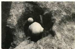
貯蔵穴内土器出土状態