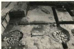
礎石根固め石と地覆石