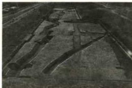
調査区全景 (下の面)