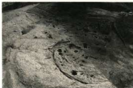
弥生時代後期～古墳時代初頭の集落跡