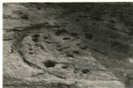
弥生時代後期の竪穴住居跡