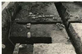
土塀基壇と根石と遺物出土状態