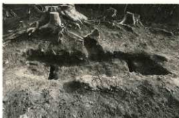
弥生時代中期の墓 （穴の中には木棺をはめ込むための溝がある）