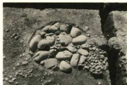
礎石根固め石 1 第1面