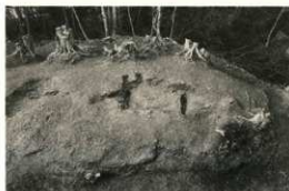
弥生時代中期の墓 （墓穴の両側に溝が掘られている）