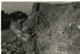
腰曲輪築塼 (瓦を埋め込んでいる)