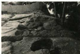
天守下門東側石垣