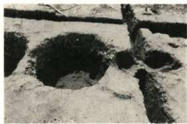
礎石根固め石 1 完掘