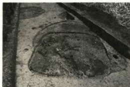
弥生時代後期から古墳時代前期の住居跡