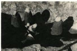
弥生時代後期の方形周溝墓遺物出土状態