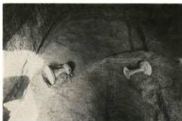
横穴墓内から発見された土器