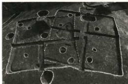
竪穴住居跡 (約1,400年前)