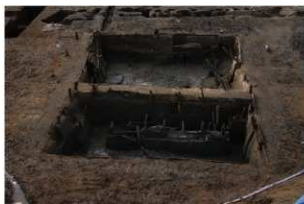
3 池状遺構構築材の状況