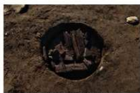
8 第 82 号埋設桶上面