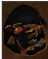
8 第15号建物跡 ビット3