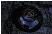
10 第66号土坑遺物出土狀況