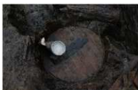
5 第 47 号埋设桶