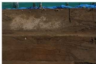
6 東壁基本土層 (部分3)