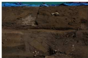
8 東壁基本土層 (部分5)