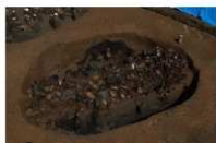
8 第 1024 号土坑遗物出土状况 (2)