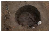
13 第 31 号埋設桶