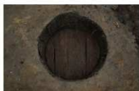
8 第 23 号埋設桶