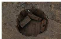
1 第 14 号埋設桶