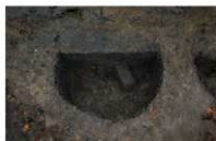
2 第 15 号埋設桶断面