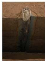
12 第16号建物跡 基礎杭 (2)