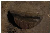
15 第 93 号埋設桶断面