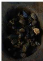
7 第14a号建物跡 ピット6