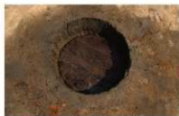
14 第 32 号埋設桶