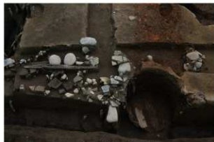
2 第6号建物跡 (部分)