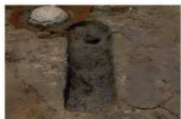
1 第 1002 号土坑