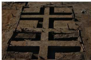
2 池状遺構検出状況