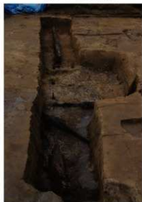
10 第 204 号土坑