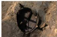
12 第 86 号埋設桶