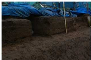
1 西壁基本土層全景