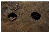
7 第 79·80 号埋設桶