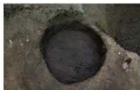
15 第 35 号埋設桶