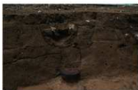
2 胞衣埋納遺構 (1)