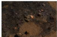
11 第 1025 号土坑检出状况 (2)