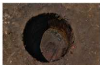
6 第 20 号埋設桶