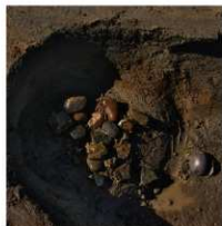
3 第14b号建物跡 ビット3