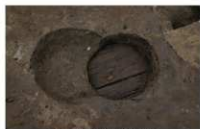
16 第 36 号埋設桶