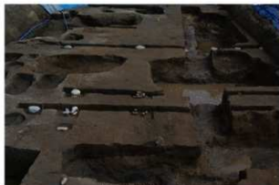
2 第2号建物跡 北から