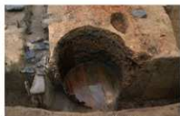
18 第 39 号埋設桶