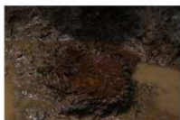
6 第46号土坑遺物出土狀況