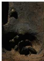
6 第14a号建物跡 ピット5