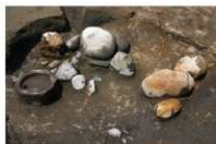
2 第 1003 号土坑