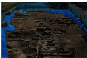
4 第一面全景 北から