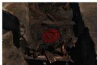
1 第210号土坑遺物出土狀況(2)