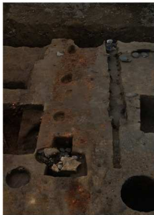
2 第1・6号建物跡・第2号杭列検出状況