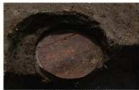
17 第 94 号埋設桶