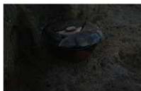
3 胞衣埋納遺構 (2)