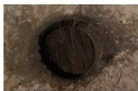
9 第 82 号埋設桶