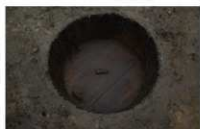
7 第 21 号埋設桶