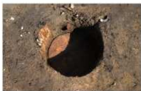
14 第 65 号埋设桶