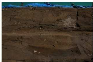
7 東壁基本土層 (部分4)