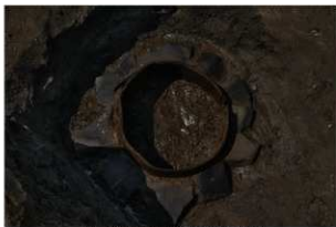
4 第10号井戸跡1段目下端