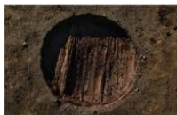
6 第 51 号埋设桶