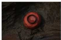
4 第 1004 号土坑遗物出土状况