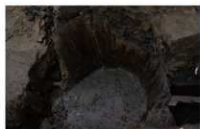
1 第 73 号埋設桶