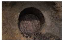
16 第 93 号埋設桶