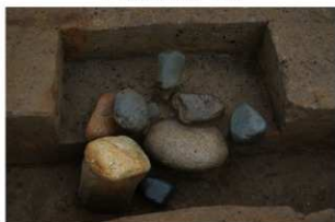
8 第4号建物跡 石5