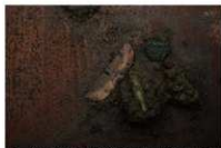
1 第29号土坑遺物出土狀況(2)