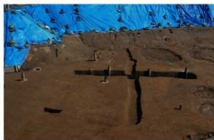
10 第16号建物跡・第15号溝跡