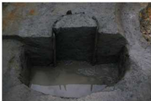
2 第14号井戸跡下部断面