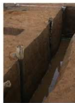
11 第16号建物跡 基礎杭 (1)