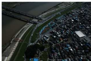
3 近景 北西から