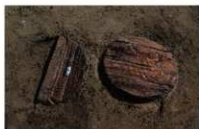
16 第 68·69 号埋设桶