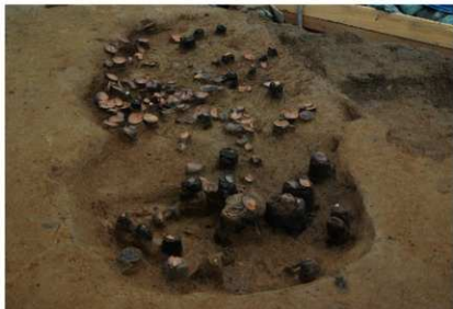
12 第 1025 号土坑