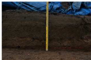
2 西壁基本土層 (部分)