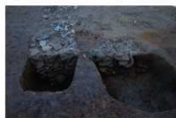
5 第 150 号土坑