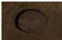
15 第 67 号埋设桶