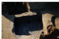
4 第 111 号土坑掘方