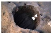
6 第 78 号埋設桶