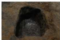
3 第 1004 号土坑