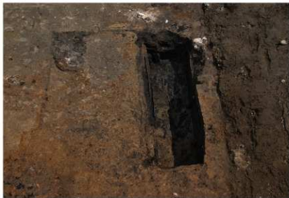
1 第1号土壤检出状况