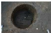
4 第 44 号埋设桶