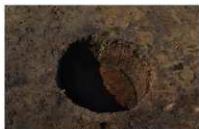
13 第 64 号埋设桶