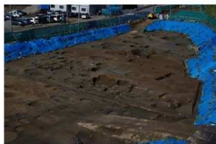
5 第二面全景 南東から