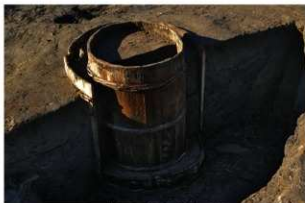
3 第5号井戸跡検出状況