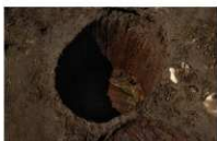
8 第 55 号埋设桶