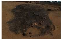
10 第 1025 号土坑检出状况 (1)