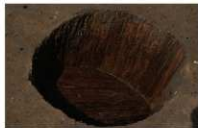
11 第 84 号埋設桶