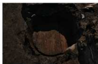
5 第 77 号埋設桶