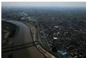
2 遠景 北から