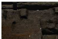
5 第 1005 ~ 1007 号土坑