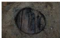
4 第 17 号埋設桶