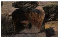
2 第 40 号埋设桶