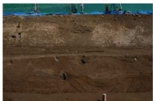
5 東壁基本土層 (部分2)