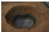
9 第 1024 号土坑完掘