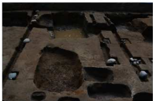
3 第2号建物跡 東から