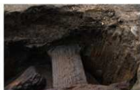
4 第 77 号埋設桶上面 (2)