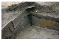
2 第 111 号土坑部分 (2)