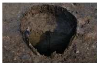
18 第 73 号埋设桶断面