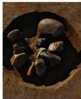
7 第15号建物跡 ビット2