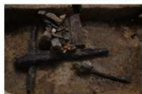
12 第 205 号土坑遗物出土状况