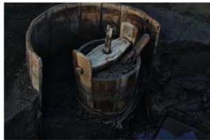
7 第3号井戸跡の瓶出土状況