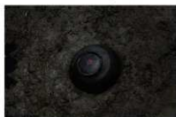
6 第 1007 号土坑遗物出土状况