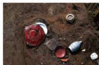
9 第 201 号土坑遗物出土状况