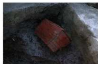
14 第 210 号土坑遗物出土状况 (1)