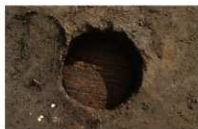
2 第 75 号埋設桶