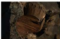
17 第 72 号埋设桶