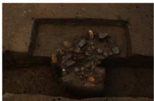
5 第2号建物跡 石2