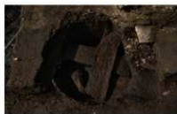
3 第 77 号埋設桶上面 (1)