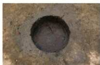
9 第 24 号埋設桶