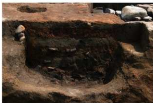
5 第1号建物跡基礎土層