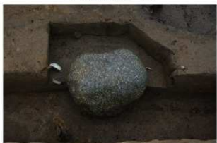
7 第4号建物跡 石1