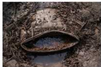
8 第13号土壤出土遗物