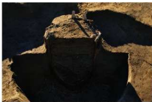
4 第15号井戸跡1段目断面