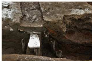
6 第1号建物跡・第39号埋設桶土層