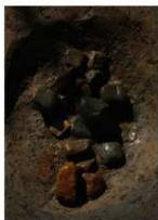
4 第14a号建物跡 ピット3