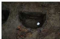
3 第 16 号埋設桶断面