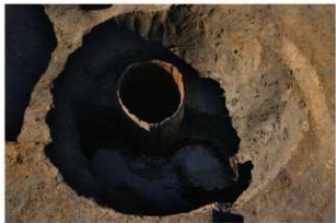
5 第15・17号井戸跡全景