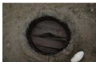
5 第 18 号埋設桶