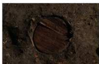
7 第 52 号埋设桶