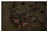
13 第 1025 号土坑部分