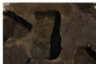
13 第 210 号土坑