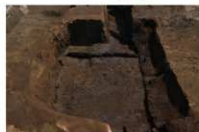
11 第 205 号土坑