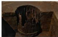
13 第 88 号埋設桶