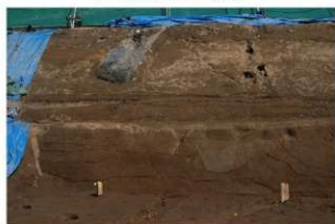
4 東壁基本土層 (部分1)