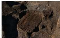
10 第 83 号埋設桶