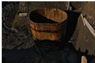
6 池状遺構桶出土状況