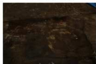
8 第 201 号土坑