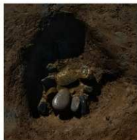
2 第14b号建物跡 ビット2