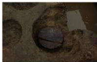
3 第 41 号埋设桶