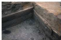
1 第 111 号土坑部分 (1)