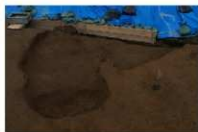
14 第 1025 · 1026 号土坑完掘