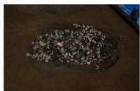
7 第 1024 号土坑遗物出土状况 (1)