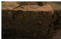
1 第 40 号埋设桶断面