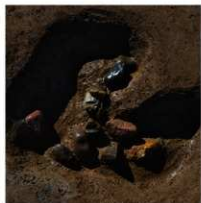
1 第14b号建物跡 ビット1