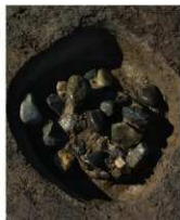
4 第14b号建物跡 ビット4