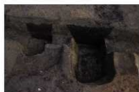
6 第 160·161 号土坑