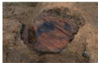
18 第 95 号埋設桶