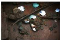
12 第29号土壤遗物出土状况(1)