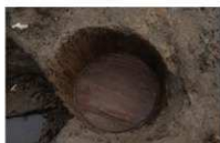
9 第 56 号埋设桶