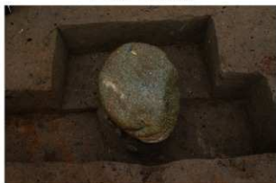
6 第2号建物跡 石3