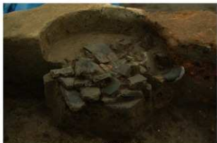
1 第1号建物跡 ピット4