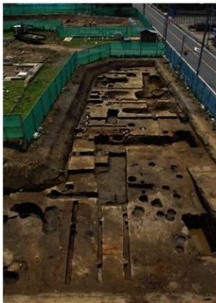
1 第一面建物跡群と日光道中