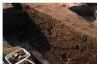
7 第 188 号土坑断面