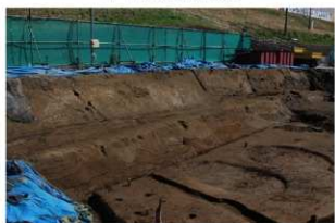
3 東壁基本土層全景