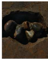
6 第15号建物跡 ビット1