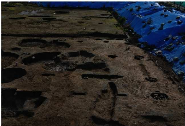
3 第14a・14b号建物跡 北から