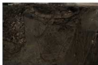
15 第 1028 号土坑 · 第 11 号沟迹 断面