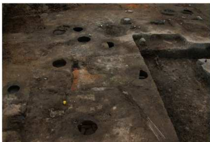
4 第一面北西部埋設桶分布状況