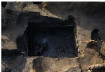
3 第 111 号土坑