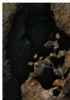
5 第14a号建物跡 ピット4