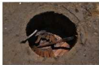
14 第 91 号埋設桶