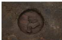
17 第 37 号埋設桶