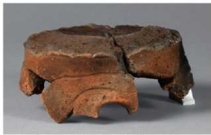
2 H-6出土土器 (第179图102)