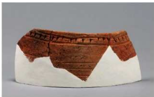
4 H-6出土土器 (第171图15)