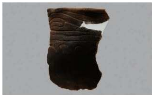
4 H-6出土土器 (第183图148)