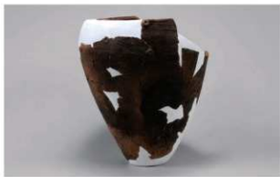
7 1-6出土土器 (第371图366)