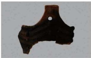
8 H-7出土土器 (第275图4)