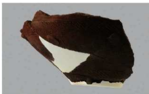
7 H-7 出土土器 (第 278 图 28)