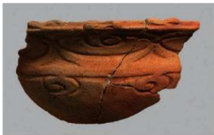
4 G-6出土土器 (第85图89)