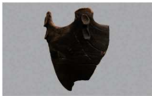
8 H-7出土土器 (第276图12)