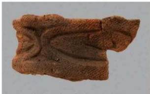
6 G-6出土土器 (第85图91)