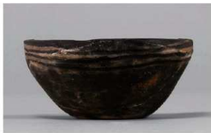
4 G-5 出土土器 (第 52 图 17)