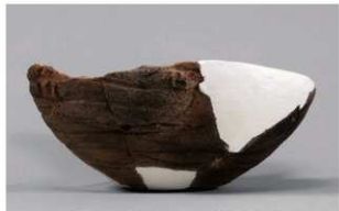
5 1-6出土土器 (第347图114)