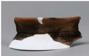
6 H-6出土土器 (第179图115)