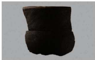
2 H-7出土土器 (第282图84)