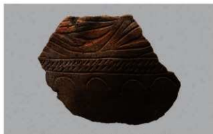
2 H-6出土土器 (第182图138)