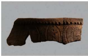
1 | - 6 出土土器 (第 361 图 262)