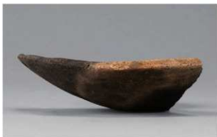
8 G-6出土土器 (第84图76)