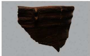
6 1-6出土土器 (第342图64)