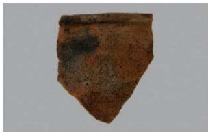
1 1-5 出土土器 (第 323 图 17)