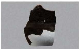
7 1-6出土土器 (第365图293)