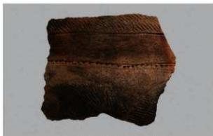
1 H-5出土土器 (第139图8)