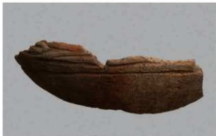
6 H-5 出土土器 (第 141 图 28)