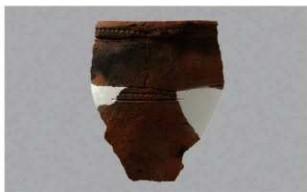
8 1-7出土土器 (第484图101)