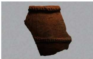
3 | - 6 出土土器 (第 361 图 264)