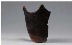
7 H-6出土土器 (第174图42)