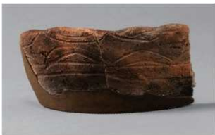
4 G-6出土土器 (第78图20)