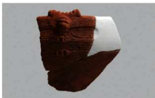
7 1-7 出土土器 (第 478 图 38)