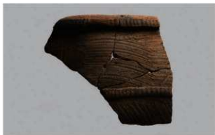
3 1-6出土土器 (第358图239)