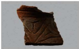
2 H-7出土土器 (第280图66)