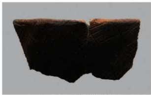
1 1-6出土土器 (第337图22)