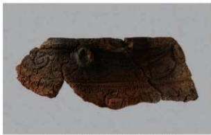
1 1-7 出土土器 (第 480 图 66)