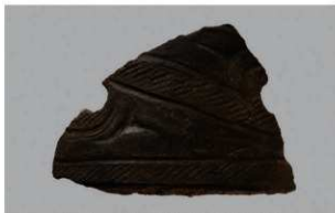
1 | -6 出土土器 (第 352 图 175)