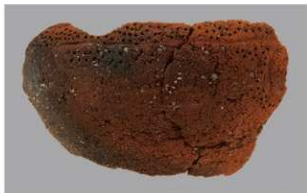
3 G-6出土土器 (第84图80)