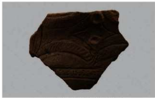
1 H-6出土土器 (第174图44)