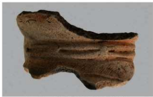
1 H-6出土土器 (第179图101)