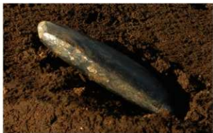
3 H-6 第 259 图 2006 出土状况