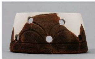
4 1-7 出土土器 (第 479 图 52)