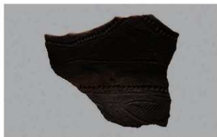
2 1-6出土土器 (第336图4)