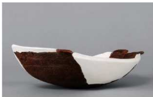
3 | -6 出土土器 (第 348 图 137)