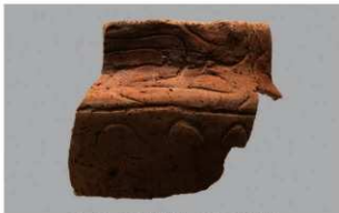
6 G-6出土土器 (第81图48)