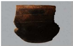
3 H-6出土土器 (第184图157)