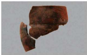
1 G-6出土土器 (第77图7)