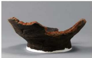
6 H-6出土土器 (第178图90)