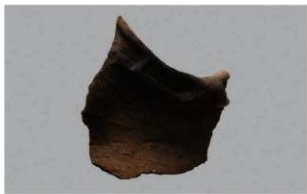
7 H-7出土土器 (第275图3)