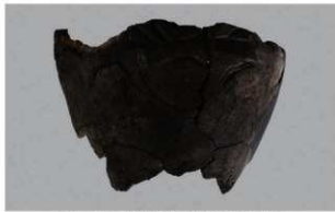
2 1-6出土土器 (第369图344)