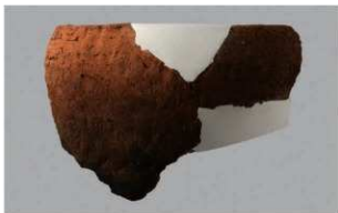
4 H-6出土土器 (第188图213)