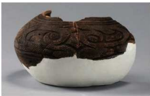
8 H-7 出土土器 (第 281 图 82)