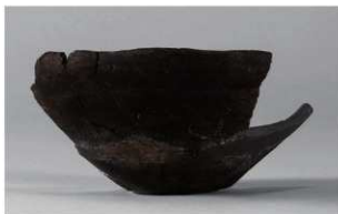
7 G-6出土土器 (第84图75)