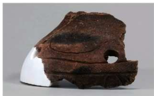
7 1-6出土土器 (第352图173)