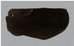
6 H-5出土土器 (第141图20)