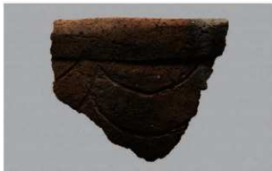
5 | -6 出土土器 (第 368 图 318)