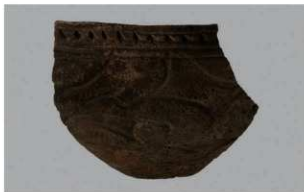
3 H-6出土土器 (第186图192)