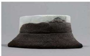
7 H-7出土土器 (第280图55)