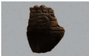
3 H-6出土土器 (第183图147)