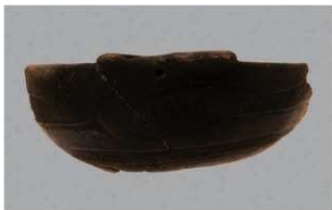
4 | -6 出土土器 (第 348 图 122)