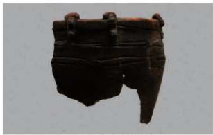
1 1-7出土土器 (第477图22)