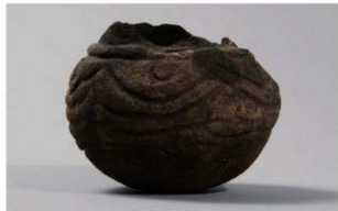
6 H-5出土土器 (第142图39)