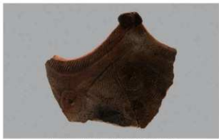
1 F-4出土土器 (第14图1)