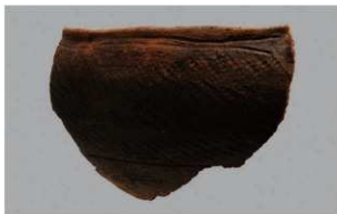
3 H-6 出土土器 (第 171 图 22)