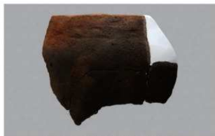
2 I-6出土土器 (第374图380)