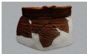
8 J-6 出土土器 (第 556 图 31)