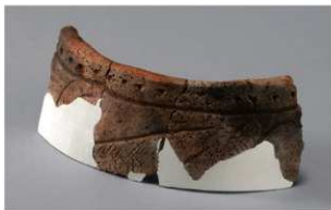
7 H-6 出土土器 (第 176 图 58)