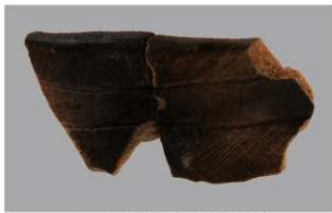
1 G-5出土土器 (第51图3)