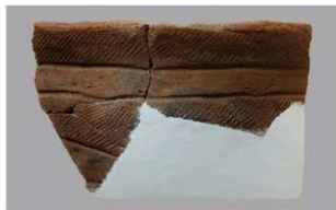
4 H-7出土土器 (第278图33)