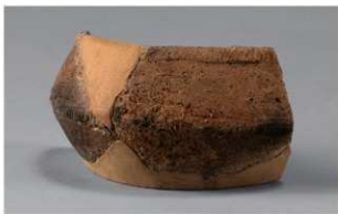
8 G-6出土土器 (第78图15)