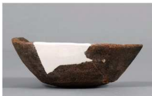
8 1-7 出土土器 (第 481 图 74)