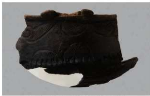
1 | -6 出土土器 (第 351 图 151)