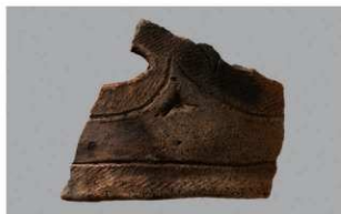
6 1-6出土土器 (第352图172)