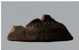
3 | -6 出土土器 (第 352 图 177)