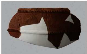
6 1-6出土土器 (第361图259)