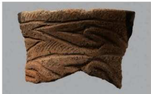
4 G-4出土土器 (第45图1)