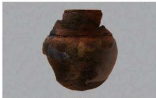
5 G-5出土土器 (第51图8)