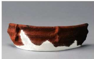
6 H-7出土土器 (第277图19)