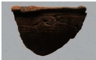
4 | -6 出土土器 (第 348 图 138)