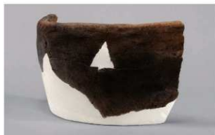
6 | -6 出土土器 (第 376 图 400)