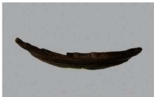
3 H-6出土土器 (第178图87)