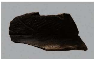
7 H-6 出土土器 (第 178 图 99)