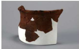
6 H-6出土土器 (第175图49)