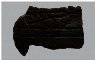
8 H-6出土土器 (第186图189)