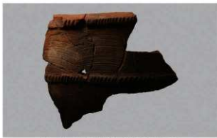
2 H-7 出土土器 (第 283 图 93)