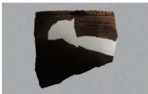
7 H-6出土土器 (第180图116)