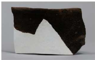
7 H-7出土土器 (第282图89)