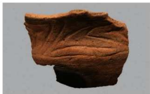
1 G-6出土土器 (第81图43)