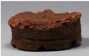
5 H-7 出土土器 (第 280 图 62)