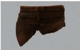
2 H-7 出土土器 (第 277 图 23)