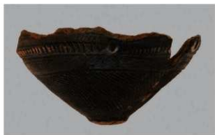
3 1-6出土土器 (第351图169)