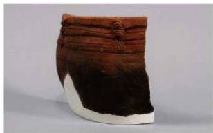
3 1-6出土土器 (第343图77)