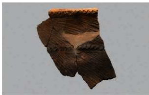
7 | -6 出土土器 (第 356 图 215)