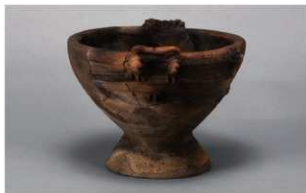
4 | -6 出土土器 (第 351 图 158)