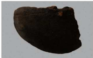
6 1-6出土土器 (第338图28)