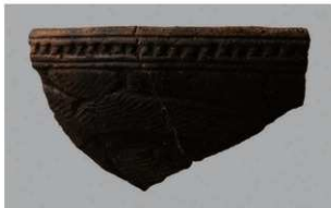
5 H-6出土土器 (第186图194)