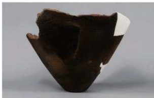
1 | -6 出土土器 (第 346 图 102)