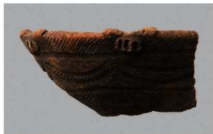
4 1-6出土土器 (第347图113)