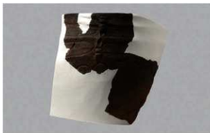
3 H-7 出土土器 (第 277 图 24)