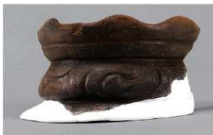
7 1-7 出土土器 (第 479 图 55)