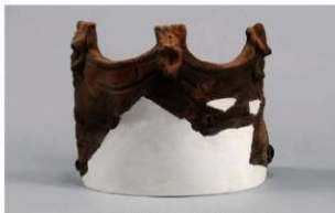
1 | -6 出土土器 (第340图51)