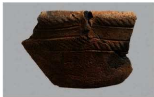
4 1-7 出土土器 (第 478 图 35)