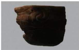
7 H-6出土土器 (第184图161)