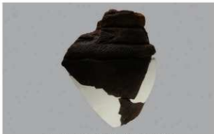
6 H-5出土土器 (第139图5)