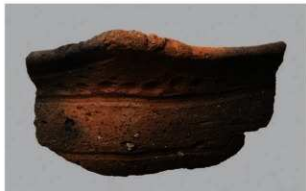
6 | -6 出土土器 (第 369 图 337)