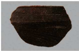
1 H-5 出土土器 (第 141 图 23)