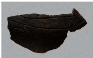
8 H-6出土土器 (第179图109)