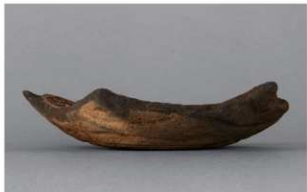
5 H-7出土土器 (第281图68)