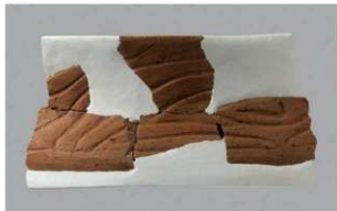
6 G-6出土土器 (第82图56)