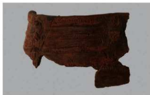
2 1-6出土土器 (第343图76)