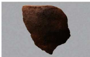
7 | -6 出土土器 (第 376 图 401)