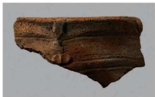
1 1-6出土土器 (第343图75)