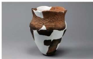
8 H-6出土土器 (第183图144)