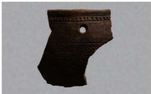
6 H-7出土土器 (第275图2)