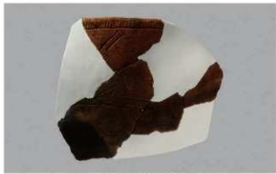
1 1-6出土土器 (第365图287)