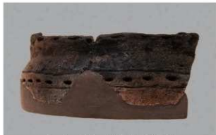
6 G-6出土土器 (第80图40)