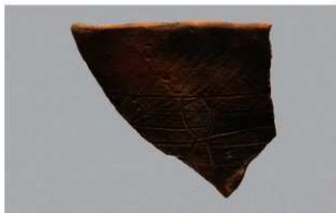
1 | -6 出土土器 (第 336 图 11)