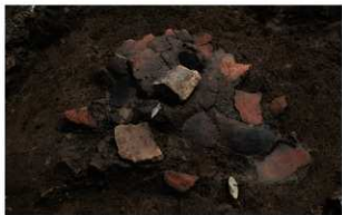
1 | - 6 第 378 图 414 出土状况