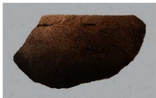
5 I-6出土土器 (第375图390)