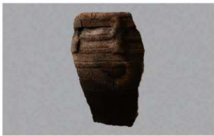
2 1-7出土土器 (第477图23)