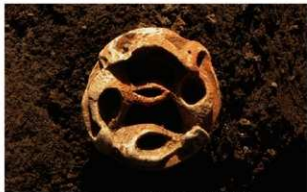
6 J-7 第 657 图 1450 出土状况