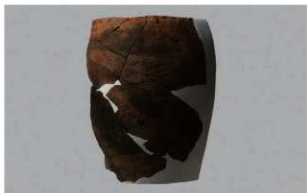
3 H-6出土土器 (第192图245)