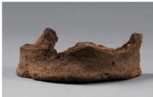
5 | -6 出土土器 (第 380 图 472)