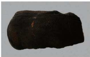
2 H-6 出土土器 (第 171 图 21)