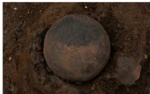
4 H-5 第 142 图 39 出土状况