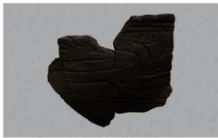
2 1-6出土土器 (第371图361)