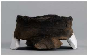
1 G-6出土土器 (第79图25)