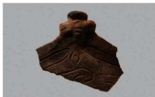
8 1-6出土土器 (第365图294)