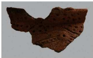
4 H-6出土土器 (第186图201)