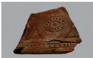
7 1-6出土土器 (第370图350)