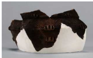
4 J-6 出土土器 (第 556 图 27)