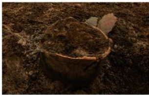
1 I-7 第 481 图 81 出土状况