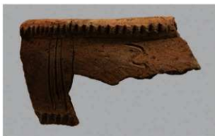
7 | -6 出土土器 (第 358 图 235)