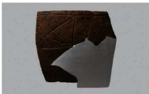
8 H-6出土土器 (第180图117)