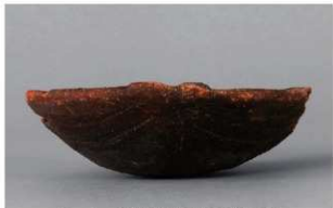
5 1-6出土土器 (第368图328)