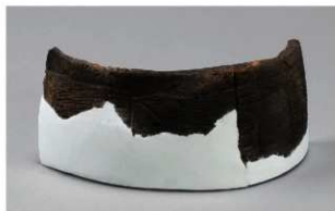
2 H-7出土土器 (第278图31)