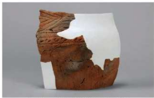
1 H-6出土土器 (第184图154)