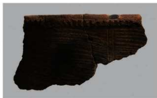
8 1-6出土土器 (第357图228)