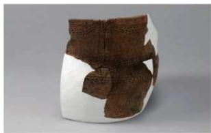
7 H-6出土土器 (第183图143)