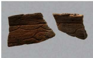
4 H-7 出土土器 (第 280 图 61)