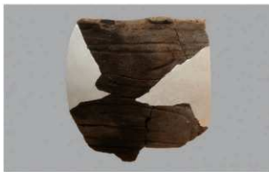
7 H-7 出土土器 (第 281 图 81)