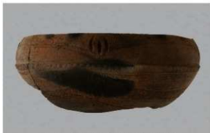
1 H-7 出土土器 (第 279 图 39)