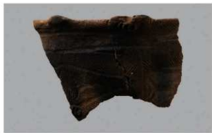
7 1-6出土土器 (第355图206)