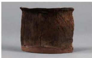
7 G-6出土土器 (第87图104)