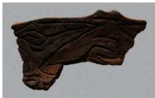
8 G-5出土土器 (第52图11)