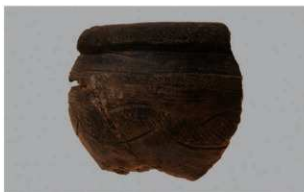
7 | -6 出土土器 (第 346 图 108)