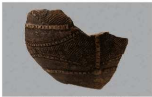
1 1-7出土土器 (第479图57)