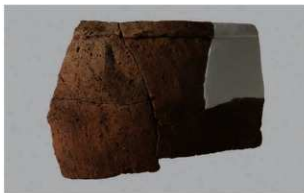
3 H-6出土土器 (第190图235)