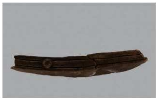
3 1-6出土土器 (第339图45)