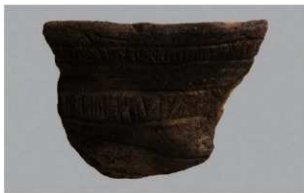
3 | -6 出土土器 (第 355 图 211)