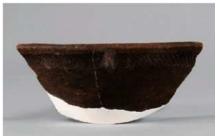
3 1-7 出土土器 (第 478 图 34)