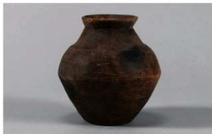
4 G-6出土土器 (第84图81)