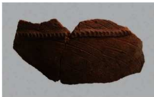
3 | -6 出土土器 (第 360 图 247)