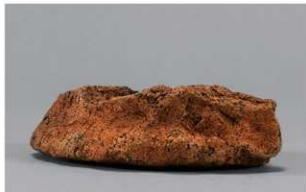
6 | -6 出土土器 (第 380 图 473)