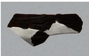
8 H-7 出土土器 (第 279 图 46)