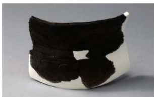
7 H-6出土土器 (第182图136)