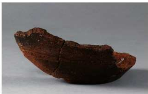
8 H-6出土土器 (第184图163)