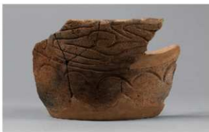
8 G-6出土土器 (第82图50)