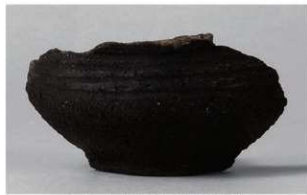
2 1-7 出土土器 (第 479 图 49)