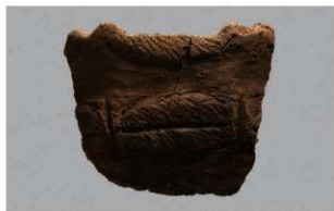
2 1-6出土土器 (第345图94)