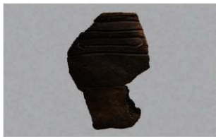
8 | - 6 出土土器 (第 366 图 304)