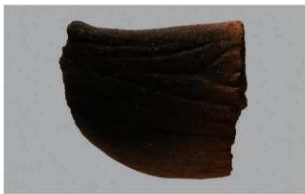
8 H-5 出土土器 (第 141 图 30)