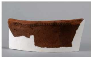
8 H-7出土土器 (第283图91)