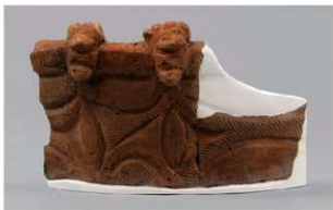
4 1-7出土土器 (第477图25)