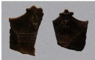
5 I-5出土土器 (第322图6)