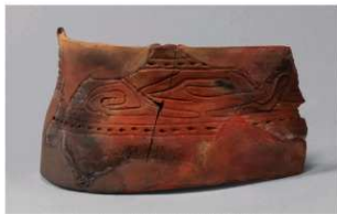
2 G-6出土土器 (第80图36)