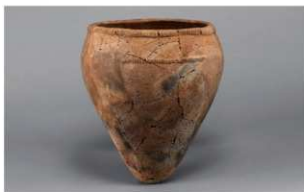
7 | - 6 出土土器 (第 362 图 269)