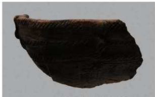
5 J-6出土土器 (第557图36)