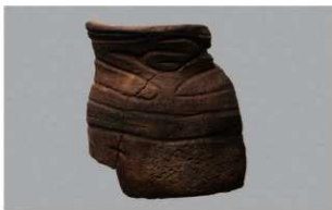
4 G-6出土土器 (第81图46)