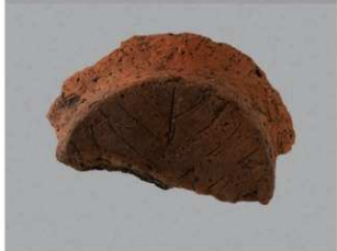
1 F-5出土土器 (第23图36)