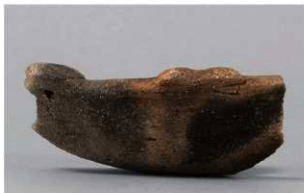
1 | -6 出土土器 (第 368 图 332)