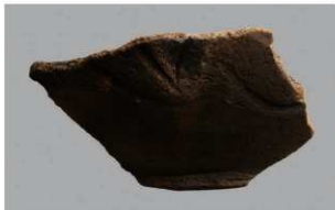
5 | - 6 出土土器 (第 370 图 356)