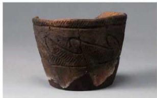
1 H-6出土土器 (第176图60)