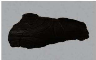
5 H-5出土土器 (第142图38)