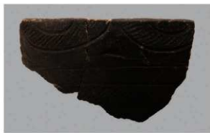
8 1-6出土土器 (第346图101)