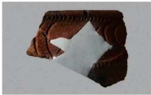
1 1-7出土土器 (第483图94)