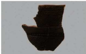
5 G-6出土土器 (第77图3)