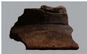
4 | -6 出土土器 (第 352 图 178)