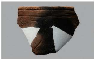
1 | -6 出土土器 (第 355 图 209)