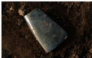
4 H-6 第 259 图 2007 出土状况