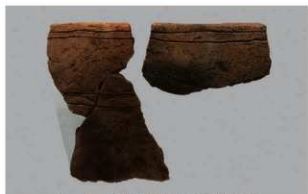
5 1-6出土土器 (第367图309)