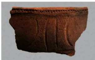
7 | -6 出土土器 (第 360 图 252)