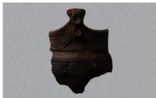
8 H-6出土土器 (第173图35)