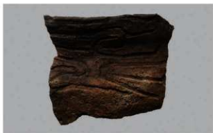
6 F-5出土土器 (第21图3)