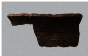
8 1-6出土土器 (第336图10)