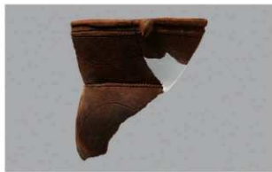
8 1-6出土土器 (第342图66)