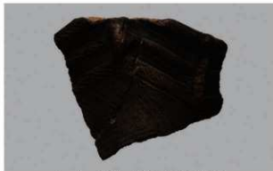
6 1-6出土土器 (第340图48)