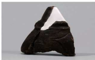
8 | -6 出土土器 (第 353 图 198)