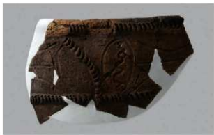
7 1-6出土土器 (第363图 277)