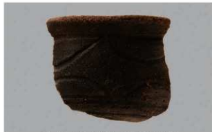
6 1-7 出土土器 (第 478 图 37)