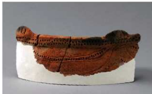
6 H-6出土土器 (第183图150)