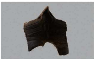
8 1-6 出土土器 (第 336 图 2)