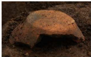
2 | - 6 第 381 图 481 出土状况