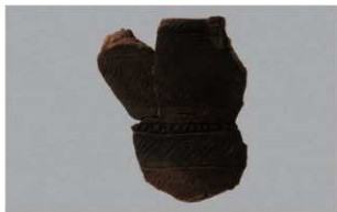
4 G-5出土土器 (第51图7)