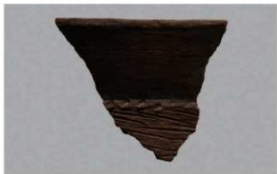
3 H-6出土土器 (第172图30)