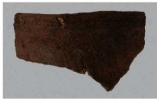
2 1-6出土土器 (第356图218)