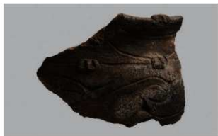
3 H-7出土土器 (第278图32)