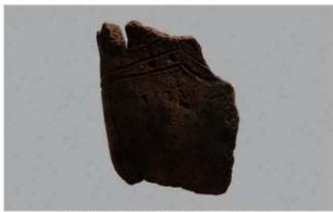
2 H-6出土土器 (第184图155)