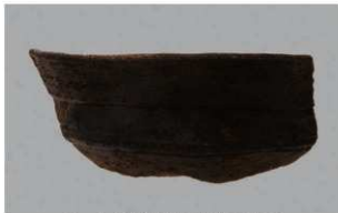
5 1-7 出土土器 (第 481 图 70)