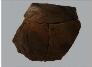
5 H-7出土土器 (第281图68)