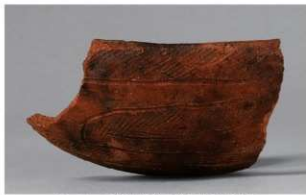
2 1-6出土土器 (第348图128)