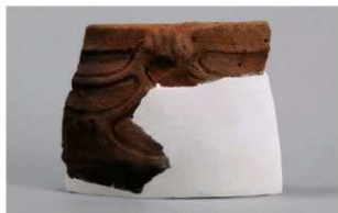
2 1-5出土土器 (第323图10)