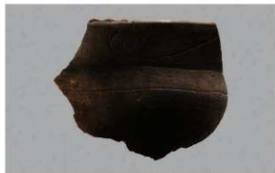
2 | -6 出土土器 (第 355 图 210)