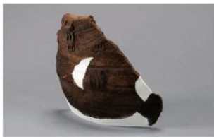
7 H-7出土土器 (第276图11)