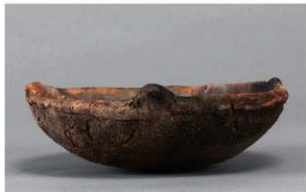
6 | -6 出土土器 (第 349 图 140)