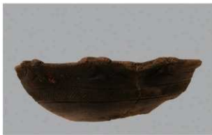
7 | -6 出土土器 (第 349 图 141)