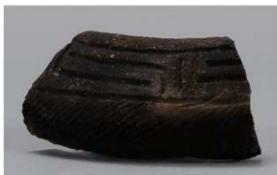
7 1-5 出土土器 (第 324 图 24)