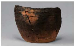
8 G-6出土土器 (第87图105)