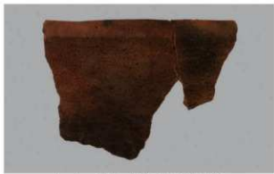
1 1-6出土土器 (第339图40)