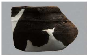
3 J-6出土土器 (第555图18)