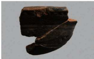
5 H-7 出土土器 (第 281 图 79)