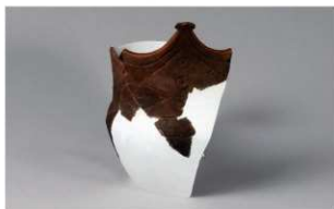
8 H-6出土土器 (第174图43)