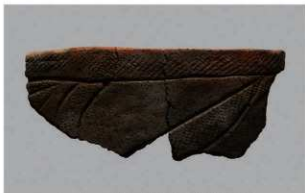
2 | -6 出土土器 (第 346 图 103)