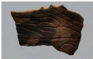
8 G-6出土土器 (第81图42)