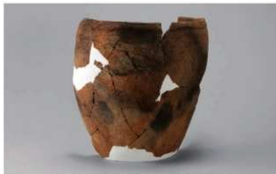
5 H-6出土土器 (第191图238)