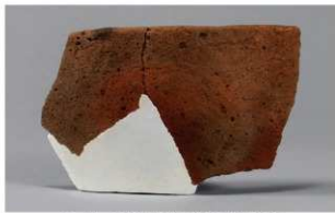
2 H-7出土土器 (第284图 103)