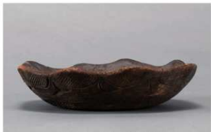
1 H-6出土土器 (第177图83)