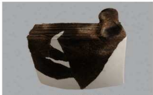
5 H-5出土土器 (第141图19)