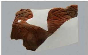
5 G-6出土土器 (第83图64)