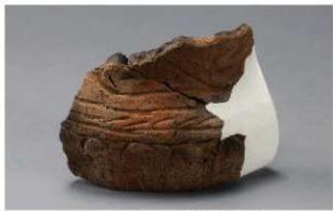
1 H-5出土土器 (第140图14)