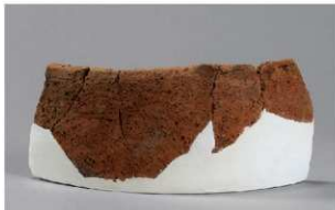
5 H-6出土土器 (第188图216)