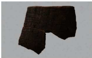
2 H-6出土土器 (第181图129)