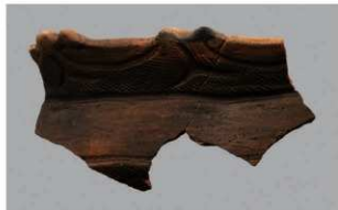
6 1-6出土土器 (第350图148)