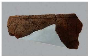
4 1-6出土土器 (第367图308)