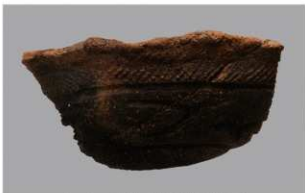
2 G-6出土土器 (第78图17)