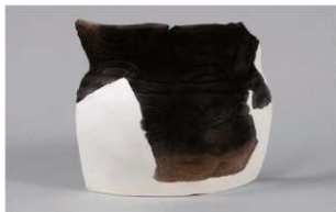
4 | - 6 出土土器 (第 366 图 298)