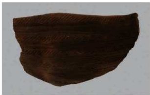
7 1-6出土土器 (第338图29)