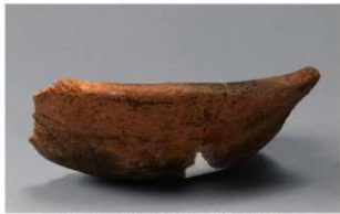
2 H-6出土土器 (第185图179)