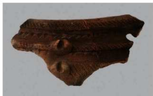
5 J-6出土土器 (第555图20)