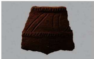
5 1-6出土土器 (第361图258)