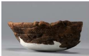
2 H-6出土土器 (第186图191)