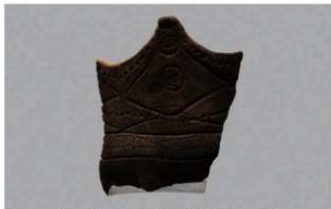
4 H-6出土土器 (第181图133)