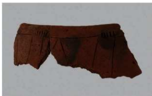
7 J-6 出土土器 (第 556 图 30)