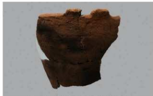
6 1-6出土土器 (第377图408)