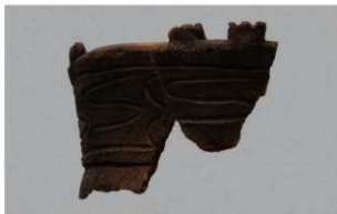
1 J-6 出土土器 (第 556 图 24)