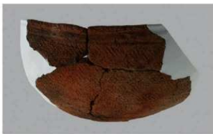
8 H-6出土土器 (第171图19)