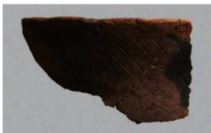
8 | -6 出土土器 (第 337 图 20)