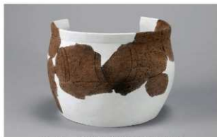
6 H-6出土土器 (第182图142)