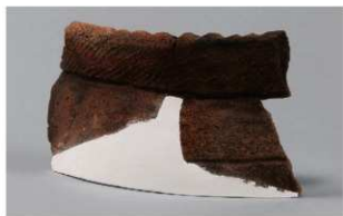
3 1-5出土土器 (第323图11)