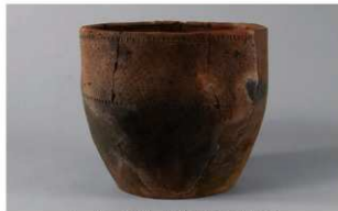
6 H-7出土土器 (第282图88)