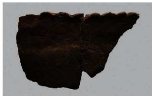
4 1-6出土土器 (第377图406)