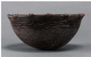
4 H-5 出土土器 (第 141 图 26)