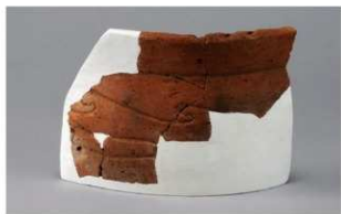
3 H-6出土土器 (第182图139)