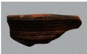
8 | -6 出土土器 (第 346 图 109)