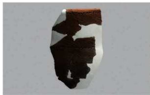
8 | -6 出土土器 (第 356 图 216)