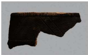
7 1-6出土土器 (第359图243)