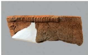
5 | -6 出土土器 (第 360 图 250)