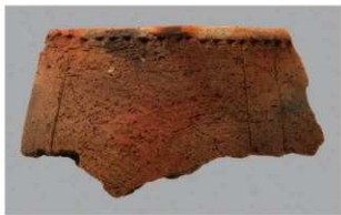
7 G-5 出土土器 (第 52 图 21)