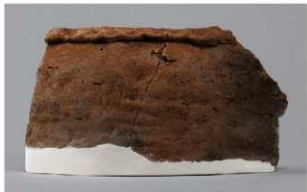
5 H-7出土土器 (第284图 106)