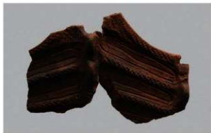
2 H-7出土土器 (第275图6)