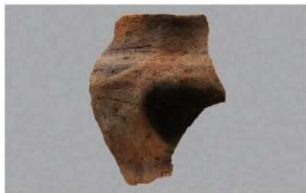
2 G-5出土土器 (第53图24)