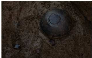
6 I-6第349图140·第458图2949·2959 出土状况