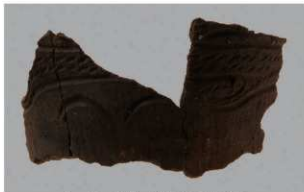
5 G-6出土土器 (第80图39)