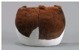
8 1-6出土土器 (第367图312)