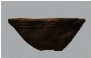
5 1-7 出土土器 (第 478 图 36)