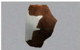
7 1-7出土土器 (第480图63)