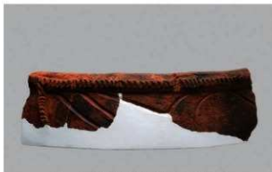
1 1-7 出土土器 (第 482 图 85)