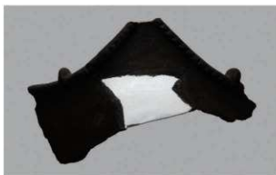
7 | -6 出土土器 (第 338 图 37)