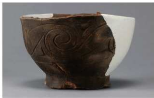
8 H-6出土土器 (第178图92)