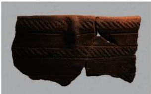
6 | - 6 出土土器 (第 343 图 72)