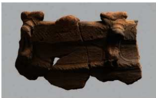
4 H-7 出土土器 (第 277 图 25)