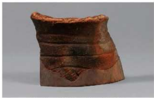
1 G-5 出土土器 (第 52 图 12)