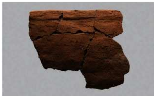
5 | - 6 出土土器 (第 372 图 373)