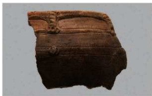
7 I-5出土土器 (第322图8)