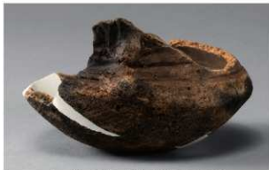
5 H-6出土土器 (第179图114)