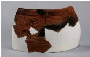
3 | -6 出土土器 (第344图86)