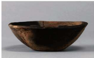
6 | -6 出土土器 (第 368 图 320)