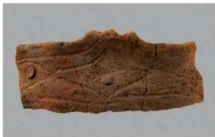
1 | - 6 出土土器 (第 366 图 295)