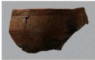
2 1-6出土土器 (第365图288)