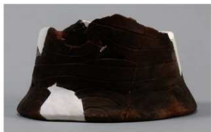
3 1-6出土土器 (第352图185)