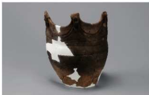
1 H-6出土土器 (第173图36)