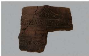
1 | -6 出土土器 (第364图279)