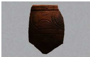
4 | -6 出土土器 (第 360 图 249)