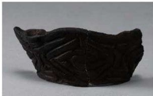
5 H-5出土土器 (第140图12)