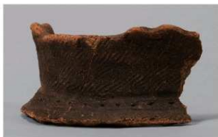
8 H-7出土土器 (第280图56)