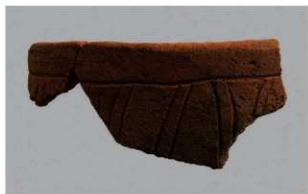
3 1-6出土土器 (第367图307)