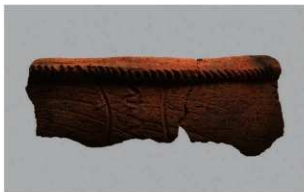
3 | -6 出土土器 (第 358 图 231)