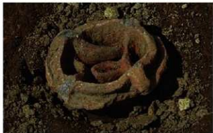
5 | - 6 第 459 图 2969 出土状况