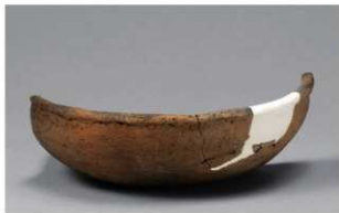
4 H-6出土土器 (第185图181)