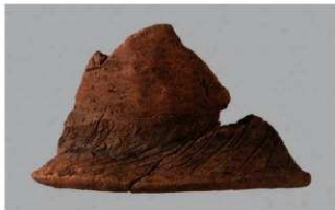
4 1-6出土土器 (第369图346)