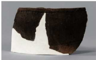
5 H-7出土土器 (第282图87)