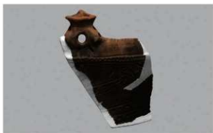
7 H-6出土土器 (第170图3)