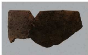
8 | -6 出土土器 (第 377 图 402)