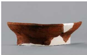
3 | -6 出土土器 (第 337 图 14)