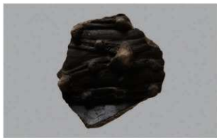
8 | -6 出土土器 (第 351 图 166)