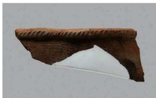
8 | -6 出土土器 (第 358 图 236)