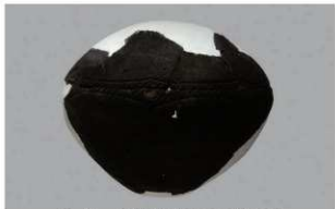
5 H-6出土土器 (第186图202)