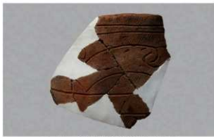
1 H-6 出土土器 (第 175 图 52)