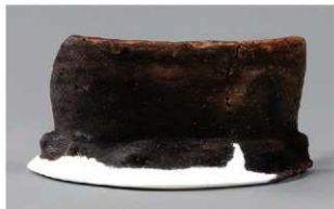
1 1-6出土土器 (第353图199)