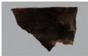
7 1-6出土土器 (第336图9)