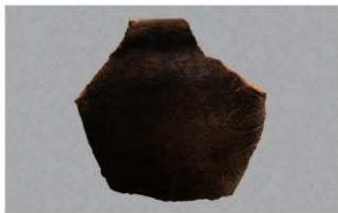
4 H-6出土土器 (第189图224)