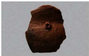
3 H-6出土土器 (第186图200)