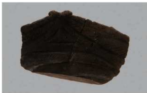
3 G-6出土土器 (第78图18)