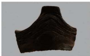
7 H-6出土土器 (第171图11)