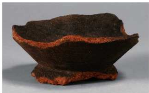
3 H-7出土土器 (第280图49)