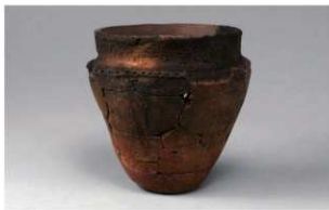
7 G-6出土土器 (第80图41)