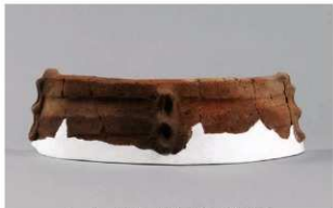
5 1-7出土土器 (第477图26)