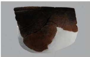
2 1-5 出土土器 (第 324 图 18)