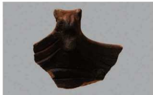
6 1-6出土土器 (第365图292)