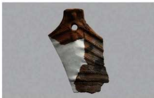
1 H-7出土土器 (第275图5)