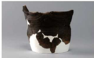
6 H-6出土土器 (第173图33)