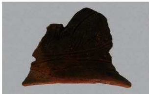
5 H-6 出土土器 (第 178 图 97)