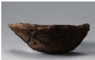
7 H-5 出土土器 (第 141 图 29)