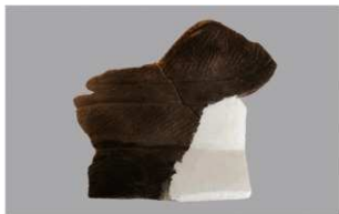
4 H-6 出土土器 (第 178 图 96)