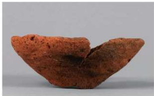
3 1-6出土土器 (第369图345)