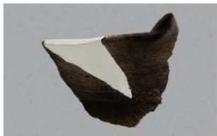
4 G-6出土土器 (第77图2)