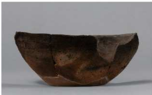
6 G-6出土土器 (第78图21)