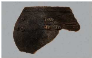
4 | -6 出土土器 (第344图87)