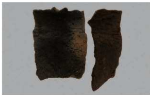
3 F-5出土土器 (第22图27)