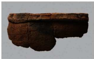
8 H-6出土土器 (第190图231)