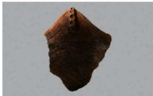
6 | -6 出土土器 (第 338 图 36)