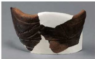
3 H-7出土土器 (第276图15)