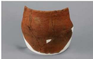
5 H-6 出土土器 (第 175 图 56)