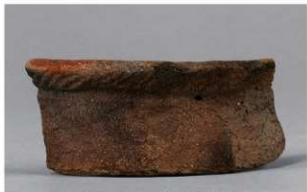
5 F-5出土土器 (第22图20)