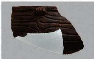
7 1-7出土土器 (第477图28)