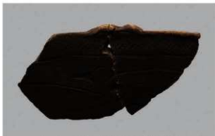
2 | -6 出土土器 (第 347 图 120)