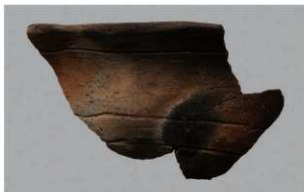
2 H-7 出土土器 (第 280 图 59)