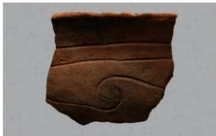
5 | - 6 出土土器 (第 366 图 300)