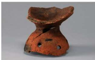
6 H-7 出土土器 (第 280 图 63)