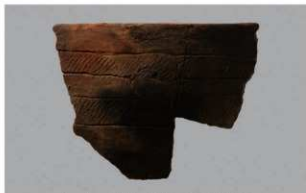
2 H-7出土土器 (第279图48)