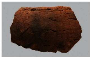
4 I-6出土土器 (第375图388)