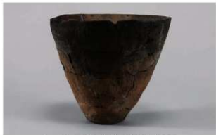
5 G-6出土土器 (第86图100)