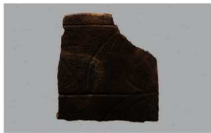
8 1-6出土土器 (第355图208)