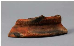
8 G-5 出土土器 (第 52 图 22)