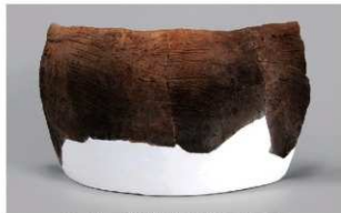
6 1-6出土土器 (第357图223)