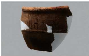
3 1-7 出土土器 (第 482 图 87)