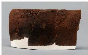
6 I-6出土土器 (第375图391)