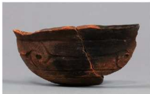
2 | -6 出土土器 (第 348 图 136)