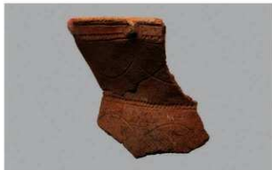
5 H-6出土土器 (第171图9)