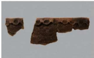
5 G-6出土土器 (第84图82)