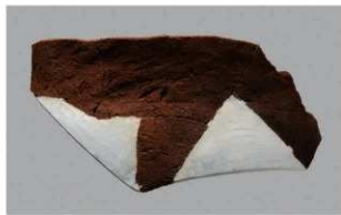
8 1-6出土土器 (第377图410)