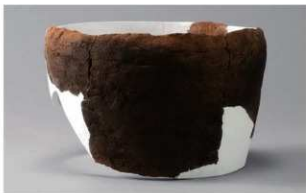
4 H-6出土土器 (第192图246)