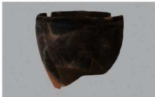
5 G-6出土土器 (第79图30)