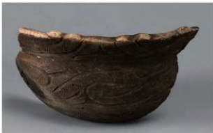
6 H-7 出土土器 (第 279 图 44)