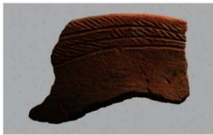
2 1-6出土土器 (第339图42)