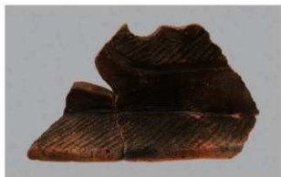
1 1-6出土土器 (第352图183)