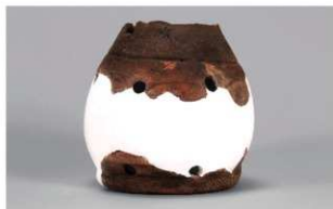
2 1-6出土土器 (第351图168)