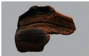
4 1-7 出土土器 (第 481 图 69)