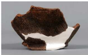
3 1-7 出土土器 (第 479 图 50)