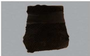
6 F-5出土土器 (第22图21)