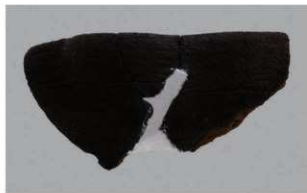
4 J-6出土土器 (第557图35)