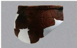
5 1-6出土土器 (第365图291)