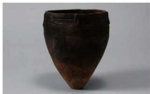
5 1-5出土土器 (第323图13)