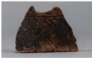
2 | -6 出土土器 (第 338 图 32)