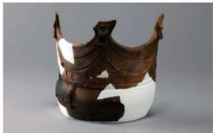
5 H-6出土土器 (第173图32)