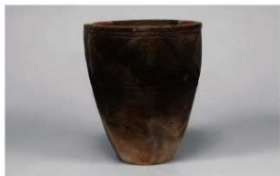
1 1-6出土土器 (第345图93)