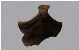
2 | -6 出土土器 (第340图52)