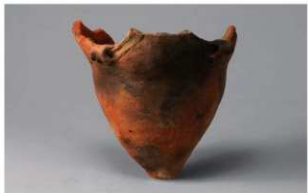
1 H-6出土土器 (第171图12)