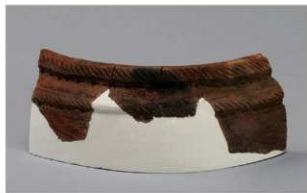
8 H-6出土土器 (第175图51)