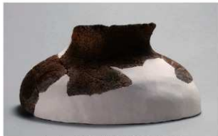
6 | -6 出土土器 (第 353 图 196)