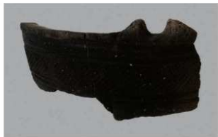
3 H-6出土土器 (第176图62)