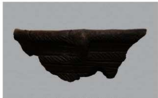
5 H-6出土土器 (第177图71)