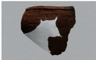
6 | - 6 出土土器 (第 373 图 376)