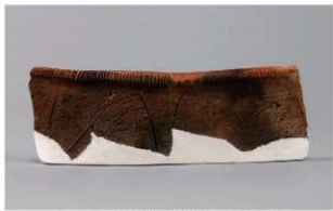
1 1-6出土土器 (第362图 271)