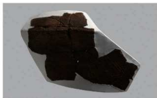
8 H-6出土土器 (第170图4)