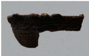
5 H-5 出土土器 (第 141 图 27)