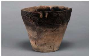
5 H-6出土土器 (第183图149)