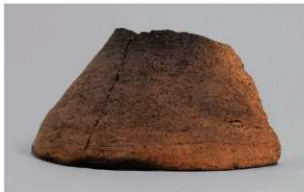
5 G-6出土土器 (第84图73)