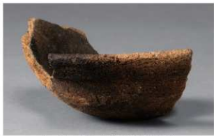
1 H-5出土土器 (第141图31)