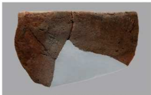
1 1-6出土土器 (第377图403)