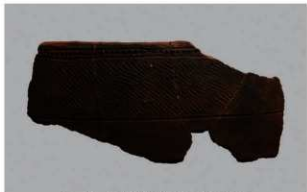
5 H-5出土土器 (第139图4)