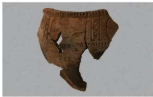
2 | - 6 出土土器 (第 361 图 263)