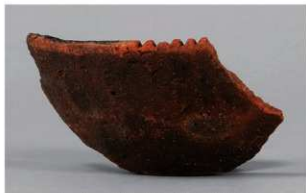
2 | -6 出土土器 (第 368 图 315)