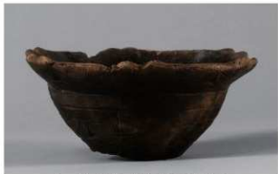
5 H-6出土土器 (第178图89)