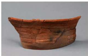
7 G-6出土土器 (第78图13)