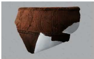
3 1-6出土土器 (第361图256)