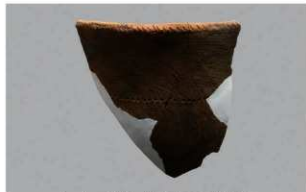
6 | -6 出土土器 (第 356 图 214)