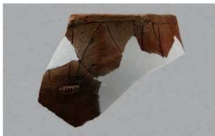
3 | -6 出土土器 (第 346 图 104)