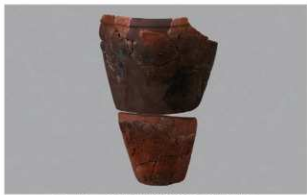
1 H-6出土土器 (第191图242)