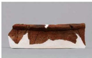
8 1-7 出土土器 (第 483 图 92)