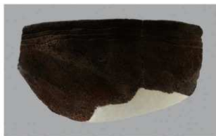
8 H-5出土土器 (第142图43)