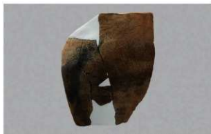
1 | -6 出土土器 (第 376 图 395)