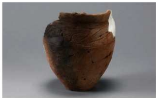
3 H-6出土土器 (第175图46)