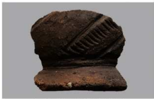
1 G-6出土土器 (第83图69)