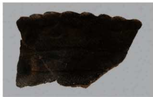
8 H-7出土土器 (第277图21)