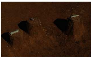
7 J-7 出土状况 (左: 第 662 图 1497 中央: 第 656 图 1432 右: 第 662 图 1497)