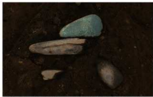
2 H-6 第 259 图 2004 · 第 271 图 2143 出土状况