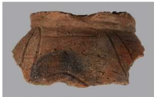
6 1-7 出土土器 (第 481 图 71)