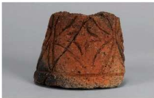
4 G-6出土土器 (第84图72)