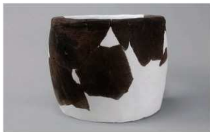
4 | - 6 出土土器 (第 372 图 372)