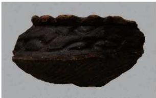
6 H-7 出土土器 (第 281 图 80)