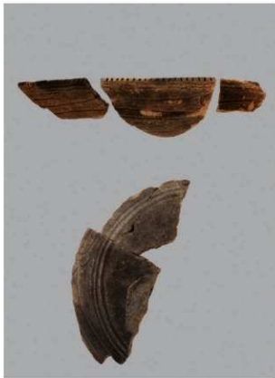
5 G-6出土土器 (第78图19)