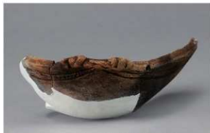
1 H-6出土土器 (第185图166)