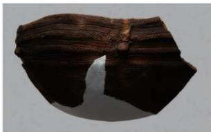
4 | -6 出土土器 (第 346 图 105)