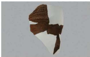
3 G-5出土土器 (第51图6)