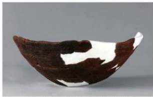
2 H-6 出土土器 (第 178 图 94)