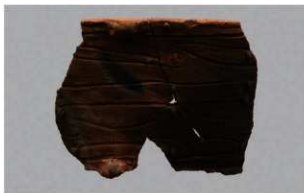
3 H-7 出土土器 (第 281 图 77)