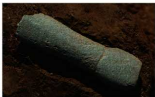
8 J-7 第 662 图 1497 出土状况