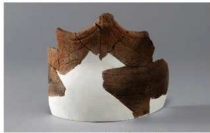
2 H-6出土土器 (第174图45)