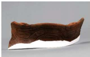
4 1-7出土土器 (第480图60)