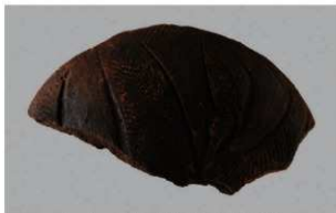
1 | -6 出土土器 (第 348 图 135)