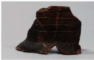
1 | -6 出土土器 (第 353 图 191)