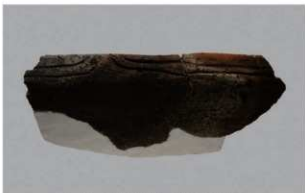
2 H-7 出土土器 (第 279 图 40)