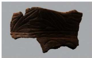
1 H-6出土土器 (第182图137)