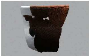
5 | -6 出土土器 (第 356 图 213)