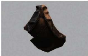
4 I-5出土土器 (第322图5)