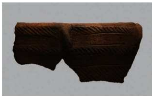
3 | - 6 出土土器 (第 342 图 69)