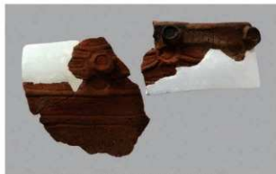
2 1-6出土土器 (第354图201)