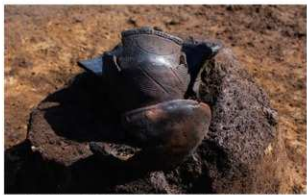
1 H-6第171图8·第185图177出土状况