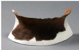
6 H-7出土土器 (第281图70)