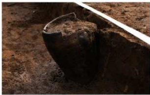
2 I-7 第 485 图 114 出土状况