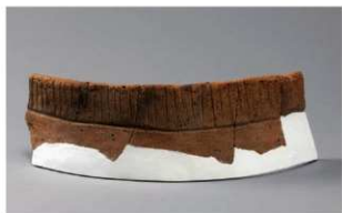
7 H-7出土土器 (第278图37)