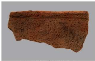
2 1-6出土土器 (第360图255)