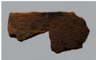
5 1-6出土土器 (第357图221)