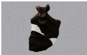
8 1-6出土土器 (第340图50)