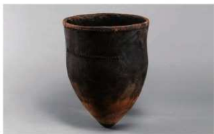
7 1-6出土土器 (第357图227)