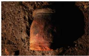
1 G-6 第 118 图 939 出土状况