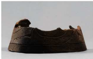
5 1-7 出土土器 (第 479 图 53)