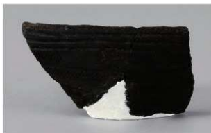
7 H-6出土土器 (第186图196)