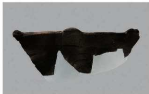
2 1-6出土土器 (第349图144)