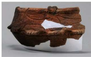
7 1-6出土土器 (第367图311)