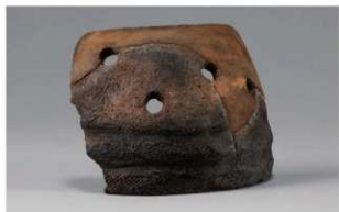
1 1-6出土土器 (第351图167)