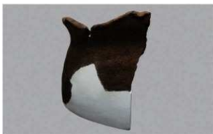
8 H-6出土土器 (第189图220)