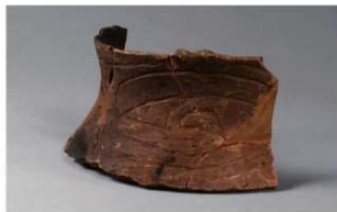
3 F-6出土土器 (第42图1)