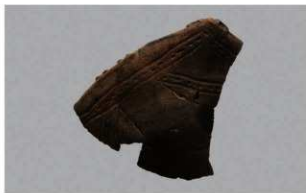
4 1-6出土土器 (第368图327)