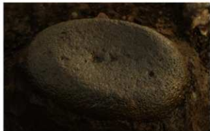
6 H-6 第 268 图 2108 出土状况