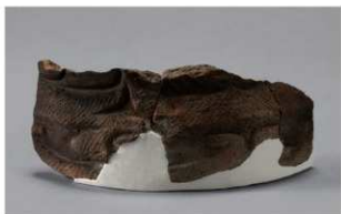
7 H-6出土土器 (第187图204)