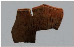
2 H-5出土土器 (第139图1)