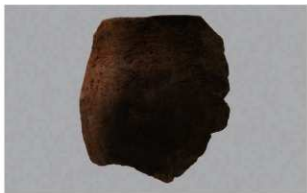
3 H-6出土土器 (第189图223)