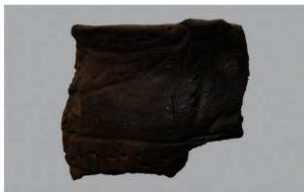
3 | -6 出土土器 (第364图281)