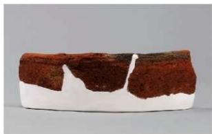
3 I-6出土土器 (第374图386)