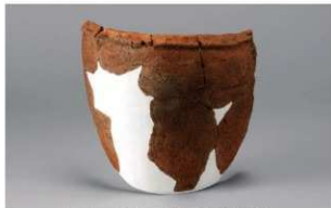
6 H-6出土土器 (第191图239)