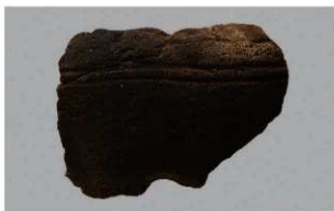
7 | - 6 出土土器 (第 370 图 358)