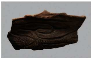
7 G-5出土土器 (第51图10)