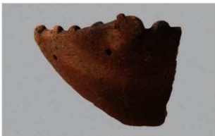
2 H-7 出土土器 (第 281 图 75)