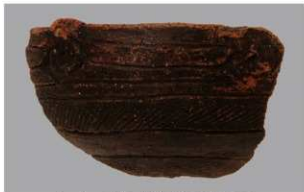
5 | -6 出土土器 (第 348 图 123)