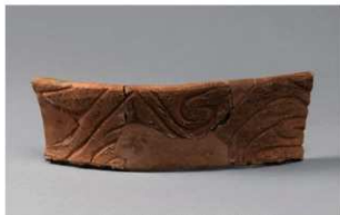
2 G-6出土土器 (第82图52)