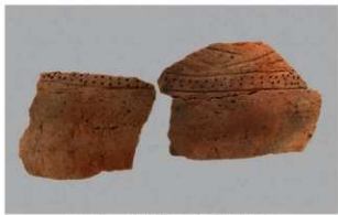
1 G-6出土土器 (第84图77)