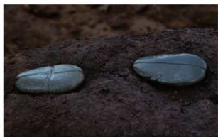
8 H-6 第 270 图 2130 · 2134 出土状况