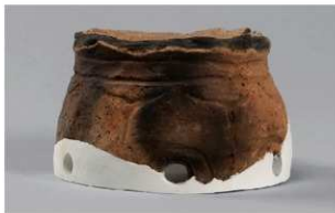
3 G-6出土土器 (第84图71)