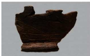
8 | -6 出土土器 (第 352 图 182)