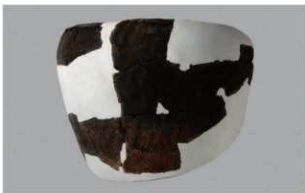
4 G-6出土土器 (第87图110)