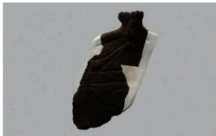
5 H-7出土土器 (第275图9)