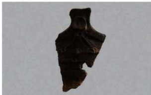
5 H-6出土土器 (第174图40)