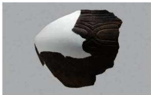
4 | -6 出土土器 (第 353 图 194)