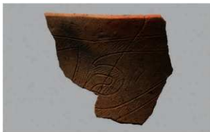
3 G-6出土土器 (第77图1)