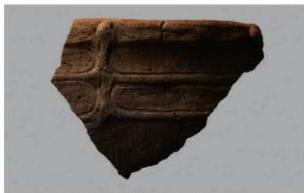
1 H-7 出土土器 (第 277 图 22)