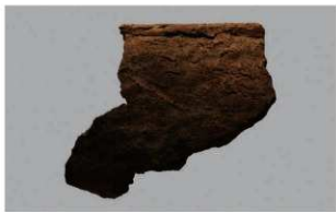
7 H-6出土土器 (第190图230)