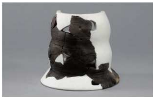
3 H-6 出土土器 (第 178 图 95)