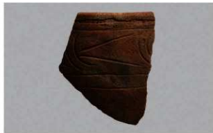
4 1-6出土土器 (第365图290)