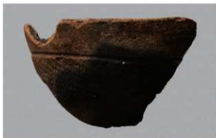
1 H-6 出土土器 (第 171 图 20)