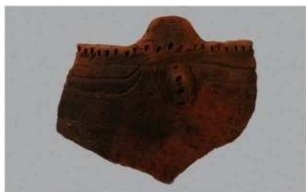
8 | -6 出土土器 (第364图286)