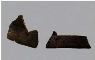
5 | -6 出土土器 (第 352 图 179)