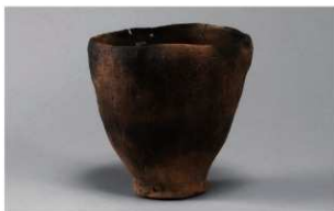
7 H-6出土土器 (第188图218)