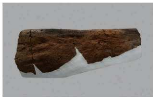
8 I-6出土土器 (第375图394)