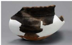
1 H-7出土土器 (第279图47)