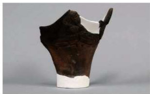
3 1-6出土土器 (第336图5)