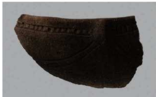
6 G-6出土土器 (第77图4)