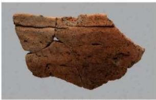
2 G-6出土土器 (第87图108)