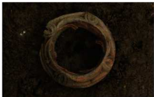
3 | - 6 第 459 图 2966 出土状况