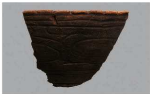
3 1-6出土土器 (第371图362)