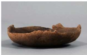
3 1-7 出土土器 (第 481 图 68)