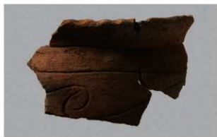
4 H-6出土土器 (第182图140)