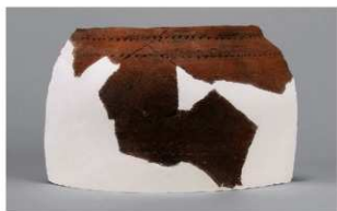
7 J-6出土土器 (第555图22)