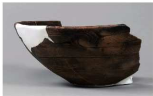
7 1-6出土土器 (第347图116)