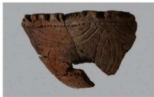
8 1-6出土土器 (第347图117)