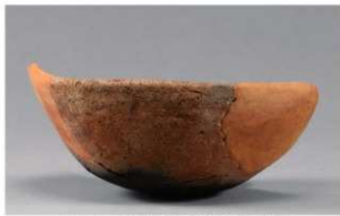
2 1-6出土土器 (第368图325)