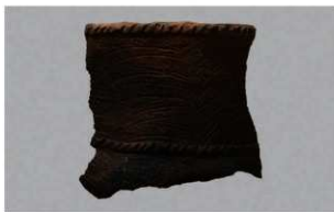
7 H-6 出土土器 (第 172 图 26)