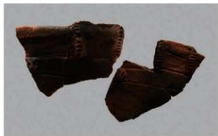
3 1-6出土土器 (第347图112)