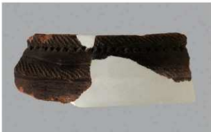
6 H-7 出土土器 (第 278 图 27)