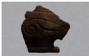
4 1-6出土土器 (第352图170)