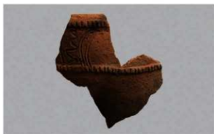
8 | - 6 出土土器 (第 362 图 270)