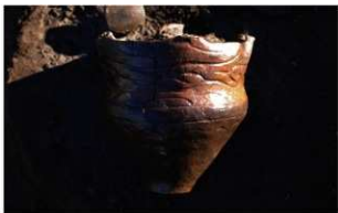
3 J-7 第 609 图 34 出土状况