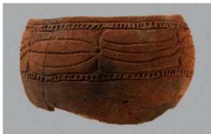
1 | - 6 出土土器 (第 371 图 368)