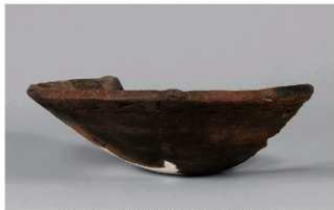
6 1-6出土土器 (第368图329)