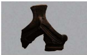
3 H-7出土土器 (第275图7)