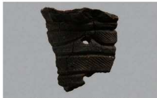
6 1-7 出土土器 (第 479 图 54)