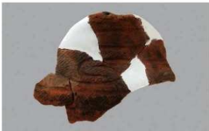
6 1-5 出土土器 (第 324 图 23)