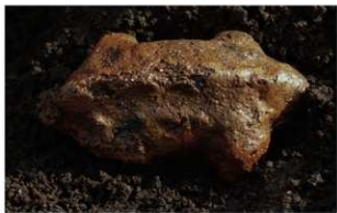
7 | - 6 第 462 图 2986 出土状况