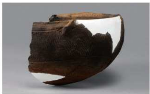
7 H-6出土土器 (第171图18)