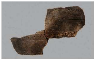
3 F-5出土土器 (第22图18)