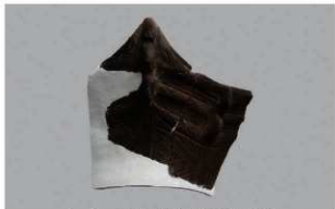
5 1-6出土土器 (第339图47)