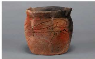
4 H-6出土土器 (第175图47)