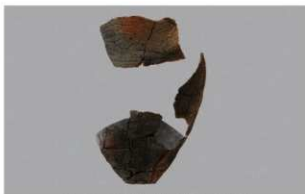
2 G-6出土土器 (第81图44)