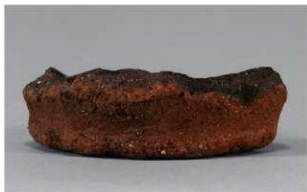
3 F-4出土土器 (第14图6)