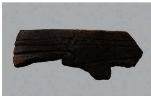
3 | -6 出土土器 (第 338 图 33)