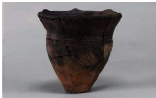
4 H-6出土土器 (第171图8)