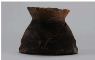
7 | -6 出土土器 (第 351 图 165)