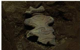
6 | - 6 第 460 图 2976 出土状况