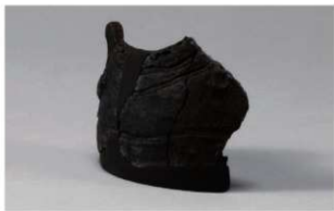
7 G-6出土土器 (第84图84)