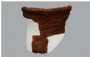
1 G-6出土土器 (第82图51)