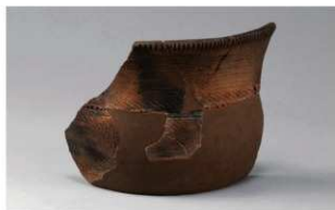
4 J-6出土土器 (第555图19)