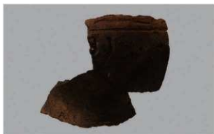
8 H-6出土土器 (第184图152)