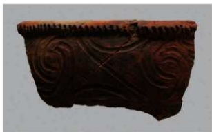
7 1-7出土土器 (第484图100)