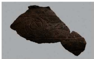
3 H-6出土土器 (第180图120)