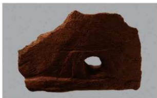
8 1-6出土土器 (第370图351)