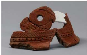
6 H-6 出土土器 (第 178 图 98)