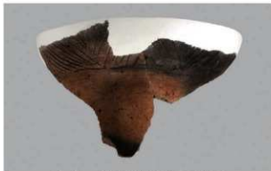
5 H-6 出土土器 (第 172 图 24)