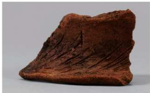
5 1-6出土土器 (第369图347)