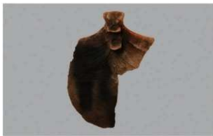
7 | -6 出土土器 (第341图57)