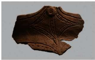
1 H-6出土土器 (第186图198)