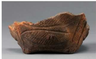
5 1-6出土土器 (第355图204)