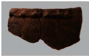
2 | -6 出土土器 (第 378 图 412)