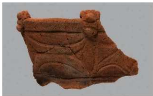
3 1-7出土土器 (第477图24)