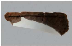
1 G-6出土土器 (第87图107)