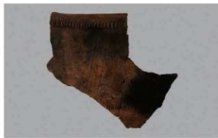
8 1-6出土土器 (第359图244)