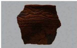
5 1-7出土土器 (第480图61)