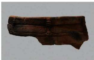
6 I-5出土土器 (第322图7)