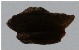
3 H-6出土土器 (第185图169)