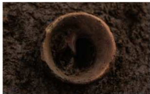
4 | - 6 第 459 图 2968 出土状况