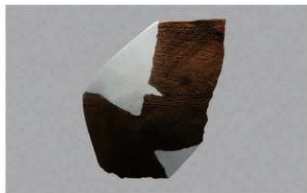
4 1-6出土土器 (第356图220)