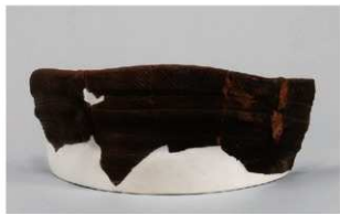
7 1-6出土土器 (第342图65)