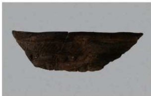
1 H-6出土土器 (第186图190)