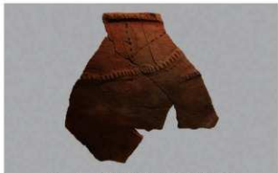
5 1-6出土土器 (第363图 275)