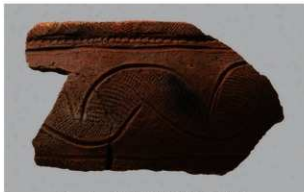
5 | -6 出土土器 (第345图88)