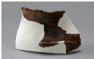
8 H-6 出土土器 (第 176 图 59)