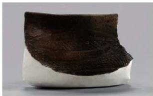
4 1-6出土土器 (第348图130)