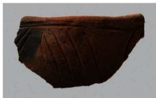
2 1-6出土土器 (第367图306)