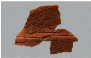
2 F-4出土土器 (第14图2)