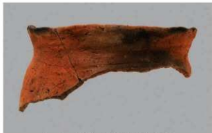
6 G-6出土土器 (第87图103)