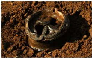
2 J-6 第 597 图 1132 出土状况