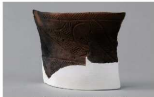
6 1-6出土土器 (第345图98)