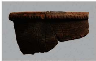
2 1-6出土土器 (第358图238)