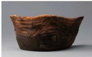
6 G-5出土土器 (第51图9)