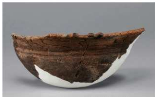
2 H-6出土土器 (第185图167)