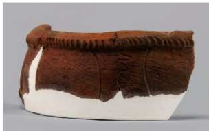
5 | -6 出土土器 (第 358 图 233)