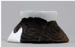
6 1-6出土土器 (第370图349)