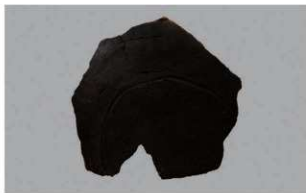
4 H-7出土土器 (第281图69)