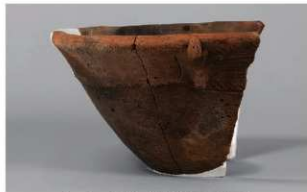
6 J-6出土土器 (第557图37)