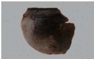
1 G-6出土土器 (第78图16)