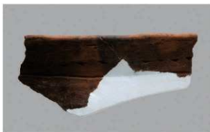
7 | -6 出土土器 (第364图285)