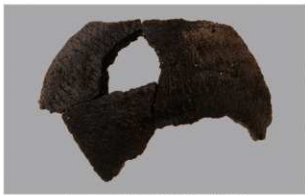
2 F-5出土土器 (第22图26)