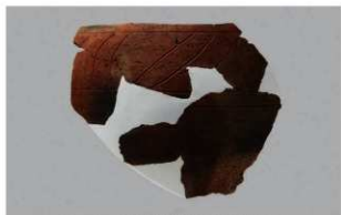
1 1-6出土土器 (第367图305)