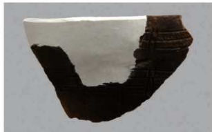
6 H-6出土土器 (第170图2)