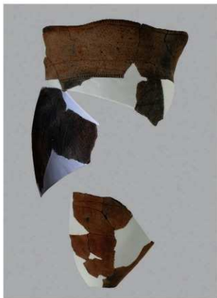
3 H-6出土土器 (第170图7)