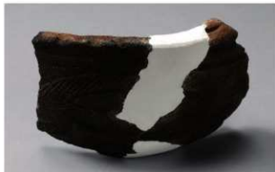
6 H-6出土土器 (第186图195)