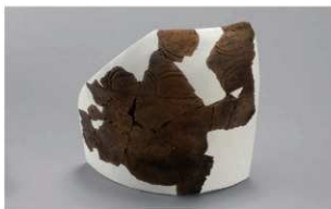
7 H-6出土土器 (第184图151)