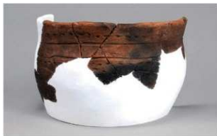
4 | -6 出土土器 (第364图282)