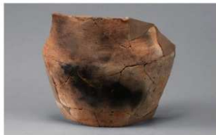
2 F-5出土土器 (第23图29)