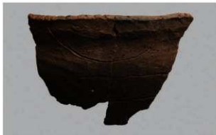
5 | -6 出土土器 (第 369 图 336)