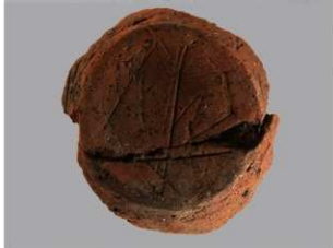
6 F-5出土土器 (第23图35)