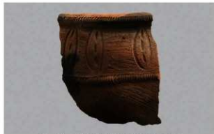
6 1-6出土土器 (第359图242)