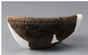
4 H-6出土土器 (第186图193)