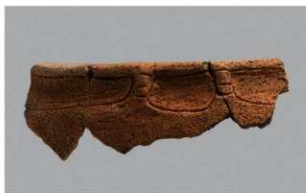
8 1-7出土土器 (第480图64)