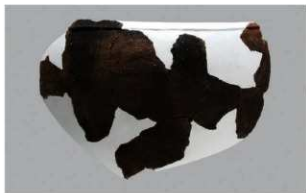
4 | -6 出土土器 (第 378 图 414)