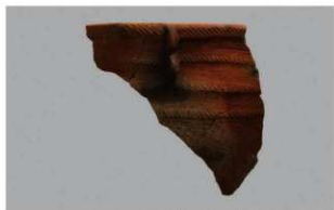
1 J-6出土土器 (第555图16)