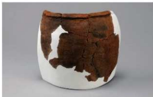
1 H-6出土土器 (第190图232)