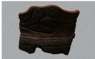
5 G-4出土土器 (第45图2)