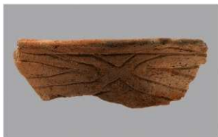
8 G-6出土土器 (第82图58)