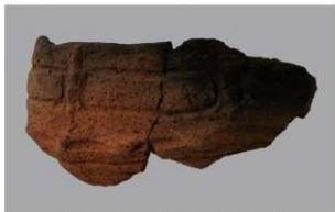
1 | -6 出土土器 (第 368 图 314)