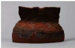
1 G-6出土土器 (第80图35)