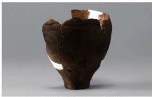
2 H-6出土土器 (第192图243)