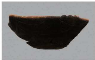
8 H-6出土土器 (第177图74)