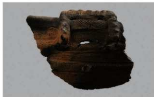
2 1-6出土土器 (第347图111)