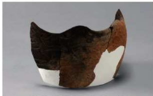
6 H-5出土土器 (第140图13)