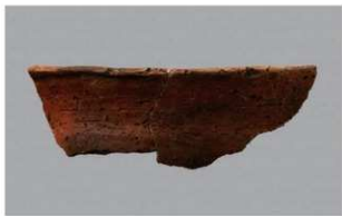
7 1-6出土土器 (第377图409)