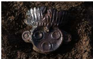
3 I-7 第 536 图 1539 出土状况