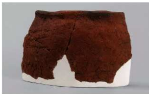
3 | - 6 出土土器 (第 372 图 370)