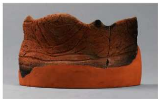
7 G-6出土土器 (第81图49)