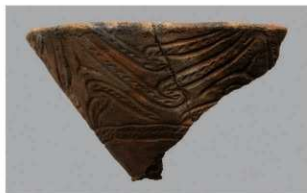
8 G-6出土土器 (第83图67)