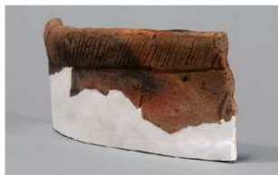
4 1-5出土土器 (第323图12)