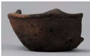
3 | -6 出土土器 (第 368 图 316)