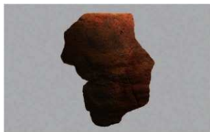
4 | -6 出土土器 (第 376 图 398)