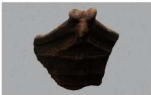
2 G-6出土土器 (第77图8)