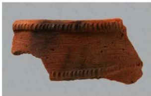
1 | -6 出土土器 (第 358 图 229)