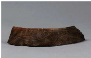
3 H-6 出土土器 (第 175 图 54)