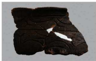
8 1-6出土土器 (第353图190)