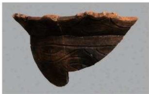
7 H-6出土土器 (第178图91)