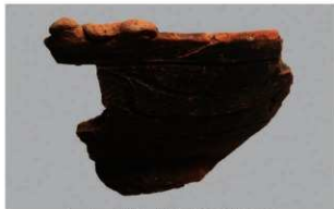
6 | -6 出土土器 (第 351 图 160)