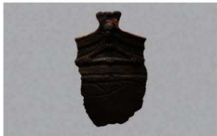
6 H-7出土土器 (第276图10)