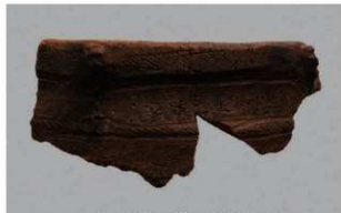
6 1-6出土土器 (第343图80)