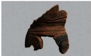
6 H-7出土土器 (第280图52)