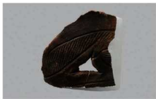
7 1-6出土土器 (第352图189)