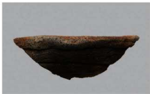
7 1-6出土土器 (第368图330)