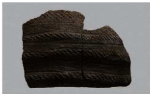
4 H-7出土土器 (第280图50)