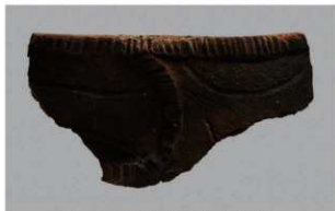
2 1-7 出土土器 (第 482 图 86)