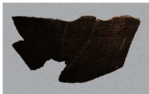
6 1-6出土土器 (第336图8)