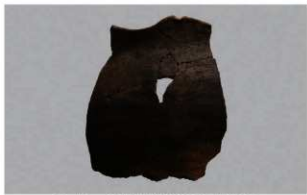
1 H-6出土土器 (第189图221)