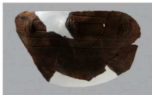
8 1-6出土土器 (第344图82)