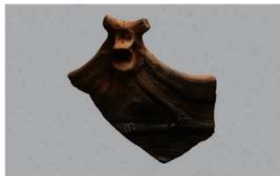
2 H-7出土土器 (第276图14)