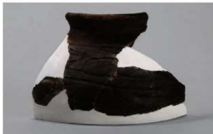
5 1-5 出土土器 (第 324 图 22)