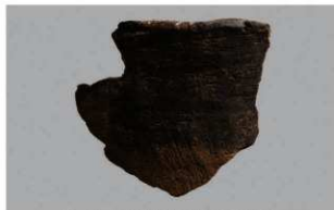
2 1-6出土土器 (第377图404)