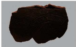
6 1-6出土土器 (第347图115)