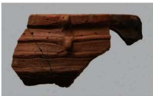
8 | - 6 出土土器 (第 343 图 74)