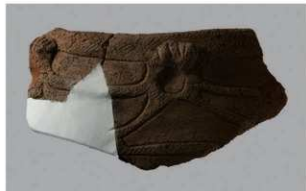
6 J-6 出土土器 (第 556 图 29)