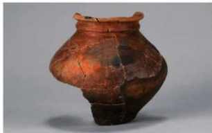
6 G-5 出土土器 (第 52 图 20)