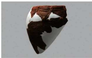
7 | - 6 出土土器 (第 366 图 302)