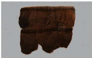
4 H-7 出土土器 (第 283 图 95)