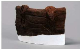
5 1-6出土土器 (第343图79)