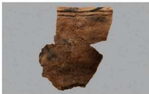
1 G-5出土土器 (第52图23)