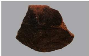
5 1-6出土土器 (第338图27)