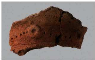
8 G-6出土土器 (第84图85)