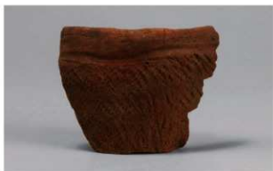
6 G-5出土土器 (第51图1)