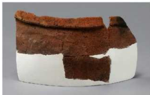
2 H-6出土土器 (第190图234)