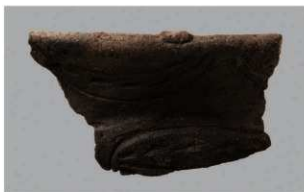
7 | -6 出土土器 (第 369 图 338)