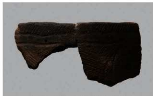
2 H-6出土土器 (第176图61)