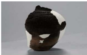
3 H-6出土土器 (第179图112)