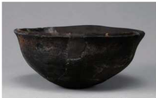
6 G-6出土土器 (第84图74)