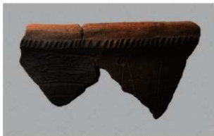
1 | -6 出土土器 (第 359 图 245)