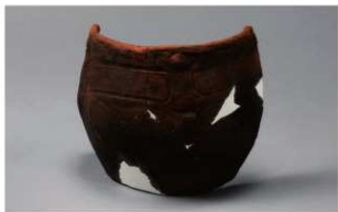
7 H-6出土土器 (第175图50)