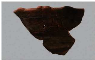
8 | -6 出土土器 (第 349 图 142)