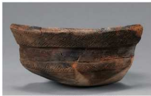
2 | -6 出土土器 (第 351 图 152)