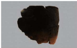
3 G-6出土土器 (第83图61)