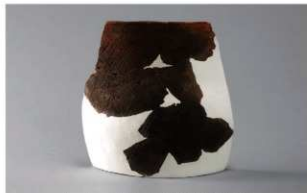
2 H-6出土土器 (第172图29)