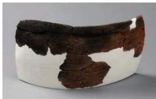
8 H-6出土土器 (第191图241)