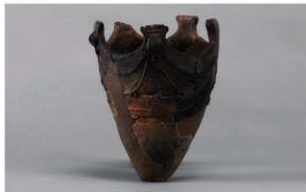
6 | -6 出土土器 (第341图56)