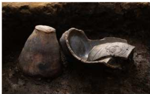
4 H-6第178图92·第188图218出土状况