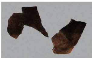
7 | -6 出土土器 (第 337 图 19)