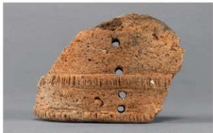
5 H-6出土土器 (第179图106)