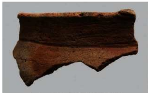
6 | - 6 出土土器 (第 366 图 301)