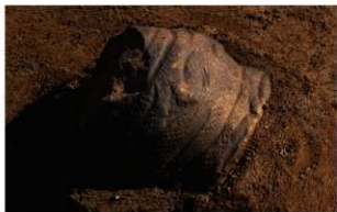
4 J-7 第 609 图 40 出土状况