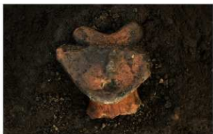
7 H-5 第 159 图 516 出土状况