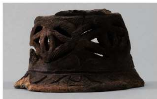
2 1-6出土土器 (第352图184)