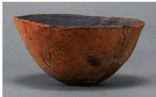
6 H-6出土土器 (第185图174)