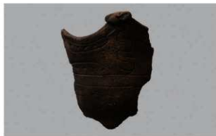
4 H-7出土土器 (第277图16)