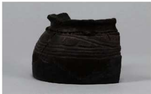
5 G-5 出土土器 (第 52 图 18)