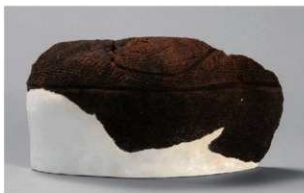
7 | -6 出土土器 (第 353 图 197)