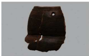
8 G-6出土土器 (第77图6)