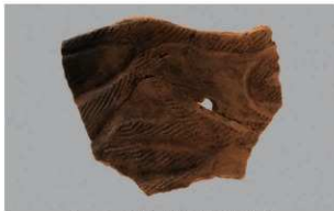
5 G-6出土土器 (第85图90)