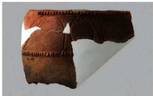
3 1-7出土土器 (第483图96)