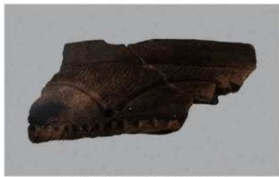
2 G-5出土土器 (第51图4)