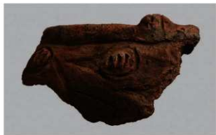
3 1-6出土土器 (第354图202)