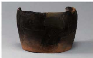
4 G-6出土土器 (第86图99)