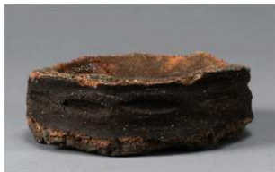
4 H-6出土土器 (第185图170)