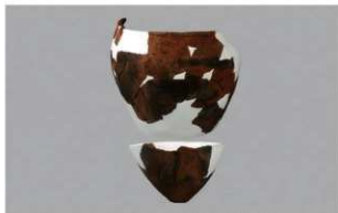
2 | - 6 出土土器 (第 372 图 369)