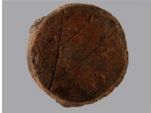
5 F-5出土土器 (第23图34)