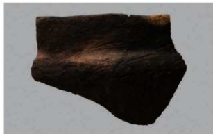
2 H-5出土土器 (第143图51)