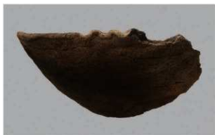
8 H-6出土土器 (第185图176)