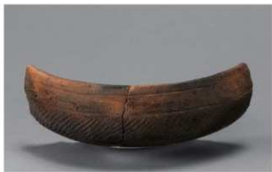
7 H-5出土土器 (第141图21)