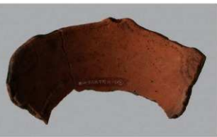
7 H-5出土土器 (第140图15)