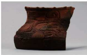
8 G-6出土土器 (第85图93)