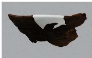
8 J-6出土土器 (第557图39)