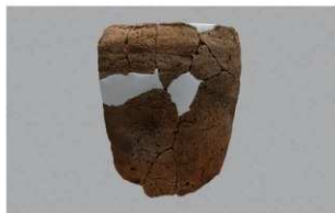
2 | -6 出土土器 (第 376 图 396)