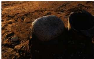
5 H-6 第 263 图 2051 出土状况