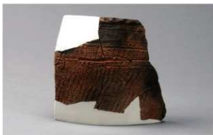
8 H-6 出土土器 (第 172 图 27)