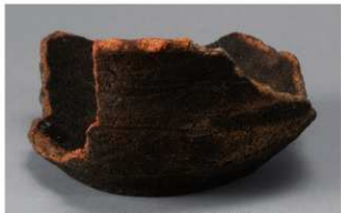
5 H-6出土土器 (第184图159)