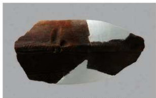
5 1-6出土土器 (第336图7)