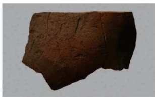
8 H-6出土土器 (第187图206)