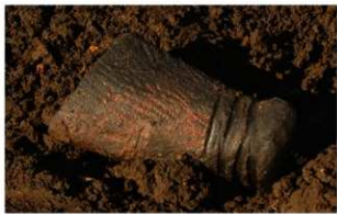
1 H-6 第 253 图 1949 出土状况