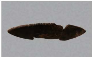
5 H-6出土土器 (第185图183)