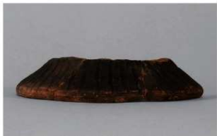
1 H-7出土土器 (第280图65)