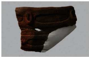
2 | -6 出土土器 (第344图84)