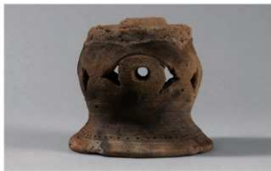
2 G-6出土土器 (第79图26)