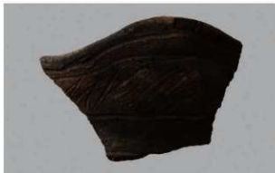
5 | -6 出土土器 (第 337 图 16)