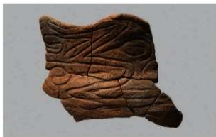
3 H-5出土土器 (第140图10)