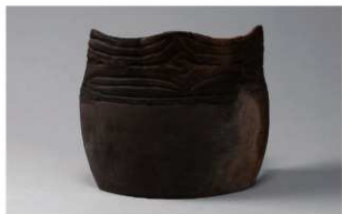
3 G-6出土土器 (第81图45)