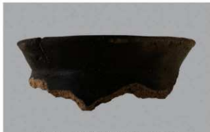
6 H-6出土土器 (第190图229)