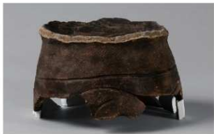
3 G-6出土土器 (第79图27)