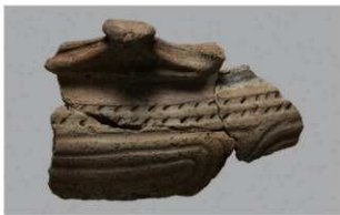
8 F-5出土土器 (第22图24)