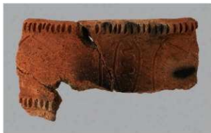
4 | -6 出土土器 (第 358 图 232)