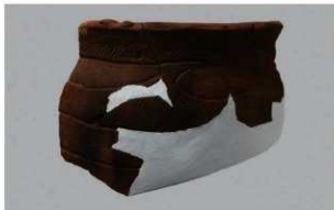
5 J-6 出土土器 (第 556 图 28)