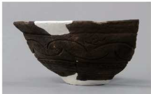
5 1-6出土土器 (第350图147)