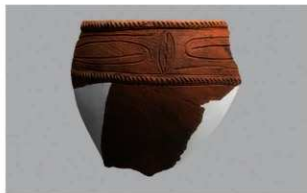
4 1-6出土土器 (第359图240)