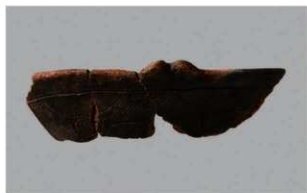
8 1-7 出土土器 (第 478 图 39)