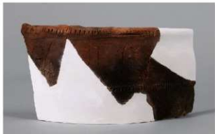
5 1-7出土土器 (第483图98)