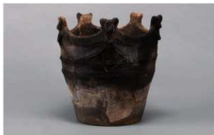
4 | -6 出土土器 (第340图54)