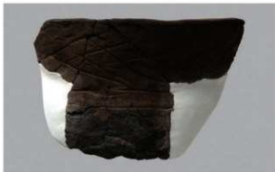
6 | -6 出土土器 (第 337 图 17)