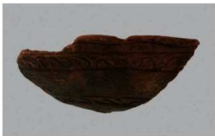
4 H-6出土土器 (第184图158)