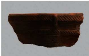
5 | - 6 出土土器 (第 343 图 71)