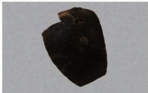
6 1-6出土土器 (第348图132)