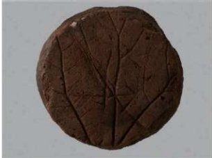
6 G-6出土土器 (第88图121)