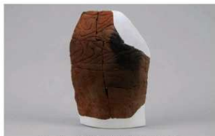
6 1-6出土土器 (第367图310)