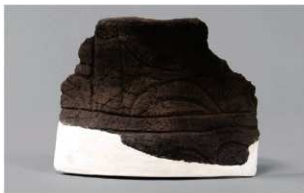
3 | - 6 出土土器 (第 366 图 297)