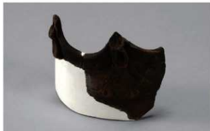
6 H-6出土土器 (第174图41)