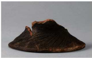
2 F-5出土土器 (第22图16)