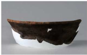
1 G-7出土土器 (第135图1)