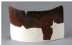
8 H-7出土土器 (第278图38)