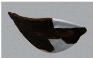
7 J-6出土土器 (第557图38)