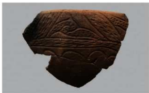
7 G-6出土土器 (第83图66)