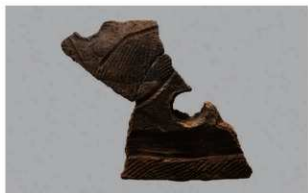
5 1-6出土土器 (第352图171)