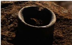
5 J-7 第 656 图 1432 出土状况