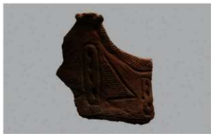
8 | -6 出土土器 (第341图58)