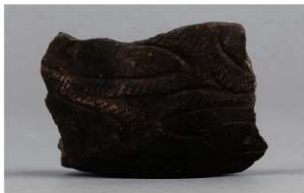
3 G-6出土土器 (第85图88)