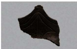
6 H-6出土土器 (第182图135)