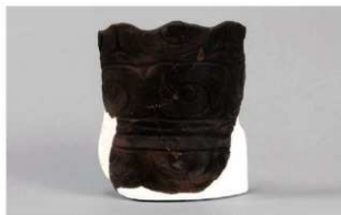
2 1-6出土土器 (第341图60)