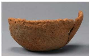
7 H-6出土土器 (第185图175)