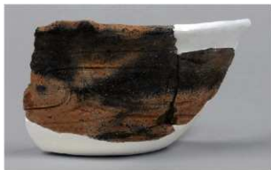
4 | -6 出土土器 (第 369 图 335)