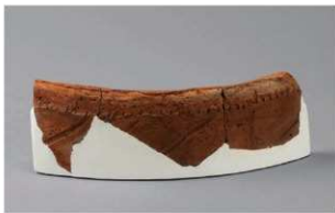
8 H-7 出土土器 (第 284 图 99)