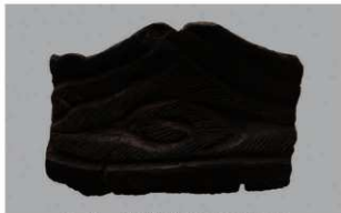
6 H-6出土土器 (第187图203)