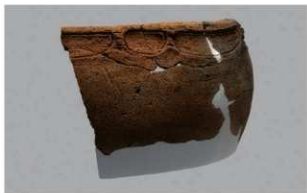
3 J-6出土土器 (第557图34)