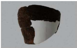
4 H-5出土土器 (第140图18)