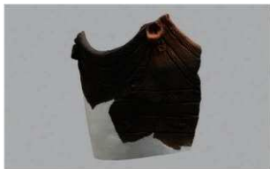
4 H-6出土土器 (第174图39)