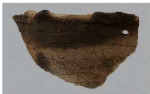
8 | -6 出土土器 (第 369 图 340)