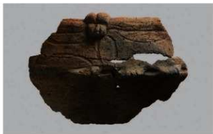
3 H-7出土土器 (第280图67)