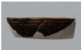
8 H-6出土土器 (第186图197)