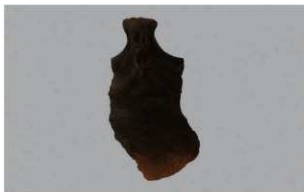
3 H-6出土土器 (第173图38)