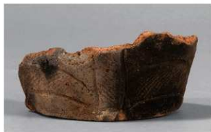
8 1-7 出土土器 (第 479 图 56)