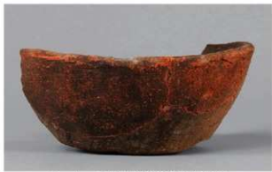
1 1-6出土土器 (第368图323)