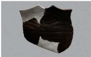
5 H-6出土土器 (第182图134)