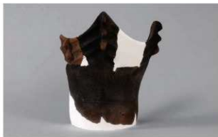
4 1-6出土土器 (第339图46)