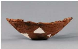
4 1-6出土土器 (第371图363)