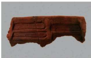
7 | - 6 出土土器 (第 343 图 73)