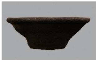
1 1-6出土土器 (第347图110)