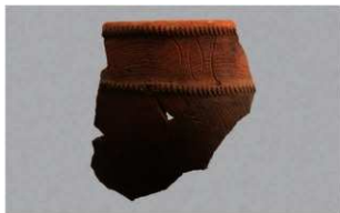
4 1-7 出土土器 (第 482 图 88)