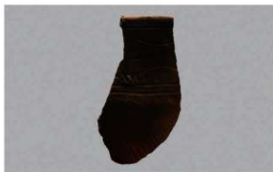
8 | -6 出土土器 (第345图92)