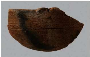
6 | -6 出土土器 (第 348 图 124)