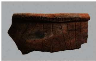
1 1-6出土土器 (第360图254)