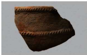
2 | -6 出土土器 (第 358 图 230)