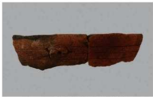
1 1-6出土土器 (第348图127)