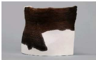
2 | -6 出土土器 (第364图280)