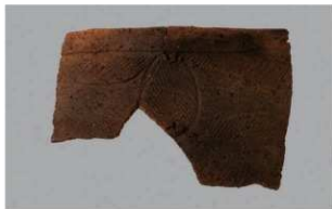
4 H-6 出土土器 (第 175 图 55)