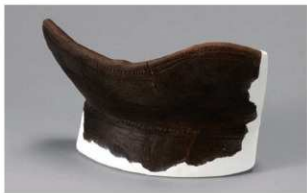
3 H-5出土土器 (第139图2)