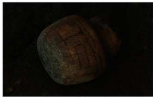
2 G-6 第 131 图 1089 出土状况