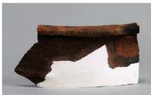
7 1-7 出土土器 (第 482 图 91)