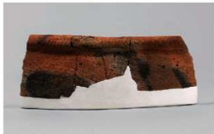
6 | -6 出土土器 (第 358 图 234)