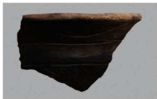
2 H-6出土土器 (第180图119)