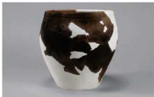
1 J-6出土土器 (第557图32)