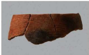
6 G-6出土土器 (第79图31)