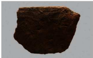
5 1-6出土土器 (第377图407)