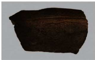
8 1-6出土土器 (第338图30)