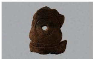
5 1-6出土土器 (第352图187)