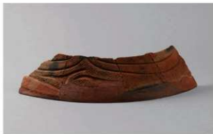
4 G-6出土土器 (第79图28)