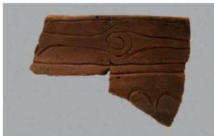
3 G-6出土土器 (第82图53)