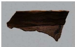
5 H-6出土土器 (第182图141)