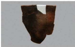
1 H-6出土土器 (第181图126)