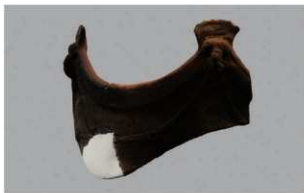
3 | -6 出土土器 (第340图53)