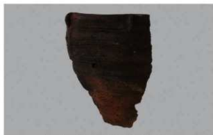
2 J-6出土土器 (第555图17)