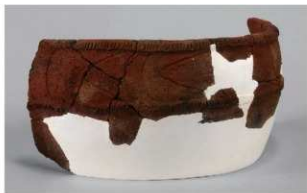
4 1-6出土土器 (第363图 274)