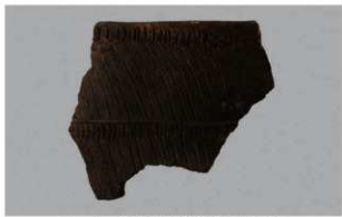
1 1-6出土土器 (第356图217)