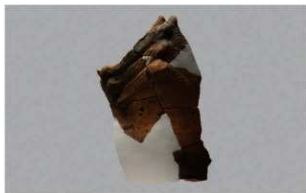
4 H-7出土土器 (第275图8)