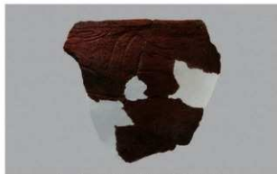
2 J-6出土土器 (第557图33)