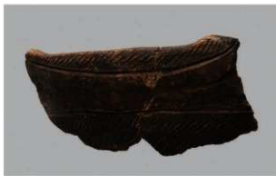
7 | -6 出土土器 (第 348 图 125)