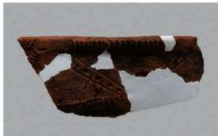
6 1-7出土土器 (第483图99)