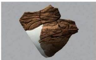
5 F-5出土土器 (第21图2)