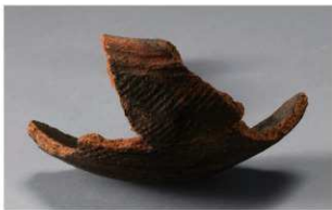
8 H-5出土土器 (第141图22)