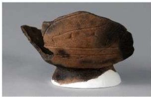
1 H-6 出土土器 (第 178 图 93)