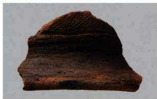
4 1-6出土土器 (第352图186)