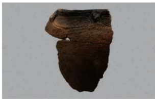
7 H-7 出土土器 (第 283 图 98)