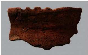
5 H-6出土土器 (第190图228)