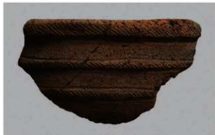
6 | -6 出土土器 (第345图89)