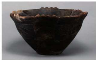
4 1-6出土土器 (第350图146)