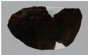
5 | -6 出土土器 (第 353 图 195)