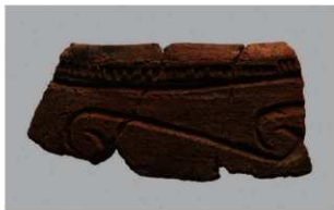
4 1-6出土土器 (第361图257)