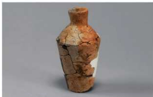
1 H-7 出土土器 (第 281 图 72)