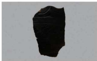
1 1-6出土土器 (第341图59)