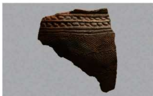
8 | - 6 出土土器 (第 370 图 359)