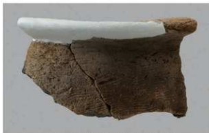
1 H-7 出土土器 (第 280 图 57)