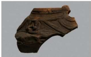
6 H-6出土土器 (第179图107)