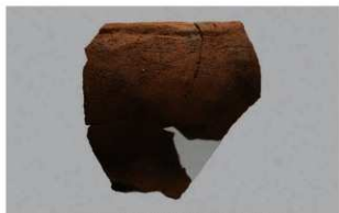
1 I-6出土土器 (第373图379)