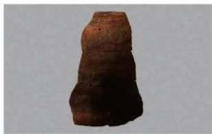
7 I-6出土土器 (第375图393)