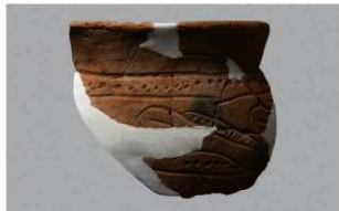
6 H-7出土土器 (第278图35)