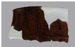
4 H-6出土土器 (第180图121)