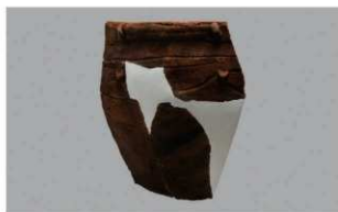
8 J-6出土土器 (第556图23)