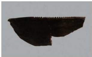
3 H-6出土土器 (第185图180)