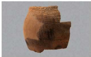
4 G-6出土土器 (第83图62)