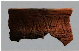
1 H-6出土土器 (第183图145)