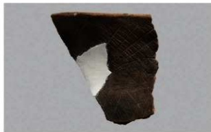
4 H-6出土土器 (第172图31)