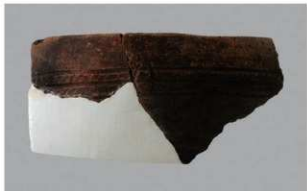
5 H-6出土土器 (第170图1)