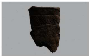
4 1-6出土土器 (第336图6)