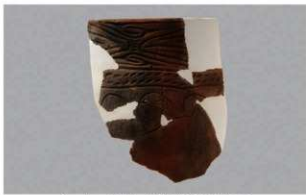
2 H-5出土土器 (第140图16)