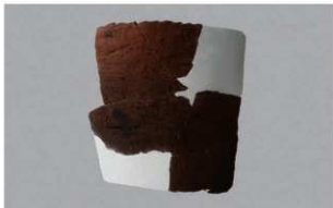
6 H-6出土土器 (第188图217)