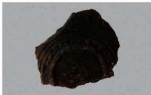
2 H-6出土土器 (第178图86)