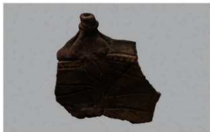
2 I-5出土土器 (第322图1)