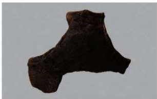
4 H-5出土土器 (第139图3)