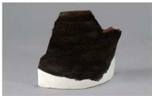
7 H-7出土土器 (第277图20)