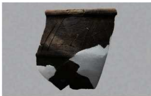
3 H-7 出土土器 (第 283 图 94)