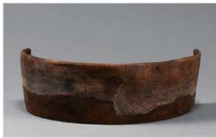
2 1-6出土土器 (第337图24)