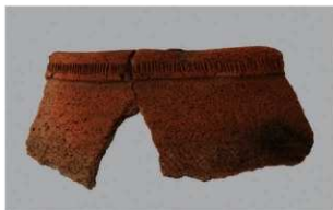
8 | -6 出土土器 (第 360 图 253)