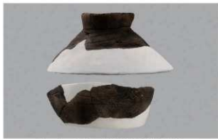
2 | -6 出土土器 (第 353 图 192)