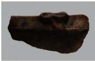
1 | -6 出土土器 (第 338 图 31)