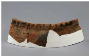
4 H-7出土土器 (第284图 105)