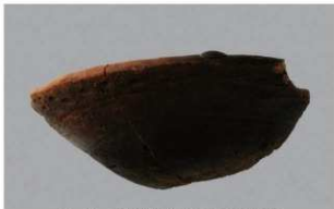
6 H-6出土土器 (第184图160)