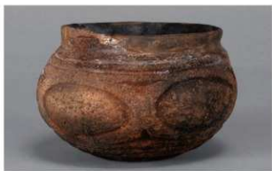
7 H-5出土土器 (第142图42)