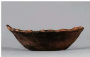
1 1-6出土土器 (第349图143)