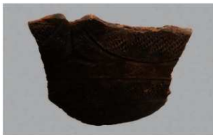
3 | -6 出土土器 (第 347 图 121)