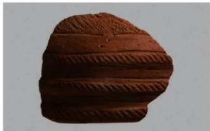
5 H-7出土土器 (第280图51)