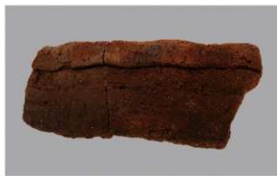
8 1-5出土土器 (第323图16)