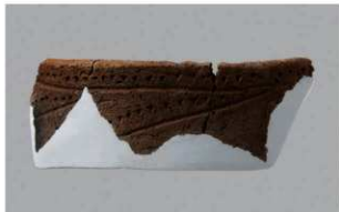
6 | -6 出土土器 (第364图284)