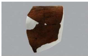
3 | -6 出土土器 (第 376 图 397)