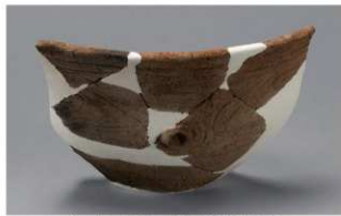
2 H-5出土土器 (第141图35)