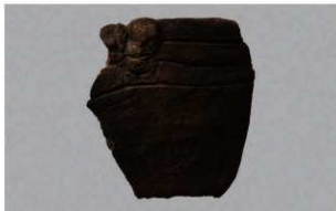
5 | -6 出土土器 (第 346 图 106)