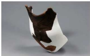
1 H-7出土土器 (第276图13)