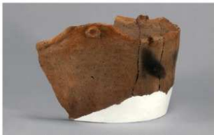
2 H-6出土土器 (第171图13)