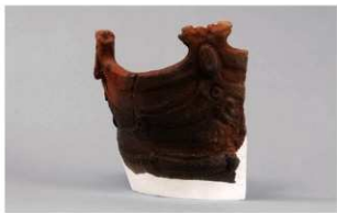
7 1-6出土土器 (第340图49)