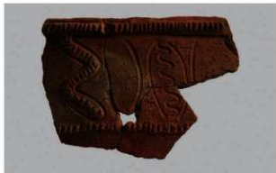
6 1-6出土土器 (第363图 276)