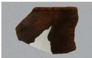
8 H-7出土土器 (第285图 109)