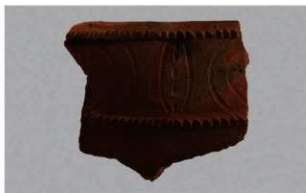
8 1-6出土土器 (第361图261)