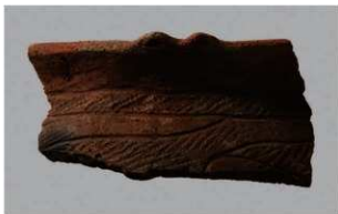
4 H-6出土土器 (第179图113)