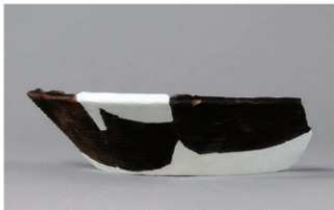
6 H-6出土土器 (第171图17)