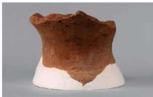
3 1-5 出土土器 (第 324 图 20)