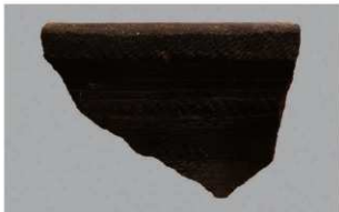
6 | -6 出土土器 (第 346 图 107)