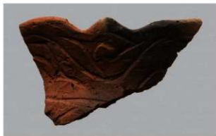
4 H-5出土土器 (第140图11)