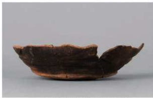
1 1-7 出土土器 (第 479 图 48)