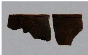
4 H-7出土土器 (第282图86)