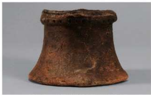
1 F-5出土土器 (第22图15)