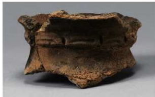
5 H-6出土土器 (第185图171)