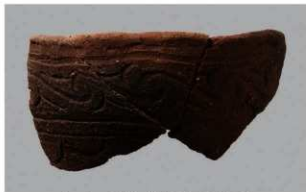
6 1-7出土土器 (第480图62)