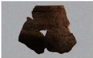
3 1-6出土土器 (第365图289)