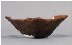
2 | -6 出土土器 (第 369 图 333)