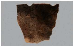
5 G-6出土土器 (第82图55)