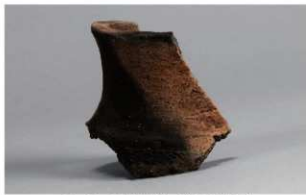
2 G-6出土土器 (第84图79)