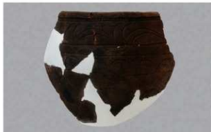
6 | -6 出土土器 (第 360 图 251)