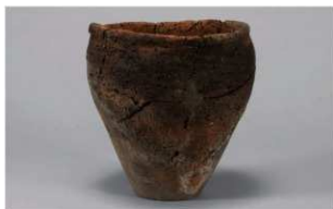
8 | - 6 出土土器 (第 373 图 378)