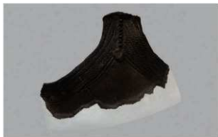
4 | -6 出土土器 (第 338 图 34)