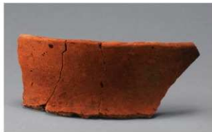
4 H-5出土土器 (第143图54)