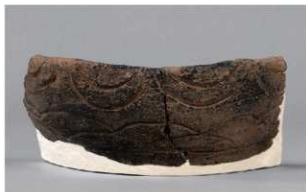
4 | -6 出土土器 (第 368 图 317)