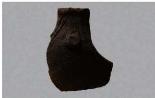
5 | -6 出土土器 (第 338 图 35)