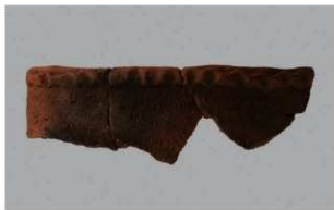
4 1-6出土土器 (第338图26)