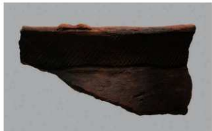
5 H-7出土土器 (第278图34)