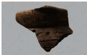
1 1-6出土土器 (第336图3)