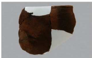
7 H-7出土土器 (第285图 108)