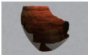
5 | -6 出土土器 (第 376 图 399)