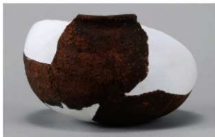
1 | - 6 出土土器 (第 370 图 352)