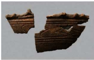
2 G-6出土土器 (第85图87)