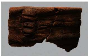
7 | -6 出土土器 (第345图90)