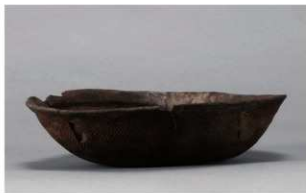
4 H-6出土土器 (第178图88)