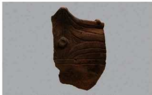
6 G-6出土土器 (第84图83)