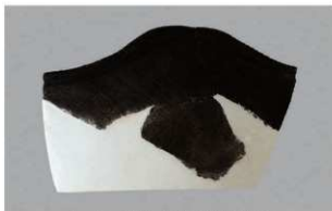
1 H-6出土土器 (第170图5)