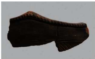
4 | -6 出土土器 (第 337 图 15)