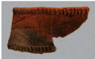
6 | - 6 出土土器 (第 362 图 268)