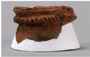
1 1-6出土土器 (第369图342)