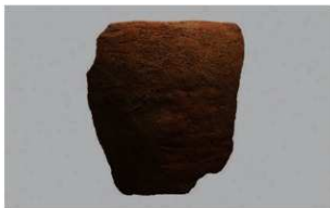
3 H-6出土土器 (第187图210)