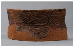
7 G-6出土土器 (第82图57)