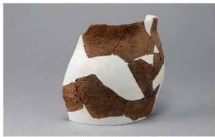
2 H-6出土土器 (第189图222)