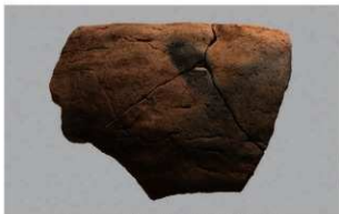
2 H-6出土土器 (第187图209)