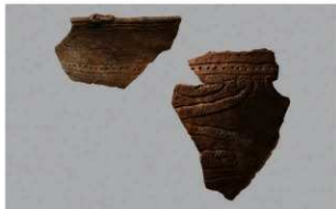
6 | - 6 出土土器 (第 370 图 357)