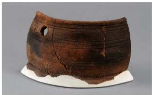
3 H-6出土土器 (第171图14)