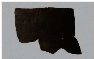
6 H-6出土土器 (第180图123)