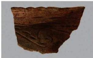
5 | -6 出土土器 (第364图283)