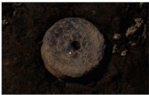
1 J-6 第 596 图 1126 出土状况