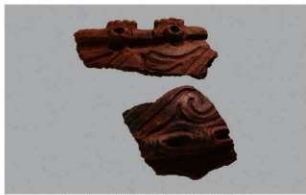
2 1-7出土土器 (第480图58)