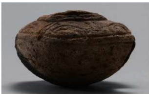
4 1-5 出土土器 (第 324 图 21)