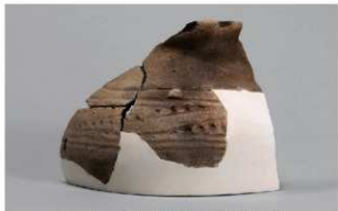
5 1-6出土土器 (第371图364)