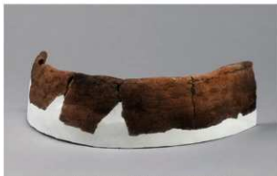
1 H-6出土土器 (第187图207)