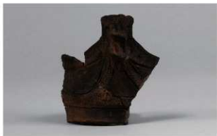
3 G-6出土土器 (第77图9)