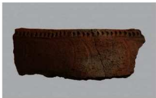
3 1-6出土土器 (第362图 273)