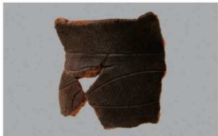
5 G-6出土土器 (第78图11)