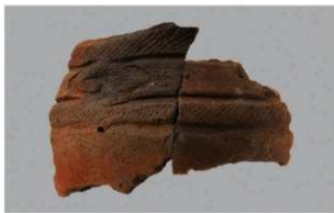
7 G-6出土土器 (第85图92)