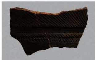
4 H-6出土土器 (第176图64)