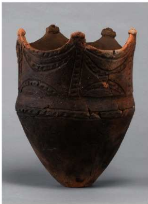
3 H-6出土土器 (第181图132)