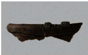
3 J-6 出土土器 (第 556 图 26)