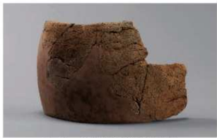
1 G-6出土土器 (第86图95)