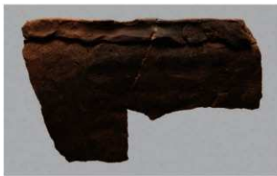
7 H-6出土土器 (第191图240)