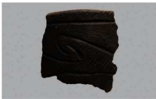
8 H-5出土土器 (第139图7)