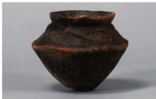
1 H-6出土土器 (第179图110)