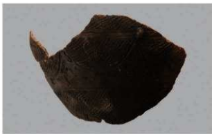
8 1-7出土土器 (第478图29)