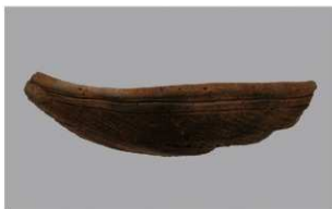
7 G-6出土土器 (第77图5)