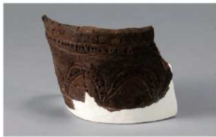
2 H-6出土土器 (第183图146)