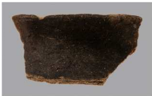
4 F-5出土土器 (第22图28)