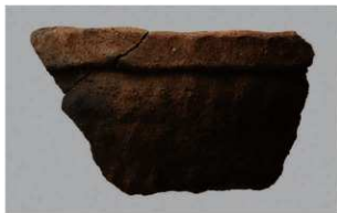
4 H-6出土土器 (第191图237)