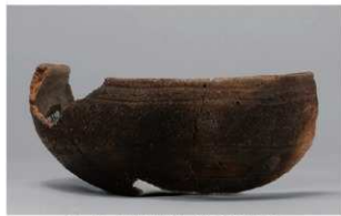
2 1-7 出土土器 (第 478 图 33)