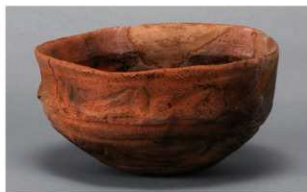
8 1-6出土土器 (第351图150)