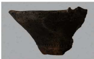
7 H-7 出土土器 (第 279 图 45)