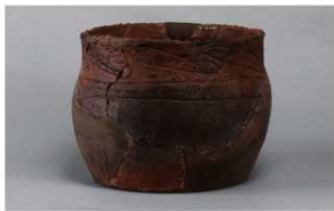
8 1-6出土土器 (第364图 278)