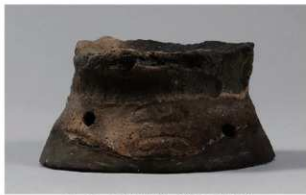
2 G-5 出土土器 (第 52 图 13)