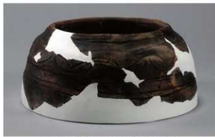
2 H-6 出土土器 (第 175 图 53)