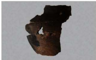
6 1-6出土土器 (第371图365)