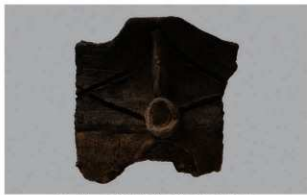
2 H-6出土土器 (第186图199)