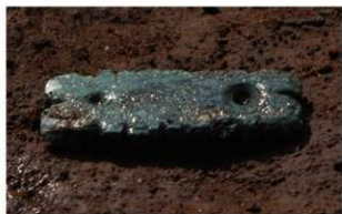
8 H-5 第 167 图 596 出土状况