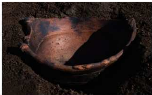
3 H-5 第 141 图 24 出土状况