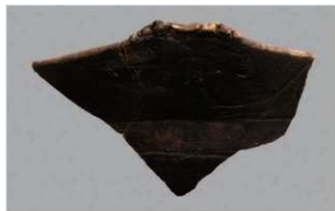
4 | -6 出土土器 (第 355 图 212)