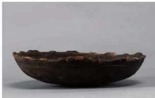
5 | -6 出土土器 (第 349 图 139)