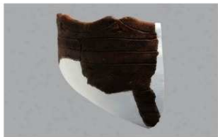
3 1-6出土土器 (第341图61)