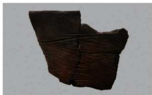
7 G-5出土土器 (第51图2)