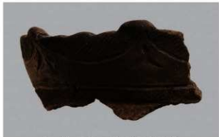
5 H-6出土土器 (第175图48)