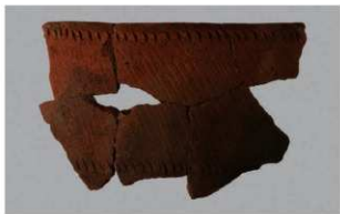
3 1-6出土土器 (第356图219)