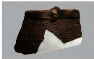
2 J-6 出土土器 (第 556 图 25)