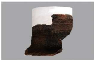
3 | -6 出土土器 (第 353 图 193)