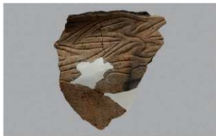
4 G-6出土土器 (第80图38)