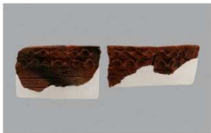
3 1-6出土土器 (第337图25)