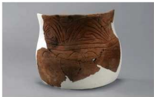
3 H-5出土土器 (第140图17)