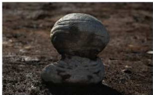
5 H-5 第 142 图 39·42 出土状况