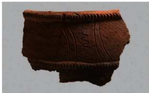
5 1-7 出土土器 (第 482 图 89)