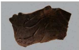
7 F-5出土土器 (第21图4)