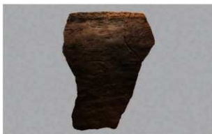
7 | - 6 出土土器 (第 373 图 377)