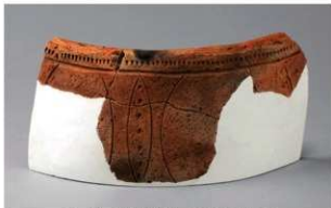
6 H-7 出土土器 (第 283 图 97)