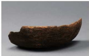
6 H-6出土土器 (第185图184)