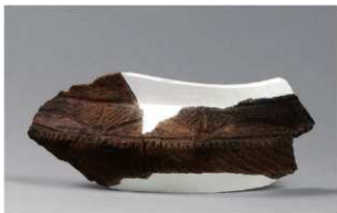
4 H-6 出土土器 (第 172 图 23)