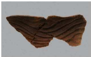
3 G-5 出土土器 (第 52 图 14)