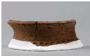
4 | - 6 出土土器 (第 370 图 355)