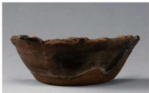
3 1-6出土土器 (第349图145)