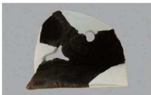
7 | -6 出土土器 (第 352 图 181)