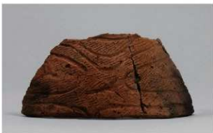
7 G-6出土土器 (第79图24)