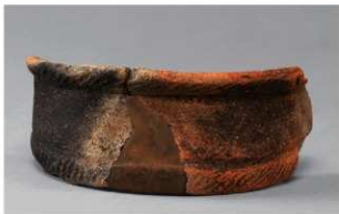
4 F-5出土土器 (第22图19)