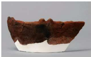
3 1-6出土土器 (第368图326)