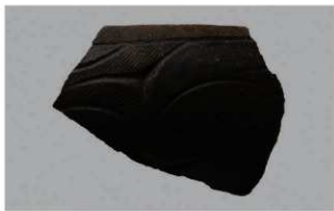
7 1-6出土土器 (第348图133)