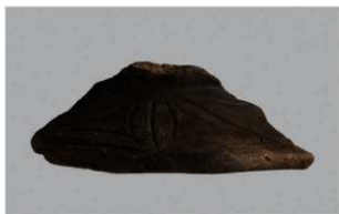
8 H-6 出土土器 (第 179 图 100)