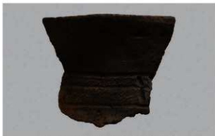
2 | -6 出土土器 (第 336 图 12)