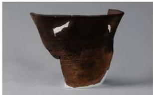
5 H-7出土土器 (第275图1)