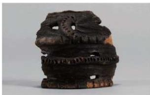
7 1-7 出土土器 (第 481 图 72)