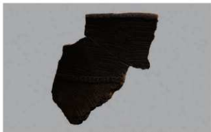
1 H-7出土土器 (第282图83)