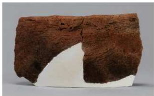
3 H-7出土土器 (第284图 104)