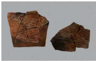
1 G-6出土土器 (第82图59)