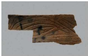
4 G-6出土土器 (第82图54)