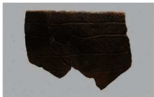
3 1-6出土土器 (第345图95)