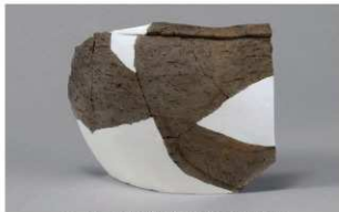
6 H-7出土土器 (第284图 107)