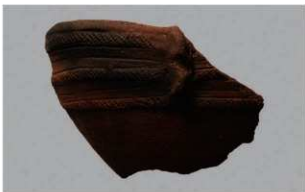
4 H-7 出土土器 (第 279 图 42)