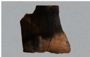
1 H-5出土土器 (第143图48)