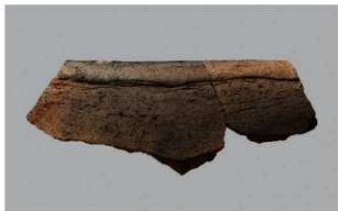
3 H-5出土土器 (第143图53)