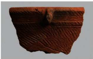
2 | - 6 出土土器 (第 342 图 68)