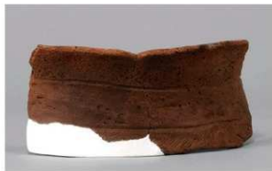
4 1-6出土土器 (第341图62)