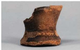
2 | - 6 出土土器 (第 370 图 353)