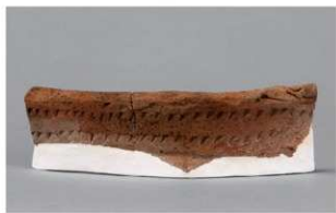
7 1-5出土土器 (第323图15)