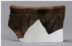
5 H-7 出土土器 (第 283 图 96)