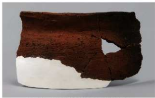
1 H-7出土土器 (第284图 101)