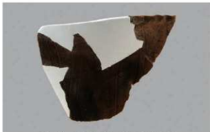
6 H-6 出土土器 (第 172 图 25)