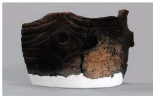
8 1-6出土土器 (第371图367)