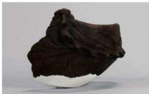
1 | -6 出土土器 (第 347 图 118)