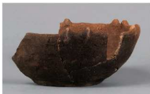
8 | -6 出土土器 (第 368 图 322)