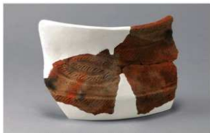
2 H-5出土土器 (第139图9)