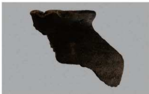
2 H-6出土土器 (第179图111)