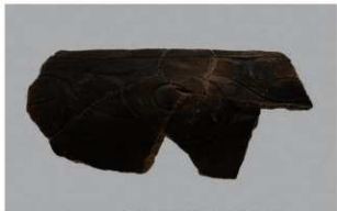
5 1-6出土土器 (第348图131)