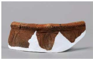
1 1-6出土土器 (第358图237)