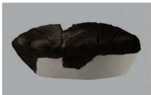
7 H-6出土土器 (第179图108)