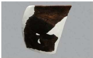
3 1-7出土土器 (第480图59)