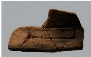
6 | -6 出土土器 (第 352 图 180)