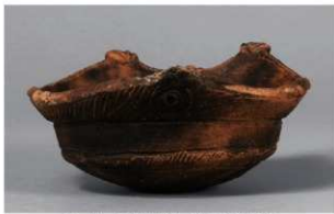
2 H-5 出土土器 (第 141 图 24)