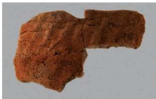
3 G-6出土土器 (第87图109)