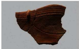
5 1-6出土土器 (第342图63)