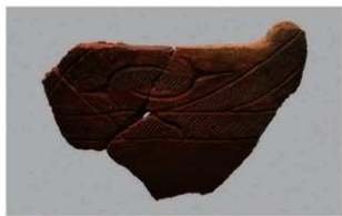
7 1-6出土土器 (第346图100)