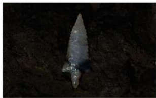
8 | - 6 第 463 图 2998 出土状况