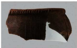
7 1-6出土土器 (第361图260)