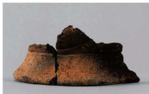
6 1-6出土土器 (第352图188)