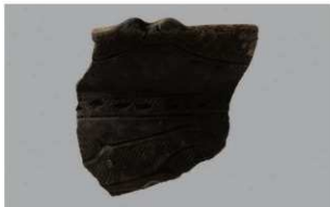
5 H-7 出土土器 (第 279 图 43)