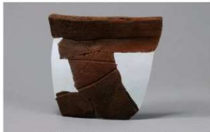
6 H-6 出土土器 (第 176 图 57)