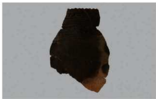
7 H-6出土土器 (第186图188)