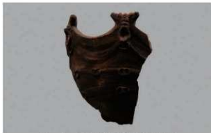
5 | -6 出土土器 (第341图55)