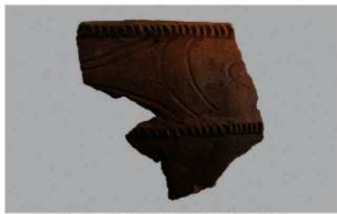
2 1-6出土土器 (第362图 272)