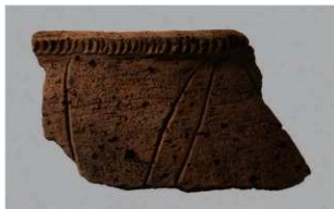
4 | - 6 出土土器 (第 362 图 266)