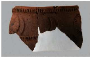
2 1-7出土土器 (第483图95)