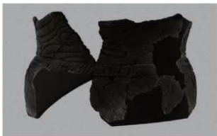
4 F-5出土土器 (第21图1)