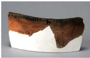
1 H-7 出土土器 (第 283 图 92)