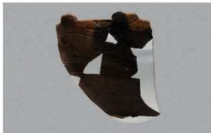
5 | -6 出土土器 (第 351 图 159)