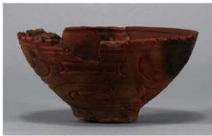
1 G-6出土土器 (第85图86)