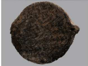
5 G-6出土土器 (第88图120)