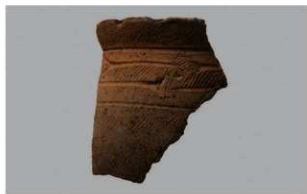
4 1-6出土土器 (第345图96)