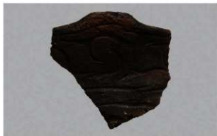
2 | - 6 出土土器 (第 366 图 296)