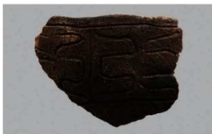
7 | -6 出土土器 (第 368 图 321)