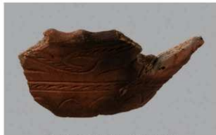
6 G-6出土土器 (第83图65)