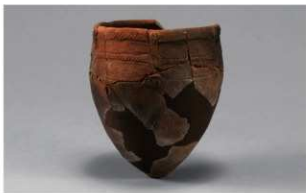
4 G-6出土土器 (第77图10)