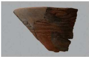
2 G-6出土土器 (第84图70)