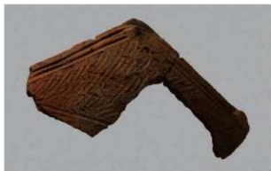
3 I-5出土土器 (第322图3)