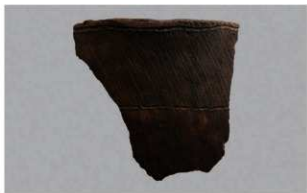
3 H-7出土土器 (第282图85)