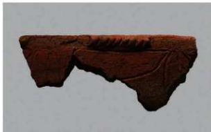
5 | - 6 出土土器 (第 362 图 267)