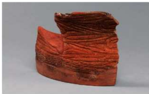
3 G-6出土土器 (第80图37)