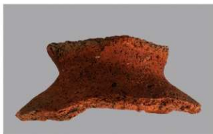
7 H-7出土土器 (第281图71)