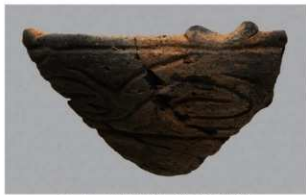
2 1-7 出土土器 (第 480 图 67)