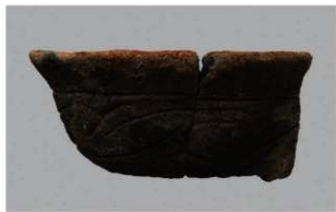
7 H-6出土土器 (第177图73)