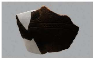
1 H-6出土土器 (第180图118)