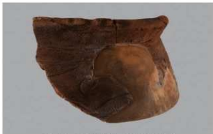
6 G-6出土土器 (第78图12)