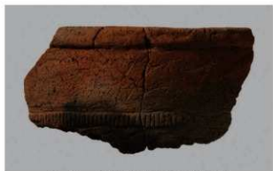
5 H-6出土土器 (第180图122)