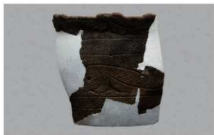
1 1-5出土土器 (第322图9)