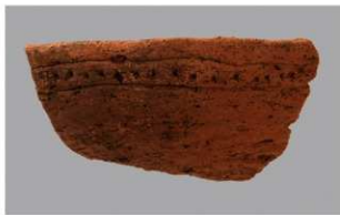
8 1-6出土土器 (第368图331)