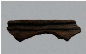
5 H-7 出土土器 (第 278 图 26)