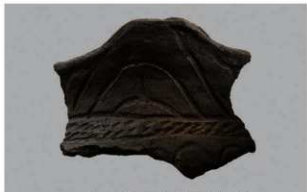
5 H-7出土土器 (第277图17)