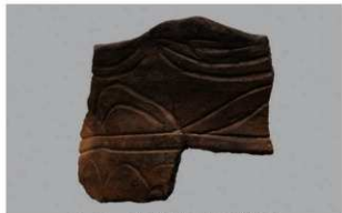
5 G-6出土土器 (第81图47)