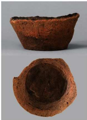
1 H-7出土土器 (第285图120)