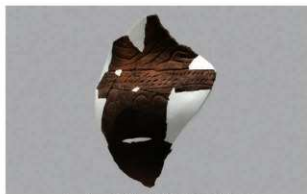
6 1-5出土土器 (第323图14)