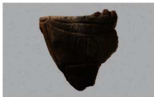
1 H-7出土土器 (第278图30)