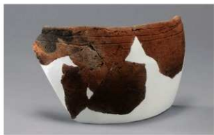
7 H-6出土土器 (第180图124)