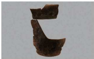
3 G-6出土土器 (第86图98)