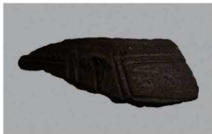
2 | -6 出土土器 (第 352 图 176)