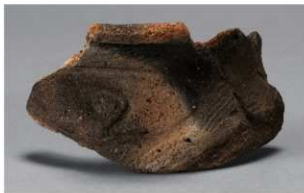
3 H-5 出土土器 (第 141 图 25)