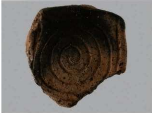
3 H-7 出土土器 (第 280 图 58)