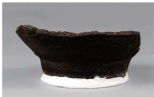
3 H-6出土土器 (第179图103)