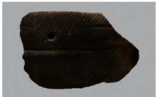
5 H-6出土土器 (第171图16)