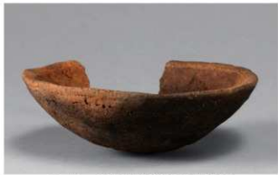
1 H-6出土土器 (第185图177)