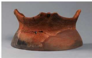
8 G-6出土土器 (第80图34)