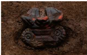
4 I-7 第 536 图 1540 出土状况