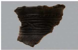
1 F-5出土土器 (第22图25)