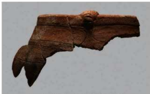
6 1-7出土土器 (第477图27)