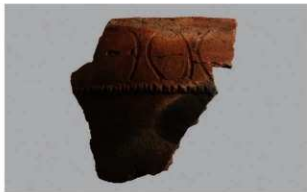
4 1-7出土土器 (第483图97)