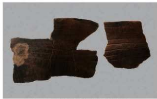
2 G-6出土土器 (第82图60)