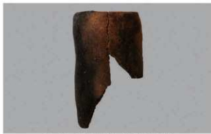
2 G-6出土土器 (第86图97)