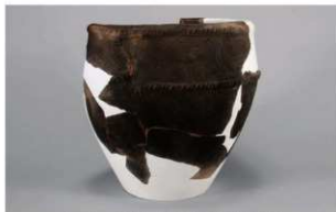
2 | -6 出土土器 (第 359 图 246)