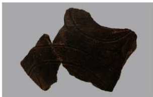
3 | -6 出土土器 (第 351 图 153)