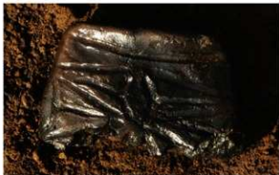
6 I-7 第 538 图 1550 出土状况