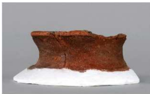
3 | - 6 出土土器 (第 370 图 354)