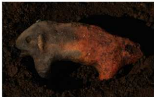
5 I-7 第 538 图 1549 出土状况