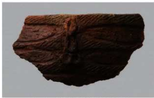
1 | -6 出土土器 (第344图83)