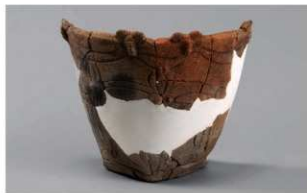
4 1-6出土土器 (第355图203)