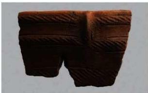
4 | - 6 出土土器 (第 343 图 70)