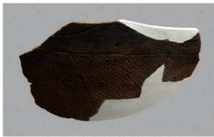
1 1-7 出土土器 (第 478 图 30)