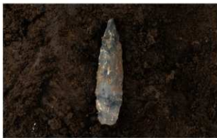
7 I-7 第 539 图 1559 出土状况