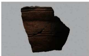
7 1-6出土土器 (第350图149)