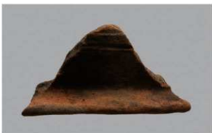
7 H-7 出土土器 (第 280 图 64)