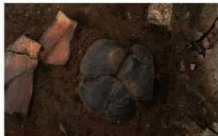
6 H-5 第 143 图 55 出土状况