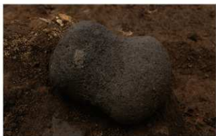
7 H-6 第 269 图 2115 出土状况