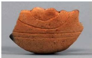
3 1-6出土土器 (第348图129)