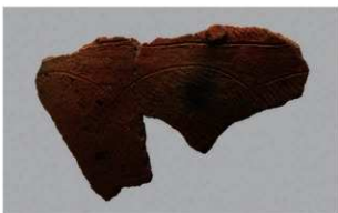
8 H-7 出土土器 (第 278 图 29)