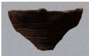
8 | -6 出土土器 (第 339 图 38)