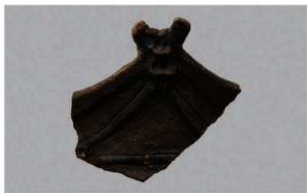
7 H-6出土土器 (第173图34)