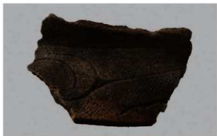
3 H-5出土土器 (第142图36)