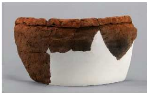
3 | -6 出土土器 (第 378 图 413)