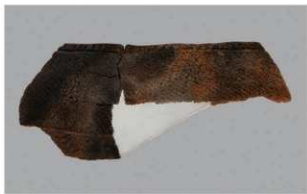
7 H-5出土土器 (第139图6)