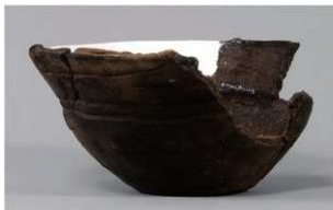
3 | -6 出土土器 (第 369 图 334)