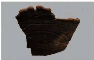
8 | -6 出土土器 (第 348 图 126)