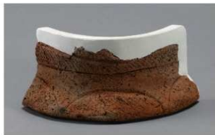
4 H-5出土土器 (第142图37)