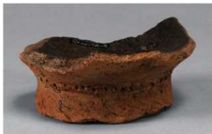
4 H-6出土土器 (第179图105)