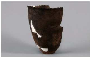
3 1-6出土土器 (第377图405)