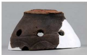
8 1-6出土土器 (第352图174)