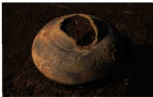
8 J-6 第 559 图 69 出土状况