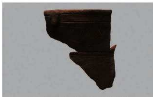
1 | - 6 出土土器 (第 342 图 67)