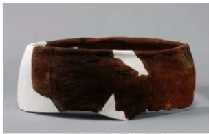
1 | -6 出土土器 (第 377 图 411)