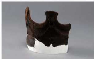
2 H-6出土土器 (第173图37)