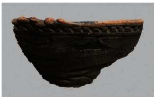
4 H-7 出土土器 (第 281 图 78)