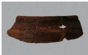
6 J-6出土土器 (第555图21)