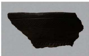
6 H-6出土土器 (第171图10)