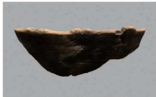
6 H-6出土土器 (第177图72)