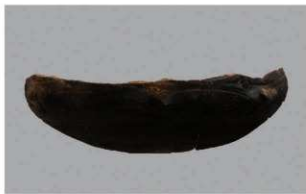
8 1-6出土土器 (第348图134)