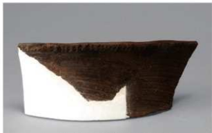
1 H-6出土土器 (第172图28)