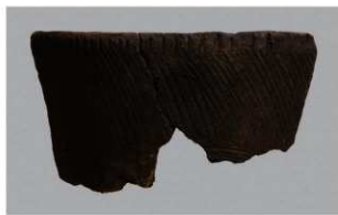
8 H-6出土土器 (第181图125)