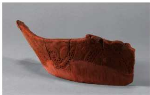
7 G-6出土土器 (第80图33)