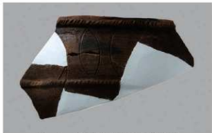
5 1-6出土土器 (第359图241)