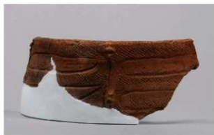
4 1-6出土土器 (第343图78)