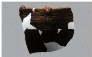
7 1-6出土土器 (第344图81)