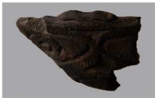
7 F-5出土土器 (第22图23)