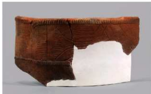
6 1-7 出土土器 (第 482 图 90)