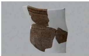
2 H-6出土土器 (第170图6)