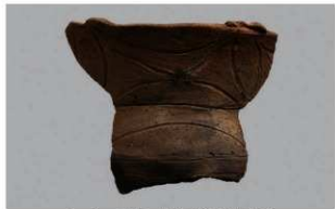
5 1-6出土土器 (第345图97)