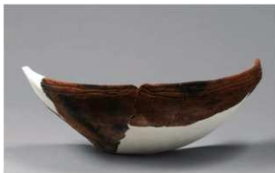
3 H-7 出土土器 (第 279 图 41)