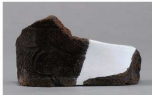
6 1-6出土土器 (第355图205)