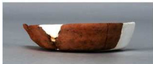
1 第263号土壙 (第401図114)