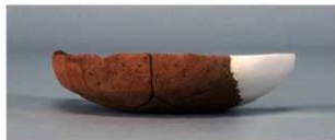
7 第268号土壙 (第401図125)