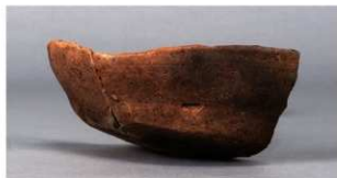
7 第237号土壙 (第400図95)