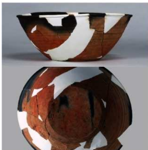
5 第3号住居跡 (第242図29)