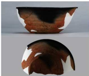
6 第3号住居跡 (第242図30)