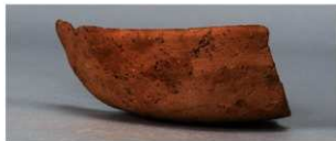
5 第263号土壙 (第401図118)