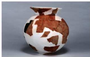
6 第234号土壙 (第400図81)