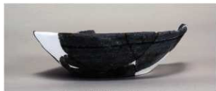
5 第3号遺物集中 (第411図7)