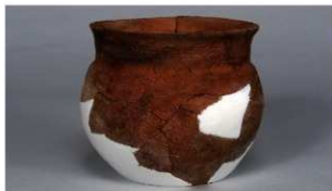
9 第102号住居跡 (第346图45)