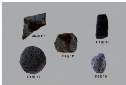
3 石製品 (7)