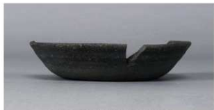
5 第178号土壙 (第399図52)