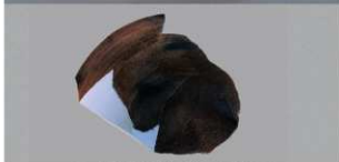
7 第3号住居跡 (第242図31)