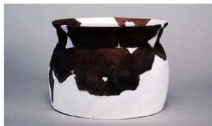
4 第2号遺物集中 (第408図19)