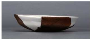
3 第153号土壙 (第399図37)