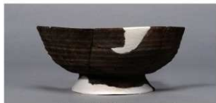
7 第85号住居跡 (第330図11)