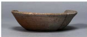
6 第102号住居跡 (第345图2)