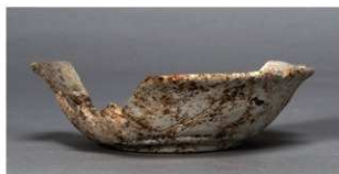
9 第75号住居跡 (第307図149)