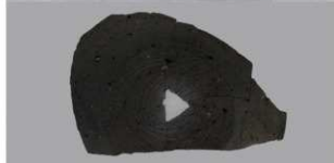
5 第3号住居跡 (第242図2)