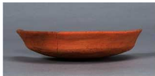
9 第36号住居跡 (第267図43)