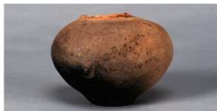
9 第36号住居跡 (第268図75)