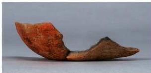
1 第13号住居跡 (第246图7)