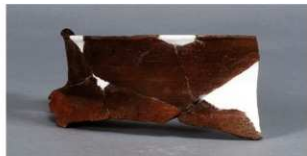
5 第3号住居跡 (第243図43)