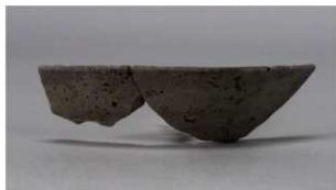
2 第36号住居跡 (第267図6)