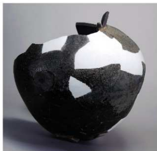
8 第142号井戸跡 (第357図32)