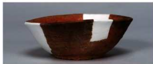
6 第22号住居跡 (第249图24)