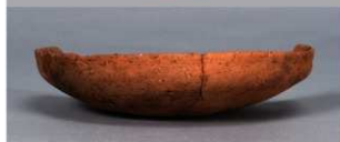
6 第36号住居跡 (第267図25)