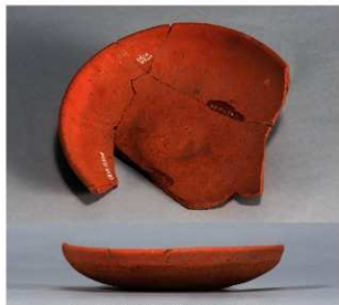
10 第37号住居跡 (第271図6)