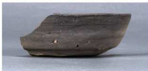
2 第20号住居跡 (第247图2)