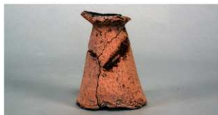
7 第3号遺物集中 (第414図106)