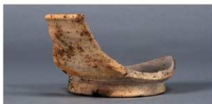
3 第22号住居跡 (第249图9)