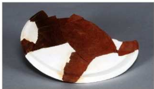
1 第3号住居跡 (第243図32)