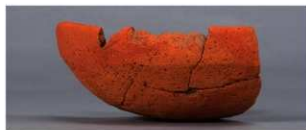
9 第27号住居跡 (第252图7)