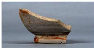
1 第3号住居跡 (第242図10)