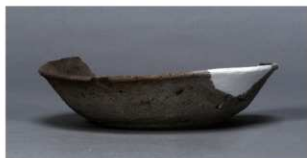
10 第75号住居跡 (第307図150)