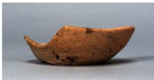
5 第85号住居跡 (第330図6)