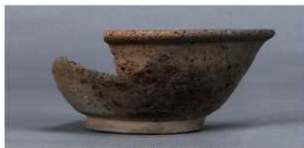
4 第22号住居跡 (第249图10)