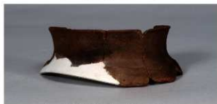
9 第 82 号住居跡 (第 323 図 28)