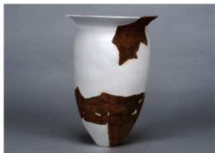
5 第36号住居跡 (第268図60)