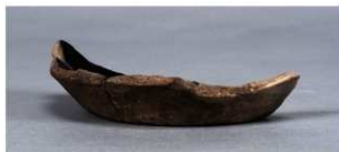
1 第38号住居跡 (第273図16)