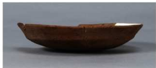
2 第36号住居跡 (第268図52)