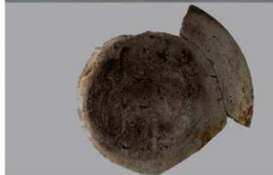
6 第3号住居跡 (第242図3)