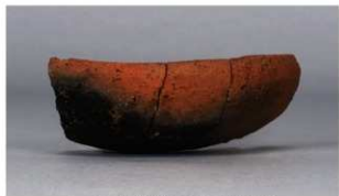
1 第318号土壙 (第403図161)