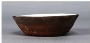
1 第55号土壙 (第398図1)