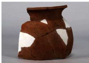
2 第434号土壙 (第405図212)