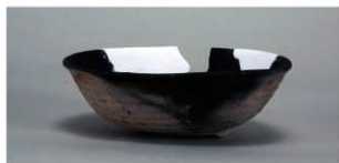
8 第85号住居跡 (第330図12)