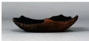
8 第430号土壙 (第405図208)