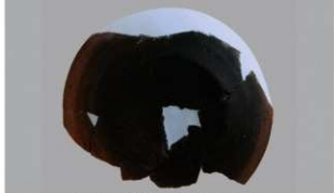
3 第3号住居跡 (第243図34)