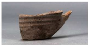
5 第75号住居跡 (第306図71)