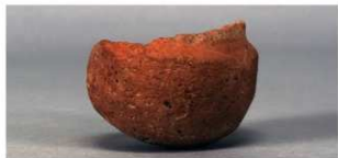
1 第2号掘立柱建物跡 (第353図6)