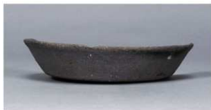
1 第36号住居跡 (第267図4)