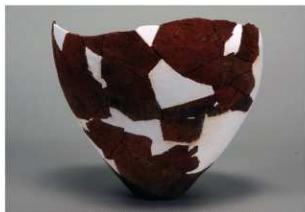
3 第2号遺物集中 (第408図18)