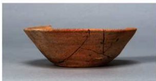
3 第85号住居跡 (第330図4)