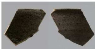
2 第85号住居跡 (第330図3)