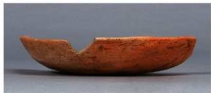
1 第36号住居跡 (第267図47)