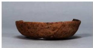
2 第75号住居跡 (第305図51)