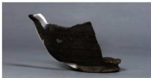
1 第83号住居跡 (第325図1)