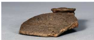
2 第89号住居跡 (第339图53)