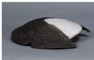
9 第44号住居跡 (第283図1)