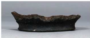
5 第91号住居跡 (第342图2)