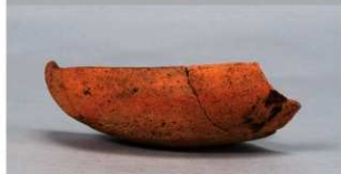
6 第33号住居跡 (第260図3)