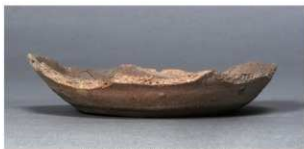
1 第75号住居跡 (第308图165)