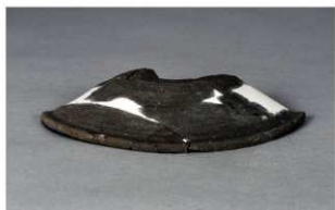
3 第420号土壙 (第404図182)