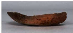
8 第247号土壙 (第401図99)