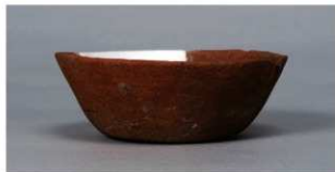
5 第 82 号住居跡 (第 323 図 18)