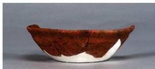
3 第38号住居跡 (第273図18)