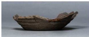
7 第102号住居跡 (第345图17)