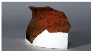
4 第38号住居跡 (第273図22)