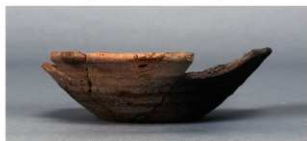
9 第430号土壙 (第405図207)