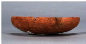
4 第36号住居跡 (第267図22)