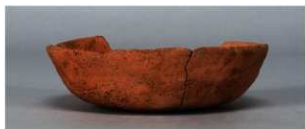
2 第263号土壙 (第401図115)