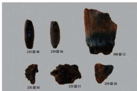
1 土錘・羽口・鉄滓