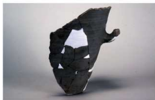
6 第3号遺物集中 (第412図46)