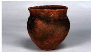
11 第81号住居跡 (第318图18)