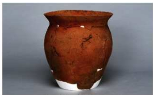
2 第2号住居跡 (第239図46)