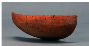
7 第33号住居跡 (第260図4)