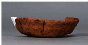
3 第75号住居跡 (第305図52)