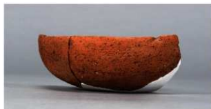
8 第43号住居跡 (第280図1)