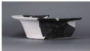
5 第420号土壙 (第404図186)