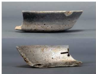
3 第112号井戸跡 (第356図12)