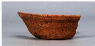
2 第38号住居跡 (第273図17)