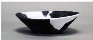
5 第78号住居跡 (第314图1)