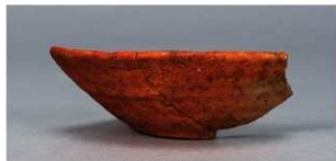
6 第85号住居跡 (第330図8)