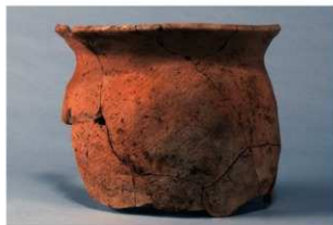
9 第85号住居跡 (第330図14)