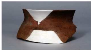
7 第12号住居跡 (第245図8)