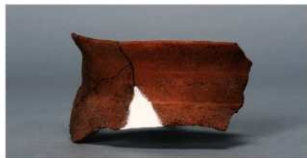
4 第3号住居跡 (第243図42)