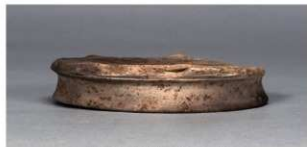
6 第75号住居跡 (第306図72)