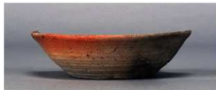
11 第309号土壙 (第403図158)