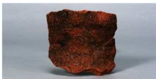
4 第77号住居跡 (第311图3)