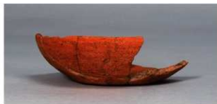
6 第 82 号住居跡 (第 323 図 19)