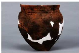
5 第38号住居跡 (第273図34)