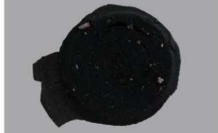
6 第12号住居跡 (第245図2)