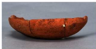
7 第36号住居跡 (第267図27)