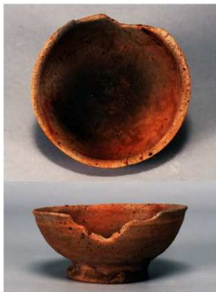
1 第434号土壙 (第405図211)