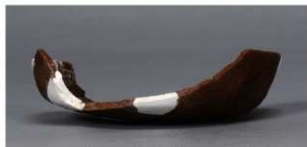
7 第75号住居跡 (第306図75)