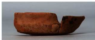
6 第263号土壙 (第401図119)