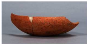
8 第36号住居跡 (第267図41)