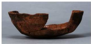
4 第36号住居跡 (第268図59)