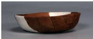
1 第89号住居跡 (第338图39)