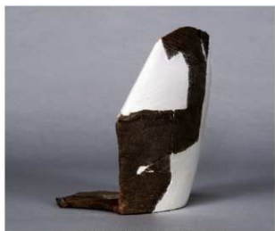
4 第420号土壙 (第404図188)