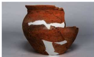
7 第22号住居跡 (第249图31)