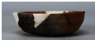
3 第263号土壙 (第401図116)