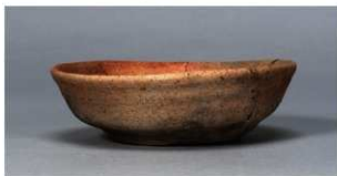
4 第85号住居跡 (第330図5)