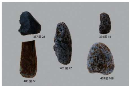
2 石製品 (6)