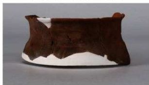
7 第429号土壙 (第405図205)