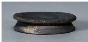
10 第263号土壙 (第401図113)