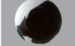
4 第3号住居跡 (第242図1)