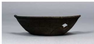
10 第86号住居跡 (第333図2)