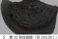
5 第33号住居跡 (第260図1)