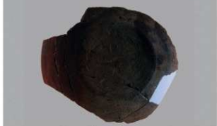
2 第3号住居跡 (第243図33)