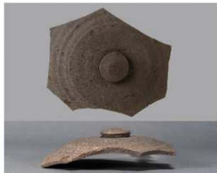
8 第27号住居跡 (第252图1)