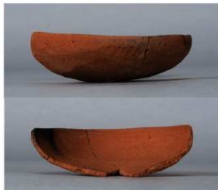
6 第112号井戸跡 (第356図14)