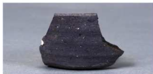
6 第39号住居跡 (第276図1)