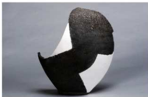
5 第22号住居跡 (第249图13)