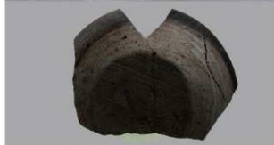
7 第3号住居跡 (第242図4)