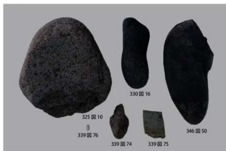
1 石製品 (5)