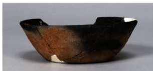
8 第102号住居跡 (第345图21)