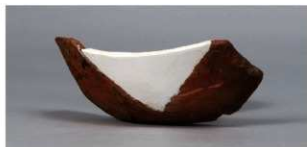
7 第 82 号住居跡 (第 323 図 22)