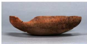
3 第36号住居跡 (第267図19)