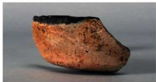
4 第171号土壙 (第399図47)