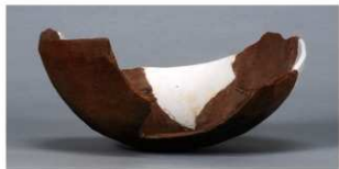
3 第36号住居跡 (第268図58)