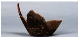
2 第27号住居跡 (第252図44)