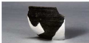
7 第78号住居跡 (第314图8)