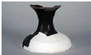
2 第67号土壙 (第398図10)