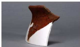
8 第75号住居跡 (第306図116)