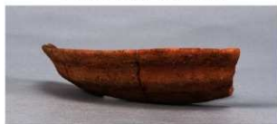
7 第39号住居跡 (第276図13)