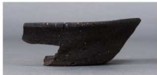
9 第257号土壙 (第401図102)