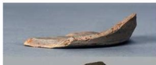
9 第272号土壙 (第402図136)