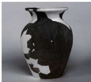
7 第142号井戸跡 (第357図31)