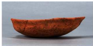
9 第33号住居跡 (第260図14)