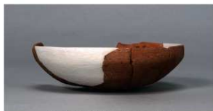
10 第44号住居跡 (第283図7)