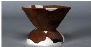
2 第3号掘立柱建物跡 (第353図11)