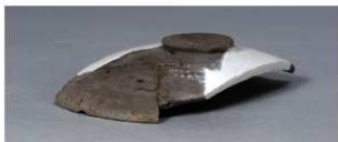
3 第89号住居跡 (第339图54)