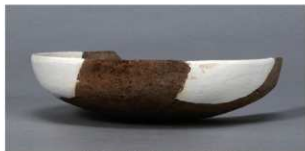
5 第36号住居跡 (第267図23)