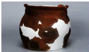
10 第102号住居跡 (第345图36)