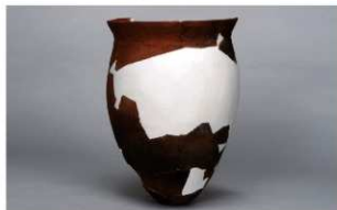
8 第 82 号住居跡 (第 323 図 25)