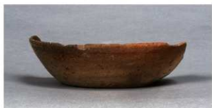
4 第75号住居跡 (第306図63)