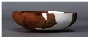
8 第271号土壙 (第402図128)