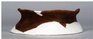
1 第27号住居跡 (第252図41)