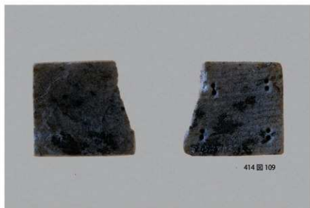
3 石製品 (1)