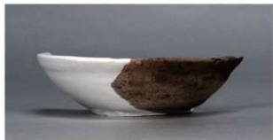
1 第75号住居跡 (第305図41)