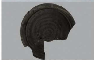
2 第 82 号住居跡 (第 323 図 11)