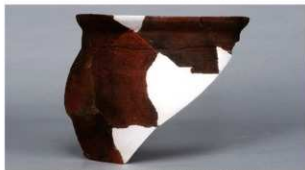
11 第102号住居跡 (第345图37)