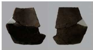
6 第426号土壙 (第404図195)