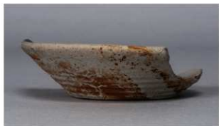
2 第331号土壙 (第403図166)