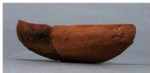
8 第33号住居跡 (第260図11)