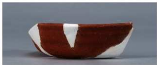
1 第2号住居跡 (第238図44)