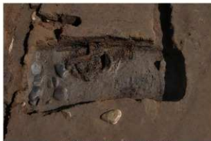
5 第17号建物跡 地業西部(2)