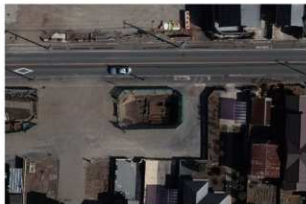
7 調査区全景 第二面南部