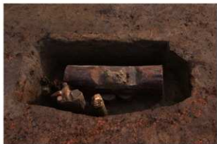
3 第9号建物跡 壹地業4 (1)