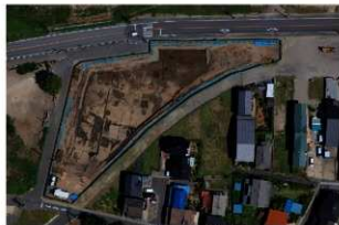
8 調査区全景 第三面