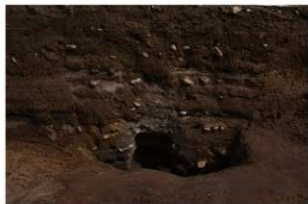
3 第9号建物跡 壺地菜1断面