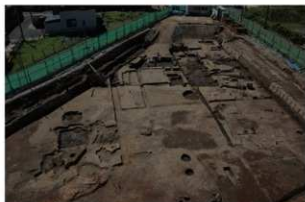
7 第三面 東から