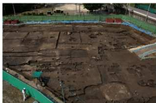
5 第二面 南から