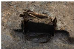
2 第13号井戸跡（一段目）