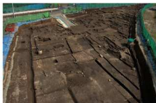
6 第二面 西から