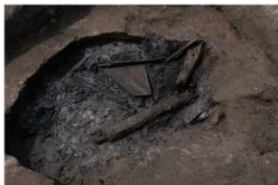
6 第 18 号井戸跡遺物出土状況 (5)