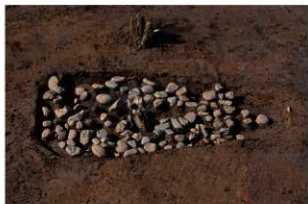
1 第9号建物跡 壹地業3 (1)