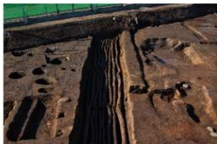
2 第3号建物跡 地業北部(2)