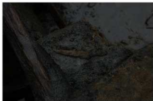
3 第9号井戸跡遺物出土状況