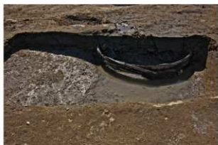
2 第4号井戸跡下部断面