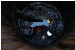
7 第13号井戸跡遺物出土状況（2）