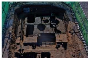
4 第一面南部 北から