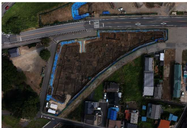
2 調査区全景 第二面合成写真