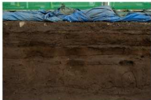
6 基本土層 東壁3