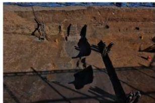
5 第18号建物跡 南部