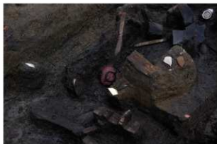
4 第 18 号井戸跡遺物出土状況 (3)