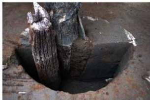
4 第12号建物跡 杭5断面