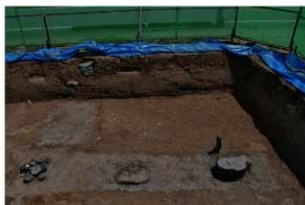
2 第18号建物跡検出状況