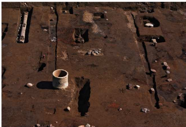
5 第10号建物跡・第28号溝跡