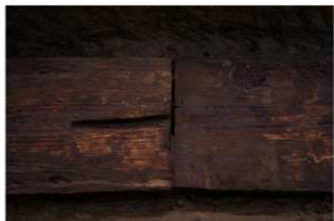
1 第1号建物跡 捨土台接合部