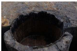
2 第62号埋設桶 (2)