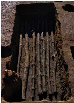
3 第3号建物跡 地菜西部 (2)