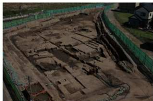
8 第三面 北西から