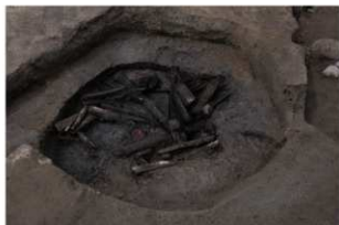
5 第 18 号井戸跡遺物出土状況 (4)