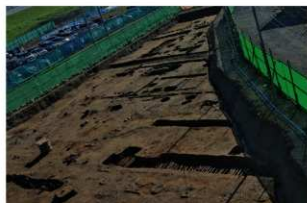
2 第一面 北西から