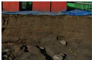
3 基本土層 北壁2