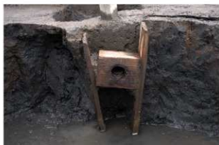
1 第5号井戸跡 竹桶・継手検出状況(4)