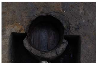
1 第62号埋設桶 (1)