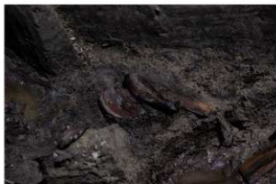
2 第 18 号井戸跡遺物出土状況 (1)