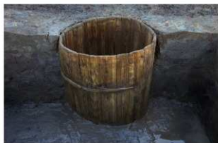
4 第13号井戸跡 井戸側（二段目）