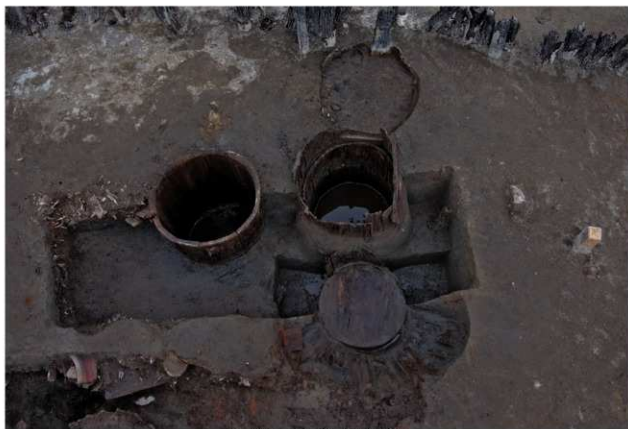
5 第58・59・60・66号埋設桶