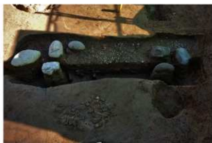
2 第42号建物跡 地業西部断面