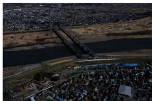
2 調査区遠景 西から