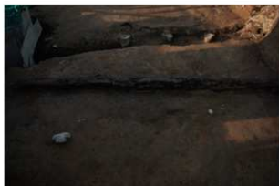
2 第1号建物跡 地葉南部(1)