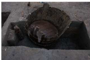
6 第71号埋設桶 (2)