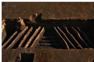
2 第3号建物跡 地菜西部 (1)