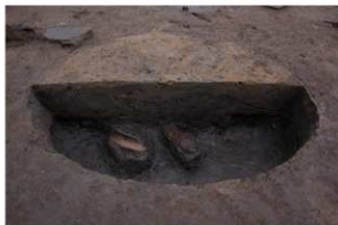
4 第10号井戸跡断面・遺物出土状況