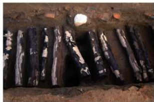
4 第3号建物跡 地菜東部 (1)