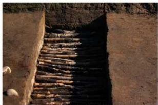
6 第3号建物跡 地菜南部 (1)