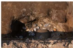
4 第9号建物跡 壺地菜1(1)