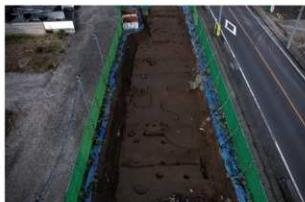
3 第一面 南から