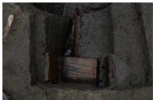
7 第5号井戸跡 竹桶・継手検出状況 (2)