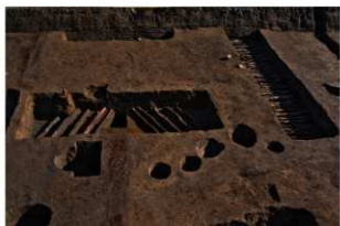
1 第3号建物跡 地菜西・南部