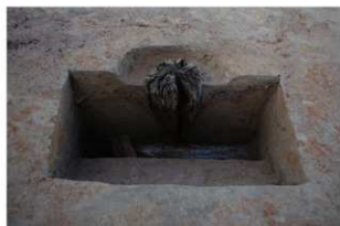
3 第15号建物跡 杭8断面