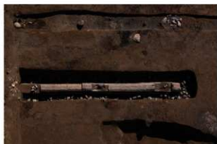
1 第9号建物跡 地菜北部(1)