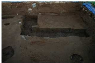
4 第18号建物跡 北部