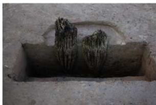
2 第15号建物跡 杭9断面