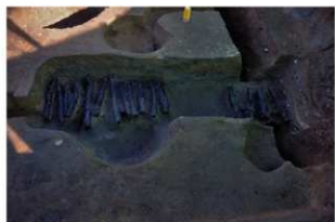
3 第42号建物跡 地業西部(1)