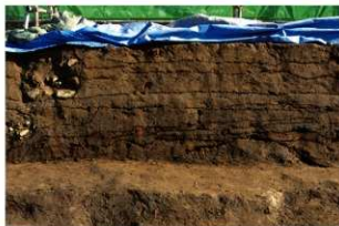
4 基本土層 東壁1 (1)