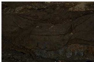
2 基本土層 北壁1 (2)