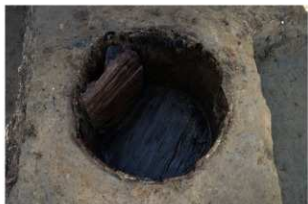
2 第20号建物跡 桶1 (1)