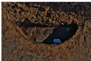
5 第18号埋設桶遺物出土状況