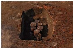
4 第9号建物跡 壹地業4 (2)