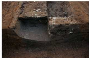
5 第42号建物跡 地業北部断面