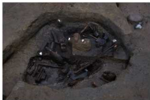
3 第 18 号井戸跡遺物出土状況 (2)