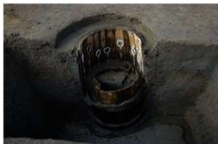
8 第11号井戸跡 井戸側(三段目)