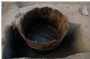
3 第20号建物跡 桶1 (2)