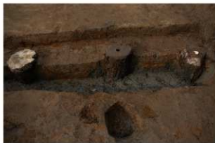
4 第1号建物跡 地葉南部断面