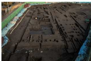
1 第一面 西から