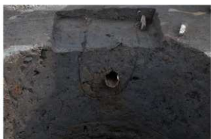
5 第5号井戸跡 竹桶