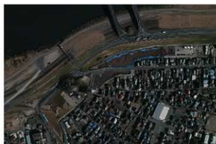
6 調査区近景 第二面合成写真