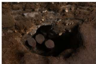
5 第9号建物跡 壺地菜1(2)