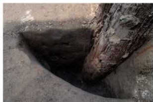
3 第12号建物跡 杭4断面