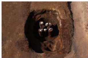
7 第9号建物跡 壺地菜2(2)