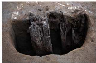
5 第12号建物跡 杭6断面