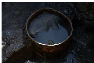
5 第13号井戸跡 井戸側（三段目）