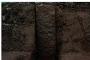
2 第1号建物跡 地業断面