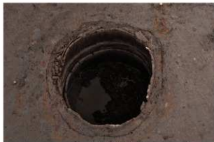
8 第 19 号井戸跡