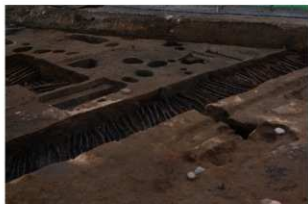
1 第3号建物跡 地業北部(1)