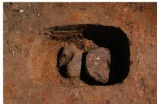
5 第1号建物跡 地業西部 (3)