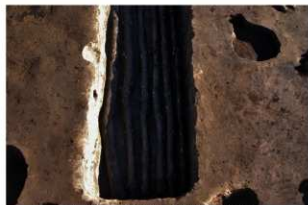
7 第3号建物跡 地菜南部 (2)