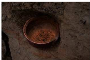
2 第1号胞衣埋納遺構容器出土状況(2)