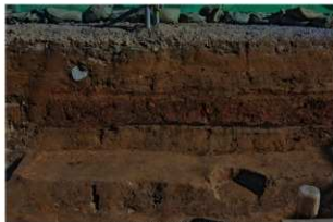
7 基本土層 東壁4