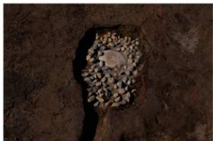
6 第9号建物跡 壺地菜2(1)