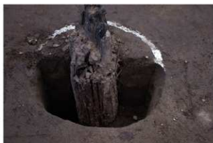
2 第12号建物跡 杭1断面