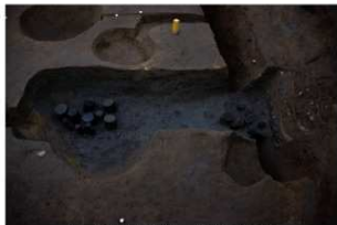
4 第42号建物跡 地業西部(2)