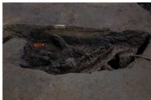
1 第 18 号井戸跡断面・遺物出土状況