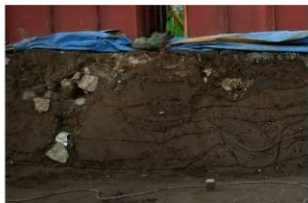
1 基本土層 北壁1 (1)