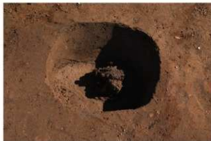
4 第1号建物跡 地業西部 (2)