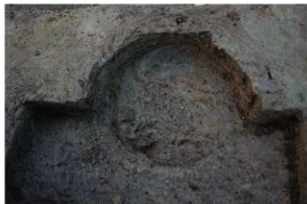
5 第20号建物跡 桶2掘方