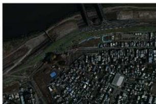
5 調査区近景 第一面合成写真