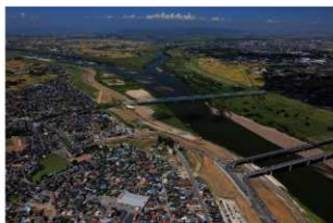
1 調査区遠景 南から