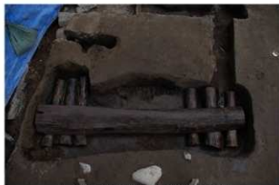
4 第17号建物跡 地業西部(1)