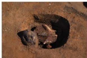
3 第1号建物跡 地業西部 (1)