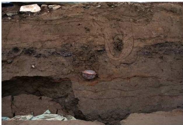
4 第1号胞衣埋纳遗构断面