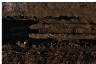
5 第3号建物跡 地菜東部 (2)