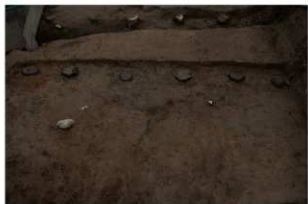
3 第1号建物跡 地葉南部(2)