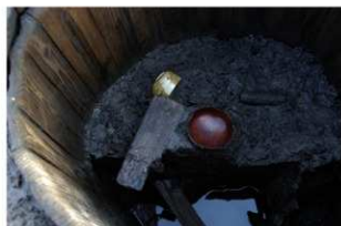
6 第13号井戸跡遺物出土状況（1）