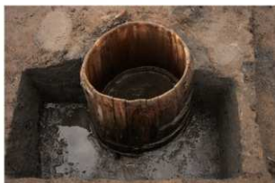
6 第11号井戸跡 井戸側(一段目)