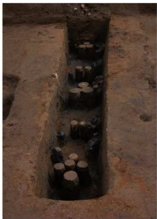
2 第9号建物跡 地菜北部(2)