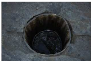
3 第13号井戸跡（二段目）