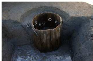
7 第11号井戸跡 井戸側(二段目)