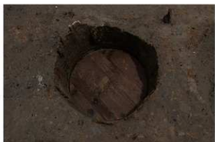
5 第71号埋設桶 (1)