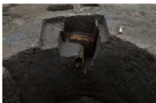
6 第5号井戸跡 竹桶・継手検出状況 (1)