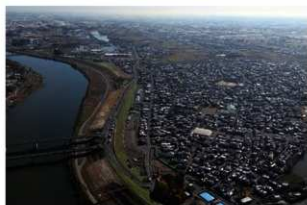
4 調査区遠景 北から