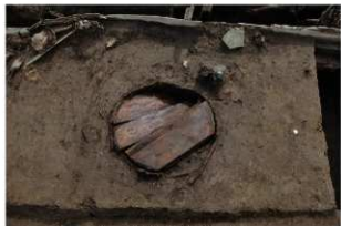
4 第20号建物跡 桶2