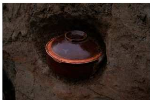
1 第1号胞衣埋納遺構容器出土状況(1)