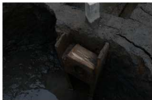
8 第5号井戸跡 竹桶・継手検出状況 (3)