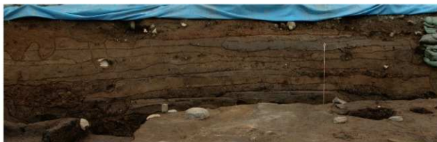
5 基本土層 東壁1 (2)