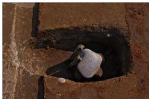
2 第9号建物跡 壹地業3 (2)