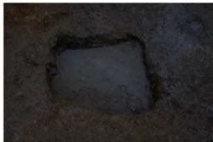
7 第 18 号井戸跡下部検出状況