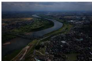
3 調査区遠景 北西から