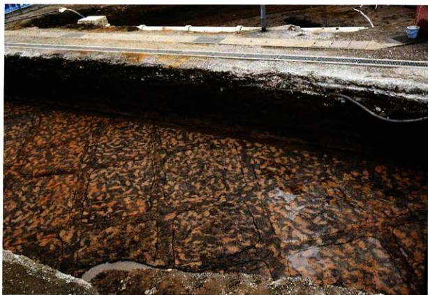
Hr-FA 泥流層下水田跡足跡検出状態（北東から）