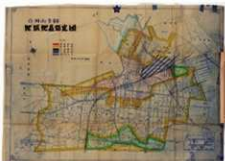
▲立川市全図 地域地区指定図 昭和31年(1956)