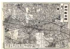
▲砂川町全図 昭和38年(1963)頃

こうして、「多摩地域の中核都市」へと発展を遂げた立川市。今回の「地図・絵図」に掲載された地図資料は、立川の現代を知るうえで、重要な手がかりとなり、基礎資料といえます。そこには、いまは形を変え、存在しない軍事施設・工場・店舗・映画館・旅館・公共施設・学校・農地・河川・地名などが記載されており、土地利用の履歴が刻まれています。また、久々に終わった米軍基地の跡地利用計画も含まれており、時々刻々と変化した都市計画の将来像が、「地図・絵図」からうかがえます。平成も終わりを迎えた現在、かつての砂川村(町)と立川市の変遷を把握するうえで、不可欠な1点1点の地図資料から、先人の息吹とその時代の活力に思いをはせることのできる市史刊行物です。