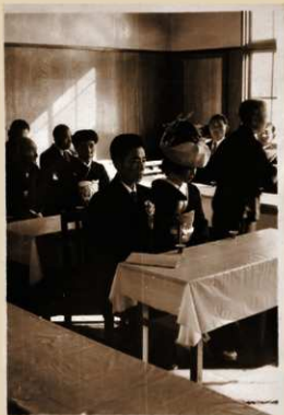
写真2 都立西多摩婦人生活館での結婚式 新郎新婦や両家の参列者へ盃が渡されている様子

同じ改善という言葉を用いて、家庭生活のそれに重きを置くものを「生活改善」という。国が進めた政策としても知られる。砂川の青年団においては生活改善を複数の部で担当した。文化部においては「女性の集い」という話し合いを開き、自主的な女性による営みにしようと試みていた。ある年の「女性の集い」は、家事労働の改善を話題として「余暇の善用」と題した講演が行われ、余暇の過ごし方が話し合われた。折しも、「毎日が戦争」の様な最盛期で、多くの青年女性は余暇がなく、参加者は40名余りであった。文化部長は「昼休に女の方は洗濯をしているのに男の方は昼寝などしているのが現状ですが此れなど自分の兄弟に自分の物はさせる様にする」等と講評した（「女性の集い」1954年秋季号）。盆踊りとはまた異なった意味で家庭生活の改善は容易なものではなかった。しかし、機関誌には、家の行事の改善を試みた例も認められる。それは、農家の長男であるにもかかわらず、結婚式を改善した内容である（「厚き壁を破って」14号 1959年）。自宅ではなく、都立西多摩婦人生活館にて結婚式を「新しい形」で行った青年は、当時の準備、式次第を詳述し、「厚き壁は外面的なものばかりではなく、自分達自身の心の中にある厚い壁を打ち破る事が何よりも第一に必要」と所感を綴っている。この文章からは、青年団活動を自らの生き方へ発展的に解消していった姿を読みとることができる。結婚式の変化については、家で行う結婚式（かつては祝言と称した）が結婚式場で行われるようになったと図式的に理解されているが、この例のように、結婚式を家制度でもなく、資本を背景とするサービス産業でもなく、手作りで行っていたという史実が立川市内にもあったということが、この文章から明らかになる。