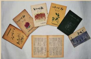
写真1 「いづみ」表紙 見開きは16号 1960年

とする行政の意図も垣間見えるようである。その後も盆踊りの改善は計画にあまり（「社会部経過報告」13号 1958年）、練習日を長く確保したい、盆踊り発表会を1日だけでなく、2～3日かけて行いたい、コンクール的に行いたい等の要望も会議にのぼり、ようやく、5年後に「統一盆踊り会」を達成することができた（「社会部事業を顧みて」16号 1960年）。砂川の風物詩には「砂川音頭」がある。1950年代初頭に制作された「砂川音頭」の数年後において、盆踊りを統一しようとする機運がなぜ、どのように