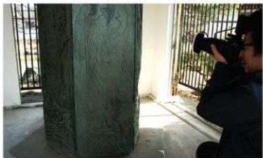
▲ 図3: 現地での撮影の様子。LEDリング照明をつけたデジタル一眼レフカメラなどを使用した。