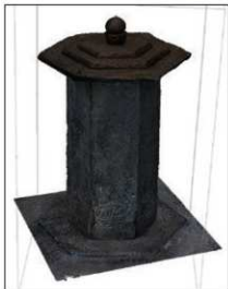
▲ 撮影した六面石幢全体の画像データをより生成した六面石幢の3次元モデル。