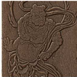
普濟寺六面石幢 三次元計測図 谷加工画像

第7号では普濟寺の六面石幢を取り上げました。六面石幢は立川市で唯一の国宝として知られています。古代・中世部会では六面石幢の三次元計測をおこない、肉眼では把握しづらかった細部まで調査できるようになりました。特集ではこの調査の概要と、六面石幢をより深く知るための知識をまとめています。