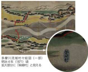
多摩川流域村々絵図(一部) 明治4年(1871)頃 拡大部分に「柴崎村」と見える

昭和8年(1933)、民間航空は逓信省管轄の東京飛行場(羽田飛行場)に移転します。翌9年に陸軍航空本部補給部が所沢から移転してきて軍事施設と軍需工場の集積が進むと、日本有数の「軍都」に変貌して、昭和15年(1940)に立川町は市制を施行します。終戦末期の疎開要図と立川市全国(公共待避所記入)は、立川飛行機(株)の疎開計画と空襲に対する立川市の公共待避所を記したものです。