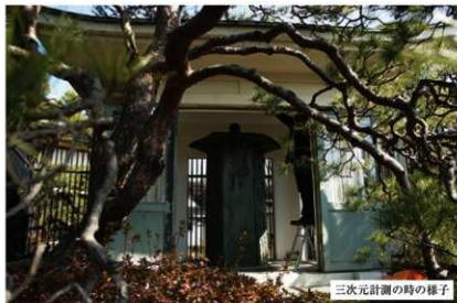
三次元計測の様子