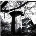
図1a、b: 斎藤幸成1834「江戸名所図会」