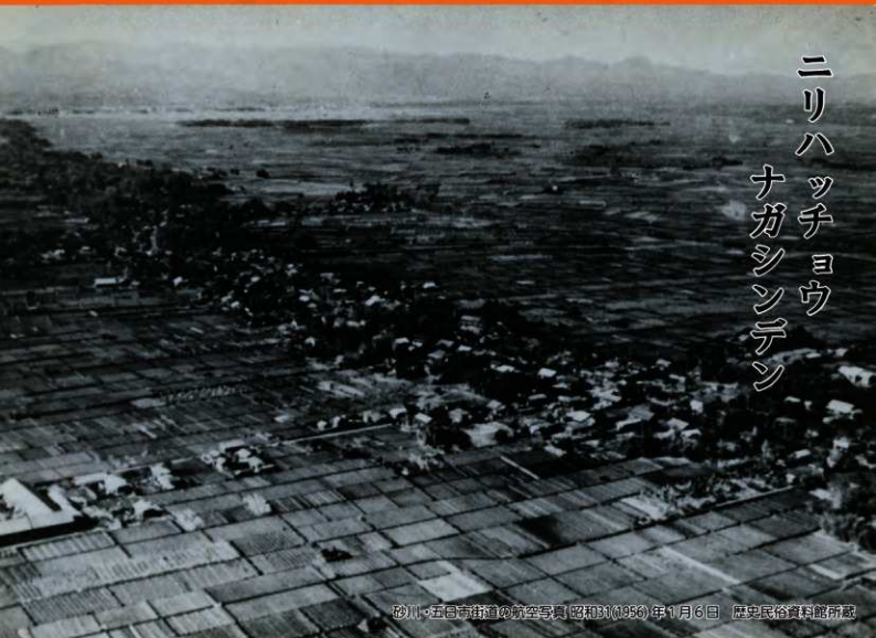
砂川・五目市街道の航空写真 昭和31(1956)年1月6日

立川市の北半分、砂川という地域の名前は、市内を流れる残堀川に由来していると言われています。かつての残堀川は大雨が降ると氾濫することもありましたが、普段は砂と石がむき出しの「砂の川」であることがほとんどでした。江戸時代の初め、砂川の新田開発は、この残堀川に沿って進められました。