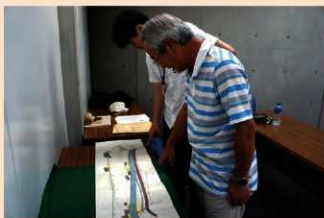
▲ 絵図に見入る参加者