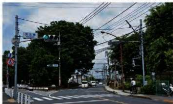
玉川上水と五日市街道が交わる「天王橋」

今回の特集では、交差点の標識や道路の名前として今でも存在が確認出来る砂川の昔の地域名をまとめました。普段何気なく見ている名称から、昔の砂川を知る手がかりが得られます。