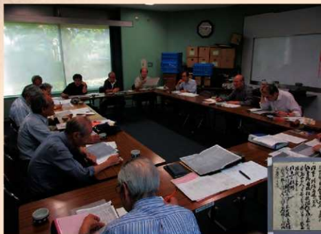
▲「立川の史料を読む会」活動の様子（平成28（2016）年撮影）

この特集では、本会がこれまで行ってきた活動を振り返るとともに、参加者の皆さんの声を紹介합니다。