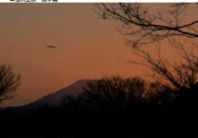
▲金比羅山から見た富士山