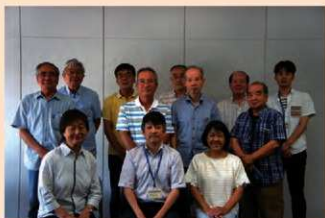
▲「立川の史料を読む会」参加者の皆さんと一緒に

今後も会の方々に協力いただき、立川に残る古文書の解説を少しずつ進めるとともに、よりよい協働作業のあり方を模索していきたいと思えます。