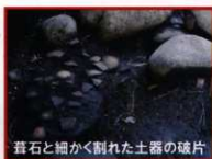
葦石と細かく割れた土器の破片

くびれ部の調査では、前方部・後方部斜面から転落した葦石を確認しました。また、東くびれ部では意図的に細かく砕いた土器が出土しています。