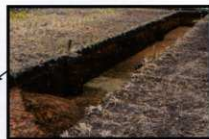
前方部南東側の周溝

前方部南東の周溝幅が約20mであることが確認できました。底面の砂礫層が東に向かうほど浅いため周溝も浅くなっていくと思われます。