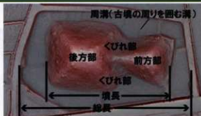
下侍塚古墳と前方後方墳の構造

上侍塚古墳の北約800mの場所にある前方後方墳。1975年に古墳周囲の調査は行なわれましたが、墳丘部は調査されていません。過去の発掘調査で周溝や葦石を確認しています。