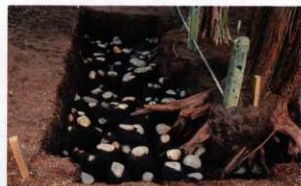
東くびれ部後方部側の転落葺石(西から)

現在は、墳丘の裾部分と、前方部と後方部の接続部分を確認することを目的に進めています。