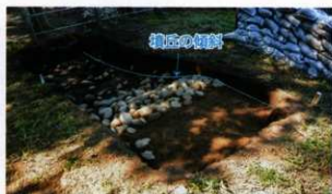
墳丘の傾斜(北西から)

墳丘の傾斜を見ると下っていくにつれ、傾斜が緩やかになっていることも判明しました。