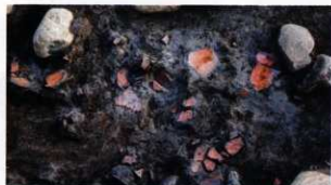
西くびれ部前方部側土器出土状況(北から)

この調査区では右写真のように土器片が多く出土しています。そうした状況から前方部の上部にも土器が並べられていて、それらが転落してきたと考えられます。