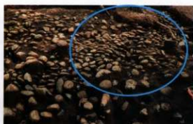
葺石の様子(南から)