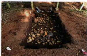
後方部東斜面トレンチの葺石(西から)

N0東斜トレンチでは、墳丘の表面や転落してきた葺石、古墳が造られた当時のまま残っていた葺石、古墳が造られる前の地表面(旧地表面)を確認しています。旧地表面は現在の地表面よりも約1.1m高い場所を確認しました。また、転落葺石と共に土器の破片も出土しています。これらの土器は墳頂部に並べられていたものが転落してきたものと考えられます。