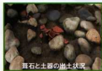
葦石と土器の出土状況

くびれ部の調査では、前方部・後方部斜面から転落した葦石を確認しました。また、東くびれ部では意図的に細かく砕いた土器が出土しています。