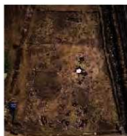
大肥条里大肥地区 (B区) 全景