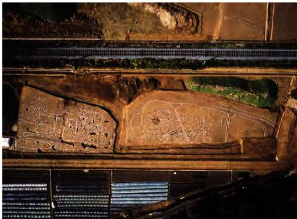
C区第1面調査区全景