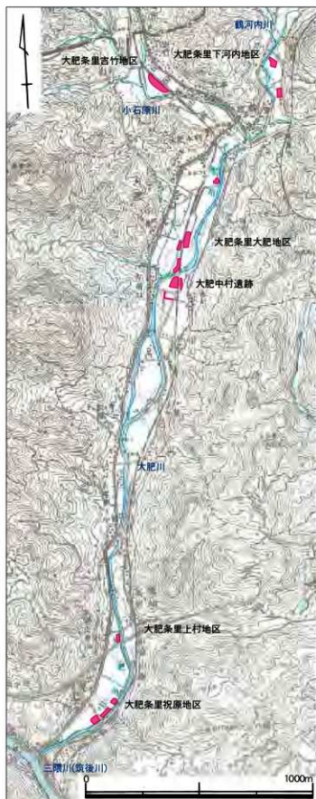
第1図 大肥地区の遺跡位置図 (1/30,000)