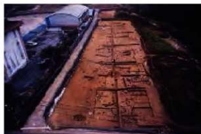
大肥条里祝原地区 (D区) 全景