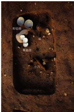
4号木棺墓内遺物出土の様子