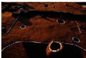
奈良時代の竪穴住居跡