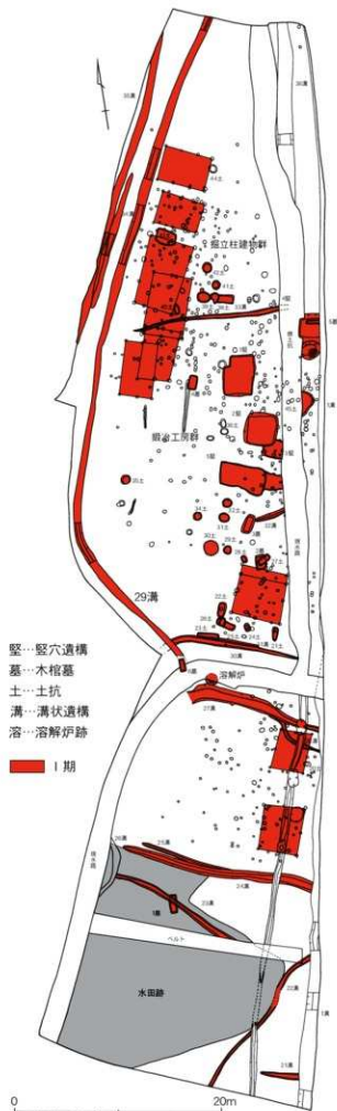
第6図 C区II面遺構配置図 (1/400)

このように第2面では、B区で発見された集落よりもさらに古い時代の鍛冶工房群を備えた集落が発見されました。これらの遺構の中からは、墓の中から出土した副葬品のほか、石製の碗や柱穴の中に埋められた宋銭などの貴重な遺物も出土しています。このことは当時の宋銭の流通が、この地域まで広がっていたことを示すもので、鉄製品の代償として手に入れられたものであることを物語っていると言えます。第2面の調査では、当時の集落が水田経営はもちろん、こうした鉄製品の製作とそれに伴う流通により、富を手に入れて繁栄していた集落の様子を知ることができました。