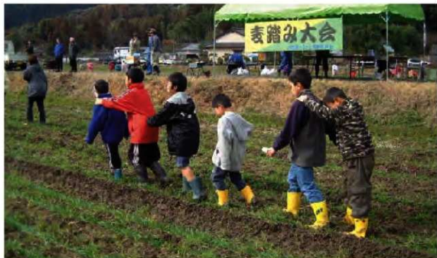
大肥郷ふるさと農業振興会の活動風景