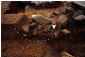
27号溝に壊された溶解炉