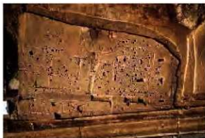
調査区南側獨立柱建物群