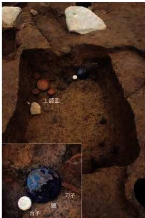
2号木棺墓内遺物出土の様子