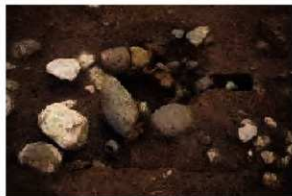
大肥条里下河内地区3号集石遺構