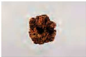
33号土坑内出土の鉄滓