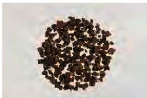
3号鍛冶炉跡出土の鍛造剥片