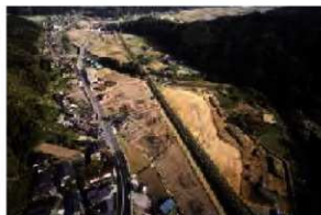
大肥条里吉竹地区全景