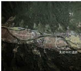
大肥中村遺跡周辺の空中写真