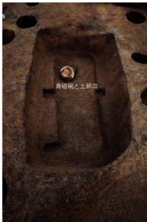
1号木棺墓内副葬品出土の様子