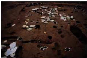
弥生時代墳墓群標石出土の様子