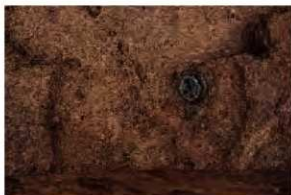
建物柱穴跡内宋銭出土の様子