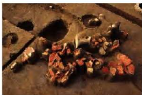
祭祀遺構遺物出土状況