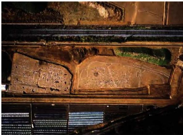
C区第1面調査区全景