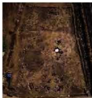
大肥条里大肥地区 (B区) 全景