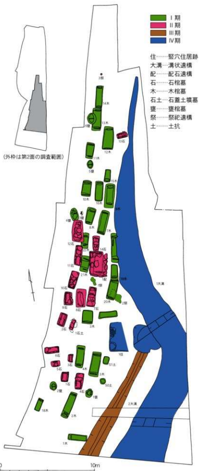
第7図 C区遺構配置図 (1/200)

このように第3面では4期にわたる遺構が発見されましたが、中でもⅠ～Ⅱ期は弥生時代の墓がまるとまるとつづられ、しかも並んで埋葬するという当時の墓地の風習を見ることができました。