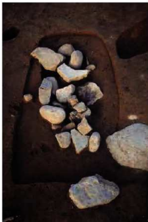
3号木棺墓標石出土の様子