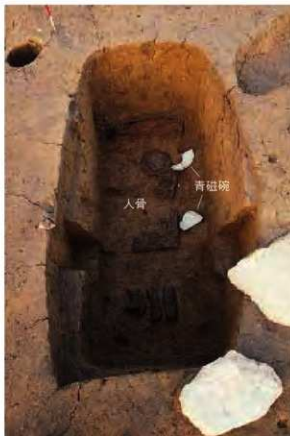
3号木棺墓内人骨出土の様子