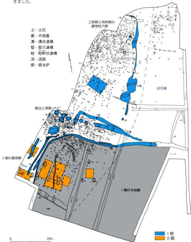
第4図 B区遺構配置図(1/600)

る1号溝が発見されました。この1号溝から南側では、この面での遺構は確認されず、この時代の遺物を多く含む包含層が広がっていました。この包含層の下の状況は、平坦で硬くしまった盤土状をしていたので、当時の水田の跡であったと考えられます。このほか1号溝や10号溝の近くからは5基の木棺墓が発見されました。このようにB区では、調査区中央に鍛冶工房群、そしてその北側にはおそらくこの鍛冶作業に携っていた人々の住まいがあり、それらの周囲には点々と墓地がつけられ、さらにこうした集落の南側には豊かな水田が広がるという当時の景観を垣間見ることができました。