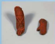
⑥人物 手部分 (左高さ15.7cm、右高さ9.4cm)