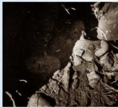
人物埴輪出土状況