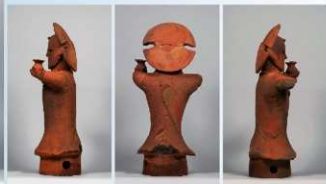
つぶし島田の髪を結び、おでこに櫛を押し、丸玉の首飾り・耳環・腕輪をし、左手で髻をかがげ、右手は欠損する。左肩からたすきを垂らす。