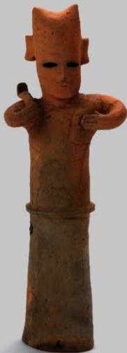
②帽子をかぶり鎌をかつく農夫 (高さ85.5cm) 頭巾風の帽子をかぶり、小さな美豆良結った男子。左手を胸に当て肩にかけて鎌を右手で握る。左手は左胸に添えられる。