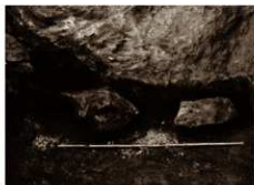
奥壁下支石使用状況