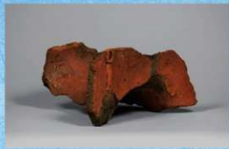
⑳馬形埴輪 腹部分 (長さ31.5cm)