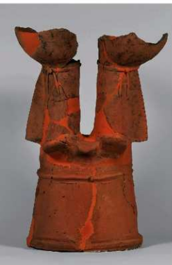
⑨ 貴人 台座と足部分