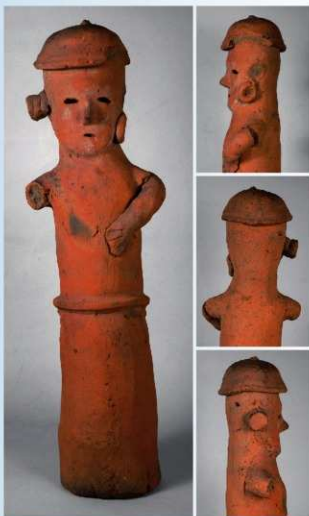
④鎌をかつく農夫 (高さ73cm) 群馬県立歴史博物館蔵 頭部に突起をもつ浅鉢形の笠をかぶり、耳上に白形に束ねた美豆良を結び、耳環を飾った男子。右肩から右胸にかけて鎌の刺痕痕がある。右手は欠損するが、左手は左胸に添えられる。