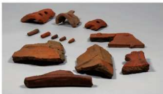
⑬ 家形埴輪 (破片であるが数個体分ある。)

麩は長い柄に大きな団扇をつけた送風の役目を持つ道具で、儀式に用いられたとみられる。