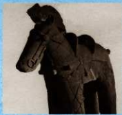
復元された馬形埴輪