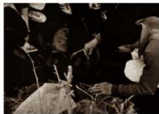
鷹匠埴輪出土状況

人物は相当高い位であったと思われ、鷹狩りが支配者層の狩猟行事であったことを物語っている。人物の表現は言うに及ばず、鷹、鈴、袴、面籠と思われる編籠細部に至るまで巧みに造られている。