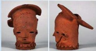
⑧巫女頭部 (高さ23.5cm) つぶし島田の髪を結び、おでこに櫛を押し、丸玉の首飾り・耳環をつけた巫女の頭部である。