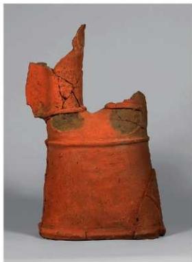
⑪ 貴人 台座