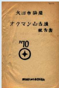
オクマン山古墳報告書表紙 (1970年)

埴輪の配列は、円筒埴輪が径約26mの円周上にほぼ隙間なく立てられていたようです。また、石室の入り口に向かって右側に貴人埴輪2体・鷹匠埴輪1体・農夫2体・馬形埴輪7体が連なるように確認されました。そのやや後方に家形埴輪が置かれ、北側には大刀・矟・矧などの器財埴輪が集中して置かれていました。