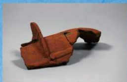
⑲馬形埴輪 鞍部分 (長さ39.0cm)