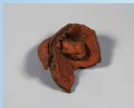
⑦人物 肩部分(内側) (高さ13.5cm)