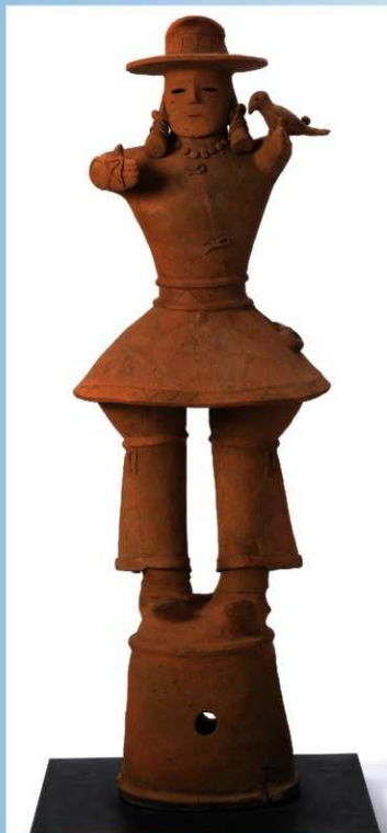
たかじょう ①鷹匠埴輪