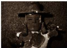
(昭和45年) 復元された鷹匠埴輪