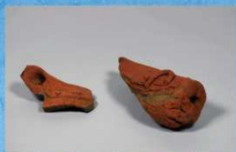
⑱馬形埴輪 顔・耳部分 (最大長24.0cm)

頭部に環状鍔板轡を付け、鬃は高く、前脚は円柱表現される。背には鞍を置く。胸繫には鈴が4つ付けられ、尻繫には雲珠が装着されている。