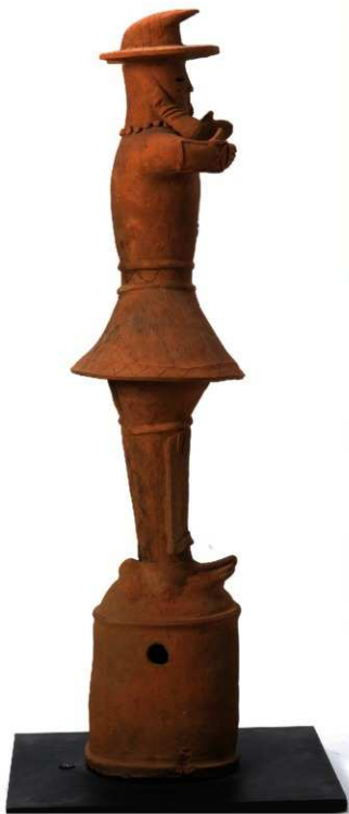
個人・太田市教育委員会蔵

人物は相当高い位であったと思われ、鷹狩りが支配者層の狩猟行事であったことを物語っている。人物の表現は言うに及ばず、鷹、鈴、袴、面籠と思われる編籠細部に至るまで巧みに造られている。