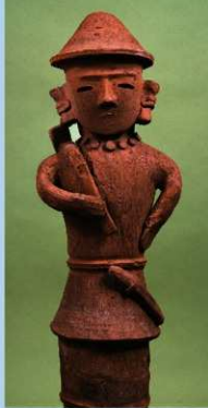
③笠をかぶり鎌をかつく農夫 (高さ75.0cm) 京都国立博物館蔵 重要美術品 菅笠をかぶり、大きな美豆良を結び、丸玉の首飾りをした男子。右肩に鎌をかつぎ、左手は腰に添えられ、腰には小刀を帯びる。