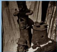
出土当時の農夫と貴人頭部・鷹