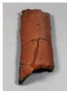
⑭ 麩形埴輪 (高さ35.5cm) 背中に背負い、矢を射れる箱