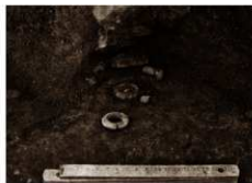
金鋼製環No.3琥珀玉出土状況