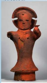
⑤髻をかかける巫女 (高さ63.5cm)