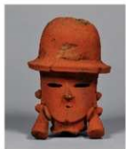
⑩ 貴人 頭部