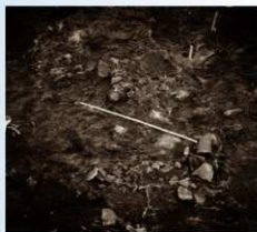
北西側 大刀、矟、矧埴輪出土状況