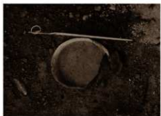
石室入口土師器環出土状況