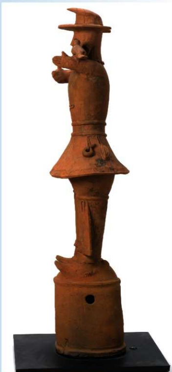
(高さ147.0cm) 太田市指定重要文化財 (平成10年度保存修理)