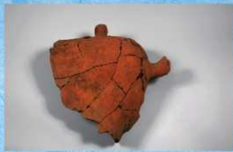
㉑馬形埴輪 臀部(尻) (高さ51.0cm)