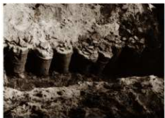
東側円筒埴輪柱出土状況