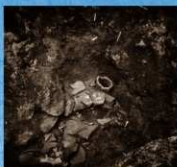
馬形埴輪出土状況 (昭和25年)